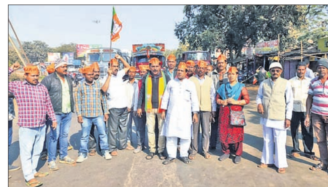
ଭାଜପା କର୍ମୀଙ୍କ ରାସ୍ତାରେକୋ ।

ଭେଙ୍ଗାନାଳ ଅଧିକ, ୧୨/୧୨- ବିପର୍ଯ୍ୟୟ ସାମ୍ବ୍ୟସେବା ପ୍ରତିବାଦରେ ଭାଜପା ପକ୍ଷରୁ ମଙ୍ଗଳବାର ୧୨ ଘଣ୍ଟିଆ ଦେଢ଼ାନାଳ ବନ୍ଦ ପାଳିତ ହୋଇଛି । ସକାଳ ୬ଟାରୁ ସନ୍ଧ୍ୟା ୬ଟା ଯାଏ ବନ୍ଦ ପ୍ରଭାବ ଅନୁଭୂତ ହୋଇଥିବାବେଳେ ସହରରେ ପ୍ରଭାବିତ ହୋଇଥିଲା ଜୀବନଯାତ୍ରା । ଭାଜପା ନେତା ଏବଂ କର୍ମୀମାନେ କୋରିଆଁ ବାଇପାଏ ଛକ, ବାଲିଚୌକ, କଲେଜ ବାଇପାଏ ଛକରେ କାତୀୟ ରାଜପଥ ଅବରୋଧ କରିଥିଲେ । ପୂର୍ବାହ୍ନରେ ପିକେଟିଂ କରି ସମସ୍ତ ବ୍ୟବସାୟିକ ପ୍ରତିଷ୍ଠାନ, ଔଷଧ ଦୋକାନ, ବ୍ୟାଙ୍କ, ସରକାରୀ, ବେସରକାରୀ କାର୍ଯ୍ୟାଳୟ, କୋର୍ଟ, ଯାନବାହନ ବନ୍ଦ କରିଥିଲେ । ଜିଲ୍ଲା କାର୍ଯ୍ୟାଳୟର ଦେଇଥିଲେ । ସିବିଲ କୋର୍ଟକୁ ଆସୁଥିବା ବିଚାରପତିଙ୍କୁ ପ୍ରବେଶ କରିବାକୁ ବେଳ ନ ଥିଲେ । ବନ୍ଦ ଯୋଗୁ ସହର ଉପକଣ୍ଠ କାତୀୟ ରାଜପଥରେ ଯାନବାହନ ଚଳାଚଳ ସମ୍ପୂର୍ଣ୍ଣ ବନ୍ଦ ରହିଥିଲା । ଏହାର ସୁଯୋଗରେ ଭାଜପାର ବିଶିଷ୍ଟ