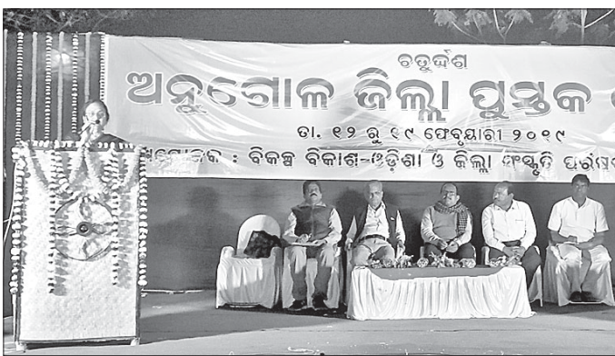
ଉଦ୍‌ଘାଟନା ମଞ୍ଚରେ ଅତିଥିମାନେ।