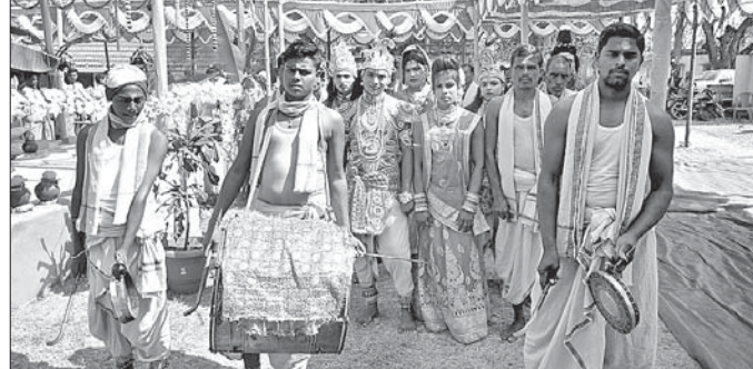
ଶୋଭାଯାତ୍ରାରେ ଠାକୁରଙ୍କୁ ପରିକ୍ରମା କରାଯାଇଛି।

ବର୍ତ୍ତମାନ ଲୁକ କାଣ୍ଡସର ସ୍ଥଳ ସାହି ନିକଟରେ ମାଘ ସପ୍ତମୀ ମେଳା ମଙ୍ଗଳବାର ଅନୁଷ୍ଠିତ ହୋଇଯାଇଛି। ଏହି ଅବସରରେ କଳସଯାତ୍ରା, ହୋମଯଜ୍ଞ, ନାମ ସଂକୀର୍ତ୍ତନ, ପ୍ରସାଦ ସେବନ ଅନୁଷ୍ଠିତ ହୋଇଥିଲା। ଆଖପାଖ ଅଞ୍ଚଳରୁ ୨୦୦ ଉର୍ଦ୍ଧ୍ୱ ସଂକୀର୍ତ୍ତନ ମଣ୍ଡଳୀ ଯୋଗଦେଇଥିଲେ। ବିଭିନ୍ନ ବାଦ୍ୟ ବାଜଣା ସହକାରେ ଭଗବତ ଠାକୁରଙ୍କୁ ମେଳାସ୍ଥଳକୁ ଅଣାଯାଇଥିଲା। ଏଥିରେ ଗ୍ରାମବାସୀ ଓ ମେଳା କମିଟିର ସଦସ୍ୟମାନେ ସହଯୋଗ କରିଥିଲେ।