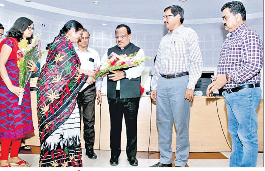
ପ୍ରାନ୍ତ ଜିଲାପାଳଙ୍କୁ ବିଦାୟ ସମ୍ବର୍ଦ୍ଧନା ଦିଆଯାଇଛି।