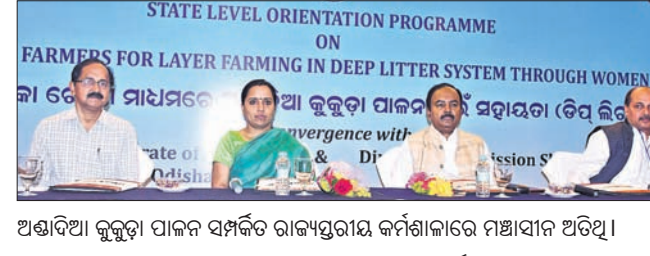
ଅଣ୍ଡାଦିଆ କୁକୁଡ଼ା ପାଳନ ସମ୍ପର୍କିତ ରାଜ୍ୟସ୍ତରୀୟ କର୍ମଶାଳାରେ ମଞ୍ଚାଧିକାରୀ ଅତିଥି।