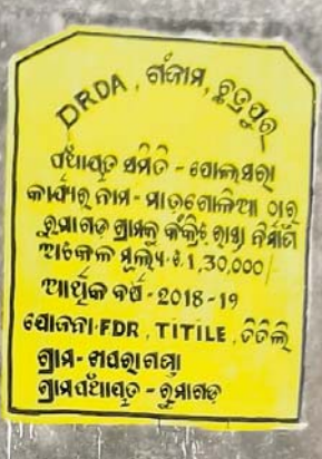
ରାସ୍ତା ନିର୍ମାଣର ପତକ।

ବେଳେ ସେ କହିଛନ୍ତି, ୨ଟି ଯାକ ରାସ୍ତା ପାଇଁ ଅନୁମୋଦନ ଅର୍ଥ ଖପରାଗଣା ଗ୍ରାମ ଭିତରେ ଥିବା ରାସ୍ତାରେ ଖର୍ଚ୍ଚ ହୋଇଛି। ମାତ୍ର ଖପରାଗଣା ସ୍ଥଳଠାରୁ ଗ୍ରାମ ଭିତରକୁ ରାସ୍ତା ଗତ ୩ ବର୍ଷ ପୂର୍ବରୁ ତ୍ରୟୋଦଶ ଅର୍ଥ ନିଶାନ ଯୋଜନାରେ ସିମେଣ୍ଟ କଞ୍ଜିଟ୍