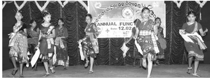
ଛାତ୍ରୀମାନେ ସାଂସ୍କୃତିକ କାର୍ଯ୍ୟକ୍ରମ ପରିବେଷଣ କରୁଛନ୍ତି ।

ଉତ୍ସବରେ ଉପସ୍ଥିତ ଛାତ୍ରୀମାନଙ୍କୁ ପୁରସ୍କୃତ କରାଯାଇଥିଲା ।