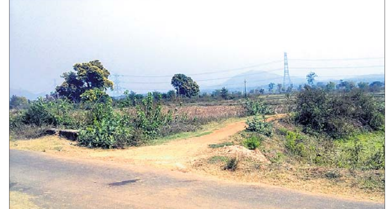
ମାତ୍ରୋକିଆ ଠାରୁ ରୁମାଗତ ଗ୍ରାମକୁ ଯିବା ରାସ୍ତା।