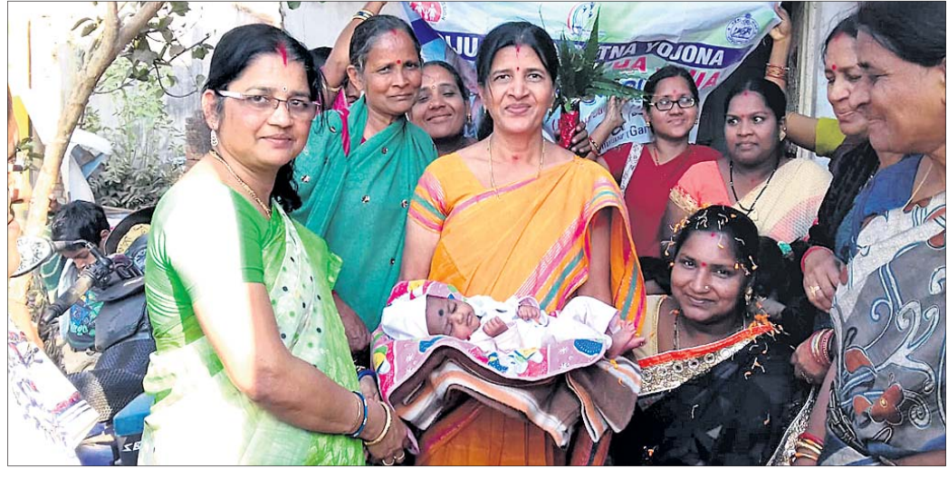
କାର୍ଯ୍ୟକ୍ରମରେ ଉପସ୍ଥିତ ସିପିଓ ଓ ଅନ୍ୟମାନେ।