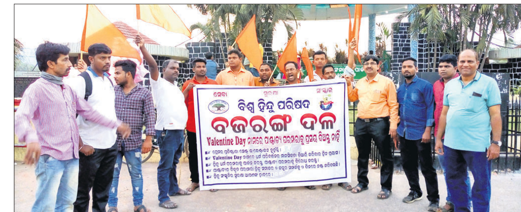
ବିଶୁ ପଞ୍ଚମାୟକ ପାର୍ଜ ଆଗରେ ବଜରଙ୍ଗ ଦଳର କର୍ମକର୍ମୀମାନେ ।

ପ୍ରେମ ଦିବସ ତଥା ଭାଲେଣ୍ଟାଇନ୍ ଡେ' ବଜରଙ୍ଗ ଦଳ ସଚେତନତା କାର୍ଯ୍ୟକ୍ରମ ହାତକୁ ନେଇଥିଲା ।