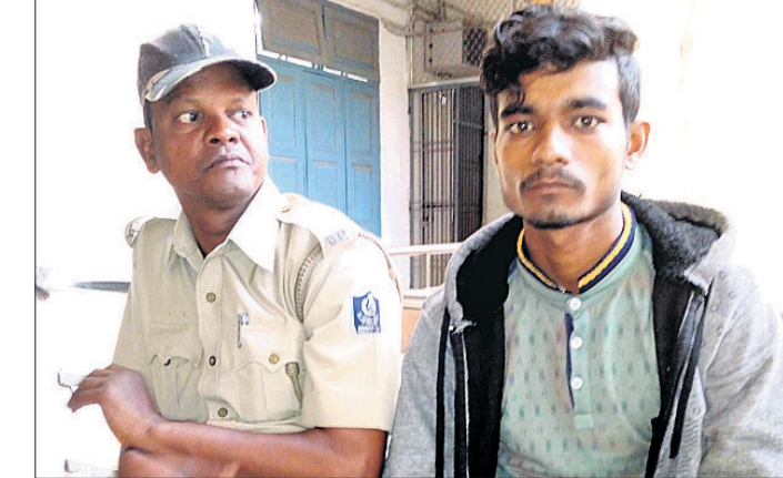
ଅଭିଯୁକ୍ତ ଲବ ପାଣିଗ୍ରାହୀ ।

ସାଧ୍ୟାଦିକ ଚରୁଣୀ ଆଚାର୍ଯ୍ୟ ହତ୍ୟା ମାମଲାରେ ସମସ୍ତ ସାକ୍ଷୀଙ୍କ ସାକ୍ଷ୍ୟ ବୟାନ ଗୁରୁବାର ଶେଷ ହୋଇଛି ।