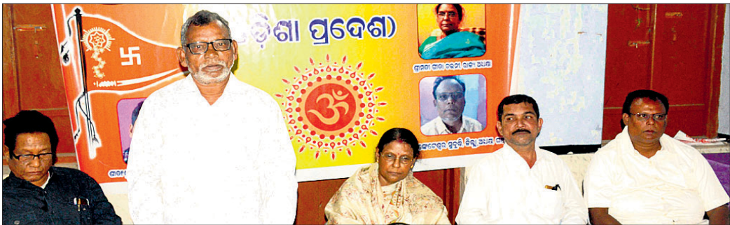
ସଭାରେ ମହାସଭାର ସଂଗଠନ କର୍ମକର୍ମୀମାନେ ।