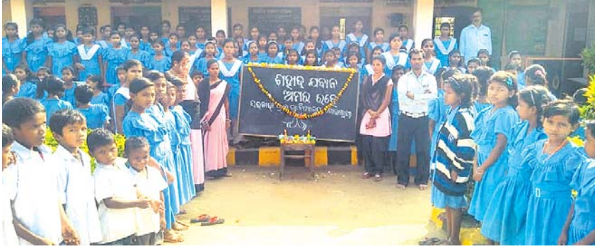
ଗୋରଖୁଣ୍ଡା ବିଦ୍ୟାଳୟରେ ଛାତ୍ରଛାତ୍ରୀଙ୍କ ଶୋକସଭା ।