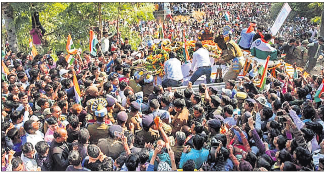
କହିଛନ୍ତି। ଆକ୍ରମଣକାରୀଙ୍କୁ ଦଣ୍ଡ ଦେବା ପାଇଁ ସରକାର ଠିକ୍ ନିଷ୍ପତ୍ତି ନେବେ ବୋଲି ସେ ଆଶା ପ୍ରକାଶ କରିଛନ୍ତି। ଅନ୍ୟ ସିନେ