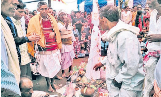
ଦୁଇହାଦେବଙ୍କ ବିବାହ କାର୍ଯ୍ୟ କରାଯାଇଛି।

ନବରଙ୍ଗପୁର ଜିଲ୍ଲା ଚନ୍ଦ୍ରହାଣ୍ଡି ବ୍ଲକ୍ ପୂଜାରୀଗୁଡ଼ା ଗ୍ରାମର ତେଲି ସମାଜ ପକ୍ଷରୁ ଆୟୋଜିତ ଦୁଇହାଦେବଙ୍କ ଦୁଇ ଦିନିଆ ବିବାହ କାର୍ଯ୍ୟ ଶନିବାର ସମାପ୍ତ ହୋଇଛି। ଶୁକ୍ରବାର ପ୍ରଥମେ ଶୁଭକଳସ ସ୍ଥାପନ ହେଲାପରେ ସମାଜର ମହିଳାମାନଙ୍କ ଦ୍ୱାରା କଳସ ଯାତ୍ରା କରାଯାଇଥିଲା। ଏହାପରେ ସନ୍ଧ୍ୟାରେ ବିଭିନ୍ନ ଦେବଦେବୀଙ୍କୁ ଆହ୍ୱାନ କରାଯାଇ ପୂଜାପାଠ କରାଯାଇଥିଲା। ମହୁଲତାକୁ ଅଗାଧାଳ ବୁଲାଇଦେବା ପ୍ରତୀକ ଭାବେ ସେଥିରେ ସମାଜର ମହିଳାମାନେ ତେଲି ହଳଦୀ ଲେପନ କରିଥିଲେ। ଏହାପରେ ନିଜ ନିଜ ଭିତରେ ହଳଦୀ ବୋଲି ହୋଇଥିଲା। ପୂଜାରୀ କ୍ଷମାନିଧି ସାହୁଙ୍କ ଦ୍ୱାରା ସକାଳେ ପୂଜାପାଠ କଲାପରେ ବଳାଦେବୀଙ୍କୁ ରଖାଯାଇଥିବା ଛାଗକୁ