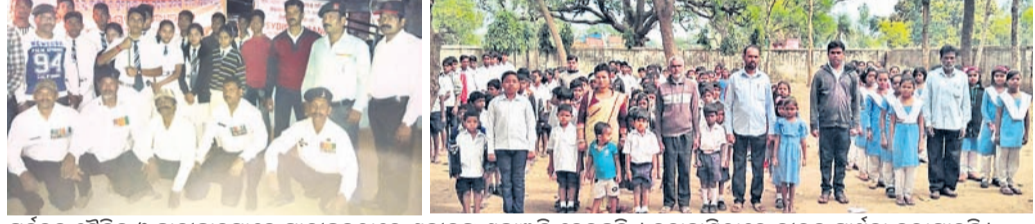
ପୂର୍ବତନ ସୈନିକ ଓ ଛାତ୍ରାଛାତ୍ରୀମାନେ ଶାନ୍ତାନ୍ତରଣରେ ଶିଶୁଦଳକୁ ଶ୍ରଦ୍ଧାଞ୍ଜଳି ଦେଇଛନ୍ତି। ଚନ୍ଦ୍ରହାଣ୍ଡିଠାରେ ନୀରବ ପ୍ରାର୍ଥନା କରାଯାଇଛି।