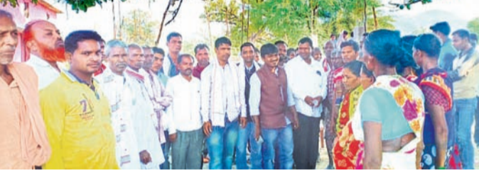
କଂଗ୍ରେସ ନେତା ଓ କର୍ମୀ ଲୋକମାନଙ୍କ ସହ ଆଲୋଚନା କରୁଛନ୍ତି।