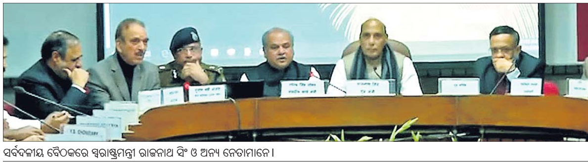
ସର୍ବଦଳୀୟ ବୈଠକରେ ସ୍ୱରାଷ୍ଟ୍ରମନ୍ତ୍ରୀ ରାଜନାଥ ସିଂ ଓ ଅନ୍ୟ ନେତାମାନେ।

ପୁଲ୍‌ଘାମା ଆକ୍ରମଣ ସର୍ବଦଳୀୟ ବୈଠକରେ ନିୟମ କରାଯାଇଛି। ଆତଙ୍କବାଦ ବିରୋଧରେ ଲଢ଼େଇ ପାଇଁ ବୈଠକ ଶେଷରେ ସଂକଳ୍ପ ଗୃହୀତ ହୋଇଛି। ଆତଙ୍କବାଦର ମୂଳୋତ୍ସାଦନ ପାଇଁ ଭାରତ ପ୍ରତିଜ୍ଞାବଦ୍ଧ ବୋଲି ସରକାରୀ ଓ ବିରୋଧୀ ଦଳଗୁଡ଼ିକ ଏକସ୍ୱରରେ କହିଛନ୍ତି। ଜମ୍ମୁ-କଶ୍ମୀରର ପୁଲ୍‌ଘାମା ଜିଲ୍ଲାରେ ଜୈଶ-ଇ-ମହମ୍ମଦ (ଜେଇଏମ୍) ଆତଙ୍କବାଦୀଙ୍କ ଆତ୍ମଘାତା ବିସ୍ଫୋରଣରେ ୪୦ରୁ ଊର୍ଦ୍ଧ୍ୱ ଯବାନ ଶହାଦ ହେବା ଘଟଣାକୁ ସାରା ବିଶ୍ୱ ନିନ୍ଦା କରିଛି। ସରକାର ତାଙ୍କୁ ସର୍ବଦଳୀୟ ବୈଠକରେ ସ୍ୱରାଷ୍ଟ୍ରମନ୍ତ୍ରୀ ରାଜନାଥ ସିଂ ଅଧିକାରୀ କରିଥିଲେ। ଦେଶର ସଂହତି ଓ ଅଖଣ୍ଡତା ବଜାୟ ରଖିବା ଲାଗି ସେନାବାହିନୀ ସହ ସମସ୍ତେ ରହିଥିବା ଭାବପା, କଂଗ୍ରେସ ସମେତ ସବୁ ଦଳ କହିଛନ୍ତି।