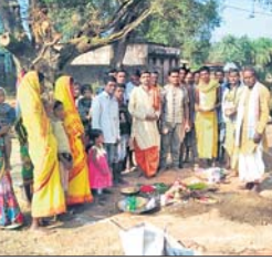
ମାଥିଲି, ୧୬୨୨ (ସ.ପୂ)

ମାଥିଲି ବ୍ଲକ୍ ଅନ୍ତର୍ଗତ ତାଳଗୁଡ଼ାଠାରେ ରାଧାକୃଷ୍ଣ ମନ୍ଦିର ନିର୍ମାଣ ପାଇଁ ଶିଳାନିଧାୟ କରାଯାଇଛି।