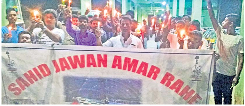
ମାଲକାନଗିରି ଅଟୋ ଯୁନିୟନ ପକ୍ଷରୁ କ୍ୟାଣ୍ଡେଲ ଶୋଭାଯାତ୍ରା ।