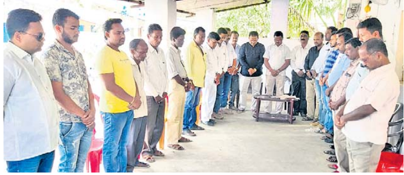
ମାଲକାନଗିରି ଜିଲ୍ଲା ବିଜେଡି କାର୍ଯ୍ୟାଳୟରେ ଶନିବାର ଶହାଦ ମଦାନଙ୍କ ଉଦ୍ଦେଶ୍ୟରେ ନାଚ ପ୍ରାର୍ଥନା ।