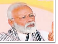
ସାଧାରଣ ସଭାରେ କହିଛନ୍ତି। ପାକିସ୍ତାନ ଆତଙ୍କବାଦର ଅନ୍ୟ ନାମ। ପୁଲଫୁମା ଆକ୍ରମଣକାରୀଙ୍କୁ ଦଣ୍ଡ ଦେବା ଲାଗି ସୈନ୍ୟବାହିନୀକୁ ପୂର୍ଣ୍ଣ ସ୍ଵାଧୀନତା ଦିଆଯାଇଥିବା ପ୍ରଧାନମନ୍ତ୍ରୀ ସୂଚନା ଦେଇଛନ୍ତି।

ଧୂଲେ (ମହାରାଷ୍ଟ୍ର), ୧୬:୨ ଦେଶର ସୈନ୍ୟବାହିନୀ ପ୍ରତି ଶକ୍ତି ପହଞ୍ଚାଇଥିବା କାହାରିକୁ ଛଡ଼ାଯିବ ନାହିଁ। ପୁଲଫୁମା ଆକ୍ରମଣ ପରବର୍ତ୍ତୀ ପ୍ରତି ବୃଦ୍ଧା ଲୁହ ପାଇଁ ପ୍ରତିଶୋଧ ନିଆଯିବ। ଯବାନଙ୍କ ବିରୋଧରେ ସେମାନେ ଆତଙ୍କବାଦୀଙ୍କୁ ଅସ୍ତ୍ର ଓ ବୋମା ଯୋଗାଇଛନ୍ତି ସେମାନଙ୍କୁ ନୂଆ ଭାରତ ବରଦାସ୍ତ କରିବ ନାହିଁ ବୋଲି ପ୍ରଧାନମନ୍ତ୍ରୀ ନରେନ୍ଦ୍ର ମୋଦି ମହାରାଷ୍ଟ୍ରର ଏକ