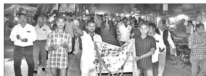
ବାରମହାରାଜପୁରରେ ବାହାରିଥିବା ବ୍ୟାଣ୍ଡେଲ ଶୋଭାଯାତ୍ରା।