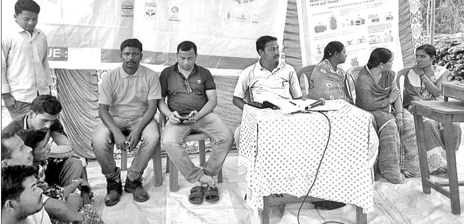
ଉତ୍ତମ ଯୋଜନା କାର୍ଯ୍ୟକ୍ରମରେ ମଞ୍ଚାସନ ଅତିଥିବୃନ୍ଦ ।