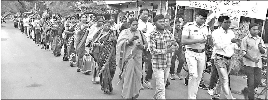
ଖପ୍ରାଖୋଲରେ ବାହାରିଥିବା କ୍ୟାଣ୍ଡେଲ ଶୋଭାଯାତ୍ରା।