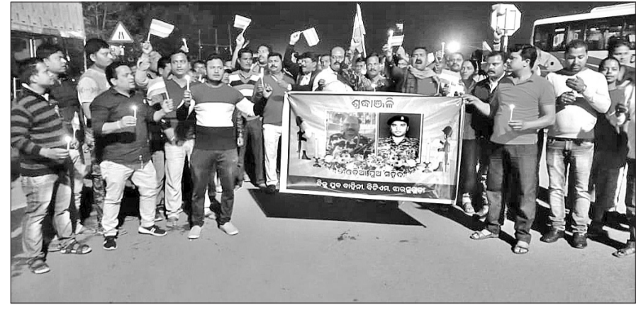
ଝାରସୁଗୁଡ଼ା ସହରରେ ଶହୀଦଙ୍କ ଉଦ୍‌ଘୋଷଣରେ କ୍ୟାଣ୍ଡେଲ ଶୋଭାଯାତ୍ରା।