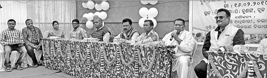
ବୁକସ୍ତରୀୟ କୃଷକ ସମ୍ପର୍କ ମେଳାରେ ମହାସାଧନ ଅତିଥି ।

ବଲାଙ୍ଗୀର ଜିଲ୍ଲା ଲୋଇସିଂହା ବ୍ଲକ କୁଶଳ ପଞ୍ଚାୟତ ଅନ୍ତର୍ଗତ ପିପିଲି ଗ୍ରାମରେ ବୁକସ୍ତରୀୟ କୃଷକ ସମ୍ପର୍କ ମେଳା ଶନିବାର ଅନୁଷ୍ଠିତ ହୋଇଯାଇଛି ।