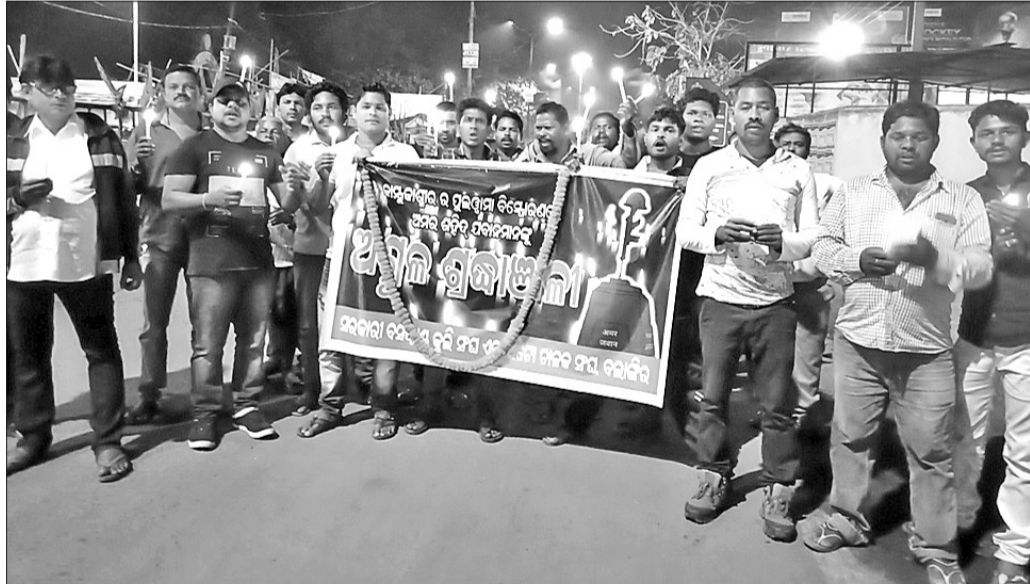
କମ୍ପାନୀରେ ଆତଙ୍କବାଦୀ ଆକ୍ରମଣରେ ଶହାଦତ୍ତ ବୀର ସଦାନକ ଉଦ୍‌ଘୋଷଣାରେ ବଲାଙ୍ଗୀର ସହକାରୀ ବସଷ୍ଟାଣ୍ଡ କୁଳି ଓ ଚିକିତ୍ସାଳକ ସଂଘ ପକ୍ଷରୁ କ୍ୟାଣ୍ଡେଲ ରାଲି କରାଯାଇଛି ।