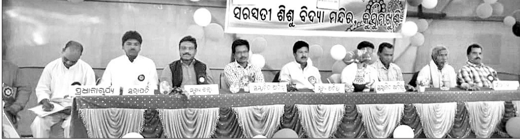
ଶିଶୁମନ୍ଦିରର ବାର୍ଷିକ ଉତ୍ସବ ଅବସରରେ ମହାସାଧନ ଅତିଥି।

ପୁଷ୍ପାବତ୍ସା ଉପରେ ଯୋଗଦେଇ ଶିଶୁ ମନ୍ଦିରରେ ଦିଆଯାଉଥିବା ଶିକ୍ଷା ପ୍ରଣାଳୀ ଉପରେ କହିବା ସହ ଛାତ୍ରୀଛାତ୍ରୀମାନଙ୍କୁ ବିଭିନ୍ନ ବିଷୟରେ ବେଶ୍‌ଭାବେ ଉଦ୍‌ଘୋଷଣା କରାଯାଇଥିଲା।