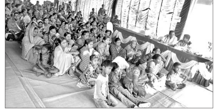
ଉତ୍ତମ ସ୍ୱାଭିମାନ ବିଦ୍ୟରେ ଯୋଗଦେଇଥିବା ମହିଳାମାନେ। ଉତ୍ତମ ସ୍ୱାଭିମାନ ସମ୍ପର୍କରେ ସମସ୍ତଙ୍କୁ ଏକ ଗାୟକ ବ୍ୟବହାର ଉପରେ ମହିଳାମାନଙ୍କୁ ସଚେତନତା କରାଯାଇଥିଲା।

କଳାହାଣ୍ଡି ଜିଲ୍ଲା ଜୁନାଗଡ଼ ସହର ନିୟନ୍ତ୍ରିତ ବଜାର କମିଟି (ଆର୍.ଏମ୍.ସି) ପରିସରରେ ଶନିବାର କେନ୍ଦ୍ର ସରକାରଙ୍କ ଉତ୍ତମ ସ୍ୱାଭିମାନ ଉତ୍ସବ ଅନୁଷ୍ଠିତ ହୋଇଯାଇଛି।