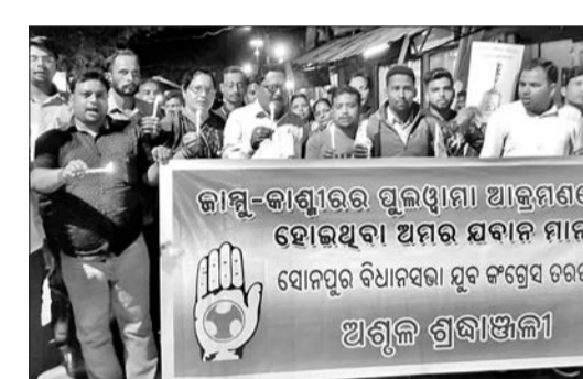
ବିଜୁ ପଟ୍ଟନାୟକ ଛକରେ ଯୁବ କଂଗ୍ରେସ ସଭାକୁ ବ୍ୟାଣ୍ଡେଲ ଶୋଭାଯାତ୍ରା।