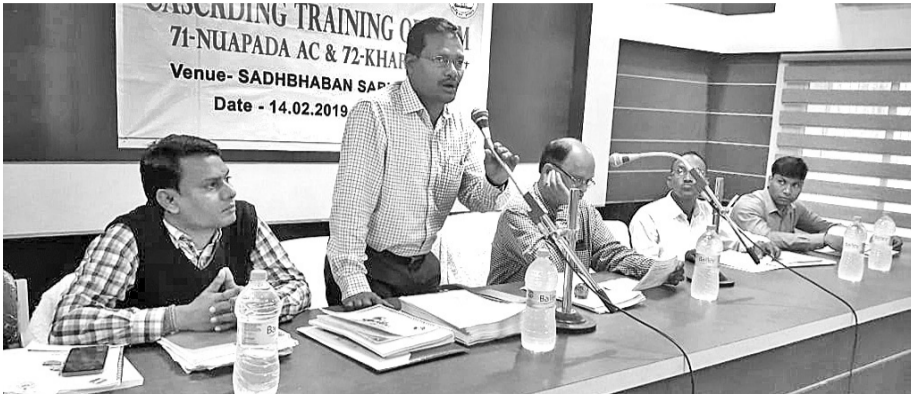
ନିର୍ବାଚନ ତାଲିମ ପ୍ରଦାନ କାର୍ଯ୍ୟକ୍ରମରେ ଅଧିକାରୀ ଅଧିକାରୀ।

ଅତିଥିମାନେ ଏହା କହିଥିଲେ। ଲିମ୍ବାପଡ଼ାରେ ଅଧିକାରୀ ବିଦେଶରେ ଯିବାକୁ ନିମନ୍ତ୍ରଣ କରିବାରୁ ଅଧିକାରୀଙ୍କୁ ନିର୍ବାଚନ ଆଗକୁ ଆସି କାର୍ଯ୍ୟକ୍ରମ ପ୍ରତିବନ୍ଧିତ ହୋଇଛି