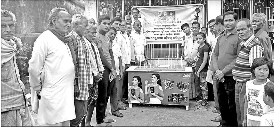
କୋଲାବିରାଠାରେ ମହମମଦି କାଜି ଶହୀଦଙ୍କୁ ଶ୍ରଦ୍ଧାଞ୍ଜଳି ଅର୍ପଣ କରାଯାଇଛି।