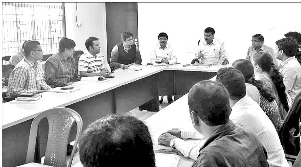
ପ୍ରଶିକ୍ଷଣ କାର୍ଯ୍ୟକ୍ରମରେ ଉପସ୍ଥିତ ସରକାରୀ ଅଧିକାରୀ ।

ଘୋଷ, ୧୬୨୨ (ସ୍ଵ.ପ୍ର) ଆଗାମୀ ସାଧାରଣ ନିର୍ବାଚନ ପାଇଁ କାରଖଣ୍ଡାନ ଆରମ୍ଭ ହୋଇ ସାରିଥିବାବେଳେ ବୈଦିକ ଲିଜା ପ୍ରଶାସନ ପକ୍ଷରୁ ନିର୍ବାଚନ ପରିଚାଳନା ପାଇଁ ପ୍ରସ୍ତୁତି କାର୍ଯ୍ୟ ମଧ୍ୟ ଜୋରସୋରରେ ଚାଲିଛି ।