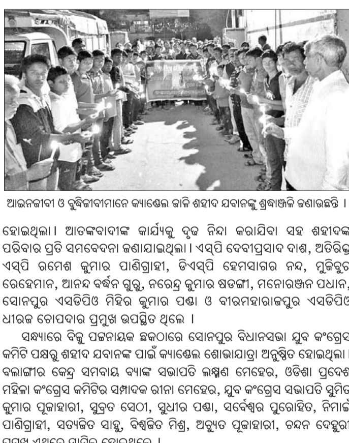
ଆଜନବାଦୀ ଓ ବୁଦ୍ଧବାଦୀମାନେ ବ୍ୟାଣ୍ଡେଲ ଜାପି ଶହାଦ ଯବାନଙ୍କୁ ଶ୍ରଦ୍ଧାଜଳି ଜଣାଇଛନ୍ତି।

କଳ୍ପ କଳ୍ପାଚାର ଆଡ଼କବାଦୀ ଆଜ୍ଞାନରେ ଶହାଦ ଯବାନଙ୍କ ପ୍ରତି ସୁବର୍ଣ୍ଣପୁର ଜିଲ୍ଲାର ବିଜିଲ୍ଲା ଅନୁଷ୍ଠାନ ସଭାକୁ ଶନିବାର ରାତ୍ନାକର ଶ୍ରଦ୍ଧାଜଳି ଜାପନ କରାଯାଇଛି।