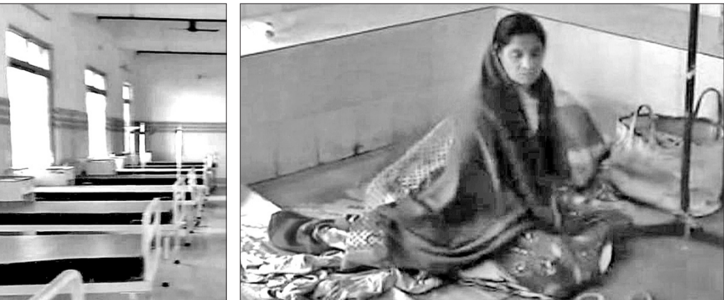
ଜିଲାର ହସ୍ପିଟାଲର ନୂଆ କୋଠାରେ ଶଯ୍ୟାଗୁଡ଼ିକ ଖାଲି ପଡ଼ିଛି (ବାମ)। ପୁରୁଣା କୋଠାରେ ଜଣେ ରୋଗୀ ତଳେ ପଡ଼ିରହିଛନ୍ତି।

ଘାନ୍ତାକର ପ୍ରସଙ୍ଗରେ ପୁଣି ପୁରାଇବାକୁ ଲାଗି କରୁନାହାନ୍ତି। ଅନ୍ୟପକ୍ଷରେ ଜିଲାରେ ଡାକ୍ତରଙ୍କ ସଂଖ୍ୟା ଅନୁମୋଦନ ହାରାହାରି ଅଧା।