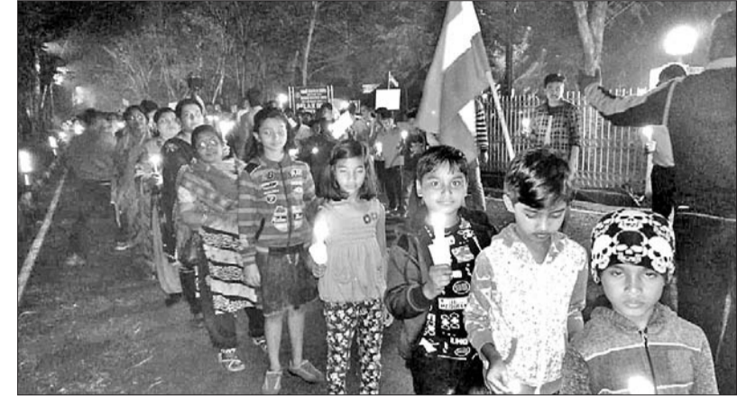
ଦୁକରାକନଗରରେ ଆୟୋଜିତ କ୍ୟାଣ୍ଡେଲ ଶୋଭାଯାତ୍ରାରେ ସାମିଲ ଶିଶୁ ଓ ମହିଳା ପୁରୁଷ।