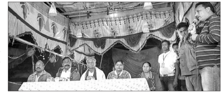
ସାଂସ୍କୃତିକ ସମାରୋହରେ ଉପସ୍ଥିତ ଅତିଥି।

ବେଲପୁର, ୧୬।୨ (ଡି.ଏନ୍.ଏ.) ମୌଳିକ ସମସ୍ୟା ସମ୍ପର୍କରେ ପୁଷ୍ୟଅତିଥି ସମାବେଶ ହେଲାଣି।