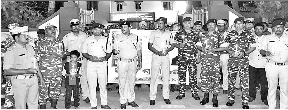
କନ୍ଧା-କନ୍ଧାରେ ଭୁଲଖାମାଠରେ ଆରମ୍ଭକାରୀ ଆକ୍ରମଣରେ ଶହାଦତ୍ତ ହୋଇଥିବା ୪୪୮୧୧୧ ଯବାନଙ୍କୁ ବଲାଙ୍ଗୀର ପୋଲିସ୍ ସମିତି କେ. ଶିବା. ପୁସ୍ତକାଳୟ ନେତୃତ୍ୱରେ କ୍ୟାଣ୍ଡେଲ ରାଲି କରି ଶ୍ରଦ୍ଧାଞ୍ଜଳି ଅର୍ପଣ କରାଯାଇଛି (ବାମ)। ଦେଖିବାରେ ମୁଗ୍ଧକାନ୍ଦନ ଚରଫତୁ କ୍ୟାଣ୍ଡେଲ ଶୋଭାଯାତ୍ରା।