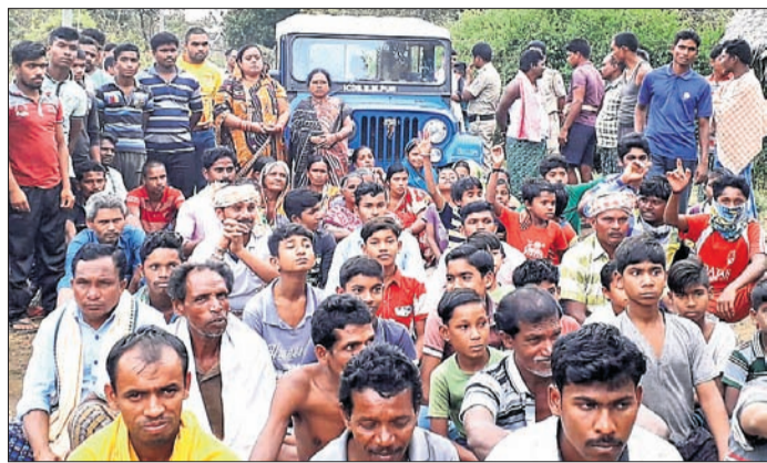
ଅଜନିବିଦ୍ୟାଳୟ ପାଠକମାନଙ୍କ ପାଇଁ ସୁବର୍ଣ୍ଣପୁର ଜିଲ୍ଲା ବାରମହାରାଜପୁର କ୍ଲବ୍ କେମ୍ପରେ ଅନୁଷ୍ଠିତ ହେଉଥିବା ପ୍ରତିଯୋଗିତା ପ୍ରତିଯୋଗିତାରେ ଅଂଶଗ୍ରହଣ କରିଥିଲେ।