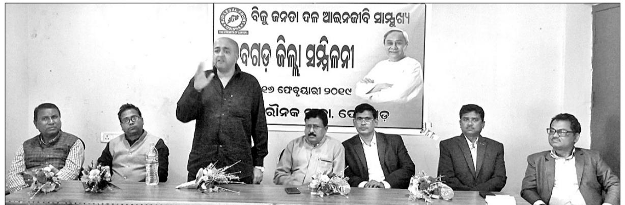
ବିଜେଡି ଆଇନଜୀବୀ ସାମ୍ବଲପୁର ଜିଲ୍ଲା ସମ୍ମିଳନୀ