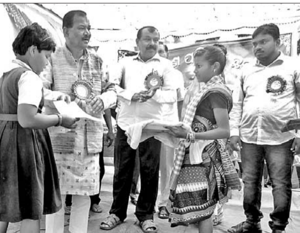
ବାର୍ଷିକ ଉତ୍ସବରେ ପ୍ରତିଯୋଗୀମାନଙ୍କୁ ପୁରସ୍କୃତ କରାଯାଇଛି ।

ବୈଦିକ ଜିଲା ହରଭଙ୍ଗା ବ୍ଲକ୍ ଛତରଙ୍ଗ ଛିତ ଜନକଲ୍ୟାଣ ପରିଷଦ ପକ୍ଷରୁ ସ୍ଥାନୀୟ ନାରୀମଣ୍ଡଳ ଉଚ୍ଚ ବିଦ୍ୟାଳୟ ପରିସରରେ ଶନିବାର ପରିଷଦର ବାର୍ଷିକ ଉତ୍ସବ ପାଳିତ ହୋଇଯାଇଛି ।