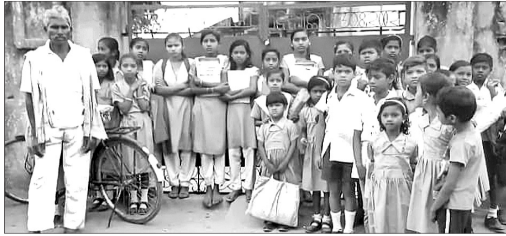
ଅଭିଭାବକ ଓ ଛାତ୍ରୀଛାତ୍ରୀମାନେ ସ୍କୁଲ ଗେଟ୍‌ରେ ତାଲା ପକାଇଛନ୍ତି। ସ୍କୁଲ ଭିତରେ ଛାତ୍ରୀମାନେ ଥିବା ଦେଖିବାକୁ ପାଇଥିଲେ। ଏନେଇ ଅଭିଭାବକମାନଙ୍କରେ ଅସନ୍ତୋଷ ବେଶ୍‌ଭାବେଇଥିଲା। ଅଭିଭାବକମାନେ ପ୍ରଧାନ ଶିକ୍ଷକଙ୍କୁ ଭେଦ ଆଗପୂର୍ବକ ଚାଲି ପଡ଼ିଥିବା ବେଳେ