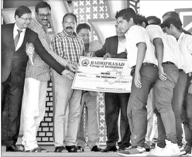
ବିକାଶ ଛାତ୍ରମାନେ ପୁରସ୍କାର ଗ୍ରହଣ କରୁଛନ୍ତି ।