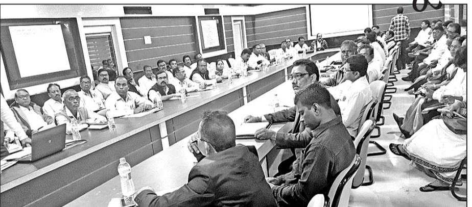
ମାତ୍ରିକ ବୋର୍ଡ ପରୀକ୍ଷା ପରୀକ୍ଷା ପ୍ରସ୍ତୁତି କାର୍ଯ୍ୟକ୍ରମ।