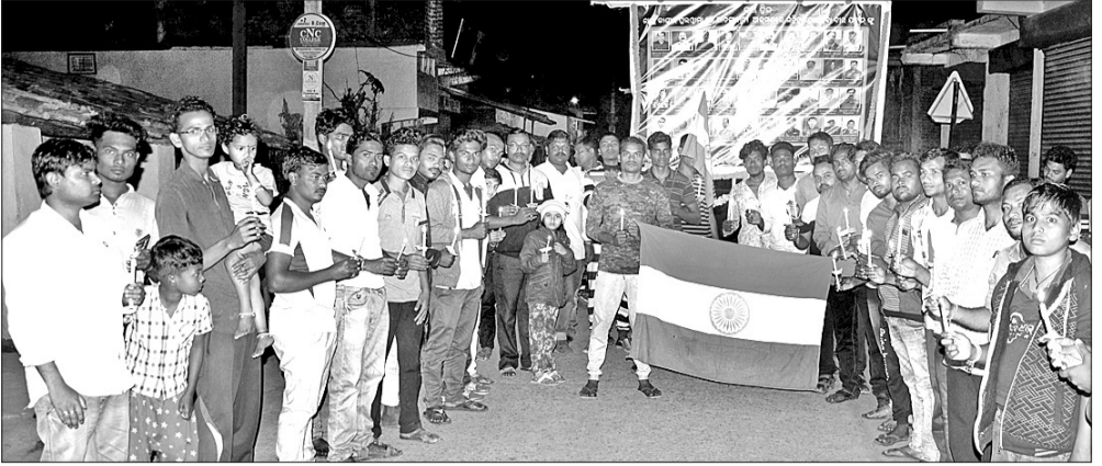
ଶହାଦତ୍ତ ଯବାନଙ୍କୁ ଉଦ୍ଦେଶ୍ୟରେ ପାଟଣାଗଡ଼ରେ କ୍ୟାଣ୍ଡେଲ ଶୋଭାଯାତ୍ରା