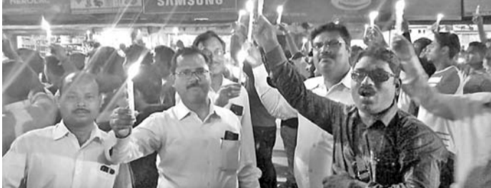
କ୍ୟାଣ୍ଟେଲ ଶୋଭାଯାତ୍ରାରେ ସାମିଲ ହୋଇଥିବା ଜନସାଧାରଣ। ଛକରେ କ୍ୟାଣ୍ଟେଲ ଘାଟଣା କରି ନିକଟରେ ଦାବି କରାଯାଇଛି।

କଳାହାଣ୍ଡି ଜିଲ୍ଲା କେସିଜା ସହରରେ ଶହାଦ ଯବାନଙ୍କ ଆତ୍ମୀୟ ସଦ୍‌ବଚ୍ଚି ନିମନ୍ତେ କେସିଜା ସହରବାସୀଙ୍କ ପକ୍ଷରୁ ଏକ କ୍ୟାଣ୍ଟେଲ ଶୋଭାଯାତ୍ରା ଶନିବାର ସନ୍ଧ୍ୟାରେ ଅନୁଷ୍ଠିତ ହୋଇଯାଇଛି।