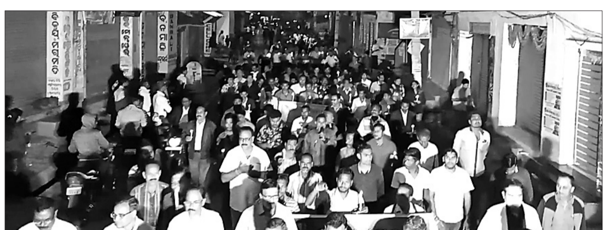
ଶହାଦତ୍ତ ଯବାନଙ୍କୁ ଉଦ୍ଦେଶ୍ୟରେ ପାଟଣାଗଡ଼ରେ କ୍ୟାଣ୍ଡେଲ ଶୋଭାଯାତ୍ରା