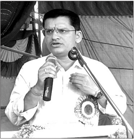
ମୁଖ୍ୟଅତିଥି ବକ୍ତବ୍ୟ ରଖୁଛନ୍ତି ।

ଭଲ ମାଧ୍ୟମିକ ଶିକ୍ଷାପ୍ରଦାନ ମଣିଷ ହେବାର ସୁଯୋଗ ରହିଥାଏ । ପାଠ୍ୟ ଜୀବନର ସହି ସମୟରେ ଛାତ୍ରଛାତ୍ରୀ ନିଜର ଆଗାମୀ ସ୍ଵପ୍ନକୁ ଦେଖିବା ଆରମ୍ଭ କରିଥାନ୍ତି ।