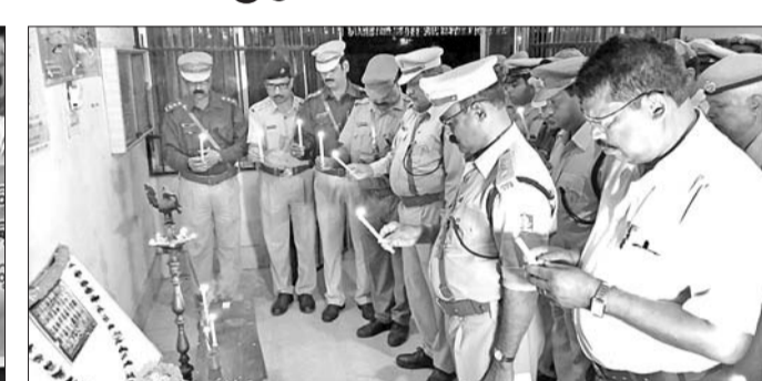
ଜିଲ୍ଲା ପୋଲିସ୍ ମୁଖ୍ୟାଳୟରେ ଏସ୍ପି ଓ ଅନ୍ୟ ପୋଲିସ୍ ଅଧିକାରୀ ଶ୍ରଦ୍ଧାଜଳି ଜଣାଇଛନ୍ତି।

କଳ୍ପ କଳ୍ପାଚାର ଆଡ଼କବାଦୀ ଆଜ୍ଞାନରେ ଶହାଦ ଯବାନଙ୍କ ପ୍ରତି ସୁବର୍ଣ୍ଣପୁର ଜିଲ୍ଲାର ବିଜିଲ୍ଲା ଅନୁଷ୍ଠାନ ସଭାକୁ ଶନିବାର ରାତ୍ନାକର ଶ୍ରଦ୍ଧାଜଳି ଜାପନ କରାଯାଇଛି।