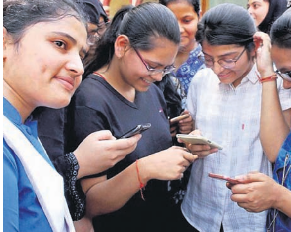
କଲ ରେକର୍ଡର: ଅଧିକାଂଶ

କୌଣସି ଡିଭେନ୍ସିଭ୍ କମ୍ପ୍ୟୁଟର ଏବଂ ମୁଖ୍ୟତଃ ପଞ୍ଜରେ ଉପଲବ୍ଧ ଭଳି ପଡ଼ିଯାଇଥାଏ। ଏହା ଏକ ସାମାଜିକ କଲମ ପରି, ଯାହା ଭିତରେ ଭିତରେ ଏବେ ଯତ୍ନ କରେ ଯେ ତାହା ବାହାରକୁ ସହଜରେ ଜଣାପଡ଼ି ନ ଥାଏ।