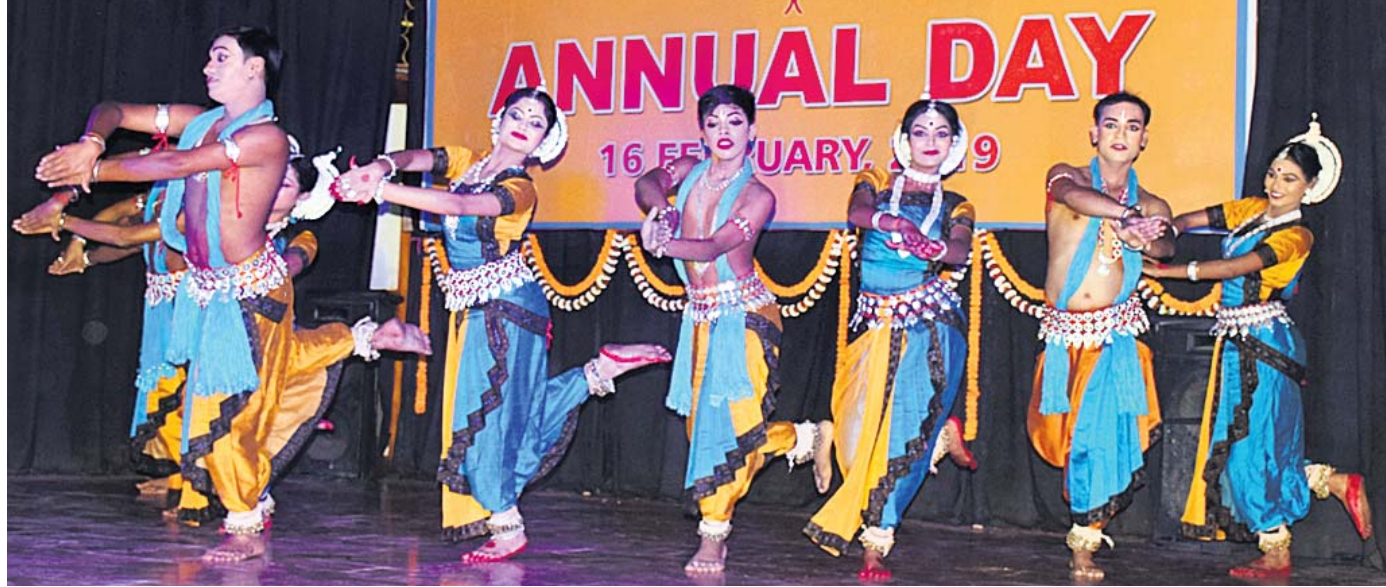
ଭୁବନେଶ୍ୱର ସୂଚନା ଭବନରେ ଶନିବାର ଓଡ଼ିଆ ଭେଟରୋନ ଅଫିସର ଆସୋସିଏଟସ୍ ନରାଜକ ଉପସ୍ଥାପନ ପରିବେଷିତ ସାଂସ୍କୃତିକ କାର୍ଯ୍ୟକ୍ରମ।

ସମ୍ପର୍କରେ ସଚେତନ କରିବାକୁ ମୁଁ ଏହି ଯାତ୍ରା କରିଛି। ଏହି ଯାତ୍ରାରେ ବିଭିନ୍ନ ସହରର ସ୍କୁଲ, କଲେଜ ଯାଇ ମୁବଦିଲ୍ ସହିତ ଆଲୋଚନା କରି ସ୍ୱେଚ୍ଛାକୃତ ରକ୍ତଦାନ ପାଇଁ ଅନୁରୋଧ କରୁଛି। ଏହା ପୂର୍ବରୁ ୨୦୧୭ରେ କଲିକତାରୁ ହେଉଛି ଦେଶର ଭବିଷ୍ୟତ। ତେଣୁ କନ୍ୟାକୁମାରୀ ପର୍ଯ୍ୟନ୍ତ ମଧ୍ୟ ସେ ଏହି ବାଣୀ ନେଇ ସାଇକେଲ ଯାତ୍ରା କରିଥିଲେ।