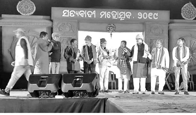
ସତ୍ୟବାଦୀ ମହୋତ୍ସବ ହିତାୟ ସନ୍ଧ୍ୟାରେ ମହୋତ୍ସବ ଦିଶୁଛି ଅତିଥିମାନେ ।

ସାକ୍ଷୀଗୋପାଳ, ୧୬/୨(ଡି.ଏନ୍.ଏ./ସ.ପ୍ର.): ଏହିସାପ୍ତକୀୟ ବଜ୍ରବିଦ୍ୟାଳୟ ପ୍ରତିଷ୍ଠା ଉଦ୍ଦେଶ୍ୟରେ ଏପରିକି ସତ୍ୟବାଦୀ ମହୋତ୍ସବର ଶନିବାର ଥିଲା ହିତାୟ ସନ୍ଧ୍ୟା। ବିଦ୍ୟାଳୟର ପିଲାମାନଙ୍କୁ ନେଇ ଅନୁଷ୍ଠିତ ବଜ୍ରବିଦ୍ୟାଳୟ ନୃତ୍ୟ ସଙ୍ଗୀତ, ଆଧ୍ୟାତ୍ମିକ ନୃତ୍ୟ, ଓଡ଼ିଶୀ, ସମ୍ବଲପୁରୀ, ଦେଶାତ୍ମବୋଧକ ନୃତ୍ୟ ଓ ତିରୁକାମ ପ୍ରତିଯୋଗିତାରେ କୃତୀ ପ୍ରତିଭାମାନଙ୍କୁ ଏହି ଅବସରରେ ଅତିଥିମାନେ ସମର୍ଥନ କରିଥିଲେ। ସତ୍ୟବାଦୀର ବିଭିନ୍ନ ସଙ୍ଗୀତ ନାୟକମାନଙ୍କୁ ଏହାପାଇଁ ଶ୍ରଦ୍ଧାଞ୍ଜଳି ଦିଆଯାଇଥିଲା। ସତ୍ୟବାଦୀର ବିଭିନ୍ନ ସଙ୍ଗୀତ ନାୟକମାନଙ୍କୁ ଏହାପାଇଁ ଶ୍ରଦ୍ଧାଞ୍ଜଳି ଦିଆଯାଇଥିଲା। ସତ୍ୟବାଦୀର ବିଭିନ୍ନ ସଙ୍ଗୀତ ନାୟକମାନଙ୍କୁ ଏହାପାଇଁ ଶ୍ରଦ୍ଧାଞ୍ଜଳି ଦିଆଯାଇଥିଲା।