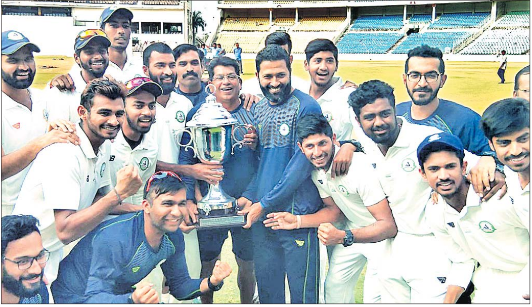
ଈରାନୀ କପ୍ ଚାମ୍ପିୟନ ବିଦର୍ଭ ଦଳର ଖେଳାଳିମାନେ ଗୁଡ଼ି ସହ।

ନାଗପୁର, ୧୬/୨ (ପି.ଟି.): ରଣଜୀ ଚାମ୍ପିୟନ ବିଦର୍ଭ ଘରୋଇ କ୍ରିକେଟରେ ତା'ର ଶ୍ରେଷ୍ଠତା ବଜାୟ ରଖିଛି।