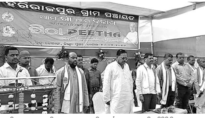
ପୂଜାରିଆ ଠାକୁରଙ୍କୁ ଗଜଉଦ୍ଧାରଣ ବେଶରେ ପିଠା କାର୍ଯ୍ୟକ୍ରମରେ ପ୍ରମୁଖ ଅତିଥି ପିପିଲି ବିଧାୟକ ପ୍ରମୋଦ ପୁରୀ ସମାପ୍ତି କରିଥିଲେ ।