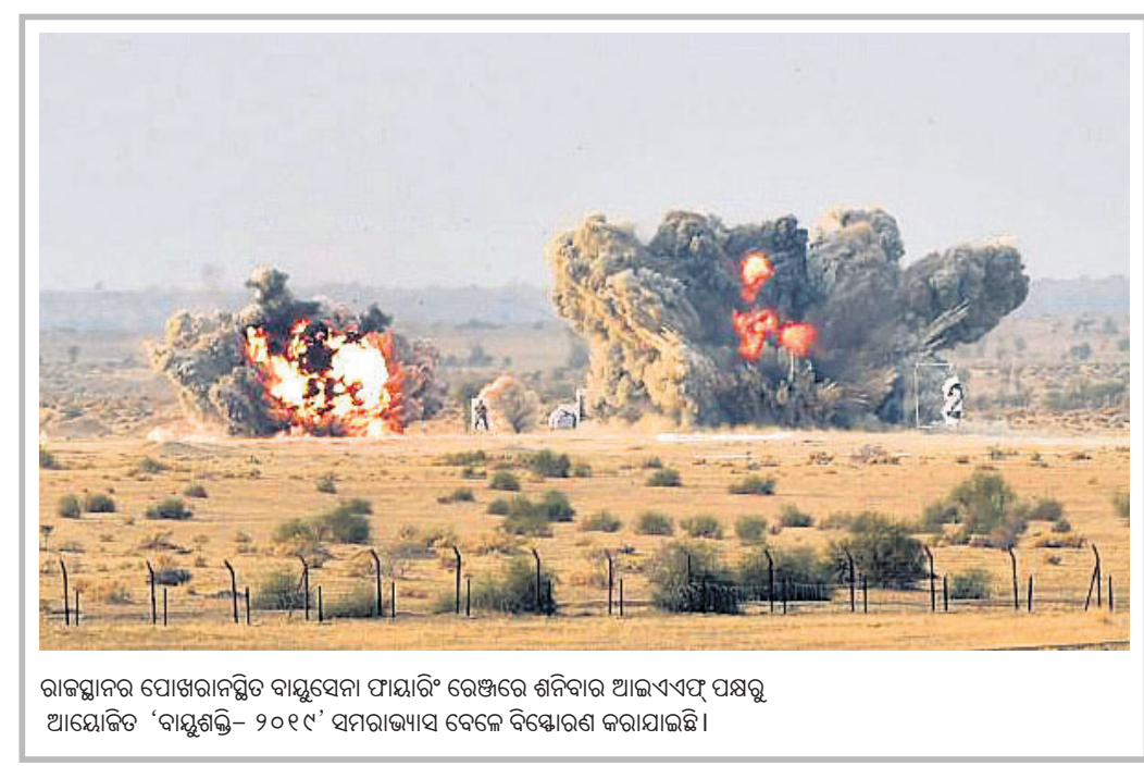
ରାଜସ୍ଥାନର ପୋଖରାନସ୍ଥିତ ବାୟୁସେନା ପାଲାର୍ ବିଖେରେ ଶନିବାର ଆଇଏଏସ୍ ପକ୍ଷରୁ ଆୟୋଜିତ 'ବାୟୁଶକ୍ତି-୨୦୧୯' ସମରାଜ୍ୟାସ ବେଳେ ବିଖେରଣ କରାଯାଇଛି।