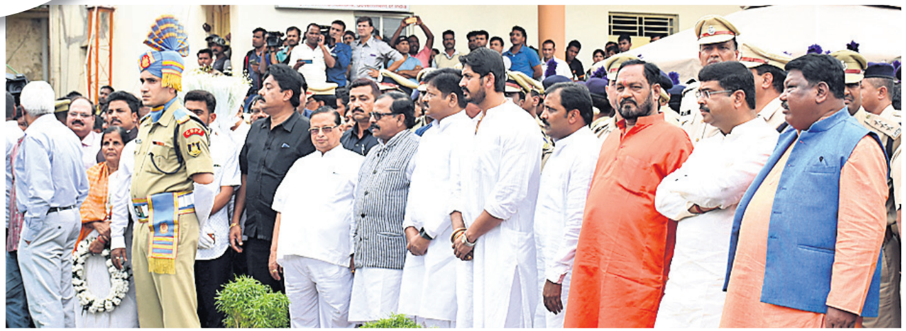
ଭୁବନେଶ୍ୱର ବିମାନବନ୍ଦର ବାହାରେ ୨ ଶହାଦଙ୍କ ଶେଷଦର୍ଶନ ଓ ଶ୍ରଦ୍ଧାଞ୍ଜଳି ପାଇଁ ଅପେକ୍ଷା କରି ରହିଥିବା ସାଧାରଣ ଲୋକ, ପ୍ରଶାସନିକ ଅଧିକାରୀ, ବିଭିନ୍ନ ଦଳର ନେତା, ବିଧାୟକ ଏବଂ କେନ୍ଦ୍ର ଓ ରାଜ୍ୟ ସରକାରଙ୍କ ମନ୍ତ୍ରୀ ।