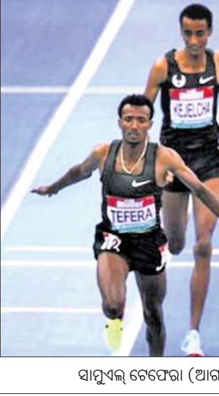
ସାପୁଏଲ୍ ଟେଫେରା (ଆମ)।

କର୍ମିହାମ୍, ୧୬/୨ (ଏସ୍ଏସ୍): ଇଥିଓପିଆର ସାପୁଏଲ୍ ଟେଫେରା ଇନ୍‌ଡୋର ୧୫୦୦ ମିଟରରେ ନୂଆ ବିଶ୍ୱ ରେକର୍ଡ ପ୍ରତିଷ୍ଠା କରିଛନ୍ତି।