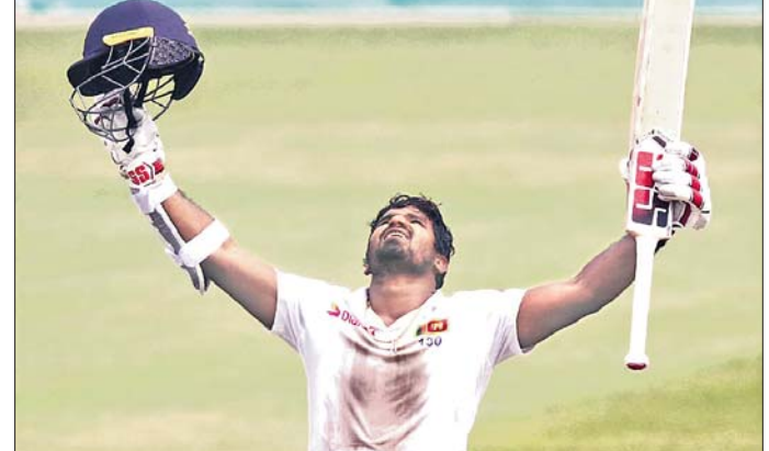
ଶତକ ହାସଲକାରୀ କୁଶାଲ ପେରେରା।

ଘରୋଇ ଦକ୍ଷିଣ ଆଫ୍ରିକା ବିପକ୍ଷରେ ଏଠାରେ ଅନୁଷ୍ଠିତ ପ୍ରଥମ ଟେଷ୍ଟ ମ୍ୟାଚ୍ରେ ଶ୍ରୀଲଙ୍କା ରୋମାଞ୍ଚକ ବିଜୟ ହାସଲ କରିଛି। ଦକ୍ଷିଣ ଆଫ୍ରିକା ପକ୍ଷରୁ ୩୦୪ ରନର ଚାର୍ଜେଟ୍ଟି ପିକ୍ସା କରିଥିବା ଶ୍ରୀଲଙ୍କା ଏ ଉଲ୍ଲେଖନୀୟ ସଫର୍ଯ୍ୟ ହାସଲ କରିଛନ୍ତି।