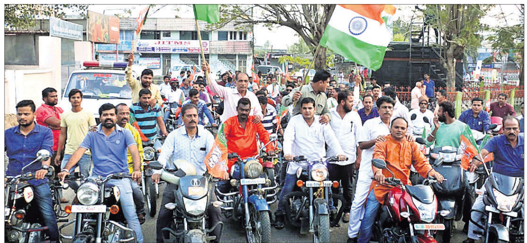
ଭାଜପା ସଂକଳ୍ପ ଶୋଭାଯାତ୍ରା ।

ବ୍ରହ୍ମପୁର ଅଫିସ୍, ୧୮୧୨: ଶ୍ରୀକୃଷ୍ଣ ଚୈତନ୍ୟ ମହାପ୍ରଭୁଙ୍କ ଅଭିଳାଷ ପ୍ରକାଶ ବିଗ୍ରହ ଶ୍ରୀମାନ୍ ନିତ୍ୟାନନ୍ଦ ମହାପ୍ରଭୁଙ୍କ ୫୪୬ ବର୍ଷ ଆବିର୍ଭାବ ମହୋତ୍ସବ ରବିବାର ସ୍ଥାନୀୟ ଶ୍ରୀସ୍ୱାସ୍ଥୀ ଚୈତନ୍ୟ ମନ୍ଦିର ଠାରେ ଅନୁଷ୍ଠିତ ହୋଇଯାଇଛି । ଏହି ଅବସରରେ ସକାଳ ୬ଟି ସମ୍ପା ୬ଟା ପର୍ଯ୍ୟନ୍ତ ନାମ ସଂକୀର୍ତ୍ତନ କରାଯାଇଥିଲା ।