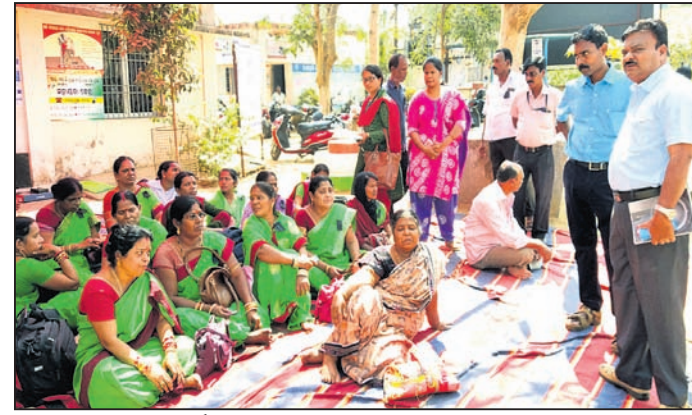
ଧାରଣାରେ ବସିଥିବା କର୍ମଚାରୀ।

ଆଲୋଚନା କରି ଆନ୍ଦୋଳନକୁ ଓହ୍ଲାଇବା ପାଇଁ ପରାମର୍ଶ ଦେଇଥିଲେ। ଆସନ୍ତା ୭ ଦିନ ମଧ୍ୟରେ ଯଥା ସମ୍ଭବ ସମସ୍ୟାର ସମାଧାନ କରିବା ଲାଗି ପ୍ରତିଶ୍ରୁତି ଦେବା