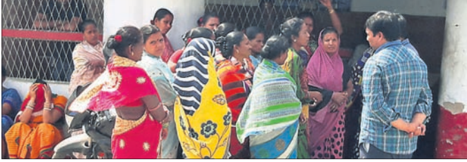
ମାନା ଟ୍ରଷ୍ଟ କର୍ତ୍ତୃପକ୍ଷ ସହ ସଫେଳ କର୍ମଚାରୀମାନେ ଆଲୋଚନା କରୁଛନ୍ତି ।

ବ୍ରହ୍ମପୁର ଅଫିସ୍, ୧୮୧୨: ବିଦ୍ୟାଳୟକୁ ଏବେ ଅନେକ ଥର ଅଭିଯୋଗ କରାଯାଇଥିଲେ ମଧ୍ୟ କେହି ଗୁରୁତ୍ୱ ଖାସ୍ୟ ଯୋଗାଉଥିବା ମାନା ଟ୍ରଷ୍ଟରେ ଯୋଗଦାନ କର୍ମଚାରୀଙ୍କ ଅସନ୍ତୋଷ ସଫେଳ କର୍ମଚାରୀମାନେ କାମ ବନ୍ଦ କରିଥିଲେ । କର୍ତ୍ତୃପକ୍ଷ ବୁଝାଖୁଣି କରିବା କର୍ମଚାରୀମାନେ ଅସନ୍ତୋଷ ପ୍ରକାଶ କରିଛନ୍ତି । ସେମାନଙ୍କ ଅଭିଯୋଗ ହେଲା, ତେବେ ଲିସ୍‌ଟ୍ ବ୍ୟବସର ବଳକା ଟଙ୍କା କରୁଛି ବୋଲି ମାନାର କଟେ ଅଧିକାରୀ ଦେବାକୁ ପ୍ରତିଶ୍ରୁତି ଦିଆଯାଇଥିଲା । ହେଲେ ଏବେ କେବଳ ୨୦୪୪ଟା ମିଳୁଛି । ବଳକା ଟଙ୍କା କୁଆଡ଼େ ଗଲା ବୋଲି ପ୍ରଶ୍ନ କଲେ, କର୍ତ୍ତୃପକ୍ଷ ଭ୍ରାନ୍ତିକର ତଥ୍ୟ ଦେଉଛନ୍ତି । ଏବେ ଅନେକ ଥର ଅଭିଯୋଗ କରାଯାଇଥିଲେ ମଧ୍ୟ କେହି ଗୁରୁତ୍ୱ ଖାସ୍ୟ ଯୋଗାଉଥିବା ମାନା ଟ୍ରଷ୍ଟରେ ଯୋଗଦାନ କର୍ମଚାରୀଙ୍କ ଅସନ୍ତୋଷ ସଫେଳ କର୍ମଚାରୀମାନେ କାମ ବନ୍ଦ କରିଥିଲେ । କର୍ତ୍ତୃପକ୍ଷ ବୁଝାଖୁଣି କରିବା କର୍ମଚାରୀମାନେ ଅସନ୍ତୋଷ ପ୍ରକାଶ କରିଛନ୍ତି । ସେମାନଙ୍କ ଅଭିଯୋଗ ହେଲା, ତେବେ ଲିସ୍‌ଟ୍ ବ୍ୟବସର ବଳକା ଟଙ୍କା କରୁଛି ବୋଲି ମାନାର କଟେ ଅଧିକାରୀ ଦେବାକୁ ପ୍ରତିଶ୍ରୁତି ଦିଆଯାଇଥିଲା । ହେଲେ ଏବେ କେବଳ ୨୦୪୪ଟା ମିଳୁଛି । ବଳକା ଟଙ୍କା କୁଆଡ଼େ ଗଲା ବୋଲି ପ୍ରଶ୍ନ କଲେ, କର୍ତ୍ତୃପକ୍ଷ ଭ୍ରାନ୍ତିକର ତଥ୍ୟ ଦେଉଛନ୍ତି ।