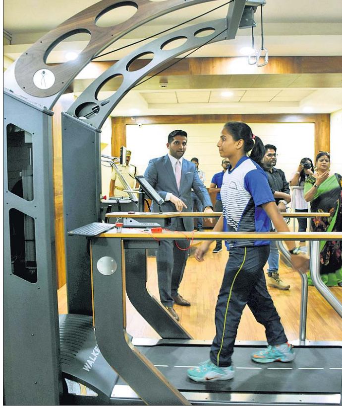
କ୍ରୀଡ଼ା ଛାତ୍ରାବାସର ଜଣେ ଆଥଲେଟିକ୍ ନିଜ ଦକ୍ଷତା ପରଖୁଛନ୍ତି ।