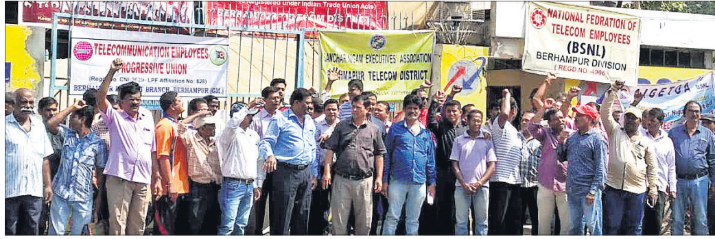
ବିଏସ୍‌ଏନ୍‌ଏଲ୍ କର୍ମଚାରୀମାନେ ବିକ୍ଷୋଭ ପ୍ରଦର୍ଶନ କରୁଛନ୍ତି ।

ଭାରତ ସଞ୍ଚାର ନିଗମ ଲିମିଟେଡ୍(ବିଏସ୍‌ଏନ୍‌ଏଲ୍)ର ସମସ୍ତ ମୁନିସିପାଲ ଏବଂ ସଂଗଠିତ ତରଫରୁ ଯୋଗଦାନରୁ ୩ ଦିନିଆ କାର୍ଯ୍ୟବନ୍ଦ ଆନ୍ଦୋଳନ ଆରମ୍ଭ ହୋଇଛି ।