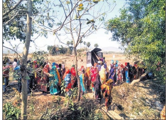
ମହିଳାମାନେ ମଦ ଦୋକାନ ଭାଙ୍ଗିଛନ୍ତି।