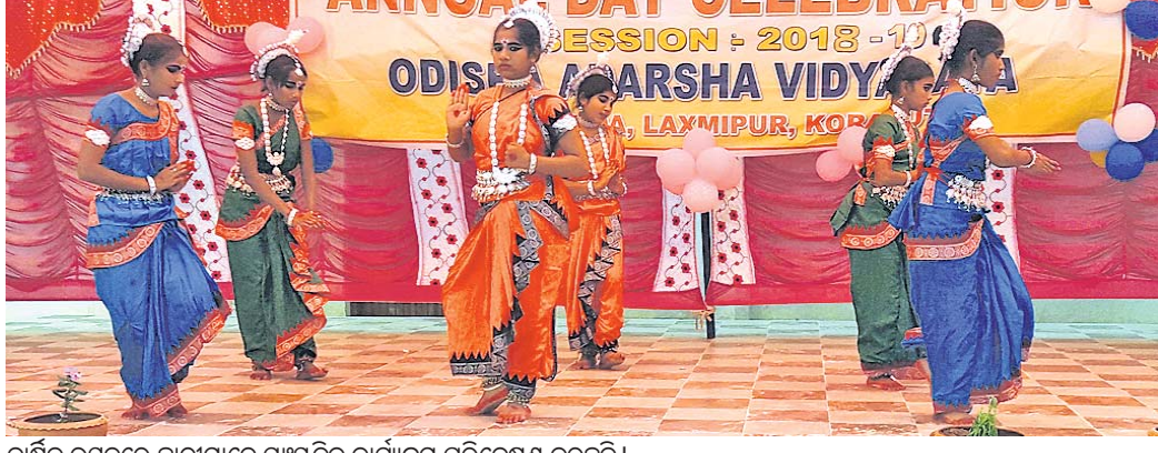
ବାର୍ଷିକ ଉତ୍ସବରେ ଛାତ୍ରୀମାନେ ସାଂସ୍କୃତିକ କାର୍ଯ୍ୟକ୍ରମ ପରିବେଷଣ କରୁଛନ୍ତି।