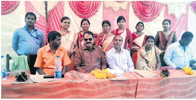
ଫାଣ୍ଡିଶି ବିଦ୍ୟାଳୟ କାର୍ଯ୍ୟକ୍ରମରେ ବିଧାୟକଙ୍କ ସହ ଅନ୍ୟମାନେ।

ଜୟପୁର/ଫାଣ୍ଡିଶି, ୨୦୧୨ (ଡି.ପ୍ର./ଡି.ଏନ୍.ଏ.)