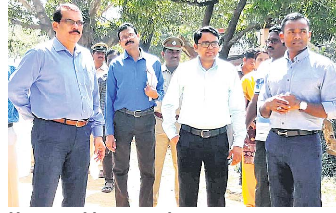
ସ୍ଥିତି ଅନୁଧ୍ୟାନ କରୁଛନ୍ତି ଜିଲ୍ଲାପାଳ ଏବଂ ଏସ୍‌ପି।

ରାୟଗଡ଼ା ଜିଲ୍ଲା ଗୁଣପୁରଠାରେ ସିପିଆଇ(ଏମ୍‌ଏଲ୍)ର ଜନ ସଂକଳ୍ପ ସମାବେଶ ଅନୁଷ୍ଠିତ ହୋଇଥିଲା। ଏଥିରେ ୨୨୨ ଯୁକ୍ତିଚ ରକ୍ତ ସଂଗ୍ରହ କରାଯାଇଛି।