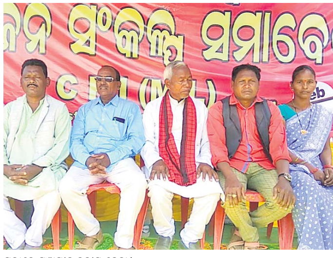
ସଭାରେ ମଞ୍ଚାଧୀନ ପକାଇ ନେତା।

ଫେବୃଆରୀ ୨୨, ଶୁକ୍ରବାରଠାରୁ ଚଳିତ ବର୍ଷର ମାଟ୍ରିକ ପରୀକ୍ଷା ଆରମ୍ଭ ହେବ। ରାୟଗଡ଼ା ଜିଲ୍ଲା ମୋଟ ୧୧୫ଟି ପଢ଼ାଉଥିବା ବିଦ୍ୟାଳୟରେ ୫୨୨ଟି ପଢ଼ାଉଥିବା ବିଦ୍ୟାଳୟରେ ୧୧,୬୦୩ ପରୀକ୍ଷାର୍ଥୀ ଉପସ୍ଥିତ ରହିବେ।