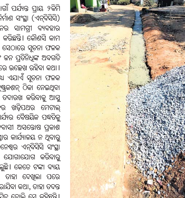
କୋଟପାଡ଼ ବ୍ଲକ୍ ପୂର୍ବାହାଣ୍ଡି ପଞ୍ଚାୟତରୁ ଜିରାଗାଁ ପର୍ଯ୍ୟନ୍ତ ପ୍ରାୟ ୨ କିମି ରାସ୍ତା ନିର୍ମାଣ କାମ ଚାଲିଛି।