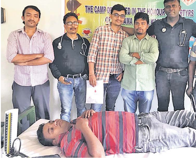
ଶିବିରରେ ଜଣେ ସେଲ୍‌ସେବା ରତ୍ନଦାନ କରୁଛନ୍ତି।

ଜୟପୁର ପୋଲିସ ବୁଧବାର ପାହାଣ୍ଡାରେ ପାଟୋଲିଙ୍ଗ କରୁଥିବା ବେଳେ ଥିବା ଗ୍ରାମ ହାଟପଦାରେ ଏକ ଗାଡ଼ି (ସିଡି ୧୩ ସି ୩୧୫୧) ଯାଞ୍ଚକରି ୬୫ କେଜି ଗଞ୍ଜେଇ ଜବତ କରିଛି।