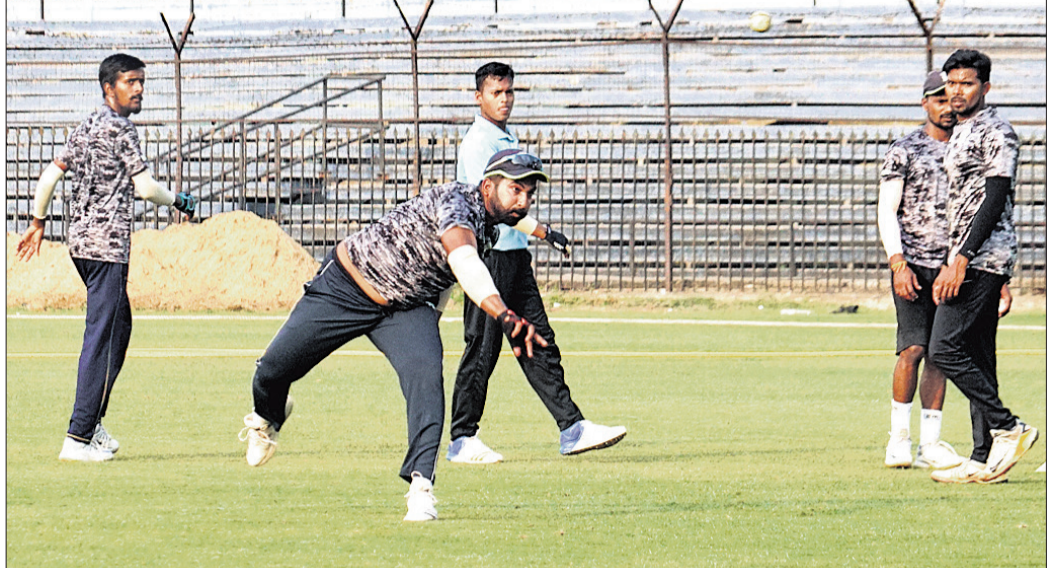
ବାରବାଟୀ ସ୍ମୃତିମନ୍ଦିର ଓଡ଼ିଶା ଖେଳାଳିଙ୍କ ଅଭ୍ୟାସ।

ବିଜୟ ହଜାରେ ଟ୍ରଫି, ରଣଜୀ ଟ୍ରଫି ପରେ ଏବେ ଘରୋଇ କ୍ରିକେଟର ଅଧିକ ପ୍ରତିଯୋଗିତା ସମୃଦ୍ଧ ପୁସ୍ତକ ଅଲି ଟି୨୦ ଟୁର୍ନାମେଣ୍ଟ ଗୁରୁବାରଠାରୁ ଦେଶର ବିଭିନ୍ନ ଗ୍ରାମ୍ୟରେ ଆରମ୍ଭ ହେବ।