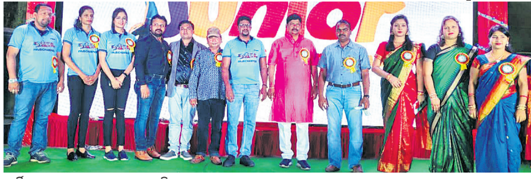
ବାର୍ଷିକ ଉତ୍ସବରେ ଯୋଗ ଦେଇଥିବା ଅତିଥିମାନେ ।