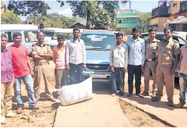
ଜବତ ଗଞ୍ଜେଇ ଓ ଗିରଫ ଅଭିଯୁକ୍ତଙ୍କ ସହ ପୋଲିସ କର୍ମଚାରୀମାନେ।