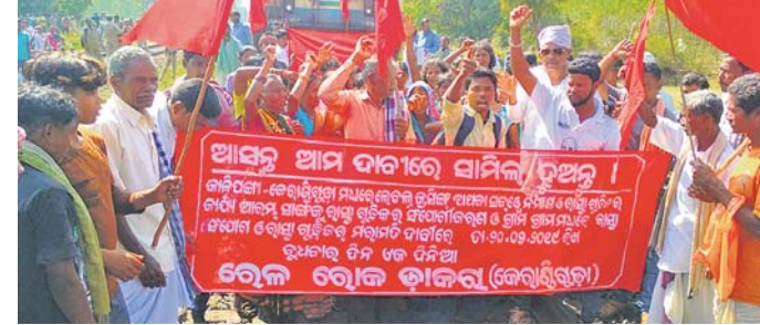
ଗ୍ରାମବାସୀ ରେଳରୋକ୍ଷୀ କରିଛନ୍ତି।

ରାୟଗଡ଼ା ଜିଲ୍ଲା ବିଷମକଟକ ବ୍ଲକ୍ରେ ଭୂତଳ ରାସ୍ତା ନିର୍ମାଣ ଦାବିରେ ରେଳରୋକ୍ଷୀମାନେ ଆନ୍ଦୋଳନ ଆରମ୍ଭ କରିଛନ୍ତି। ଏଥିରେ ୨୨୨ ଯୁକ୍ତିଚ ରକ୍ତ ସଂଗ୍ରହ କରାଯାଇଛି।