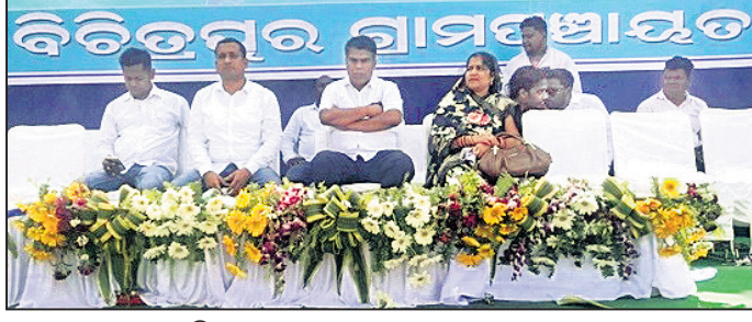
ସଭାରେ ମଞ୍ଚାସୀନ ଅତିଥି ।