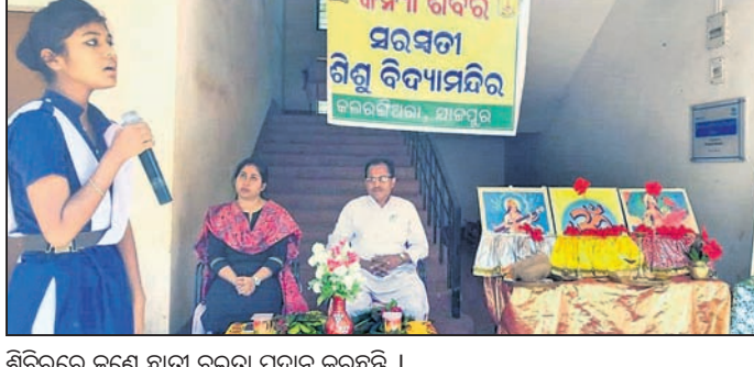
ଶିବିରରେ ଜଣେ ଛାତ୍ରୀ ବକ୍ତୃତା ପ୍ରଦାନ କରୁଛନ୍ତି ।