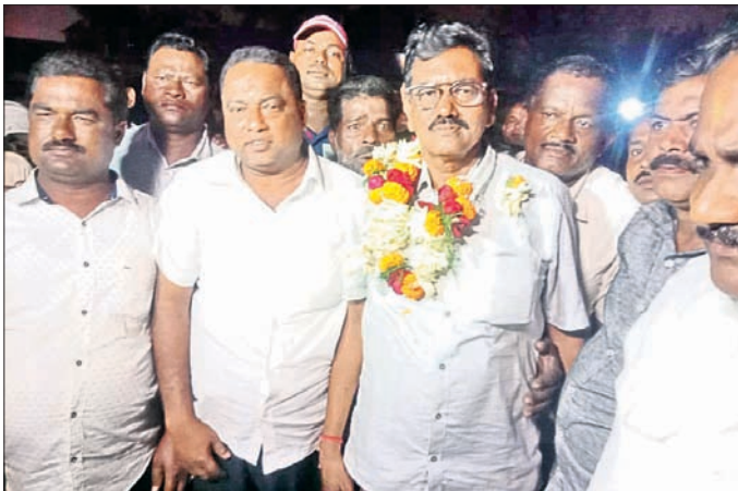
ଓମ୍ପା ନିର୍ବାଚନ କର୍ମକର୍ମୀମାନେ ବିଜୟଭଣ୍ଡାର ପାଲୁଛନ୍ତି।

ବାମା କରୁ ନ ଥିବା ଜଣାପଡ଼ିଛି। ଏହି ଆଇନ ତର୍କନା କରିବା ଓ ତଦାରଖ କରିବା ଦାୟିତ୍ୱ ଜିଲାପାଳଙ୍କର। ପ୍ରତ୍ୟକ୍ଷ ନିୟନ୍ତ୍ରଣ ବୋର୍ଡ଼ ଓ କାରଖାନା ବାସ୍ତବିକା ପକ୍ଷରୁ ମଧ୍ୟ ତଦାରଖ କରାଯାଇପାରିବ।