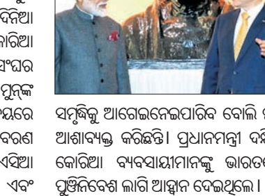
ସମ୍ପୃକ୍ତି ଆଗେଲନେଇପାରିବ ବୋଲି ପୁନୁ ଆଶାବ୍ୟକ୍ତ କରିଛନ୍ତି । ପ୍ରଧାନମନ୍ତ୍ରୀ ଦକ୍ଷିଣ କୋରିଆ ବ୍ୟବସାୟୀମାନଙ୍କୁ ଭାରତରେ ପୁଞ୍ଜିନିବେଶ ଲାଗି ଆକ୍ଷୀପ ଦେଇଥିଲେ ।

ମଧ୍ୟରେ ରାଜନୀତିକ ସମ୍ପର୍କକୁ ମଜବୁତ କରିବା ଲାଗି ମୋଦି ସେଠାକୁ ବୁଲିଗିଆ ଗସ୍ତରେ ଯାଇଛନ୍ତି । ସେ ଦକ୍ଷିଣ କୋରିଆ ରାଷ୍ଟ୍ରପତି ପୁନୁ ଜାଏ-ଇନ ଏବଂ କାରିଆୟନ ପୂର୍ବତନ ମହାସଚିବ ବାନ୍ କି-ମୁନୁଙ୍କ ସହ ସେୟାନସଭା ବିଶ୍ୱବିଦ୍ୟାଳୟରେ ଗାନ୍ଧିଜୀଙ୍କ ଆବଶ୍ୟକ ପ୍ରତିମୂର୍ତ୍ତି ଅନାବରଣ କରିଥିଲେ । ଗାନ୍ଧିଜୀଙ୍କ ଚିନ୍ତାଧାରା ଏସିଆ ଏବଂ ଏସିଆ ବାହାରେ ଶାନ୍ତି ଏବଂ