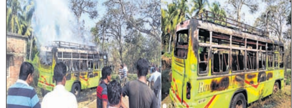
ଦୁର୍ଭିକ୍ଷ ପୋଡ଼ି ଦେଖିବା ବସ୍।