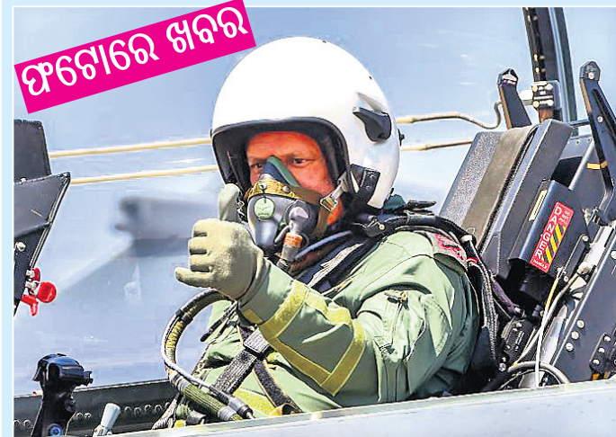
ଫାଟୋରେ ଖବର: ବେଙ୍ଗାଳୁରେ ତାଳିଥିବା ଏବେ ଲକ୍ଷ୍ମିଆ ୨୦୧୯ର ଦ୍ୱାଦଶ ସଂସ୍କରଣର ବିତୀୟ ଦିନରେ ଗୁରୁବାର ମୁକ୍ତିଦାନ 'ଚେକ୍'ରେ ଉଡ଼ାଣ ଆରମ୍ଭ ପୂର୍ବରୁ ସ୍ଥଳସେନା ମୁଖ୍ୟ କେନେରାଲ ବିପିନ ରାଓଙ୍କୁ ।

୨୦୧୨ ଫେବୃୟାରୀ ୨୨ରେ ଆର୍ଦେଶିକାର ବୁଦ୍ଧି ଏୟାର୍ସରେ ଗ୍ରେନ୍ଦ୍ ବୁର୍ଯ୍ୟିଫା ଯୋଗୁ ୫୧ଜଣଙ୍କ ମୃତ୍ୟୁ ଘଟିଥିବା ବେଳେ ୨୦୦ ଆହତ ହୋଇଥିଲେ । ବୁଦ୍ଧି ଏୟାର୍ସ ହେଉଛି ଆର୍ଦେଶିକାର ରାଜଧାନୀ ତଥା ସର୍ବବୃହତ୍ ନଗର । ସ୍ଥାନୀୟ ଭାଷାରେ ବୁଦ୍ଧି ଏୟାର୍ସ ଅର୍ଥ ସୁନ୍ଦର ସଦନ । ଉକ୍ତ ନଗରୀ ଗିଓ-ଡି-ଲା-ପୁରୀ ନଦୀର ପଶ୍ଚିମ ତଟରେ ଅବସ୍ଥିତ ।