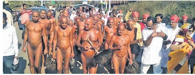
ପଦଯାତ୍ରାରେ ଯାଉଛନ୍ତି ଜୈନ ମୁନିଗଣ।