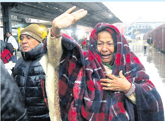
ପୁଲଫୁଆ ଆକ୍ରମଣ ପରେ ବୁଲ ପଡ଼ୋଶୀ ମଧ୍ୟରେ ଉଦ୍ଧାରଣ ବୃଦ୍ଧିପାଇଥିବାବେଳେ ଲାହୋର ରେଳଷ୍ଟେସନରେ ଗୁରୁବାର ଜଣେ ପାକିସ୍ତାନୀ ମହିଳା ସମସ୍ତେ ଓ ଏକପ୍ରୋସ୍ତରେ ଭାରତ ଆସୁଥିବା ତାଙ୍କ ସମ୍ପର୍କୀୟମାନଙ୍କୁ ବିଦାୟ ଜଣାଉଛନ୍ତି ।