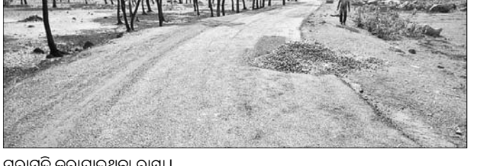
ମରାମତି କରାଯାଇଥିବା ରାସ୍ତା।

ଝୁମ୍ପୁରା, ୨୧୧୨(ଡି.ଏନ.ଏ.): ଝୁମ୍ପୁରା ବ୍ଲକ୍‌ରେ ପ୍ରଧାନମନ୍ତ୍ରୀ ସଡ଼କ ମରାମତି ନିମ୍ନମାନର ହୋଇଥିବା ଅଭିଯୋଗ ହୋଇଛି। ଅଧିକାରୀଙ୍କୁ ରାସ୍ତା, ନିମ୍ନମାନର କାର୍ଯ୍ୟ, ଅସୁବିଧା ସମ୍ମୁଖୀନ, ବାରଖଣ୍ଡିଆ, ଅସୁବିଧା ନିର୍ମାଣ ନ ସରିବା, ଏଣ୍ଟ୍ରିପେଟ ଅନୁସାରେ କାମ ନ ହେବା ଆଦି ଅଭିଯୋଗ ଗ୍ରାମ୍ୟ ଉନ୍ନୟନ ବିଭାଗରେ ହୋଇଆସୁଛି। ପ୍ରଧାନମନ୍ତ୍ରୀ ସଡ଼କ ଯୋଜନାରେ ଦୁର୍ଗାପୁର-ଅସୁବିଧା ଗ୍ରାମାଞ୍ଚଳରେ ଗ୍ରାମ୍ୟ ଉନ୍ନୟନ ବିଭାଗ ରାସ୍ତାରେ ପିଚୁ ମରାମତି କାମ କରୁଛି। ଏ କି.ମି ରାସ୍ତାରେ ସମୁଦାୟ ୪ କି.ମି ପିଚୁ ମରାମତି ହୋଇଛି।