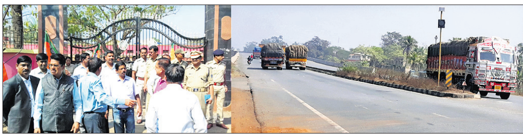
କୋର୍ଟ ବନ୍ଦ ଥିବାବେଳେ ଜାତୀୟ ରାଜପଥରେ ଗାଡ଼ି ଚଳାଚଳ।

ବାଲିସେ ସୁରକ୍ଷା ଦେଇଥିଲେ। ରାଜ୍ୟରେ ଭାଜପା ସରକାର ଆସିଲେ ଆସନ୍ତା ୨୦୨୨ ପୂର୍ଣ୍ଣା ସ୍ତରୀ ପଟା ସହ ପଙ୍କା ଘର ୧୦ବର୍ଷ ଶାସନରେ ମାତ୍ର ୬ଲକ୍ଷ ୬୭ ହଜାର ୨୫୭ଟି ପଙ୍କାଘର ଦେଇଥିଲା ବେଳେ ନରେନ୍ଦ୍ର ମୋଦିଶାସକ ଶାସନରେ ଓଡ଼ିଶାକୁ ୧୨ଲକ୍ଷ ୯୯ହଜାର ୯୨୭ଟି ପଙ୍କାଘର ଦେବା ପାଇଁ ବ୍ୟବସ୍ଥା କରାଯାଇଛି।