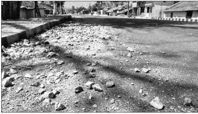
ରାସ୍ତାରେ ପଡୁଥିବା ଚିପ୍‌ସ ଓ ମେଟାଲ।

ଦୁର୍ଘଟଣା ରୋକିବା ପାଇଁ ସଚେତନତା କାର୍ଯ୍ୟକ୍ରମ କରାଯାଉଥିଲେ ହେଁ ରୋକାଯାଇପାରୁନି। ଦୁର୍ଘଟଣା ଘଟି କାବନ ହାରି ହେଉଛି। ବିପର୍ଯ୍ୟୟ ରାସ୍ତାଘାଟ ସହ ରାସ୍ତାରେ ପଡୁଥିବା ମେଟାଲ, ପିଲେଟ ଆଦି ଦୁର୍ଘଟଣାର କାରଣ ହୋଇଛି। ପ୍ରଶାସନର ତେଡ଼ା ପଶ୍ଚୁ ନ ଥିବାରୁ ଅସନ୍ତୋଷ ଟାଡ଼ ହେଉଛି। ପ୍ରଶାସନ ପକ୍ଷରୁ ଏସବୁ ରୋକିବା ପାଇଁ କୌଣସି ପଦକ୍ଷେପ ଗ୍ରହଣ କରାଯାଉନି। ନାଟିନିୟମକୁ ଉଲ୍ଲଙ୍ଘନ କରି ଟ୍ରକ୍‌ରେ ମେଟାଲ, ପିଲେଟ, ବାଲି, ଚିପ୍‌ସ, ଲୁହାପଥ ପଡୁଛି। ଜିଲ୍ଲାରେ ରାସ୍ତାଘାଟ ଆଦି କାମ ଚାଲୁଥିବାରୁ ବହୁ ପରିମାଣରେ ମେଟାଲ, ଚିପ୍‌ସ, ବାଲି ବିଭିନ୍ନ ସ୍ଥାନକୁ ପରିବହନ ହେଉଛି। ଧାର୍ଯ୍ୟଠାରୁ ଅଧିକ ଏବଂ ବିନା ଘୋଡ଼ଣିରେ ପରିବହନ ହେଉଛି।