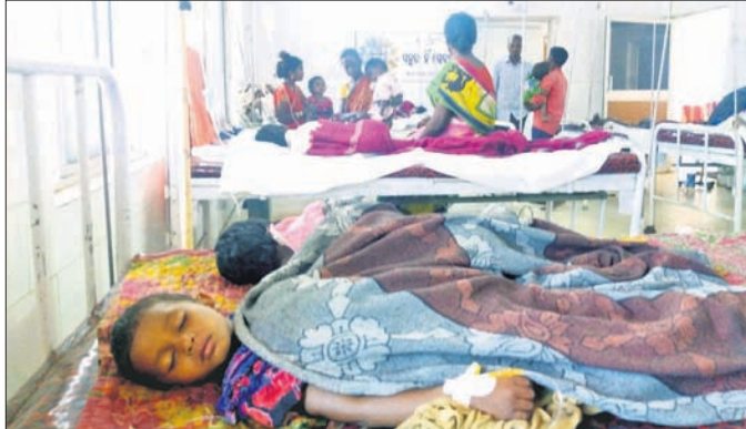
ପାଟଣା ଗୋଷ୍ଠୀ ସାକ୍ଷ୍ୟକେନ୍ଦ୍ରରେ ଭର୍ତ୍ତି ହୋଇଥିବା ଶିଶୁ।