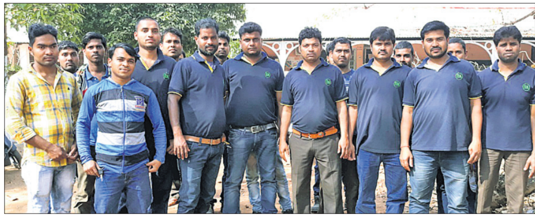
ଜିଲ୍ଲାପାଳ ଅଫିସ୍ ଆଗରେ ‘ବି ଆଣ୍ଡ ଏ ପ୍ୟାନିଂ ଇଣ୍ଡିଆ’ ଲିମିଟେଡ୍ କାରଖାନାର ଶ୍ରମିକ।