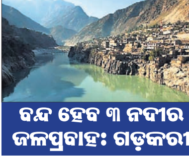
ବନ୍ଦ ହେବ ୩ ନଦୀର ଜଳପ୍ରବାହ: ଗଡ଼କରୀ

ଭାରତ ସିନ୍ଧୁ ନଦୀ ଜଳରେ ନିଜ ଭାଗକୁ ପାକିସ୍ତାନକୁ ବେହିରିବାକୁ ଦେବ ନାହିଁ ବୋଲି ଗୁରୁବାର ଘୋଷଣା କରିଛି । ପାକିସ୍ତାନକୁ ବେହିରିବାପାଇଁ ନଦୀଜଳର ଭାରତୀୟ ଭାଗକୁ ରୋକିବା ଲାଗି ସରକାର ନିଷ୍ପତ୍ତି ନେଇଥିବା ଜଣାପଡ଼ିଛି । ପକ୍ଷୀ ନାଟ୍ୟ ଗତକରୀ କହିଛନ୍ତି । ସିନ୍ଧୁନଦୀ ଜଳ ଭୂମିନାମା ଅନୁଯାୟୀ ଏହାପାଇଁ ପାକିସ୍ତାନ ଭାଗ ଜଳ ପ୍ରଭାବିତ ହେବନାହିଁ । ପୂର୍ଣ୍ଣାଞ୍ଚଳରେ ପ୍ରବାହିତ ସିନ୍ଧୁ ଶାଖା ନଦୀ ରାବି, ବେଆସ ଏବଂ ସତଲେଜ ଜଳ ସ୍ରୋତର ଦିଗ ପରିବର୍ତ୍ତନ କରି ଏହାକୁ ଜମ୍ମୁ-କଶ୍ମୀର ଏବଂ ପଞ୍ଜାବ ଲୋକଙ୍କ ବ୍ୟବହାର ପାଇଁ ଛଡ଼ାଯିବ । ପୁଲଫୁଆ ଆକ୍ରମଣ ପରେ ପାକିସ୍ତାନକୁ ନଦୀଜଳ ପ୍ରବାହ ବନ୍ଦ କରିବା ଲାଗି ଦାବି ହୋଇଥିଲା । ରାବି ନଦୀର ଶାହପୁର-