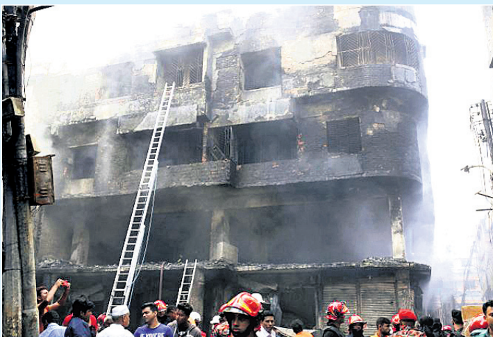
ବାଂଲାଦେଶ ରାଜଧାନୀ ଡାକାସ୍ଥିତ ଚୌକ୍‌ବଜାର ଅଞ୍ଚଳରେ ବୁଧବାର ରାତିରେ ଭୟାବହ ଅଗ୍ନିକାଣ୍ଡ ଘଟି ୮୧ ଜଣଙ୍କ ଜୀବନ ଯାଇଛି । ନିଆଁ ଲାଗିଥିବା ଏକ କୋଠା ଗାରିପଟେ ଗୁରୁବାର ସକାଳେ ଅଗ୍ନିଶମ ବାହିନୀ ।