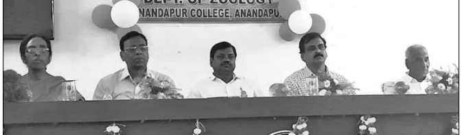
ବାର୍ଷିକ ଉତ୍ସବରେ ଅତିଥିଗଣ।