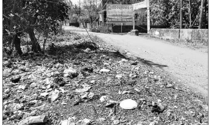
ସରସ୍ଵତୀ ଶିଶୁ ବିଦ୍ୟାଳୟର ସମ୍ମୁଖ ରାସ୍ତା।