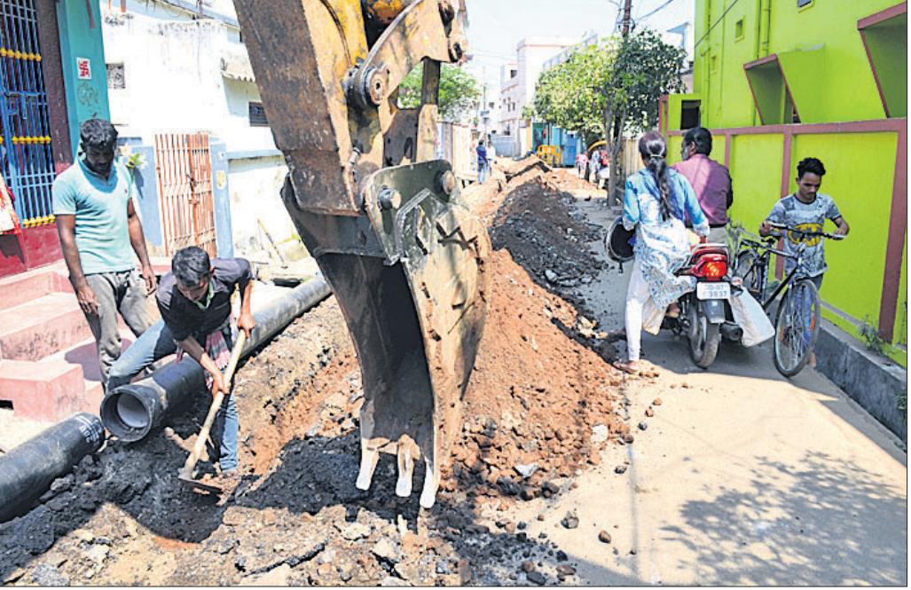
କାଳିଙ୍ଗ ପ୍ରକଳ୍ପରେ ପ୍ରତ୍ୟେକ ଘରକୁ ଜଳ ଯୋଗାଣ ପାଇଁ ନବୀନ ବ୍ରହ୍ମପୁର ସହରବ୍ୟାପୀ ରାସ୍ତାଗୁଡ଼ିକ ଖୋଳି ଦିଆଯାଇଛି। ଏଣୁ ଯାନବାହନ ଦୂର କଥା, ଚାଲି ଯିବା ମଧ୍ୟ କଷ୍ଟ ହେଉଛି। ପ୍ରତିଦିନ ଛୋଟ ବଡ଼ ଦୁର୍ଘଟଣା ଘଟୁଛି। ଏହାକୁ ନେଇ ସହରବାସୀଙ୍କ ମଧ୍ୟରେ ଅସନ୍ତୋଷର ଦାନା ବାନ୍ଧୁଛି ।