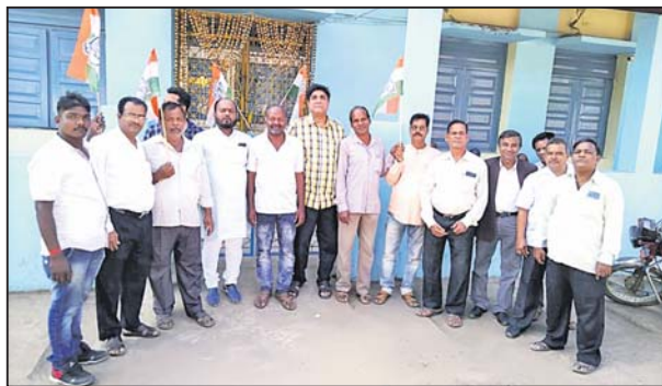
ଝେଟବ୍ୟାଙ୍କ ସମ୍ମୁଖରେ ବିରୋଧୀ ପ୍ରଦର୍ଶନ କରାଯାଇଛି।

ଭଞ୍ଜନଗର, ୨୧।୨ (ଭ.ଏନ.ଏ.) ନବ ନିର୍ମାଣ କୃଷକ ସଙ୍ଗଠନ ପକ୍ଷରୁ ଚାଷୀଙ୍କୁ ପ୍ରାଇଭ୍ ପ୍ରେକ୍ଟିକ୍ସ ଓ ପେନସନ୍ ଦାବି ନେଇ ଗୁରୁବାର ଓଡ଼ିଶା ବନ୍ଦ ଘୋଷଣା କରାଯାଇଥିଲା। ସଙ୍ଗଠନର ଏହି ଦାବିକୁ କଂଗ୍ରେସ ଓ ଭାଜପା ସମର୍ଥନ ଜଣାଇଥିଲେ। ଏହି ପରିପ୍ରେକ୍ଷାରେ ଭଞ୍ଜନଗରରେ ବନ୍ଦ ପାଳନରେ କଂଗ୍ରେସ ଓ ଭାଜପା ନେତାମାନେ ସାମିଲ ହୋଇଥିଲେ। ଯଦ୍ୱାରା ସହରର ସମସ୍ତ ବୋକାଳ ବନ୍ଦର, ସରକାରୀ କାର୍ଯ୍ୟାଳୟ