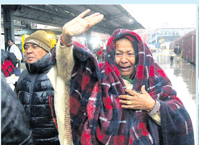
ପୁଲଫୁଲ ଆକ୍ରମଣ ପରେ ବୁଲ ପଡ଼ୋଶୀ ମଧ୍ୟରେ ଉଦ୍ଧେବନା ବୁଦ୍ଧିପାଇଥିବାବେଳେ ଲାହୋର ରେଳଷ୍ଟେଶନରେ ଗୁରୁତାର ଜଣେ ପାକିସ୍ତାନୀ ମହିଲା ସମସ୍ତେ ଠାଏଁ ଏକପ୍ରକାର ଭାରତ ଆପୁଥିବା ତାଙ୍କ ସମ୍ପର୍କୀୟମାନଙ୍କୁ ବିଦାୟ ଜଣାଉଛନ୍ତି ।