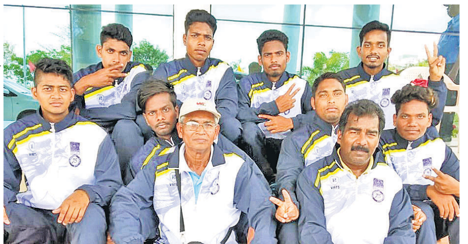
କୁଚନେଶ୍ୱର, ୨୧୧୨(କ୍ରୀଡ଼ା ପ୍ରତିନିଧି)