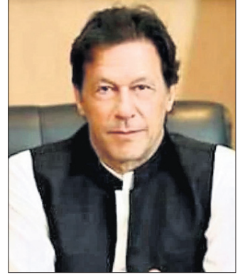
(କେଜଏମ୍) ଆକ୍ରମଣ କରିଥିଲା ଏହି ଆନ୍ତର୍ଦ୍ଦାତା ବିଶ୍ୱାସରେ ଗତ ୧୪ ତାରିଖରେ ଜେଣ୍ଡ-ଇ-ମହମ୍ମଦ ୪୯ ଦିଆରପିଏସ୍ ଯବାନ ଶହାଦ

ଭାରତ ଆକ୍ରମଣ କଲେ କଡ଼ା ଜବାବ ଦେବା ପାଇଁ ପାକିସ୍ତାନୀ ସେନାକୁ ସେଠାକାର ପ୍ରଧାନମନ୍ତ୍ରୀ ଇମ୍ରାନ୍ ଖାନ୍ ଗୁରୁତାର ନିର୍ଦ୍ଦେଶ ଦେଇଛନ୍ତି । ପୁଲଫୁଲ ଆକ୍ରମଣ ପରେ ଭାରତ-ପାକିସ୍ତାନ ମଧ୍ୟରେ ବୁଦ୍ଧି ପାଇଥିବା ଉଦ୍ଧେବନା ପରିସ୍ଥିତିରେ ଜାତୀୟ ନିରାପତ୍ତା କମିଟି (ଏନ୍ଏସ୍‌ସି) ବୈଠକରେ ଇମ୍ରାନ୍‌ଙ୍କ ପକ୍ଷରୁ ଏହି ନିର୍ଦ୍ଦେଶନାମା ଜାରି କରାଯାଇଥିବା କୁହାଯାଇଛି ।