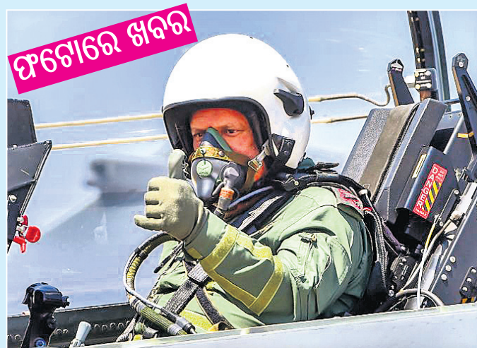
ଦେଶାନ୍ତରୁ ଦେଖାଯାଉଥିବା ଏହା ଲକ୍ଷଣ ୨୦୧୯ର ଦ୍ୱାଦଶ ସଂସ୍କରଣର ଦ୍ୱିତୀୟ ଦିନରେ ଗୁରୁତାର ମୁକ୍ତିଦାନ 'ଚେକ୍‌ଏ'ରେ ଉଡ଼ାଣ ଆରମ୍ଭ ପୂର୍ବରୁ ପ୍ରକାଶିତ । ମୁଖ୍ୟ କେନ୍ଦ୍ରରାଜ୍ୟ ବିପିନ ରାଓଙ୍କୁ ।

ନୂଆଦିଲ୍ଲୀ, ୨୧୧୨ (ପି.ଟି.)-ତହଲ ତିନି ତଲାଇ ପ୍ରଥମ ଚକ୍ରମୟ ଅପରାଧ କରିବା ଲାଗି ଅଣାଯାଇଥିବା ଅଧାଦେଶ ଗୁରୁତାର ତୃତୀୟ ଥର ପାଇଁ ଜାରି କରାଯାଇଛି । ରାଷ୍ଟ୍ରପତି ରାମନାଥ କୋବିନ୍ଦ ମୁସଲମାନ ମହିଲା (ବିବାହ ଅଧିକାର ସୁରକ୍ଷା) ଅଧାଦେଶକୁ ସ୍ୱୀକୃତି ଦେଉଥିବା ଆରମ୍ଭ ମନ୍ତ୍ରଣାଳୟ ପକ୍ଷରୁ କୁହାଯାଇଛି । ଅଧାଦେଶ ପୁନର୍ବାର ଜାରି କରିବା ଲାଗି ଗତ ମଙ୍ଗଳବାର କେନ୍ଦ୍ର କ୍ୟାବିନେଟ ନିଷ୍ପତ୍ତି ନେଇଥିଲା । ତିନି ତଲାଇ ବିଲ୍ ଲୋକ ସଭାରେ ଗୃହୀତ ହୋଇ ରାଜ୍ୟ ସଭାରେ ବିଚାରାଧୀନ ରହିଛି । କୁନ୍ ମାରେ ଲୋକ ସଭା କାର୍ଯ୍ୟକାଳ ଶେଷ ହେବାକୁ ଯାଉଥିବାରୁ ଉକ୍ତ ବିଲ୍ ଗତ ହୋଇଯିବ । ତହଲ ତିନି ତଲାଇ ଦେଇ ସ୍ୱାକ୍ଷର ହେଉଥିବା ମୁସଲମାନ ପୁରୁଷଙ୍କ ପାଇଁ ବିଲ୍ରେ ୩ ବର୍ଷ ଜେଲଦଣ୍ଡ ବ୍ୟବସ୍ଥା ରହିଛି ।