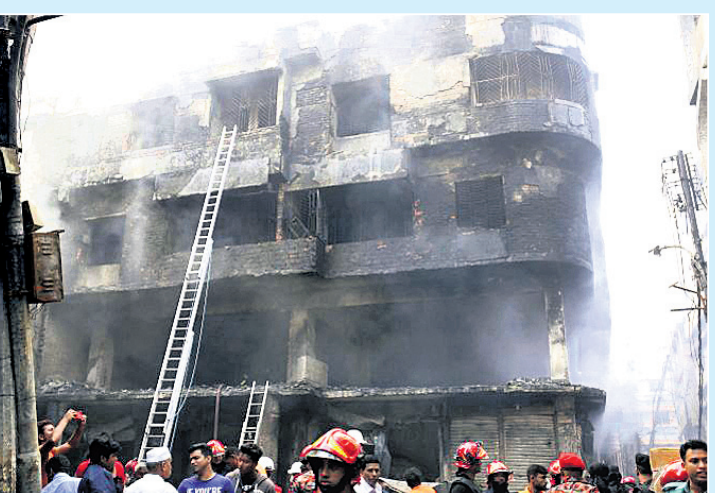
ବାଂଲାଦେଶ ରାଜଧାନୀ ଡାକାସ୍ଥିତ ବୈଦ୍ୟବିଦ୍ୟାଳୟ ଅଞ୍ଚଳରେ ବୁଧବାର ରାତିରେ ଭୟାବହ ଅଗ୍ନିକାଣ୍ଡ ଘଟି ୮୧ ଜଣଙ୍କ ଜୀବନ ଯାଇଛି । ନିର୍ମାଣ ଲାଗିଥିବା ଏକ କୋଠା ଗାଡ଼ିପଡ଼େ ଗୁରୁତାର ସକାଳେ ଅଗ୍ନିଶମ ବାହିନୀ ।