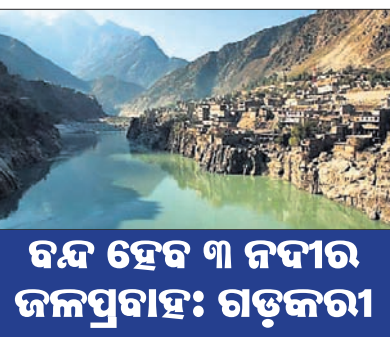
ବନ୍ଦ ହେବ ୩ ନଦୀର ଜଳପ୍ରବାହ: ଗଡ଼କରା

ଭାରତ ସିନ୍ଧୁ ନଦୀ ଜଳରେ ନିଜ ଭାଗକୁ ପାକିସ୍ତାନକୁ ବେହିରିବାକୁ ଦେବ ନାହିଁ ବୋଲି ଗୁରୁତାର ଘୋଷଣା କରିଛନ୍ତି । ପାକିସ୍ତାନକୁ ବେହିରିବାପାଇଁ ନଦୀଜଳର ଭାରତୀୟ ଭାଗକୁ ରୋକିବା ଲାଗି ସରକାର ନିଷ୍ପତ୍ତି ନେଇଥିବା ଜଣାପଡ଼ିଛି । ମହା ନାଟ୍ୟ ଗଡ଼କରା କହିଛନ୍ତି । ସିନ୍ଧୁ ନଦୀ ଜଳକୁ ନାନା ଅନୁଯାୟୀ ଏହାପାଇଁ ପାକିସ୍ତାନ ଭାଗ ଜଳ ପ୍ରଭାବିତ ହେବନାହିଁ । ପୂର୍ଣ୍ଣାଙ୍ଗରେ ପ୍ରସାରିତ ସିନ୍ଧୁ ଶାଖା ନଦୀ ରାଜି, ବେଆସ ଏବଂ ସତ୍‌ଲେଜ ଜଳ ସ୍ରୋତର ଦିଗ ପରିବର୍ତ୍ତନ କରି ଏହାକୁ ଜଳ-କମ୍ପାର ଏବଂ ପଞ୍ଜାବ ଲୋକଙ୍କ ବ୍ୟବହାର ପାଇଁ ଛଡ଼ାଯିବ । ପୁଲଫୁଲ ଆକ୍ରମଣ ପରେ ପାକିସ୍ତାନକୁ ନଦୀଜଳ ପ୍ରସାଦ ବନ୍ଦ କରିବା ଲାଗି ଦାବି ହୋଇଥିଲା । ରାଜି ନଦୀର ଶାହପୁର-