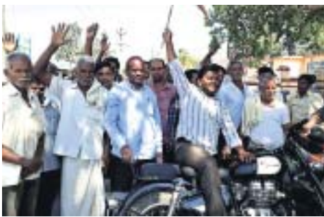
ପାରଳାଖେମୁଣ୍ଡିରେ କୃଷକ ସଂଗଠନ ପକ୍ଷରୁ ପିକେଟିଂ କରାଯାଇଛି । ବନ୍ଦ ଯୋଗୁ ପାରଳାଖେମୁଣ୍ଡି ବସଷ୍ଟାଣ୍ଡରେ ବସ୍ତୁତ୍ତିକ ଅଟକି ରହିଛି । କାଶୀନଗରଠାରେ ରାତ୍ରୀ ଅବରୋଧ କରାଯାଇଛି ।