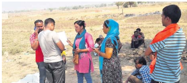
ମୃତଦେହ ଉଦ୍ଧାର ପରେ ଘଟଣାର ତଦନ୍ତ ଚାଲିଛି । ନାବାଳିକା ଜଣଙ୍କ ମୃତଦେହ ଏକ ପୋଲିସ ମୃତଦେହ ଉଦ୍ଧାର କରି ନିର୍ମାଣାଧୀନ ପାଇଖାନା ଚାକିରେ ବ୍ୟବହୃତ ପାଇଁ ପଠାଇବା ସହ ଏକ ପଡ଼ିଥିବା ଦେଖିବାକୁ ମିଳିଥିଲା । ଅପମୃତ୍ୟୁ ମାମଲା ରୁଜୁ କରିଛି ।