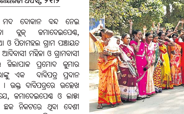
ଦାବିପତ୍ର ପ୍ରଦାନ କରିବାକୁ ଆସିଥିବା ଗ୍ରାମବାସୀ ।

ଦେଶୀ ମଦ ଦୋକାନ ବନ୍ଦ ନେଇ ରାୟଗଡ଼ା ରୁକ୍ମିଣୀ ହେବ ରହି ଆସୁଥିଲେ ମଧ୍ୟ ଘର ପତ୍ତା ମିଳି ପାରିନାହିଁ ।