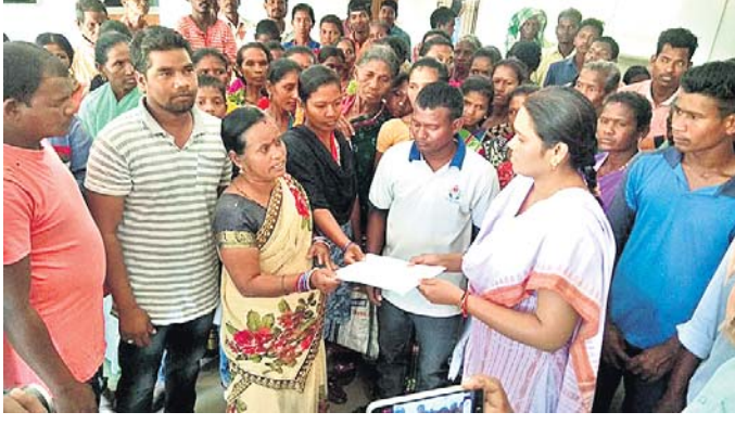
ଚଳକ୍ୟା ଗ୍ରାମବାସୀ ସହକାରୀ ଜିଲାପାଳଙ୍କୁ ଦାବିପତ୍ର ପ୍ରଦାନ କରୁଛନ୍ତି ।

ରାୟଗଡ଼ା ଜିଲାର ବିଭିନ୍ନ ସ୍ଥାନରେ ନବନିର୍ମିତ କୃଷକ ସଂଘ ତରଫରୁ ଗୁଣପୁର ବନ୍ଦ ପାଳନ କରାଯାଇଛି ।