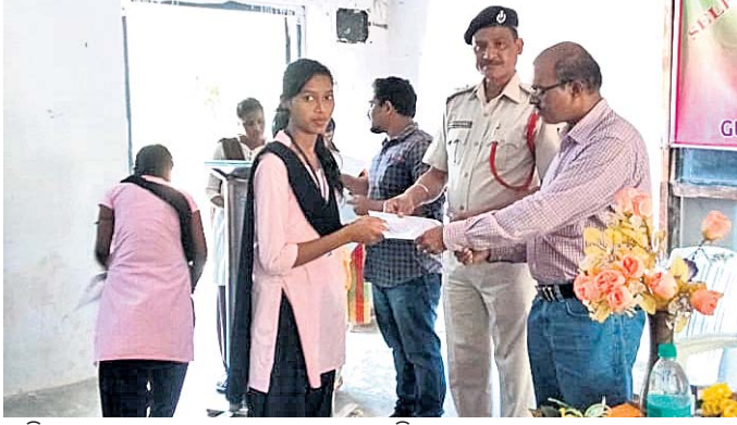
ତାଲିମପ୍ରାପ୍ତ ଛାତ୍ରାଙ୍କୁ ମାନପତ୍ର ପ୍ରଦାନ କରାଯାଇଛି ।

ରାୟଗଡ଼ା ଜିଲା ରାମନାଗୁଡ଼ା ରୁକ୍ମିଣୀ ହେବ ରହି ଆସୁଥିଲେ ମଧ୍ୟ ଘର ପତ୍ତା ମିଳି ପାରିନାହିଁ ।