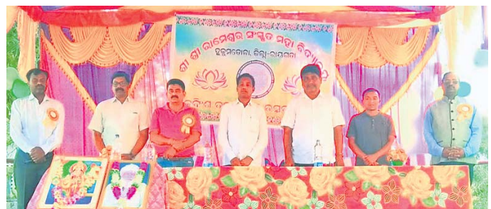
କାର୍ଯ୍ୟକ୍ରମରେ ଯୋଗ ଦେଇଥିବା ଅତିଥିମାନେ ।

ରାୟଗଡ଼ା ଜିଲା ମୁନିଗୁଡ଼ା ନିକଟସ୍ଥ ଭୂକ୍ରମତୋଳାଠାରେ ଥିବା ସଂସ୍କୃତ ମହାବିଦ୍ୟାଳୟର ବାର୍ଷିକ ଉତ୍ସବ ଅନୁଷ୍ଠିତ ହୋଇଯାଇଛି ।