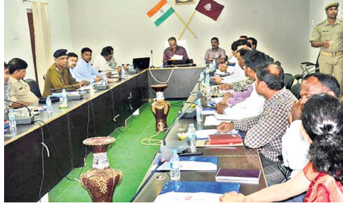
ମିଳିତ ବୈଠକରେ ପୋଲିସ ଅଧିକାରୀମାନେ ।

ଓଡ଼ିଶା, ଛତିଶଗଡ଼ ଓ ଆନ୍ଧ୍ରପ୍ରଦେଶର ୧୬ଟି ଜିଲ୍ଲା ଏସ୍‌ପିମାନଙ୍କୁ ନେଇ ଗୁରୁବାର କୋରାପୁଟରେ ଏକ ସମନ୍ୱୟ ବୈଠକ ଅନୁଷ୍ଠିତ ହୋଇଛି । ଏସ୍‌ପିମାନଙ୍କୁ ନେଇ ଗୁରୁବାର କୋରାପୁଟରେ ଏକ ସମନ୍ୱୟ ବୈଠକ ଅନୁଷ୍ଠିତ ହୋଇଛି । ଏସ୍‌ପିମାନଙ୍କୁ ନେଇ ଗୁରୁବାର କୋରାପୁଟରେ ଏକ ସମନ୍ୱୟ ବୈଠକ ଅନୁଷ୍ଠିତ ହୋଇଛି ।