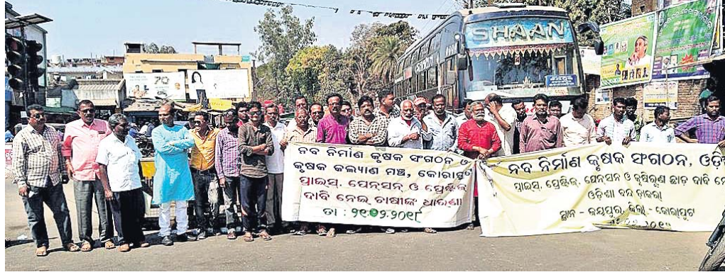
ଜୟପୁରରେ ୨୬ଟି ଜାତୀୟ ରାଜପଥ ଅବରୋଧ କରାଯାଇଛି ।

ଜୟପୁର/କୁନ୍ତୁରା/କୋରାପୁଟ, ୨୧୨ (ନି.ପ୍ର./ଡି.ଏନ୍.ଏ./ସ୍ୱ.ପ୍ର.)