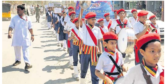
ଓଡ଼ିଆ ଭାଷାରେ ଭୂରକ୍ଷା ଏବଂ ପ୍ରଚାର ନେଇ ଗୁଣପୁରରେ ସଚେତନତା ଶୋଭାଯାତ୍ରା ।

ଗୁଣପୁର ସରକାରୀ ଶିଶୁବିଦ୍ୟାଳୟର ପିଲାମାନଙ୍କୁ ନିଜର ମାତୃଭାଷା ବିଷୟ ପାଳିତ ହୋଇଛି ।