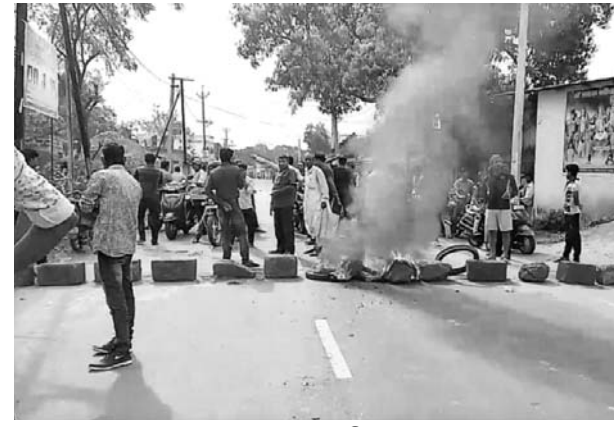
ଆନ୍ଦୋଳନକାରୀ ରାଜପଥ ଅବରୋଧ କରୁଛନ୍ତି।