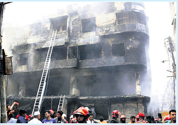
ବାଂଲାଦେଶର ଚାନ୍ଦିଆ ନଦୀ ତୀରରେ ଆତଙ୍କିତ ଦୁର୍ଘଟଣାର ଗୁରୁତାର ଉଦ୍ଧାରକାରୀ ଆତଙ୍କିତ ଗଣେଶଙ୍କ ପୁଅ କୋଠା ତଳରେ ଗୁରୁତାର ସହାୟକ ଆତଙ୍କିତ ହେଲେ ।