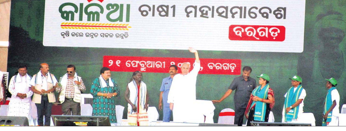
ବରଗଡ଼ ଚାଷୀ ସମାବେଶରେ ମୁଖ୍ୟମନ୍ତ୍ରୀ ନବୀନ ପଟ୍ଟନାୟକ ଓ ଅନ୍ୟମାନେ ।