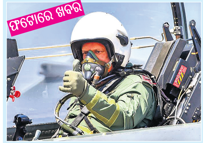
ଦେଶାନ୍ତରେ ତଳିଥିବା ଏହା ଲକ୍ଷିଆ ୨୦୧୯ର ଦ୍ୱାଦଶ ସଂସ୍କରଣର ବିତରଣ ଦିନରେ ଗୁରୁତାର ଯୁକ୍ତବିମାନ 'ଚେକର୍'ରେ ଉଡ଼ାଣ ଆରମ୍ଭ ପୂର୍ବରୁ ସୁରକ୍ଷିତ ମୁଖ୍ୟ କେନ୍ଦ୍ରରୁ ବିଦାନ ରାଫୁ ।

୧୫୮ ଫେବୃୟାରୀ ୨୨ରେ ଜଳିତ ଓ ସିରିଶା ମିଶ୍ରଙ୍କ ଘଟଣା ଯୁଗାନ୍ତରେ ଆରମ୍ଭ ହେବା ପରେ ସମାଜରେ ୧୯୫୮ରୁ ୧୯୭୧ ମଧ୍ୟରେ ମଧ୍ୟପ୍ରାନ୍ତରେ ଯୁଗାନ୍ତରେ ଆରମ୍ଭ ହେବାକୁ ଥିଲା ଏକ ସାହିତ୍ୟିକ ଗାଳ୍ପିକ ପ୍ରଥମେ ଜଳିତ ଓ ସିରିଶା ମଧ୍ୟରେ ରାଜନୈତିକ ମିଶ୍ରଣ ହୋଇଥିଲା । ୧୯୭୧ରେ ସିରିଶା ଏହି ମିଶ୍ରଙ୍କୁ ବାହାରି ଆସିଥିଲେ ବି ଜଳିତ ୧୯୭୧ ପର୍ଯ୍ୟନ୍ତ ଯୁଗାନ୍ତରେ ଆରମ୍ଭ ହେବାକୁ ଲାଗି ପରିଚିତ ଥିଲା । ୨୦୧୨ ଫେବୃୟାରୀ ୨୨ରେ ଆର୍ଜେଣ୍ଟିନାର କୁସନୁ ଏୟାର୍ସରେ ଗ୍ରେନ୍ ସୁଇଫ୍ଟର ଯୋଗୁ ୫୯ଜଣଙ୍କ ମୃତ୍ୟୁ ଘଟିଥିବା ବେଳେ ୨୦୦ ଆହତ ହୋଇଥିଲେ । କୁସନୁ ଏୟାର୍ସ ହେଉଛି ଆର୍ଜେଣ୍ଟିନାର ରାଜଧାନୀ ତଥା ସର୍ବବୃହତ୍ ନଗର । ସ୍ଥାନୀୟ ଭାଷାରେ କୁସନୁ ଏୟାର୍ସ ଅର୍ଥ ସୁନର ସହର । ଉକ୍ତ ନଗରୀ ରିଡ-ଟି-ଲ-ପୁରୀ ନଦୀର ପଶ୍ଚିମ ଚେର ଅବସ୍ଥିତ ।