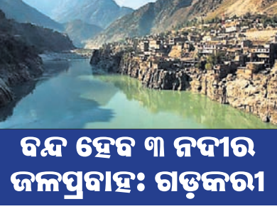
ବନ୍ଦ ହେବ ୩ ନଦୀର ଜଳପ୍ରବାହ: ଗଡ଼କରୀ

ନୂଆଦିଲ୍ଲୀ, ୨୧।୨ ଭାରତ ସିନ୍ଧୁ ନଦୀ ଜଳରେ ନିଜ ଭାଗକୁ ପାକିସ୍ତାନକୁ ଦେଇଦିବାକୁ ଦେବ ନାହିଁ ବୋଲି ଗୁରୁତାର ଘୋଷଣା କରିଛନ୍ତି । ପାକିସ୍ତାନକୁ ଦେଇଦିଆଯିବ ନଦୀଜଳର ଭାରତୀୟ ଭାଗକୁ ରୋକିବା ଲାଗି ସରକାର ନିଷ୍ପତ୍ତି ନେଇଥିବା ଜଣାପଡ଼ିଛି । ସିନ୍ଧୁ ନଦୀର ଜଳ ପ୍ରଦାନକୁ ଉପରେ ଭାରତର ପୂର୍ଣ୍ଣ ଅଧିକାର ରହିଥିଲେବେଳେ ତେନାହିଁ, ହେଲେ ୧୭ ସିନ୍ଧୁ ନଦୀଜଳ ଉପରେ ପାକିସ୍ତାନର ଅଧିକାର ପୂର୍ଣ୍ଣ ପ୍ରାପ୍ତ ହେବାକୁ ବାଧ୍ୟ ହେବାକୁ ପଡ଼ିବ ବୋଲି ଭାରତୀୟ ସରକାରୀ ସମ୍ବାଦକର୍ତ୍ତା କହିଛନ୍ତି ।