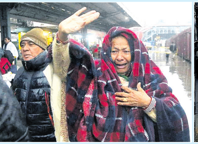
ପୂଜାପାଳୀ ଆକ୍ରମଣ ପରେ ବୁଲ ପଡ଼ିବା ପରେ ଉଦ୍ଧାରକାରୀ ଲୋକେ ଗୁରୁତାର ଜଣେ ପାକିସ୍ତାନୀ ମହିଳା ସମସ୍ତେ ଆତଙ୍କିତ ହୋଇ ଉପାଧିବିଧିରେ ତାଙ୍କୁ ସଫଳତାପୂର୍ବକ ଭାବରେ ଆପଣେଇ ପାଇଁ ସମ୍ପୂର୍ଣ୍ଣ ଉପାଧି ଦେବାକୁ କୁହୁଛନ୍ତି ।