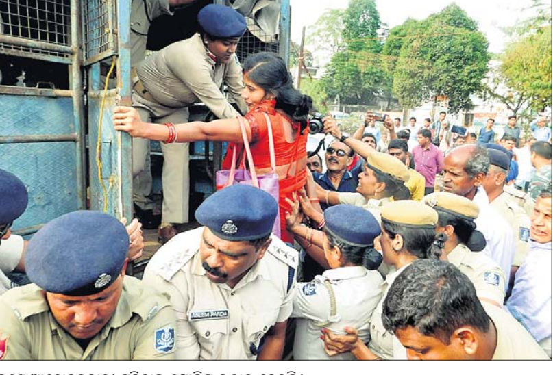
ଜଣେ ଆନ୍ଦୋଳନକାରୀ ମହିଳାଙ୍କୁ ପୋଲିସ୍ ଉଠାଇ ନେଇଛି ।