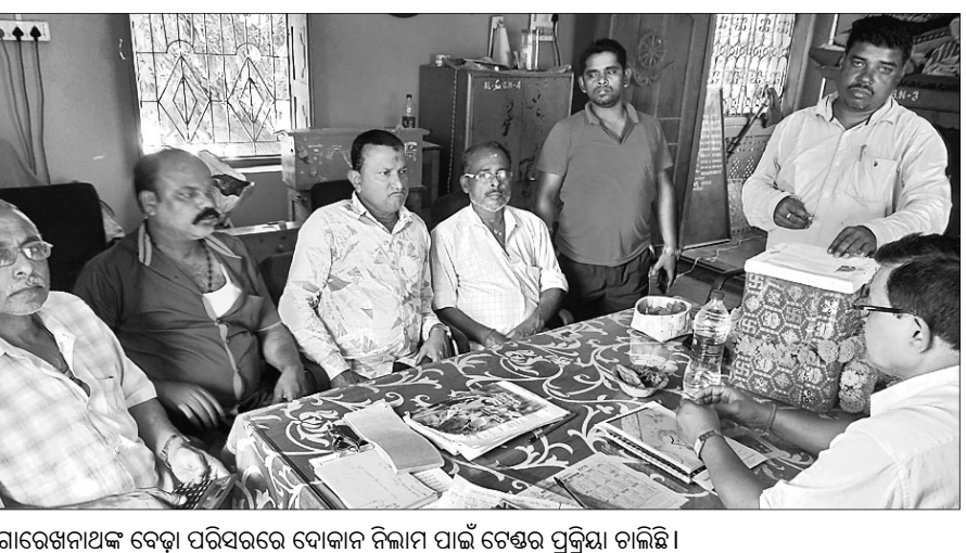
ଗୋରେଖନାଥଙ୍କ ବେଢ଼ା ପରିସରରେ ଦୋକାନ ନିଲାମ ପାଇଁ ଚେଣ୍ଡର ପ୍ରକ୍ରିୟା ଚାଲିଛି।

ରଘୁନାଥପୁର, ୨୧।୨ (ଡି.ଏନ.ଏ.): ଗୋରେଖନାଥ ଗ୍ରନ୍ଥ ବୋର୍ଡ ପକ୍ଷରୁ ଗୁରୁବାର ବେଢ଼ା ଭିତରେ ଥିବା ବିଭିନ୍ନ ଦୋକାନର ନିଲାମ କରାଯାଇଥିଲା।