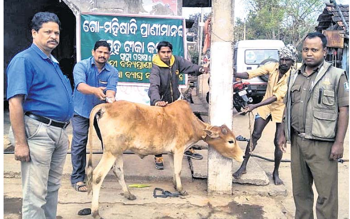
ଗୁହପାଳିତ ପ୍ରାଣୀଙ୍କୁ ଟିକା ଦିଆଯାଇଛି।

ମହାନଦୀ ବନ୍ୟପ୍ରାଣୀ ବନଖଣ୍ଡ, ନୟାଗଡ଼ ଅଧୀନ ଛାପୁଣ୍ଡିଆ ବନ୍ୟପ୍ରାଣୀ ବନାଞ୍ଚଳରେ ଗୁହପାଳିତ ପ୍ରାଣୀଙ୍କ ଟିକାକରଣ କାର୍ଯ୍ୟକ୍ରମ ଆରମ୍ଭ ହୋଇଛି।