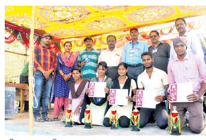
ଅଧ୍ୟାପକ ସହ ଚାମ୍ପିୟନ ହୋଇଥିବା ଛାତ୍ରଛାତ୍ରୀ ବାର୍ଷିକ ବିବରଣୀ ପାଠ କରିଥିଲେ।

ନୟାଗଡ଼ ଜିଲ୍ଲା ଶରଣକୁଳ ମହାବିଦ୍ୟାଳୟ କ୍ରୀଡ଼ା ସଂସଦର ୨୭ତମ ବାର୍ଷିକ କ୍ରୀଡ଼ା ଉତ୍ସବ ଗୁରୁବାର ଉଦ୍‌ଘାଟିତ ହୋଇଯାଇଛି।