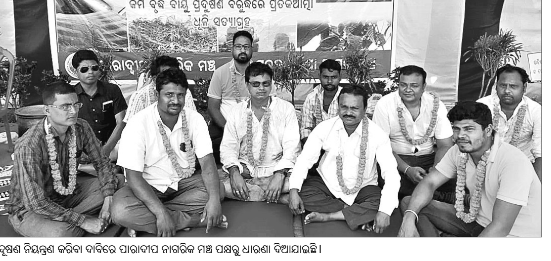
ପ୍ରଦୂଷଣ ନିୟନ୍ତ୍ରଣ କରିବା ଦାବିରେ ପାରାଦୀପ ନାଗରିକ ମଞ୍ଚ ପକ୍ଷରୁ ଧାରଣା ଦିଆଯାଇଛି।

ପାରାଦୀପ, ୨୧।୨ (ସ୍ୱ.ପ୍ର.): ପାରାଦୀପରେ ଅତ୍ୟଧିକ ପ୍ରଦୂଷଣକୁ ନିୟନ୍ତ୍ରଣ କରିବା ଦାବିରେ ପାରାଦୀପ ନାଗରିକ ମଞ୍ଚ ପକ୍ଷରୁ ରୁଧିରାଠାରୁ ଅହୋରାତ୍ର ଧାରଣା ଚାଲିଛି।