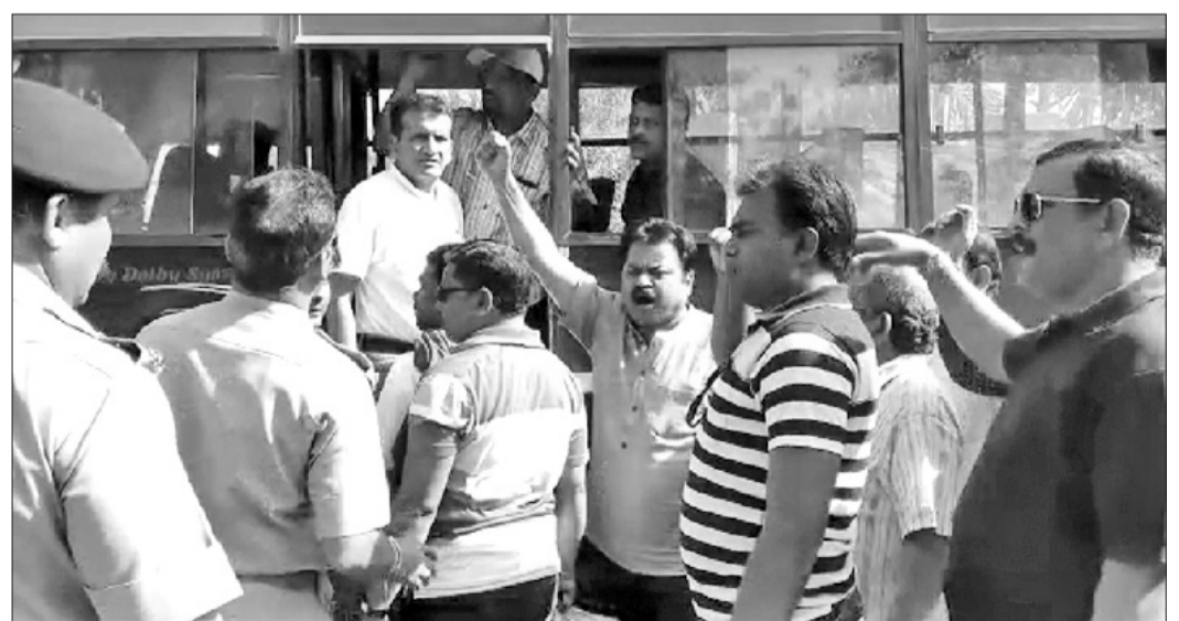
ଧାରଣାକାରୀଙ୍କୁ ପୋଲିସ୍ ଉଠାଇ ନେଇଛି।

ବରଗଡ଼ ଜିଲ୍ଲାରେ କ୍ୟାନ୍‌ସର ହସ୍ତିତାଳ ଦାବି ଆନ୍ଦୋଳନ ଉଚ୍ଚରୁପ ନେଇଛି। ଏହି କ୍ରମରେ ଗୁରୁବାର ଫୋରମ୍ ଫର୍ କ୍ୟାନ୍‌ସର ହସ୍ତିତାଳ ଆର୍ ବରଗଡ଼ ପକ୍ଷରୁ ସ୍ଥାନୀୟ ଗାନ୍ଧୀ ମୂର୍ତ୍ତି ତଳେ ଧାରଣା ବିଆଯାଇଥିଲା।