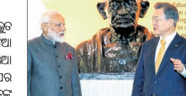
ସମ୍ପୂର୍ଣ୍ଣ ଆରୋଗ୍ୟପାଇଁ ବୋଲି ପୁନଃ ଆଶାବ୍ୟକ୍ତ କରିଛନ୍ତି। ପ୍ରଧାନମନ୍ତ୍ରୀ ଦକ୍ଷିଣ କୋରିଆ ବ୍ୟବସାୟୀମାନଙ୍କୁ ଭାରତରେ ପୁଞ୍ଜିନିବେଶ ଲାଗି ଆହ୍ଵାନ ଦେଇଥିଲେ।

ମଧ୍ୟରେ ରାଜନୀତିକ ସମ୍ପର୍କକୁ ମଜବୁତ କରିବା ଲାଗି ମୋଦି ସେଠାକୁ ପୁଲଫ୍ରିମା ଗସ୍ତରେ ଯାଇଛନ୍ତି। ସେ ଦକ୍ଷିଣ କୋରିଆ ରାଷ୍ଟ୍ରପତି ପୁନ୍ ଜାଏ-ଇନ ଏବଂ ଜାତିସଂଘର ପୂର୍ବତନ ମହାସଚିବ ବାନ୍ କି-ମୁନ୍‌ଙ୍କ ସହ ସେୟାନସେଇ ବିଶ୍ଵବିଦ୍ୟାଳୟରେ ଉଦ୍‌ଘାଟନା କରାଯାଇଥିବା ପ୍ରତିମୂର୍ତ୍ତି ଅନାବରଣ କରିଥିଲେ। ଗାନ୍ଧୀଜୀଙ୍କ ଚିନ୍ତାଧାରା ଏହିଆ ଏବଂ ଏହିଆ ବାହାରେ ଶାନ୍ତି ଏବଂ