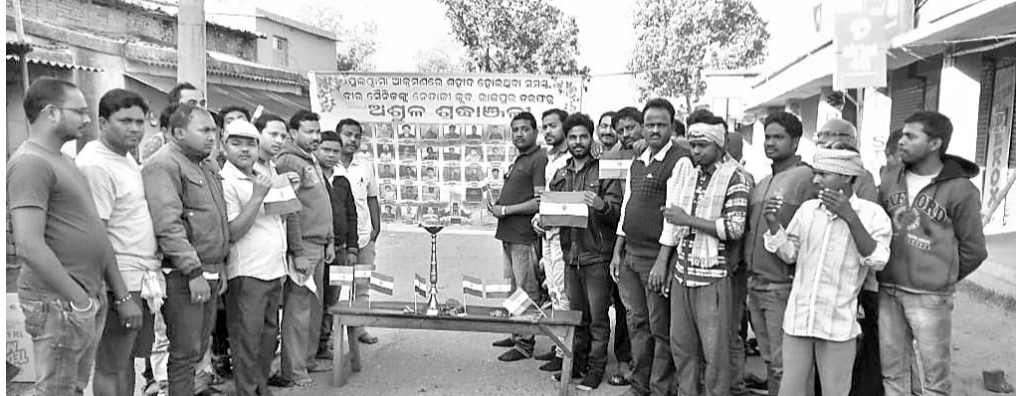
ଶହାଦ ଯବାନଙ୍କ ପତୋତ୍ତିରୁରେ ମାଲ୍ୟାପର୍ଣା କରାଯାଇଛି।

ଭାରତ ସମିତିଧାର ଧାରା ୩୭୦ ଉଲ୍ଲେଦ କରିବା ପାଇଁ ଜିଲ୍ଲାପାଳଙ୍କୁ ଜରିଆରେ ରାଜ୍ୟପାଳଙ୍କ ଉଦ୍ଦେଶ୍ୟରେ ଏକ ଦାବିପତ୍ର ପ୍ରଦାନ କରିଛନ୍ତି ରାଜପୁର ପଞ୍ଚାୟତର ନେତାଜୀ କୁନ୍ଦ ଓ ବ୍ୟବସାୟୀ ସଂଘର ଶତାଧିକ ସଦସ୍ୟ। ୪୧୨ଜଣ ସଦସ୍ୟ ସାକ୍ଷରିତ କରି ଏହି ସ୍ମାରକପତ୍ର ପ୍ରଦାନ କରିଛନ୍ତି। ସମିତିଧାର ଧାରା ୩୭୦ ଲାଗି କର୍ମରେ ଆତଙ୍କବାଦୀମାନେ ତିଷ୍ଠି ରହି ସେନା ସହିତ ନୀରବ ଜନତାଙ୍କ ଉପରେ ଆକ୍ରମଣ କରି ଅନାୟାସରେ ବନ୍ଦି ଯାଉଛନ୍ତି। ଏହି ଧାରାକୁ ଉଲ୍ଲେଦ କରିବା ଦ୍ୱାରା ସେନା ସକ୍ରିୟ ହୋଇ ପୂର୍ଣ୍ଣ ସ୍ୱାଧୀନତା ସହିତ କାର୍ଯ୍ୟକରି