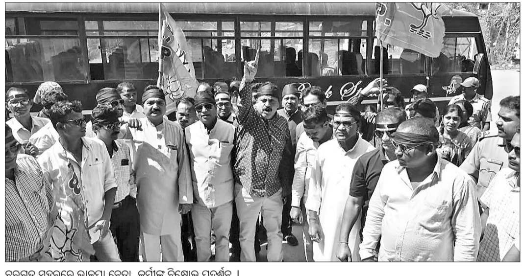
ବରଗଡ଼ ସହରରେ ଭାଜପା ନେତା, କର୍ମୀଙ୍କ ବିକ୍ଷୋଭ ପ୍ରଦର୍ଶନ।

ବରଗଡ଼ ଜିଲ୍ଲା ସୋହେଲ୍ ବୁକ୍ ଆଧାର ଲଢ଼ାପାଲିରେ ଗୁରୁବାର ମୁଖ୍ୟମନ୍ତ୍ରୀ ନବୀନ ପଟ୍ଟନାୟକଙ୍କ କାର୍ଯ୍ୟକ୍ରମ ରହିଥିଲା।