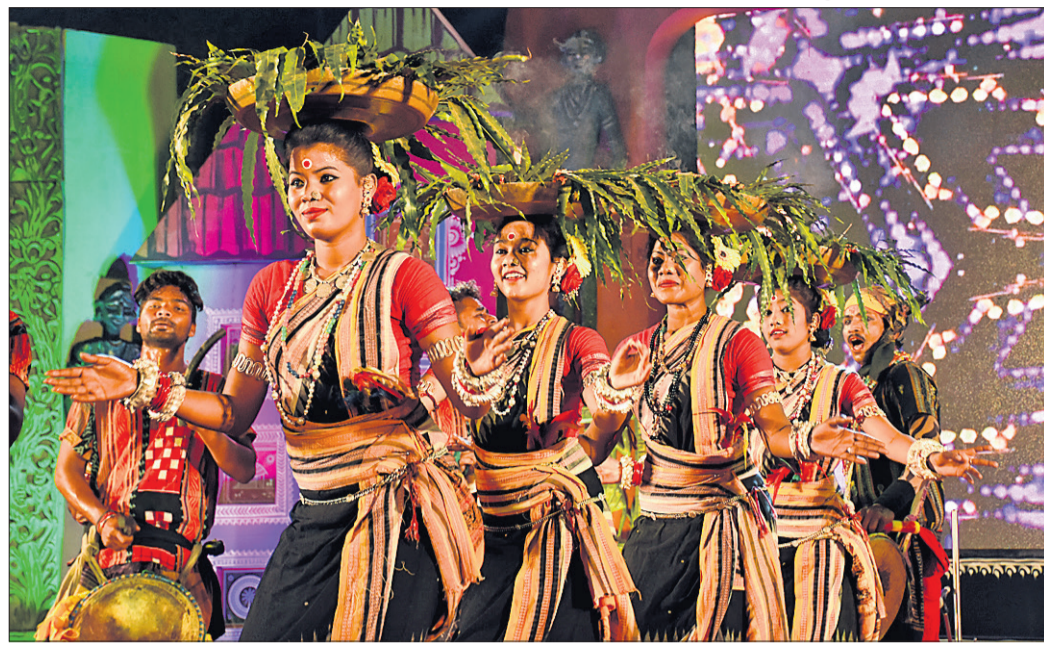
ରାଜ୍ୟସ୍ତରୀୟ ଲୋକକଳା ମହୋତ୍ସବର ଉଦ୍‌ଘାଟନା ସମ୍ବନ୍ଧରେ ପରିବେଷିତ ସଂସ୍କୃତିକ କାର୍ଯ୍ୟକ୍ରମ।

ଭୁବନେଶ୍ୱର, ୨୧.୧୨ (ଭୁବନେ): କଳା ଏକତାର ମନୁ ଦେଇଥାଏ। କଳାରେ କାଳି, ଧର୍ମ ଓ ଭାଷାର ବିଭେଦ ନ ଥାଏ। କଳା ଜରିଆରେ ସାମାଜିକ ପରିବର୍ତ୍ତନ ଆସିପାରିବ। ଓଡ଼ିଶା କଳାର ଭୂମି। ଆମର ନୃତ୍ୟ, ସଙ୍ଗୀତ ଓ ଲୋକକଳା ଆମ ସଂସ୍କୃତିକୁ ସମୃଦ୍ଧ କରିଛି। ଲୋକକଳା ପାଇଁ ଗୋଟିଏ ନିର୍ଦ୍ଦିଷ୍ଟ ଦିନକୁ ସମର୍ଥନ ଦେବାକୁ ପ୍ରତିବଦ୍ଧ ହୁଏ ୧୪ ତାରିଖକୁ ଲୋକକଳା ଦିବସ ଭାବେ ପାଳନ କରାଯିବ। ଗୁରୁବାର ଉତ୍କଳ ମହୋତ୍ସବ ଆୟୋଜିତ ନବୀନ ରାଜ୍ୟସ୍ତରୀୟ ଲୋକକଳା ମହୋତ୍ସବର ଉଦ୍‌ଘାଟନା ଦିବସରେ ଯୋଗଦେଇ ମୁଖ୍ୟମନ୍ତ୍ରୀ ନବୀନ ପଟ୍ଟନାୟକ ଆନୁଷ୍ଠାନିକ ଭାବେ 'ଲୋକକଳା ଦିବସ' ଘୋଷଣା କରିଛନ୍ତି। ଏଥିସହ ଏହି କାର୍ଯ୍ୟକ୍ରମର ଲୋଗୋ ମଧ୍ୟ ଉନ୍ମୋଚନ କରିଛନ୍ତି।