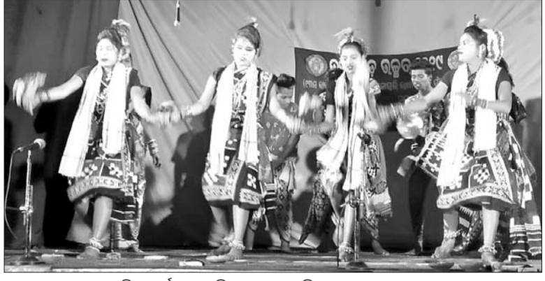
କଳାକାରମାନେ ସାଂସ୍କୃତିକ କାର୍ଯ୍ୟକ୍ରମ ପରିବେଷଣ କରୁଛନ୍ତି।

ବିଜେପୁର, ୨୧ ୧୯ (ଡି.ଏନ.ଏ.) ଭାଷା ଆନ୍ଦୋଳନରେ ନାଟକର ଭୂମିକା ଗୁରୁତ୍ୱପୂର୍ଣ୍ଣ ବୋଲି ଉତ୍ତାଳଗଡ଼ ନାଟ୍ ଉଚ୍ଛ୍ୱେଦ ୨୦୧୯ର ଉଦ୍‌ଯାପନୀ ଅବସରରେ ଅତିଥିମାନେ ନିବନ୍ଧ୍ୟ କରୁଛନ୍ତି।