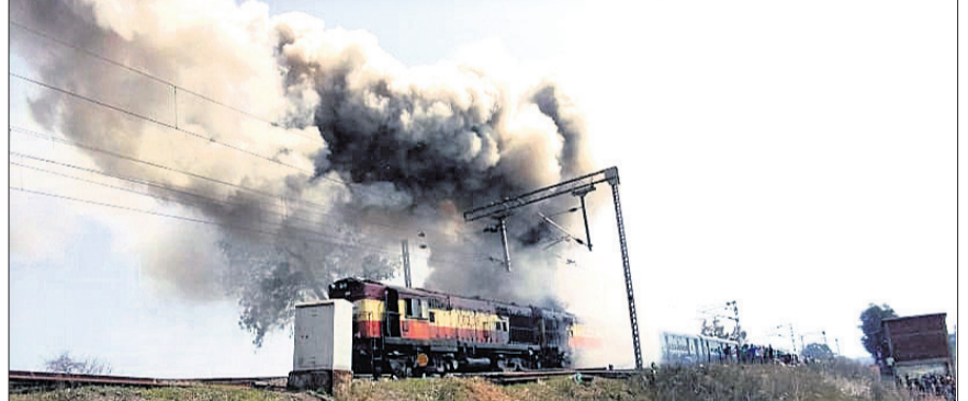
ଟ୍ରେନ ଇଞ୍ଜିନରୁ ବାହାରିଥିବା ଧୂଆଁ ।