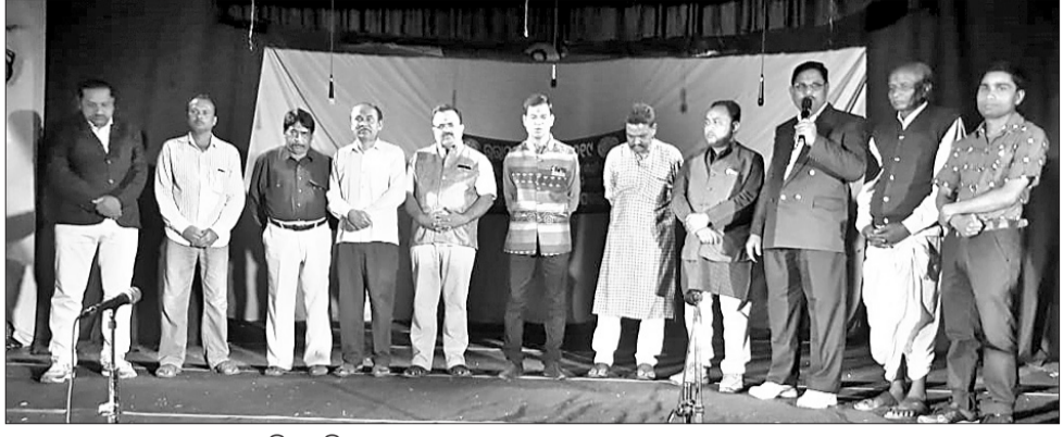
ଉଦ୍‌ଯାପନୀ ସମାବେଶରେ ଉପସ୍ଥିତ ଅତିଥିବୃନ୍ଦ।