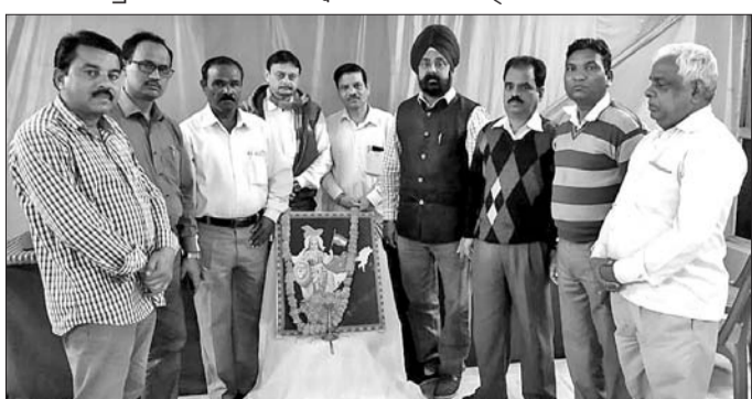
ଶହାଦତ୍ତଙ୍କ ସ୍ମୃତିରେ ଶ୍ରଦ୍ଧାଞ୍ଜଳି କରାଯାଇଛି।

ସଂସ୍କାର ଭାରତୀୟ ବରଗଡ଼ ଶାଖା ପକ୍ଷରୁ ପୁଲଖୀମା ଆଡ଼କବାଡ଼ା ଆକ୍ରମଣ ଘଟଣାର ଶହାଦତ୍ତଙ୍କ ଶ୍ରଦ୍ଧାଞ୍ଜଳି ଅର୍ପଣ କରାଯାଇଛି।