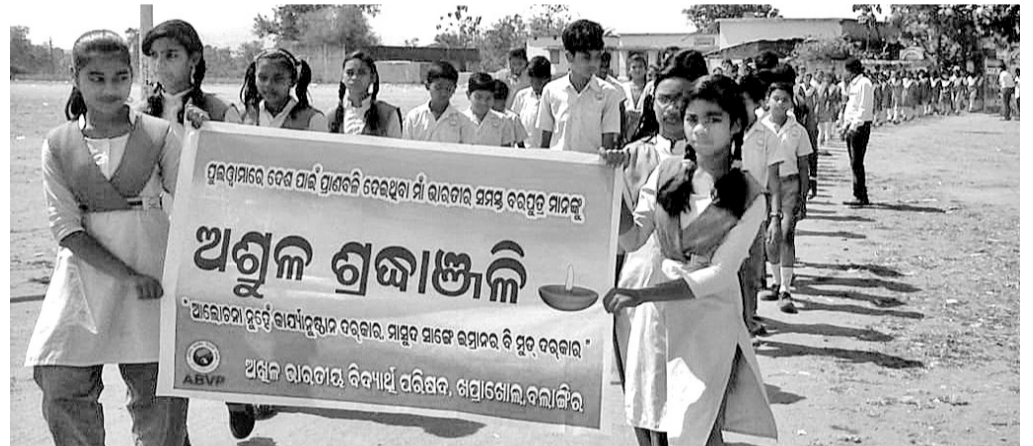
ପୁଲଝାମାରେ ଆତଙ୍କବାଦୀଙ୍କ ଆକ୍ରମଣରେ ଶହାଦତ୍ତ ସଭାନଙ୍କ ଉଦ୍ଦେଶ୍ୟରେ ଖପ୍ରାଖୋଲରେ ଛାତ୍ରାଛାତ୍ରୀଙ୍କ ନୀରବ ଶୋଭାଯାତ୍ରା।