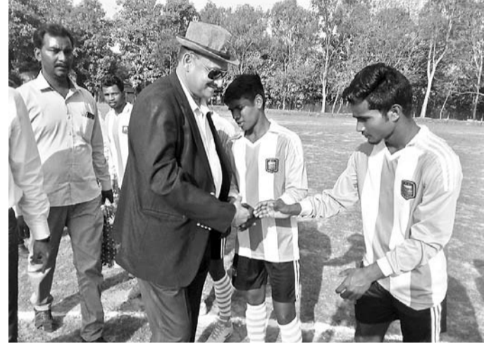
ଅଂଶଗ୍ରହଣକାରୀ ଦଳ ସହ ପରିଚିତ ହେଉଛନ୍ତି ଅତିଥି।