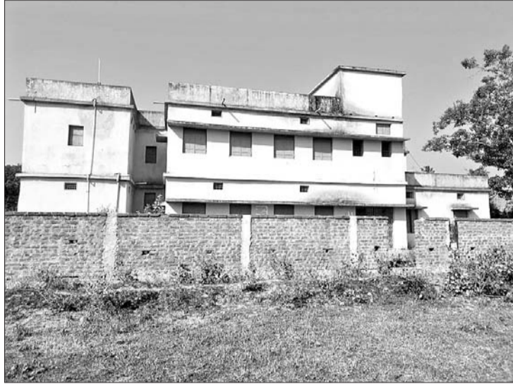
ନିର୍ମାଣଧୀନ ଆଦିବାସୀ ଛାତ୍ରା ନିବାସ। ହଷ୍ଟେଲରୁ ନିର୍ମାଣ କାର୍ଯ୍ୟକ୍ରମ କାର୍ଯ୍ୟକ୍ରମ ହୋଇନି କହିଥିଲେ।