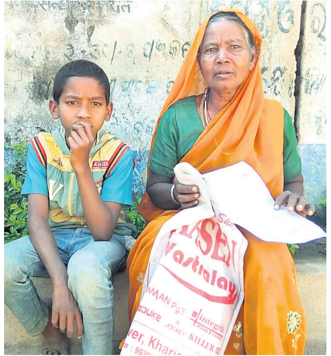
ଜେଜେମାଙ୍କ ନିକଟରେ ବସିଛନ୍ତି ଛତର ।

ହେଉଛି । ପାଠପଢ଼ା ପାଇଁ ଆନୁଷ୍ଠାନିକ ବ୍ୟବସ୍ଥା କ୍ରମାଗତରେ ଥିବା ଗ୍ରାମବାସୀ କହିଛନ୍ତି ।