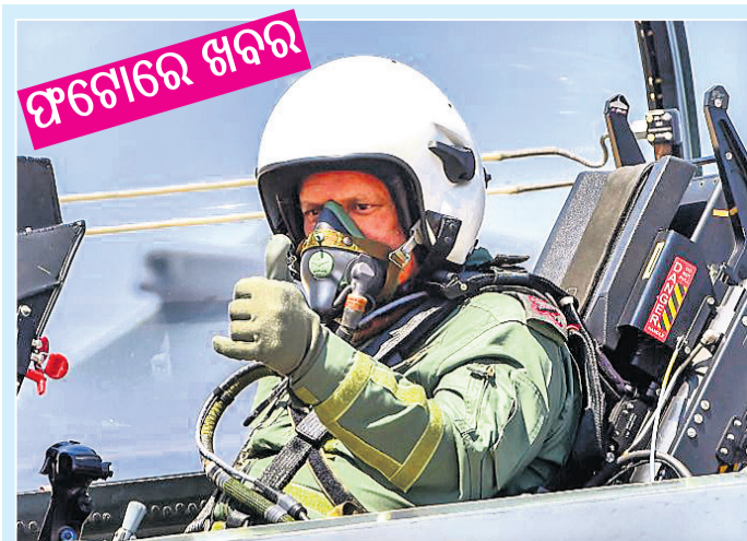
ଦେଲ୍‌ଲୀରୁ ଚାଲିଥିବା ଏବେ ଇଣ୍ଡିଆ ୨୦୧୯ର ବାଦଶବ୍ଦ ସଂସ୍କରଣର ଦ୍ଵିତୀୟ ଦିନରେ ଗୁରୁତର ମୁକ୍ତିଦାନ 'ଡେକ୍‌ସ୍'ରେ ଉଡ଼ାଣ ଆରମ୍ଭ ପୂର୍ବରୁ ସ୍ଥଳସେନା ମୁଖ୍ୟ କେନେରାଲ ବିପିନ ରାଓଙ୍କୁ।

ନୂଆଦିଲ୍ଲୀ, ୨୧।୨ (ପି.ଟି.)-ସୁନନ୍ଦା ମୃତ୍ୟୁ ମାମଲାରେ ଗୁରୁତର କଂଗ୍ରେସ ନେତା ଶଶୀ ଅରୁଣଙ୍କ ବିରୋଧରେ ଶୁଣାଣି ଥିବାବେଳେ ଏହାକୁ ଦିଲ୍ଲୀର ଏକ ଅଦାଲତ ମାର୍ଚ୍ଚ ୭ ପର୍ଯ୍ୟନ୍ତ ସ୍ଵୀକୃତି ରଖିଛନ୍ତି। ଅରୁଣ ବାହାରିନ ଏବଂ କାତାର ଭ୍ରମଣରେ ଯିବା ପାଇଁ ଆନେକନ କରିବାକୁ ଏହା ଉପରେ ଗୁରୁତର ଜବାବ ଦାଖଲ କରିବାକୁ ସ୍ଵତନ୍ତ୍ର ଭଳି ଅରୁଣ ଉତ୍ତରାଦିଲ୍ଲୀ ପୋଲିସକୁ ନିର୍ଦ୍ଦେଶ ଦେଇଛନ୍ତି। ଗତ ୪ ତାରିଖରେ ଅଦାଲତ ମାମଲାକୁ ସେସବୁ କୋର୍ଟକୁ ପଠାଇଥିଲେ। ପୂର୍ବତନ କେନ୍ଦ୍ରମନ୍ତ୍ରୀ ତଥା ସୁନନ୍ଦାଙ୍କ ସ୍ଵାମୀ ଅରୁଣଙ୍କ ବିରୋଧରେ ଆଇପିସିର ଧାରା ୪୮୮-କ ଏବଂ ୩୦୨ରେ ମାମଲା ଗୁରୁ ହୋଇଥିଲେ ମଧ୍ୟ ତାଙ୍କୁ ଏପର୍ଯ୍ୟନ୍ତ ଗିରଫ କରାଯାଇନାହିଁ। ୨୦୧୪ ଜାନୁୟାରୀ ୧୭ରେ ସୁନନ୍ଦାଙ୍କ ମୃତଦେହ ଦିଲ୍ଲୀର ଏକ ଲକ୍ଷ୍ମୀବା ହୋଟେଲ ସ୍ଵତନ୍ତ୍ର ସନ୍ଦେହଜନକ ଅବସ୍ଥାରେ ମିଳିଥିଲା।