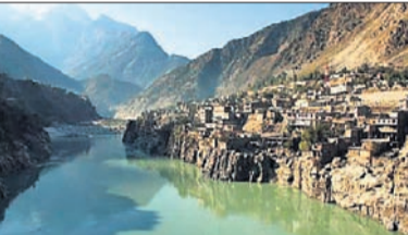
ବନ୍ଧ ହେବ ୩ ନଦୀର ଜଳସ୍ରାବ: ଗଡ଼କରୀ

ଭାରତ ସିନ୍ଧୁ ନଦୀ ଜଳରେ ନିଜ ଭାଗକୁ ପାକିସ୍ତାନକୁ ବୋଧିତ୍‌ବାକୁ ଦେବ ନାହିଁ ବୋଲି ଗୁରୁତର ଘୋଷଣା କରିଛି। ପାକିସ୍ତାନକୁ ବୋଧିତ୍‌ବାକୁ ନଦୀକଳର ଭାରତୀୟ ଭାଗକୁ ରୋକିବା ଲାଗି ସରକାର ନିଷ୍ପତ୍ତି ନେଇଥିବା ଜଣକସମ୍ପଦ ମନ୍ତ୍ରୀ ନାତାନ ଗଡ଼କରୀ କହିଛନ୍ତି। ସିନ୍ଧୁ ନଦୀ ଜଳ ରୁଜ୍‌ନାମା ଅନୁଯାୟୀ ଏହାସ୍ଵରା ପାକିସ୍ତାନ ଭାଗ ଜଳ ପ୍ରଭାବିତ ହେବନାହିଁ। ପୂର୍ବାଞ୍ଚକରେ ପ୍ରବାହିତ କରି ଏହାକୁ ଜମ୍ମୁ-କଶ୍ମୀର ଏବଂ ପଞ୍ଜାବ ଲୋକଙ୍କ ବ୍ୟବହାର ପାଇଁ ଛଡ଼ାଯିବ। ପୁଲଫ୍ରିମା ଆକ୍ରମଣ ପରେ ପାକିସ୍ତାନକୁ ନଦୀକଳ ପ୍ରବାହ ବନ୍ଦ କରିବା ଲାଗି ଦାବି ହୋଇଥିଲା। ରାଜି ନଦୀର ଶହସୂର-