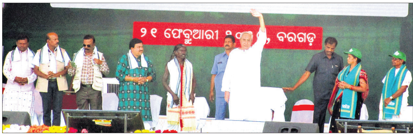
ବରଗଡ଼ ଚାଷୀ ସମାବେଶରେ ମୁଖ୍ୟମନ୍ତ୍ରୀ ନବୀନ ପଟ୍ଟନାୟକ ଓ ଅନ୍ୟମାନେ ।