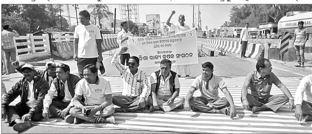
ରୋଜାଲିକାମୀ ଛକରେ ଚାଷୀ ପ୍ରତିନିଧିଙ୍କ ରାସ୍ତାରେ ବସିବା।

ନବନିର୍ମାଣ କୃଷକ ସଂଗଠନ ଆହ୍ୱାନ କ୍ରମେ ବିଆଯାଇଥିବା ବନ୍ଦ ଡାକରାର ପ୍ରଭାବ ଅତୀତରେ ବେଶ୍‌ବାଳୁ ମିଳିଥିଲା।