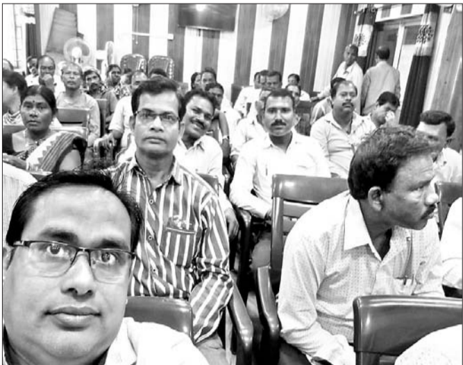
ବିଭିନ୍ନ ଦାବିକୁ ନେଇ ଆଲୋଚନା ବୈଠକରେ ପୌରପରିଷଦର ଅସ୍ଥାୟୀ କର୍ମଚାରୀ।