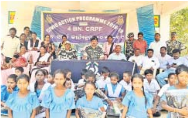
ଶିବିରରେ ଯୋଗ ଦେଇଥିବା ଅତିଥିଙ୍କ ସହ ଶିକ୍ଷୟିତ୍ରୀଶିକ୍ଷକ ଓ ଛାତ୍ରାଛାତ୍ରୀ ।