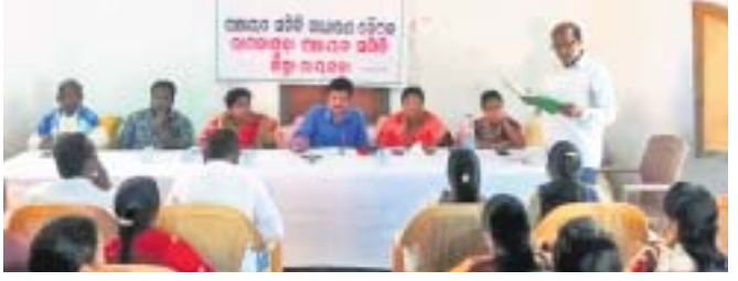
ବୈଠକରେ ଅଧିକାରୀ ଓ ଜନପ୍ରତିନିଧୀମାନେ ।

ରାଜସ୍ୱା ଜିଲ୍ଲା ରାମନାଗୁଡ଼ା ପଞ୍ଚାୟତ ସମିତି ସଭାଗୃହରେ ଚାଳିଥିବା ପଞ୍ଚାୟତ ସମିତି ବୈଠକରେ ପ୍ରାରମ୍ଭରୁ ଦେଖାଦେଇଥିଲା ହଳଗୋଳ ।