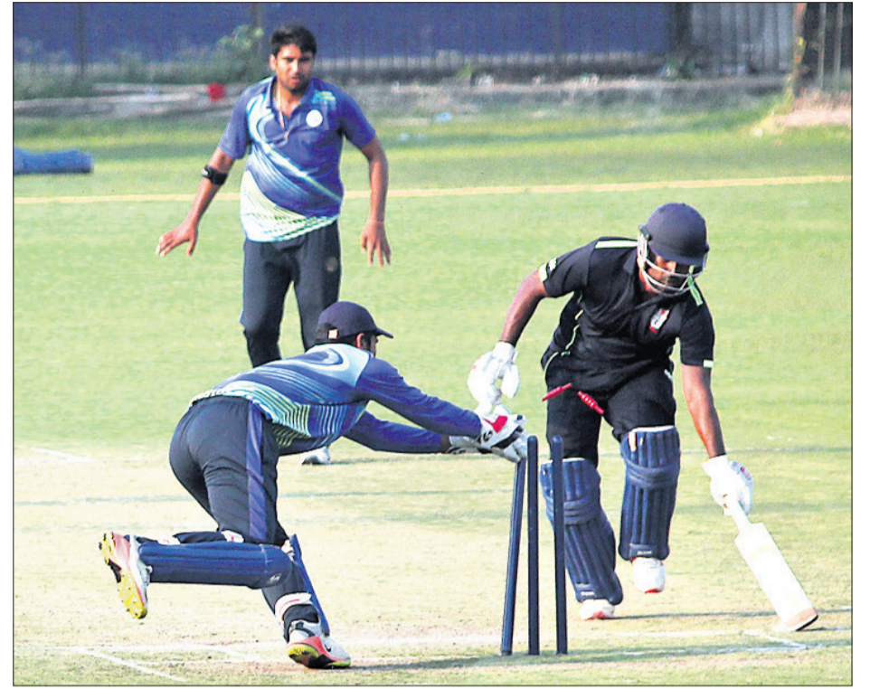
ଓଡ଼ିଶା ଓ ହରିୟାଣା ମଧ୍ୟରେ ଅନୁଷ୍ଠିତ ମ୍ୟାଚ।

ଭାରତୀୟ କ୍ରିକେଟ କଣ୍ଠେୟାଲ ବୋର୍ଡ (ବିସିଆଇ) ଆନୁକୂଲ୍ୟରେ କଟକରେ ଚାଲିଥିବା ସମ୍ପର୍କ ଅଲ୍ଲୀ ଟି୨୦ ଟୁର୍ନାମେଣ୍ଟ ଗ୍ରୁପ-ଡିର ଲିଗ ପର୍ଯ୍ୟନ୍ତ ମ୍ୟାଚରେ ଓଡ଼ିଶା ଲଗାତାର ଦ୍ୱିତୀୟ ପରାଜୟ ବରଣ କରିଛି।