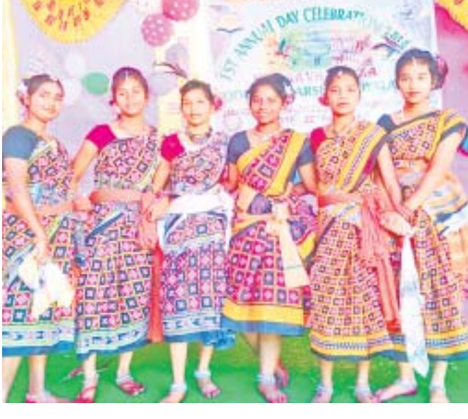
ସାଂସ୍କୃତିକ କାର୍ଯ୍ୟକ୍ରମରେ ଭାଗ ନେଇଥିବା ଛାତ୍ରୀମାନେ ।

ସାହିତ୍ୟିକ ସମ୍ମାନିତ ଅତିଥି ଭାବେ ଯୋଗ ଦେଇଥିଲେ । ଭବିଷ୍ୟତରେ ସମସ୍ତ ଛାତ୍ରଛାତ୍ରୀ ସ୍ୱାଗତୀକ ହେବାକୁ ପରାମର୍ଶ ଦେଇଥିଲେ ।