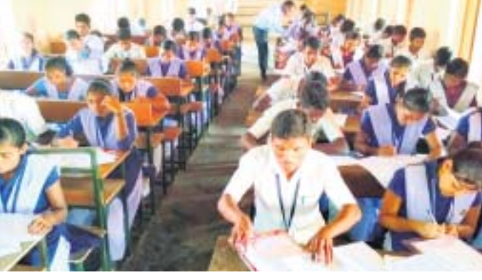
ପୁନିଗୁଡ଼ାରେ ଏକ କେନ୍ଦ୍ରରେ ଛାତ୍ରାଛାତ୍ରୀ ପରୀକ୍ଷା ଦେଉଛନ୍ତି ।

ରାଜସ୍ୱା ଜିଲାର ବିଭିନ୍ନ କେନ୍ଦ୍ରରେ ମାଟ୍ରିକୁ ପରୀକ୍ଷା ଶୁଳ୍ବକାର ଆରମ୍ଭ ହୋଇଛି । ଜିଲାର ୧୧ଟି ବ୍ଲକ୍ ୫୨ଟି ପରୀକ୍ଷା କେନ୍ଦ୍ରରେ ୧୧ହଜାର ୪୦୭ଜଣ ଛାତ୍ରାଛାତ୍ରୀଙ୍କୁ ମଧ୍ୟରୁ ୧୧ହଜାର ୪୦୭ଜଣ ପରୀକ୍ଷା ଦେଇଛନ୍ତି ।