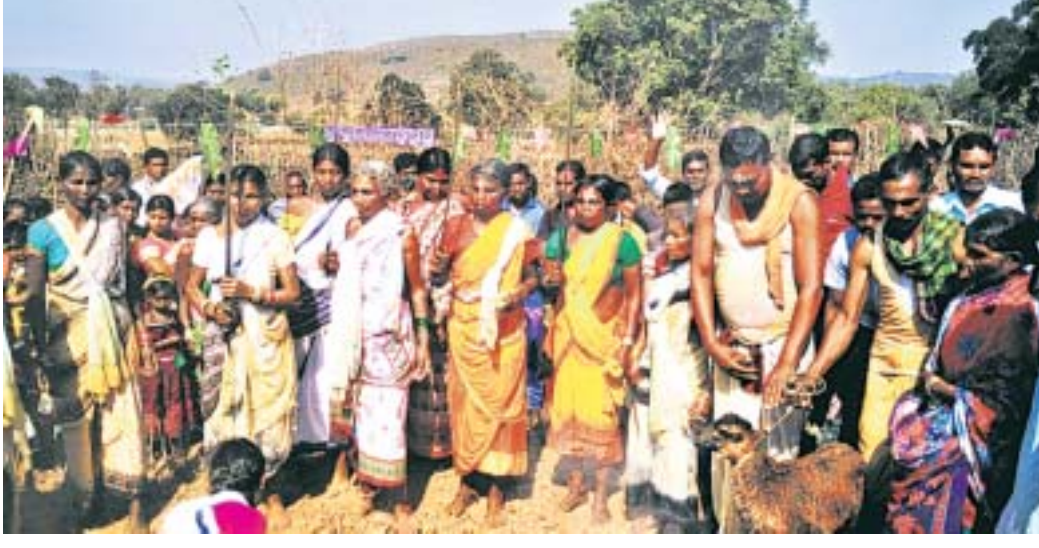
ମହିଳାମାନେ ପୂଜାର୍ଚ୍ଚନା କରୁଛନ୍ତି ।

ରାଜସ୍ୱା ଜିଲ୍ଲା କାଶୀପୁର ବ୍ଲକ୍ ନକତିଗୁଡ଼ା ପଞ୍ଚାୟତ ସଦରଘାଟ ଉପରଘାଟିଠାରେ ଶୁକ୍ରବାର ଆଦିବାସୀଙ୍କ ନିଆରା ଗୋଜିମରା ପର୍ବ ପାଳିତ ହୋଇଯାଇଛି ।