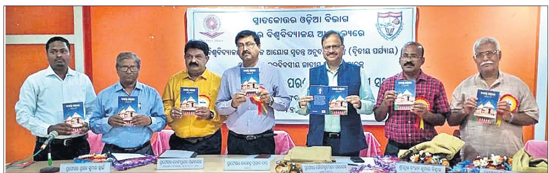
ଅଭିଯାନରେ 'ସତ୍ୟବାଦୀ ସାମ୍ବାଦିକତା' ପୁସ୍ତକ ଉଦ୍ଘାଟନ କରୁଛନ୍ତି ।