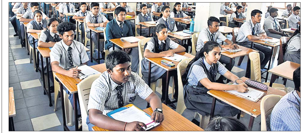
ଭୁବନେଶ୍ୱର ଭେକଟେଣ୍ଡର ଇଂଲିଶ୍ ମିଡିୟମ୍ ସ୍କୁଲରେ ଛାତ୍ରଛାତ୍ରୀମାନେ ଶୁକ୍ରବାର ଆରମ୍ଭ ହୋଇଥିବା ଆଇସିଏସ୍ ସମ୍ବନ୍ଧୀୟ ପରୀକ୍ଷା ଦେଉଛନ୍ତି।

ପୌରାଞ୍ଚଳରେ ୧୫୭ଟି ଆହାର କେନ୍ଦ୍ର ଖୋଲିବାକୁ ରାଜ୍ୟ ସରକାର ନିଷ୍ପତ୍ତି ନେଇଛନ୍ତି।