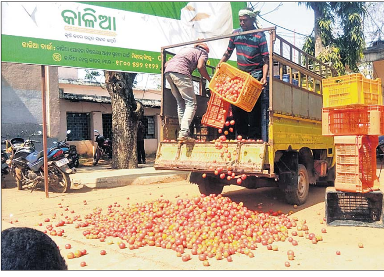
ବିଲାତି ଭାଲି ପ୍ରତିବାଦ କରୁଛନ୍ତି ଚାଷୀ।