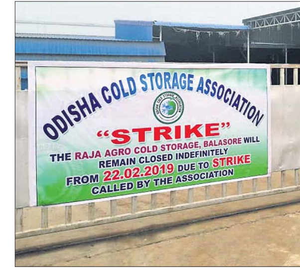
ଶୀତଳଭଣ୍ଡାର ଆଗରେ ଆସୋସିଏଶନ ପକ୍ଷରୁ ନରାଯାଇଥିବା ବ୍ୟାନର।

ଓଡ଼ିଶା ଶୀତଳଭଣ୍ଡାର ସଂଘ ପକ୍ଷରୁ ଶୁକ୍ରବାରଠାରୁ ବନ୍ଦ ଡାକରା ଦିଆଯାଇଛି। ରାଜ୍ୟରେ ଶୀତଳଭଣ୍ଡାରଚୂତିକ ଅଟକ ହେବା ପାଇଁ ୮ଟି ପୁଖ୍ୟ ପ୍ରସଙ୍ଗକୁ ଦାୟୀ କରାଯାଇଛି।