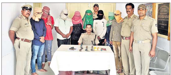
ଗିରଫ ଅଭିଯୁକ୍ତ ସମ୍ପର୍କରେ ପୋଲିସ୍ ସୂଚନା ଦେଉଛି ।