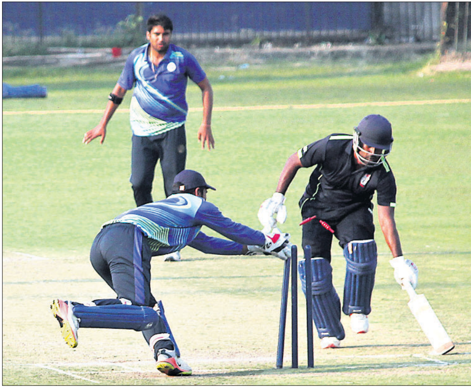
ଓଡ଼ିଶା ଓ ହରିୟାଣା ମଧ୍ୟରେ ଅନୁଷ୍ଠିତ ମ୍ୟାଚ।

ଭାରତୀୟ କ୍ରିକେଟ କଣ୍ଠେଇ ବୋର୍ଡ (ବିସିଆଇ) ଆନୁକୁଲ୍ୟରେ କଟକରେ ଚାଲିଥିବା ଯଯବ ପୁସ୍ତକ ଅଲ୍ଲୀ ଟି୨୦ ଚୂନାମେଣ୍ଟ ଗ୍ରୁପ୍-ଡିର ଲିଗ ପର୍ଯ୍ୟାୟ ମ୍ୟାଚରେ ଓଡ଼ିଶା ଲଗାତାର ଦ୍ୱିତୀୟ ପରାଜୟ ବରଣ କରିଛି।