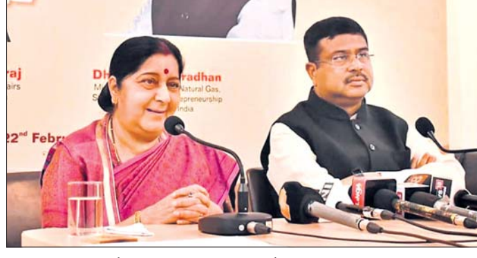
ବେଳେ ଏହା ବର୍ତ୍ତମାନ ୨୩ ହଜାର ଟିପିଇ। ବିତରଣ କେନ୍ଦ୍ର ବୁଝି ସହ କମନ ବୋଲି ସେ ସୂଚନା ଦେଇଛନ୍ତି।

ଉତ୍କଳା ଯୋଜନା ପରିବାରକୁଡ଼ିକୁ କେବଳ ଗ୍ୟାସ୍ ସିଲିଣ୍ଡର ପ୍ରଦାନ କରି ନାହିଁ। ଏହା ମହିଳାଙ୍କୁ ଶସ୍ତ୍ର କରି ଦିଅନ୍ତେ କାର୍ଯ୍ୟ କରୁଛି ବୋଲି ବିଜେଡିର ବ୍ୟାପାର ମନ୍ତ୍ରୀ ସୁଷମା ସ୍ୱରାଜ କହିଛନ୍ତି।