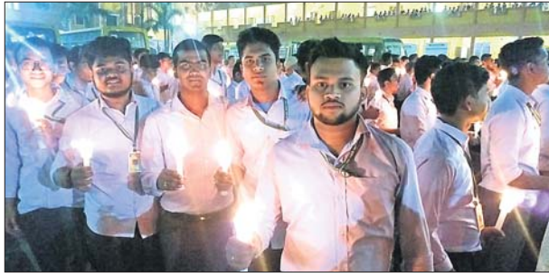
ଶହୀଦ ଯବାନଙ୍କ ଉଦ୍ଦେଶ୍ୟରେ କ୍ୟାଣ୍ଡେଲ ଶୋଭାଯାତ୍ରାରେ ଯାଉଛନ୍ତି ।