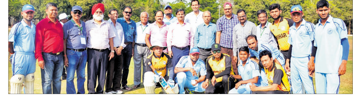
ପୂର୍ବାଞ୍ଚଳ ବଧୂର ଟି୨୦ କ୍ରିକେଟ ଉଦ୍‌ଘାଟନା ଅବସରରେ ଖେଳାଳିଙ୍କ ସହ ଅତିଥିମାନେ।