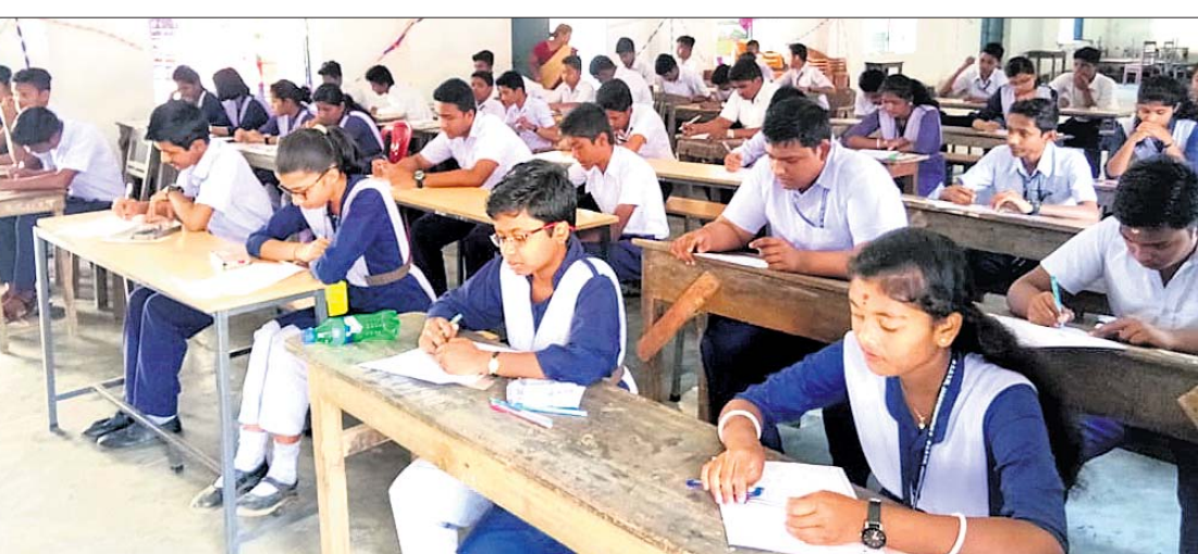
କଟକସିଂହପୁର ଜିଲ୍ଲାରେ ଏକ ମାତ୍ରିକ ପରୀକ୍ଷା କେନ୍ଦ୍ରରେ ଛାତ୍ରଛାତ୍ରୀ ପରୀକ୍ଷା ଦେଉଛନ୍ତି।

ବାଳା, ୨୨୧୩(ସ.ପ୍ର.): ବାଳା ଉପଖଣ୍ଡ ତମପଡ଼ା କ୍ଷେତ୍ରରେ ନୂତନ ଶିକ୍ଷାଧିକାରୀଙ୍କ ଯୋଗଦାନ କରାଯାଇଛି।