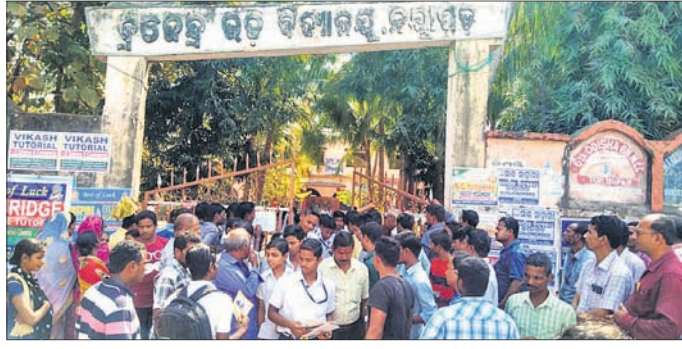
କ୍ରମେନ୍ତେ ଉଚ୍ଚ ବିଦ୍ୟାଳୟରୁ ପରୀକ୍ଷାର୍ଥୀମାନେ ପରୀକ୍ଷା ଦେଇ ଫେରୁଛନ୍ତି ।

ପ୍ରଥମ ଦିନ ଶୁକ୍ରବାର ଲିକାରେ ମାଟ୍ରିକ୍ ପରୀକ୍ଷା ଶାନ୍ତି ଶୃଙ୍ଖଳାରେ ସହିତ ଅନୁଷ୍ଠିତ ହୋଇଛି । ପରୀକ୍ଷାର୍ଥୀମାନେ ନିର୍ଦ୍ଧାରିତ ସମୟ ସକାଳ ୯ଟାରେ ବିଦ୍ୟାଳୟକୁ ପ୍ରବେଶ କରିଥିଲେ । ୧୦ଟାରେ ପରୀକ୍ଷା ଆରମ୍ଭ ହୋଇଥିଲା । ଲିକାରେ ୨୩ଟି ହାଇସ୍କୁଲର ୧୪୬୨୭ ଜଣ ପରୀକ୍ଷାର୍ଥୀଙ୍କ ପାଇଁ ୬୪ ପରୀକ୍ଷା କେନ୍ଦ୍ର ହୋଇଥିଲା ।