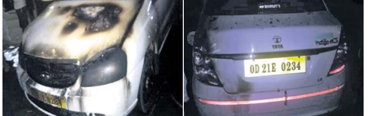
ବୋମାମାଡ଼ରେ କ୍ଷତିଗ୍ରସ୍ତ କାର୍

କାର କ୍ଷତିଗ୍ରସ୍ତ, ଆନାରେ ଏତଲା ଗାଁରେ ଉତ୍ତରକଳା, ଅଭିଯୁକ୍ତଙ୍କୁ ଗିରଫ ଦାବି