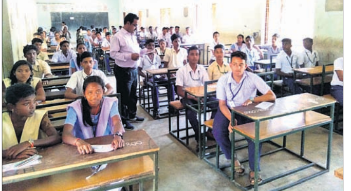
ପରୀକ୍ଷା କେନ୍ଦ୍ରରେ ଛାତ୍ରଛାତ୍ରୀ ।

ରଣପୁର, ୨୨୧୨ (ସ.ପ୍ର.) ମାଧ୍ୟମିକ ଶିକ୍ଷା ପରଷ୍ଟ ପକ୍ଷରୁ ଶୁକ୍ରବାର ମାଟ୍ରିକ୍ ପରୀକ୍ଷା ଆରମ୍ଭ ହୋଇଯାଇଛି । ନୟାଗଡ଼ ଲିକା ରଣପୁର ବ୍ଲକ୍ ଓ ବିଜ୍ଞାପିତ ଅଞ୍ଚଳ ପରଷ୍ଟରେ ୧୨ଟି ପରୀକ୍ଷା କେନ୍ଦ୍ରରେ ମୋଟ ୨୫୭୮ ଜଣ ଛାତ୍ରଛାତ୍ରୀ ପରୀକ୍ଷା ଦେଇଥିବା ସୂଚନା ମିଳିଛି । ପ୍ରଥମ ଦିନ ମାତୃଭାଷା ଓ ଉଚ୍ଚାଧିକାରୀ ୨୫୩୭ ଜଣ ପରୀକ୍ଷାର୍ଥୀ ପରୀକ୍ଷା ଦେଇଥିବା ବେଳେ ୪୧ଜଣ ଛାତ୍ରଛାତ୍ରୀ ଅନୁପସ୍ଥିତ ରହିଥିଲେ । ବିଦ୍ୟାଳୟରେ ୨, ଗୋପାଳପୁର ଉଚ୍ଚ ବିଦ୍ୟାଳୟରେ ୪, ଜନତା ହାଇସ୍କୁଲରେ