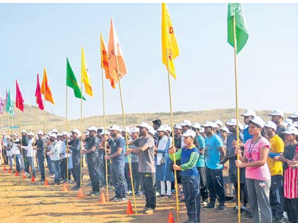
ଜ୍ଞାତୀ ଉତ୍ସବ ଉଦ୍‌ଘାଟନ କାର୍ଯ୍ୟକ୍ରମରେ ଭାଗ ନେଇଥିବା ଆୟତ୍ତଳେକ୍ତମାନେ।