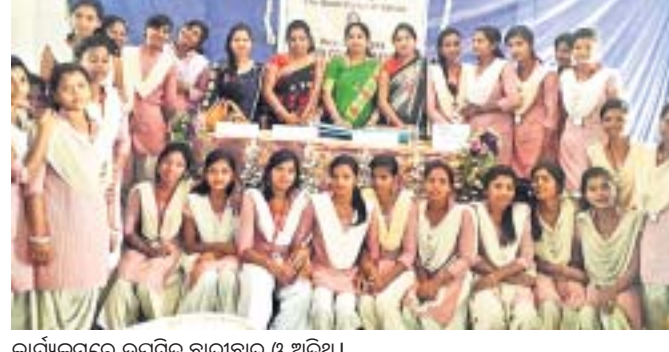
କାର୍ଯ୍ୟକ୍ରମରେ ଉପସ୍ଥିତ ଛାତ୍ରାଛାତ୍ର ଓ ଅତିଥି।

ରାୟଗଡ଼ା ମହିଳା ମହାବିଦ୍ୟାଳୟର ଈତିହାସ ବିଭାଗ ଆନୁକୂଲ୍ୟରେ ଏକ ଆଲୋଚନାଚକ୍ର ଉଦ୍ଘାଟନ କରାଯାଇଛି।