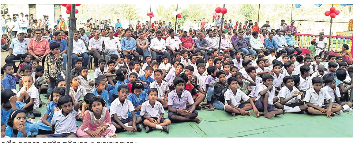
ବାର୍ଷିକ ଉତ୍ସବରେ ଉପସ୍ଥିତ ଅଭିଭାବକ ଓ ଛାତ୍ରାଛାତ୍ରୀମାନେ।