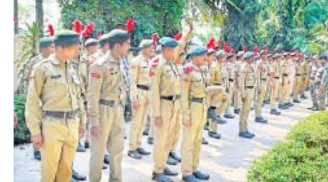
ପରୀକ୍ଷା ଦେବାକୁ ଆସିଥିବା ଏନ୍.ସି.ଏ. କର୍ମଚାରୀ

ନାଗରିକମାନେ ଶାନ୍ତି ଶୋଭାଯାତ୍ରା କରି ଠାକୁରାଣୀ ମନ୍ଦିରରେ ପହଞ୍ଚିଥିଲେ।