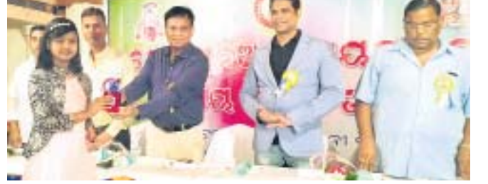
ଜଣେ ଛାତ୍ରାଙ୍କୁ ଅତିଥି ସମ୍ବର୍ଦ୍ଧିତ କରୁଛନ୍ତି।

ରାୟଗଡ଼ା ପ୍ରେସ୍ ମୁନିୟନର ତୃତୀୟ ବାର୍ଷିକ ଉତ୍ସବ ରବିବାର ପାଳିତ ହୋଇଛି।