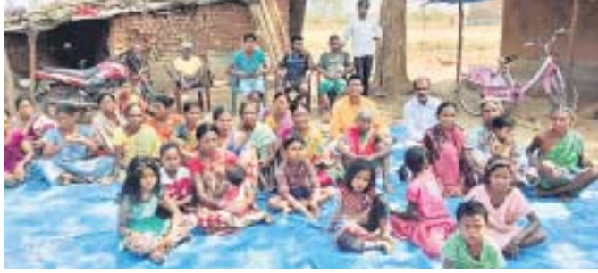
ମାଙ୍କଡ଼ଝୋଲାବାସୀ ମନ୍କା ବାଚ୍ ଶୁଣୁଛନ୍ତି।

ରାୟଗଡ଼ା ମାଙ୍କଡ଼ଝୋଲା ଓ ଭୂସିଗୁଡ଼ା ଅଞ୍ଚଳବାସୀ ପ୍ରଧାନମନ୍ତ୍ରୀଙ୍କୁ ମାସିକ କାର୍ଯ୍ୟକ୍ରମ ମନ୍କା ବାଚ୍ ଶୁଣିଛନ୍ତି।