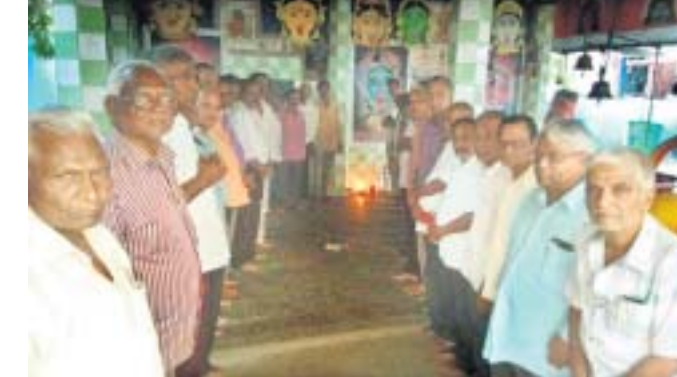
ଠାକୁରାଣୀ ମନ୍ଦିରରେ ବରିଷ୍ଠ ନାଗରିକଙ୍କ ସମୂହ ଦୀପଦାନ।

ରାୟଗଡ଼ା ଜିଲ୍ଲା ଗୁଣପୁର ଜେଲର ଜଣେ ବିଚାରାଧୀନ କଏଦୀଙ୍କ ଚିକିତ୍ସାଧୀନ ଅବସ୍ଥାରେ ଶନିବାର ରାତିରେ ମୃତ୍ୟୁ ହୋଇଛି।