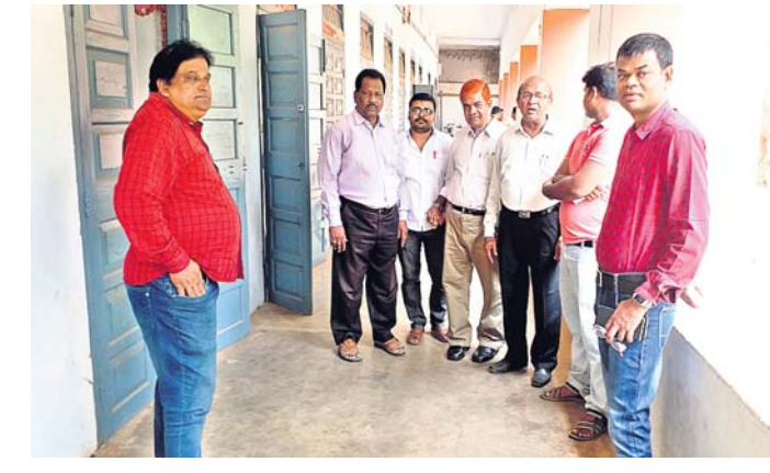
ଉପଜିଲ୍ଲାପାଳ ଶ୍ରେଣୀଗୃହ ଦେଖିଛନ୍ତି।