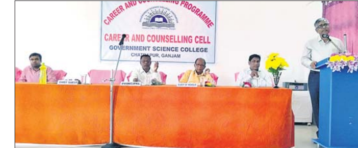
କୂଳପତି ବକ୍ତବ୍ୟ ଦେଉଛନ୍ତି।

କାର୍ଯ୍ୟକ୍ରମରେ ଉପସାଧନା କରିଥିଲେ। ବିଭିନ୍ନ ପ୍ରକଳ୍ପର ଉଦ୍ଘାଟନ କରାଯାଇଥିଲା।