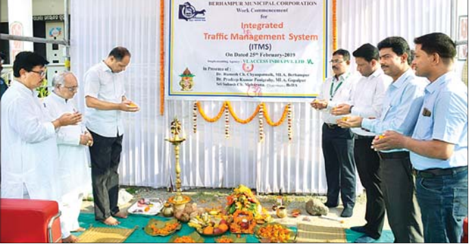
ଶୁଭାରମ୍ଭ କାର୍ଯ୍ୟକ୍ରମରେ ଉପସ୍ଥିତ ଅତିଥି ବୃନ୍ଦ ।

ବ୍ରହ୍ମପୁରରେ ସୁଧୁରିବ ଟ୍ରାଫିକ୍ ସମସ୍ୟା । ବେପାରୀମାନେ ଗାଡ଼ିର ବିଷ ପିଇ ଜଣେ ନାବାଳିକା ଆତ୍ମହତ୍ୟା କରିଛନ୍ତି । ସେ ହେଲେ ପ୍ରଥମ ମୃତ୍ୟୁ। ପ୍ରଧାନମନ୍ତ୍ରୀ ପ୍ରଧାନଙ୍କୁ ଟ୍ରାଫିକ୍ (୧୬) । ସୋମବାର ଏନେଇ ବଡ଼ ମେଡିକାଲ ଫାଷ୍ଟି ପୋଲିସ୍ ନଂ. ୧୦୩/୧୯୯୯ ଏକ ଅପମୃତ୍ୟୁ ମାମଲା ଗୁରୁ କରି ବ୍ୟବହୃତ ପରେ ମୃତଦେହ ପରିବାର ବର୍ତ୍ତକୁ ହସ୍ତାନ୍ତର କରାଯାଇଥିବା ଏବଂ ଆଇନ ରାମକୃଷ୍ଣ ଦାସ କହିଛନ୍ତି। ପ୍ରକାଶକ୍ଷେତ୍ର, ରିଭିରା ସହ୍ୟାଳୟ ଘରେ କେହି ନ ଥିବା ସମୟରେ ନାବାଳିକା ଜଣକ କୌଣସି କାରଣରୁ କାରନାଶକ ପିଇ ଦେଇଥିଲେ । ପରିବାର ବର୍ତ୍ତ ତାଙ୍କୁ ଗୁରୁତର ଅପସ୍ତାରେ ବଡ଼ ମେଡିକାଲରେ ଭର୍ତ୍ତି କରିଥିଲେ । ହେଲେ ରାସ୍ତାରେ ଡାକ୍ତର ମୃତ୍ୟୁ ଘଟିଥିବା ତାଙ୍କୁ କହିଥିଲେ ।