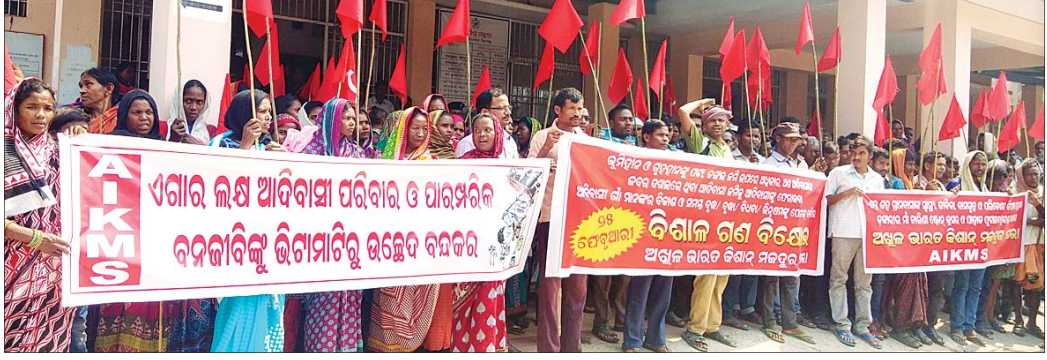
ବ୍ରହ୍ମପୁର ଉପଜିଲାପାଳଙ୍କ କାର୍ଯ୍ୟାଳୟ ସମ୍ମୁଖରେ ବିକ୍ଷୋଭ ପ୍ରଦର୍ଶନ କରାଯାଇଛି ।

ସାନଖେମୁଣ୍ଡି ଓ ଦିନପହଣ୍ଡି ତହସିଲର ଭୂମିସ୍ୱାଧୀନ ଓ ଗୃହସ୍ୱାଧୀନ ଗରିବମାନେ ଜମି ଓ ଘର ତିହ ପଞ୍ଜା ପାଇଁ ଦୀର୍ଘ ମାସ ହେଲା ଦାବି କରିଆସୁଛନ୍ତି। ଆବେଦନ ମଧ୍ୟ କରିଛନ୍ତି। କିନ୍ତୁ ପଞ୍ଜା ପ୍ରଦାନ ଦିଗରେ କୌଣସି ପଦକ୍ଷେପ ନିଆଯାଉନାହିଁ। ଜଙ୍ଗଲ ଜମିରେ ଚାଷ ଓ ବାସ କରୁଥିବା ଆଦିବାସୀଙ୍କୁ ଜଙ୍ଗଲ ଅଧିକାର ପଞ୍ଜା ମଧ୍ୟ ମିଳୁନି । ସାନଖେମୁଣ୍ଡି ତହସିଲ ଅନ୍ତର୍ଗତ ପୋଡ଼ାମାଟା ରାଜସ୍ୱ ସର୍କଲ ଅଧୀନରେ ରାଜନାପଲ୍ଲୀ, ମାଥାପୁର ଓ ବାଲିସାହି ଆଦି ଆଦିବାସୀ ଗାଁଗୁଡ଼ିକରେ ଆଦିବାସୀଙ୍କ