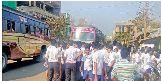
କେନ୍ଦ୍ର ବାହାରେ ପରୀକ୍ଷାର୍ଥୀମାନେ ଅପେକ୍ଷା କରିଥିବା ବେଳେ ବ୍ୟବହୃତ ଯାତାୟତ କରୁଛି ।

ପରୀକ୍ଷାର୍ଥୀଙ୍କ ସୁରକ୍ଷା ଦୃଷ୍ଟିରୁ ନିଜ ବିଦ୍ୟାଳୟଠାରୁ ପରୀକ୍ଷା କେନ୍ଦ୍ର ଦୂରତାକୁ ଯାତାୟତ କମାଇବା ଦିଗରେ ପଦକ୍ଷେପ ନେଇଛି ଗଣଶିକ୍ଷା ବିଭାଗ । ଏହାର ଉଦ୍ଦେଶ୍ୟ ଥିଲା ଘରଠାରୁ କେନ୍ଦ୍ରରେ ପହଞ୍ଚିବାର ପରୀକ୍ଷାର୍ଥୀଙ୍କର ଯେମିତି କୌଣସି ଅସୁବିଧା ନ ହୁଏ । କିନ୍ତୁ ଅଭେଦ ପରୀକ୍ଷା କେନ୍ଦ୍ରରେ ପହଞ୍ଚିବା ପରେ ସେଠାରେ ପରୀକ୍ଷାର୍ଥୀଙ୍କ ସୁରକ୍ଷାକୁ ସମ୍ପୂର୍ଣ୍ଣ ଅଣଦେଖା କରାଯାଇଛି । ବ୍ରହ୍ମପୁର ସହର ଡାଳୁକା ଛକରେ ଥିବା ଆସିକାରୋଡ଼ ପୌର ବାଳିକା ଉଚ୍ଚ ବିଦ୍ୟାଳୟରେ ଏହା ଦେଖିବାକୁ ମିଳିଛି । ପରୀକ୍ଷା କେନ୍ଦ୍ର ଭିତରକୁ ପ୍ରବେଶ କରିବା ପାଇଁ ରାଜପଥ କଡ଼ରେ ବିପଦପୂର୍ଣ୍ଣ ଭାବେ ଶତାଧିକ ପରୀକ୍ଷାର୍ଥୀ ଅପେକ୍ଷା କରୁଛନ୍ତି, ଯାହାକୁ ନେଇ ପରୀକ୍ଷାର୍ଥୀ ଏବଂ ଅଭିଭାବକଙ୍କ ମଧ୍ୟରେ ଅସନ୍ତୋଷ ପ୍ରକାଶ ପାଇଛି । ତଳେ ମାଟ୍ରିକ୍ ପରୀକ୍ଷା ପାଇଁ ଗଞ୍ଜାମ ଜିଲ୍ଲାରେ ୨୨୯ ପରୀକ୍ଷା କେନ୍ଦ୍ର କରାଯାଇଛି । ସେଥିରୁ ଗୋଟିଏ ହେଲା ଡାଳୁକା ଛକରେ ଥିବା ଆସିକାରୋଡ଼ ପୌର ବାଳିକା ଉଚ୍ଚ ବିଦ୍ୟାଳୟ । ଏହି କେନ୍ଦ୍ରରେ ସିଟି ହାଇସ୍କୁଲର ୧୬୦ ଏବଂ