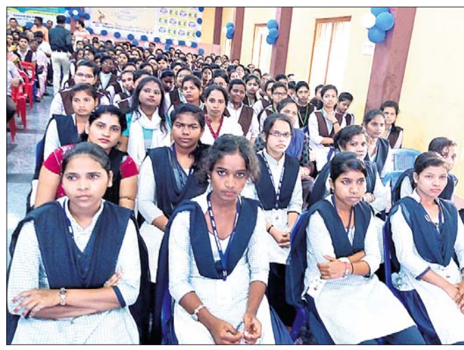
କାର୍ଯ୍ୟକ୍ରମରେ ଉପସ୍ଥିତ ସଭ୍ୟମାନେ।

ଦେଶର ବେକାରି ସ୍ଵରୂପିତ୍ଵ ଉଚ୍ଚ ଉଦ୍ଘାଟନ ଗଠନ କ୍ଷେତ୍ରରେ ପରାମର୍ଶ ପ୍ରଦାନ ନିମିତ୍ତ କେନ୍ଦ୍ର ସରକାରଙ୍କ ପକ୍ଷରୁ ଥିଲ ସାଥୀ ନୂତନ ଓଡ଼ିଶା 'ଧର୍ମପଦ' ଡାଇଲଗ କାର୍ଯ୍ୟକ୍ରମ ଯୋଗଦାନ ଅନୁଷ୍ଠିତ ହୋଇଯାଇଛି।