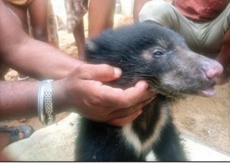
ଉଦ୍ଧାର ହୋଇଥିବା ଭାଲୁଛୁଆ ।