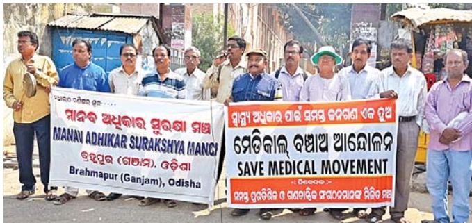
ମାନବ ଅଧିକାର ସୁରକ୍ଷା ମଞ୍ଚ ପକ୍ଷରୁ ବିଭାଗ ପ୍ରଦର୍ଶନ କରାଯାଇଛି ।

ବ୍ରହ୍ମପୁର ସିଟି ହସ୍ପିଟାଲରେ ବରିଷ୍ଠ ନାଗରିକଙ୍କ ପାଇଁ ଅନ୍ତଃନିକିଆ ବିଭାଗ କାର୍ଯ୍ୟକାରୀ, ଅଲଗାସାଧାରଣ ମେଡିକାଲ କାର୍ଯ୍ୟକାରୀ ଭଳି ୩ ଦିନ ଦାବି ନେଇ ଯୋଗଦାନ କରିଥିବା କାର୍ଯ୍ୟକାରୀ ପଦକ୍ଷେପ ମାନବ ଅଧିକାର ସୁରକ୍ଷା ମଞ୍ଚ ପକ୍ଷରୁ ୮୨ ତମ ଘଣ୍ଟଯାତ୍ରା ଯାତ୍ରା ଅନୁଷ୍ଠିତ ହୋଇଯାଇଛି । ଏହି ଘଣ୍ଟଯାତ୍ରାରେ ଏକ ଦସ୍ତଖତ ସମ୍ବଳିତ ସ୍ମାରକ ପତ୍ର ସିଟିସମ୍ପୁର ତାହାର ସଦାନୁମତି ମିଶ୍ରଙ୍କୁ ଜଣାଇବାକୁ ସ୍ୱାଧୀନ ମନ୍ତ୍ରାଳୟ ଉଦ୍ଦେଶ୍ୟରେ ପ୍ରଦାନ କରାଯାଇଛି । ପ୍ରକାଶରେ, ବ୍ରହ୍ମପୁର ସିଟି ହସ୍ପିଟାଲକୁ