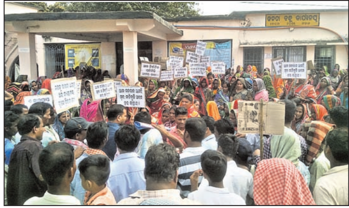
ଶୋଭାଯାତ୍ରାରେ ଆସିଥିବା ମହିଳା ଓ ପୁରୁଷମାନେ ।