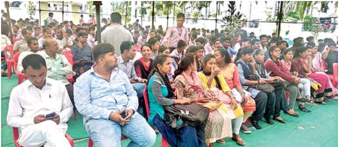
ଉପସ୍ଥିତ ଛାତ୍ରଛାତ୍ରୀ ଓ ଅଧ୍ୟାପକମାନେ।

କନିଷ୍ଠ ଡିପାର୍ଟମେଣ୍ଟର ଭାଜପାର ଧର୍ମପଦ ଡାଇଲଗ୍ (ନୂଆ ଓଡ଼ିଶା) କାର୍ଯ୍ୟକ୍ରମ ଅନୁଷ୍ଠିତ ହୋଇଯାଇଛି। ବିଭିନ୍ନ ପ୍ରକଳ୍ପର ଉଦ୍ଘାଟନ କରାଯାଇଥିଲା।