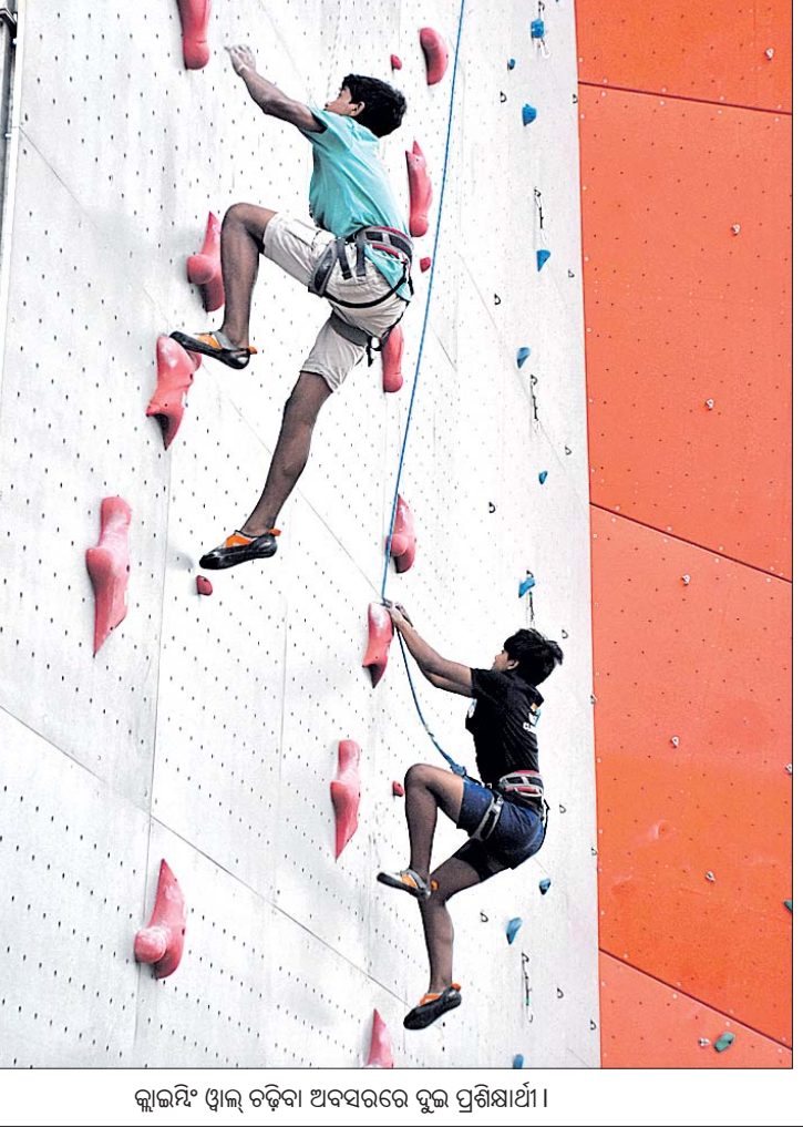
କ୍ଲାଇମିଂ ଓ ୫ ହାଇପରଫରମାନ୍ସ୍ ସେକ୍ଟର ଉଦ୍‌ଘାଟନୀ ।

ରଂଲଣ୍ଡ ମହିଳା ଦଳ: ୪୩.୩ ଓଭରରେ ୧୬୧/ଅଲଆଉଟ୍ (ସ୍କୋର-୮୫; ୱୁଲ୍ଡ଼ ଗୋସ୍ୱାମୀ-୪/୩୦, ଶିଖା ପାଣ୍ଡେ-୪/୧୮) ।