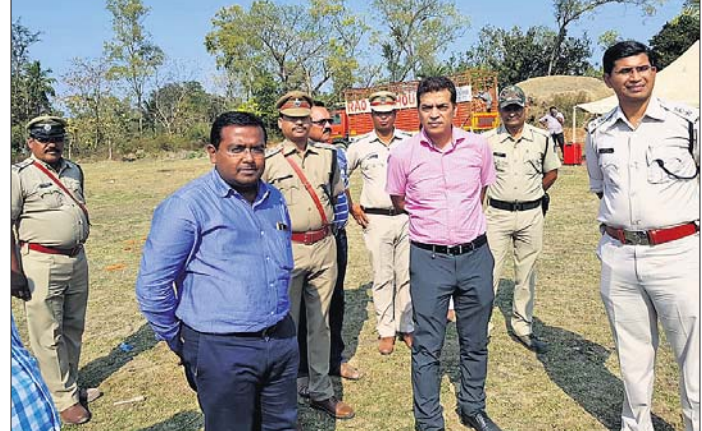
ଆଇ.ଜି. ଓ ଏସ୍ପିଙ୍କ ସହ ଅନ୍ୟ ଅଧିକାରୀମାନେ ।