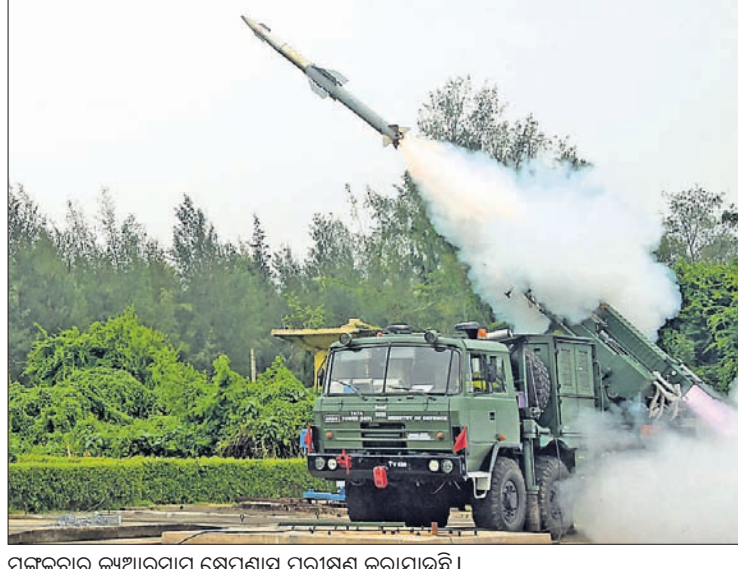
ମଙ୍ଗଳବାର କୁଆରସାମ୍ କ୍ଷେପଣାସ୍ତ୍ର ପରୀକ୍ଷଣ କରାଯାଇଛି।