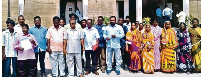
ଦାବିପତ୍ର ପ୍ରଦାନ ପାଇଁ ଆସିଥିବା ପୌର କର୍ମଚାରୀମାନେ ।

ବ୍ରହ୍ମପୁରକୁ ସ୍ୱଚ୍ଛ ଓ ସୁନ୍ଦର କରିବାରେ ପୌର କର୍ମଚାରୀ ତଥା ସଫେଇ କର୍ମଚାରୀମାନଙ୍କ ଯଥେଷ୍ଟ ଭୂମିକା ରହିଛି ।