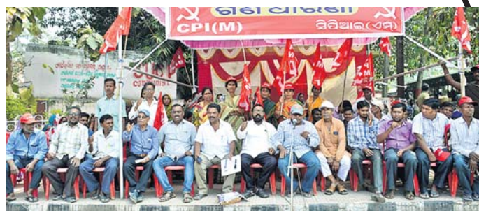
ମେଡିକାଲ ସମ୍ମିଳନୀରେ ସିପିଏମ୍ ଧାରଣା ଦିଆଯାଇଛି।

୨୦ ଦିନ ହେଲା ମେଡିକାଲରେ ମୈଥୁଳୀ ଅସ୍ତ୍ରୋପଚାର ଦିନ ଧାର୍ଯ୍ୟ ହେଉଛି