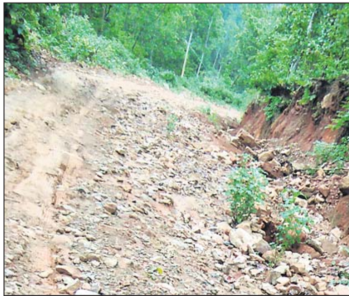
ଗ୍ରାମକୁ ସଂଯୋଗ କରୁଥିବା ରାସ୍ତା ।