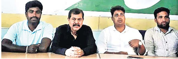
ଖବରଦାତା ସମ୍ମିଳନୀରେ ଯୁବ କଂଗ୍ରେସର ନେତାମାନେ ।

ଅସମ୍ପୂର୍ଣ୍ଣ ଜାନିବିଲି ଜଳ ଯୋଗାଣ ପ୍ରକଳ୍ପକୁ ଆସନ୍ତା ୨୮ରେ ପୁଷ୍ୟମନ୍ତ୍ରୀ ନବୀନ ପଟ୍ଟନାୟକ ଉଦଘାଟନ କରିବା କାର୍ଯ୍ୟକ୍ରମ ଧିରରେ ହୋଇଥିଲା ।