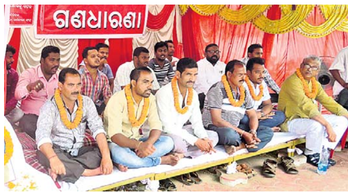
ସଂଘର କର୍ମକର୍ତ୍ତାମାନେ ଅନଶନରେ ବସିଛନ୍ତି ।

ଓଡ଼ିଶା ବିଦ୍ୟୁତ୍ କର୍ମଚାରୀ ସଂଘ ତରଫରୁ ଗୁଆଁ ନିୟୁତ୍ ଏବଂ ଅନ୍ୟାନ୍ୟ ଦାବି ନେଇ ଚାଲିଥିବା ଆନ୍ଦୋଳନ ମଙ୍ଗଳବାର ୪୦ ଦିନରେ ପହଞ୍ଚିଛି।