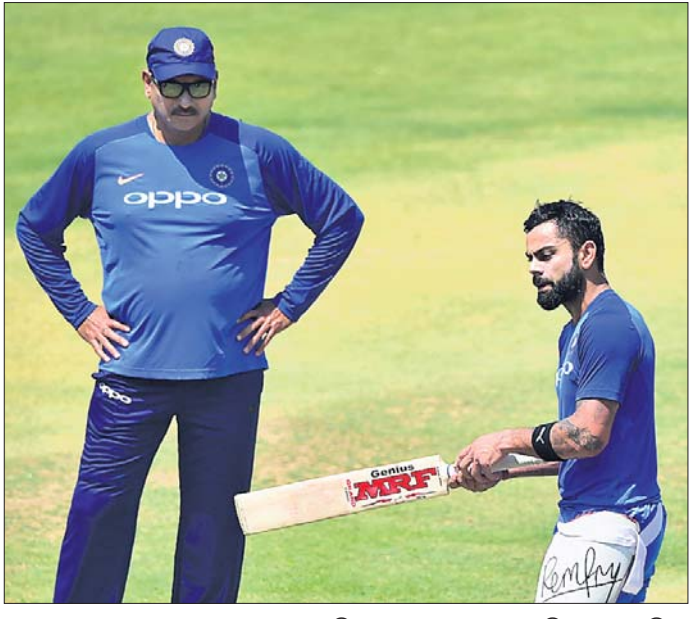
ମଙ୍ଗଳବାର ଅଭାସ୍ୟ ସେସନରେ କୋଚ୍ ରବି ଶାସ୍ତ୍ରୀଙ୍କ ସହ ଅଧିନାୟକ ବିରାଟ କୋହଲି ।

ସ୍ଥାନୀୟ ଏମ୍.ଟି.ନାସାମୀ ଷ୍ଟାଡ଼ିୟମରେ ରୁଧିରା ଭାରତ ଓ ଭ୍ରମଣକାରୀ ଅଷ୍ଟ୍ରେଲିଆ ଦ୍ୱିତୀୟ ଚର୍ଚ୍ଚା ଅନ୍ତିମ ଟି୨୦ ମ୍ୟାଚରେ ପରସ୍ପରକୁ ଭେଟିବେ । ଏହାପୂର୍ବରୁ ବିଶାଖାପାଟଣାରେ ଅନୁଷ୍ଠିତ ପ୍ରଥମ ମ୍ୟାଚରେ ଶେଷ ବଲ୍ରେ ଭାରତ ୩ ଭଲକେଟରେ ପରାସ୍ତ ହୋଇଥିଲା । ଫଳରେ ଭାରତ ସିରିଜ ପରାଜୟରୁ ରକ୍ଷା ପାଇବା ପାଇଁ ତଥା ସିରିଜ ବଞ୍ଚାଇବା ପାଇଁ ଏହି ମ୍ୟାଚ୍ ଜିତିବା ଅପରିହାର୍ଯ୍ୟ ହୋଇପାରିଛି । ବିଶ୍ୱକପ୍ ଉପରେ ନଜର ରହିଥିଲେ ମଧ୍ୟ ଭାରତ ଏହି ଘରୋଇ ସିରିଜକୁ ହାତଛଡ଼ା କରିବାକୁ ଚାହଁବ ନାହିଁ । ପୁଣି ୨୦୦୮ ପରେ ଭାରତ ଅଷ୍ଟ୍ରେଲିଆ ବିପକ୍ଷରେ କୌଣସି ଟି୨୦ ସିରିଜରେ ପରାସ୍ତ ହୋଇ ନାହିଁ । ତେଣୁ ଏହି ଅପରାଜେୟ ଧାର ବଜାୟ ରଖିବାକୁ ଘରୋଇ ଦଳ ପ୍ରୟାସ କରିବ । ପ୍ରଥମ ଟି୨୦ରେ ଭାରତ ସାଂଘାତକ ବ୍ୟାଟିଂ ବିପକ୍ଷରେ ସମ୍ପୂର୍ଣ୍ଣାନ୍ତ ହୋଇଥିଲା । ତେବେ ଦମ୍ଭଦାର ବୋଲି କହି ଭାରତ ଅଷ୍ଟ୍ରେଲିଆ ବ୍ୟାଟ୍ସମ୍ୟାନଙ୍କୁ ବାନ୍ଧି ରଖିବାରେ ସଫଳ ହୋଇଥିଲା । ଫଳରେ ବିଜୟୀ ହେବା ପାଇଁ ଅଷ୍ଟ୍ରେଲିଆ ଶେଷ ବଲ୍ ପର୍ଯ୍ୟନ୍ତ ଯିବାକୁ ପଡିଥିଲା । ଯଶପ୍ରୀତ ରୁମ୍‌ରାଜ୍ ଭଲକେଟରେ ପ୍ରଦର୍ଶନ ଦଳରେ ଭାରତ ମ୍ୟାଚକୁ ଫେରିଥିଲା । ଏହି ଦଳ ବିଶ୍ୱକପ୍ ଦଳ ସହ ମେଲ ଖାଇଛି ବୋଲି ଭାରତୀୟ ଅଧିନାୟକ ବିରାଟ କୋହଲି କହିଛନ୍ତି । ତେବେ ଚଳିତ ଟି୨୦ ଓ ୫