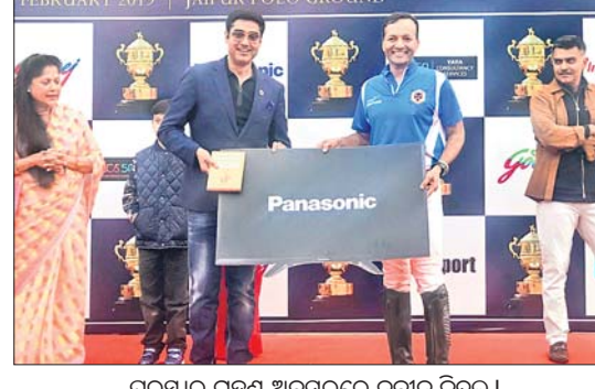
ପୁରସ୍କାର ଗ୍ରହଣ ଅବସରରେ ଘନେଡ଼ା ଖେଳାଳି ।

ଘନେଡ଼ା (ସେକ୍ସ ଜର୍ଜ୍), ୨୬୨୨: ଘନେଡ଼ା ଜାତୀୟ କ୍ରୀଡ଼ା ସ୍ଥଳରେ ଘରୋଇ ଖେଳାଳି ଓ ଲାଲ ଖେଳାଳିଙ୍କୁ ପୁରସ୍କାର ଦିଆଯାଇଥିଲା । ଘନେଡ଼ା (ସେକ୍ସ ଜର୍ଜ୍), ୨୬୨୨: ଘନେଡ଼ା ଜାତୀୟ କ୍ରୀଡ଼ା ସ୍ଥଳରେ ଘରୋଇ ଖେଳାଳି ଓ ଲାଲ ଖେଳାଳିଙ୍କୁ ପୁରସ୍କାର ଦିଆଯାଇଥିଲା । ଘନେଡ଼ା (ସେକ୍ସ ଜର୍ଜ୍), ୨୬୨୨: ଘନେଡ଼ା ଜାତୀୟ କ୍ରୀଡ଼ା ସ୍ଥଳରେ ଘରୋଇ ଖେଳାଳି ଓ ଲାଲ ଖେଳାଳିଙ୍କୁ ପୁରସ୍କାର ଦିଆଯାଇଥିଲା ।