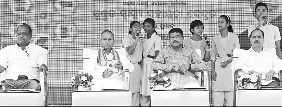
ଶୁଣ୍ଠିତ ସ୍ୱାସ୍ଥ୍ୟ ସହାୟତା କେନ୍ଦ୍ରର ଭିତ୍ତିପ୍ରସ୍ତର ସ୍ଥାପନ ଉତ୍ସବରେ କେନ୍ଦ୍ରମନ୍ତ୍ରୀ ଧର୍ମେନ୍ଦ୍ର ପ୍ରଧାନ ଓ ଅନ୍ୟମାନେ।