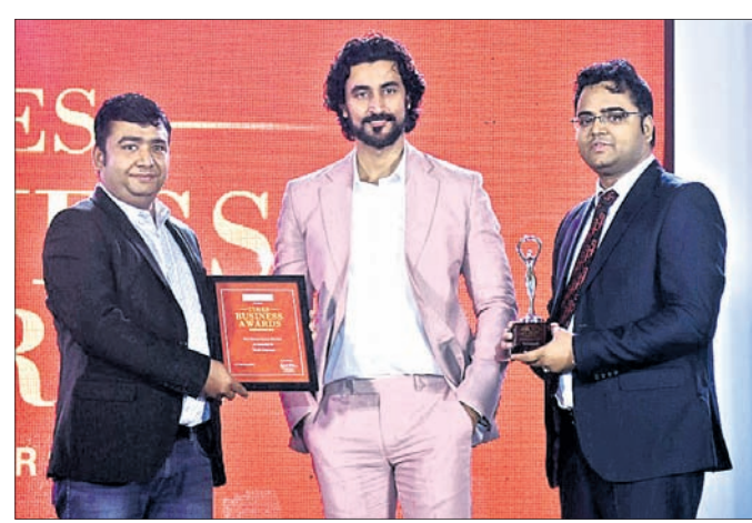
ଗଭୀର ଗୁପ୍ତ ପକ୍ଷରୁ ଭୁବନେଶ୍ୱରରେ ଅନୁଷ୍ଠିତ ଏକ କାର୍ଯ୍ୟକ୍ରମରେ ବଲିଉଡ ଅଭିନେତା କୁନାଲ କପୁର ଓଡ଼ିଆ ଟେଲିଭିଜନ ପ୍ରାଇଭେଟ ଲିମିଟେଡକୁ 'ବେଷ୍ଟ ଇଣ୍ଟରନେଟ ପ୍ରୋଭାଇଡର ଅଫ ଓଡ଼ିଶା-୨୦୧୯' ଆଡ଼ାଡ଼ି ପୁରସ୍କାର କରିଛନ୍ତି।

ରେଳବେଳକ୍ଷତ୍ତି। କାରଣ ଏଥିଯୋଗୁଁ ବିଶ୍ୱ ବ୍ୟାଙ୍କଙ୍କ ବ୍ୟବସ୍ଥା ଠିକ୍ ହୋଇଯାଇଛି।