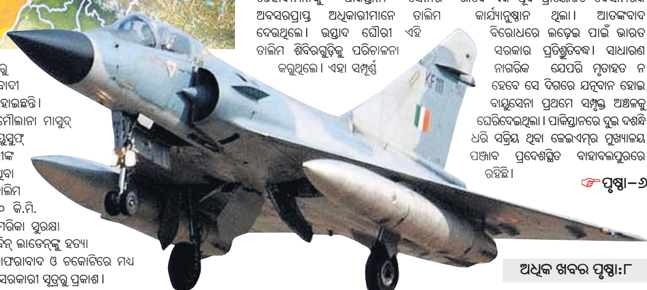
ଅଧିକ ଖବର ପୃଷ୍ଠା:୮

ଭାବେ ଏକ ପୂର୍ବ ପ୍ରାୟୋଜିତ ବ୍ୟୋମନିକ କାର୍ଯ୍ୟାନୁଷ୍ଠାନ ଥିଲା । ଆତଙ୍କବାଦ ବିରୋଧରେ ଲଢ଼େଇ ପାଇଁ ଭାରତ ସରକାର ପ୍ରତିକୃତିବଦ୍ଧ । ସାଧାରଣ ନାଗରିକ ଯେପରି ମୃତ୍ୟୁ ହେବ ସେ ଦିଗରେ ଯତ୍ନବାନ ହୋଇ ବାୟୁସେନା ପ୍ରଥମେ ସମ୍ପୂର୍ଣ୍ଣ ଅଞ୍ଚଳକୁ ଘେରିଦେଇଥିଲା । ପାକିସ୍ତାନରେ ଭୁଲ ବନ୍ଧାଯି ଧରି ସକ୍ରିୟ ଥିବା ଜେଇଏମ୍ ମୁଖ୍ୟାଳୟ ପଞ୍ଜାବ ପ୍ରଦେଶର ବାହାବଳପୁରରେ ରହିଛି ।