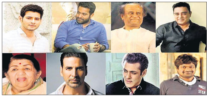
ଆକ୍ରମଣ ପରେ ଭାରତୀୟ ବାୟୁସେନା ସେଲିବ୍ରିଟମାନେ ସେମାନଙ୍କ ପ୍ରତିକ୍ରିୟା ଜବାବୀ ଆକ୍ରମଣ କରିଛି। ବଲିଉଡ ସୋସିଆଲ ମିଡିଆରେ ପୋଷ୍ଟ କରିଛନ୍ତି। ଏ

ପୃଷ୍ଠା ଲତା ମଙ୍ଗେସକର, ସଲମନ୍ ଖାନ୍ ଏବଂ ଅକ୍ଷୟ କୁମାରଙ୍କ ଭଳି ବିଶିଷ୍ଟ କଳାକାରମାନେ ଭାରତୀୟ ସଶସ୍ତ୍ର ସେନାର କାର୍ଯ୍ୟାନୁଷ୍ଠାନକୁ ପ୍ରଶଂସା କରିଛନ୍ତି। ମଙ୍ଗଳବାର ଭୋର ୩୦ରେ ବାୟୁସେନା ଆକାଶମାର୍ଗରୁ ଆକ୍ରମଣ କରି ପାକିସ୍ତାନସ୍ଥିତ ଆତଙ୍କବାଦୀ ଶିବିରଗୁଡ଼ିକୁ ଧ୍ୱଂସ କରିଦେଇଛି। ପାକିସ୍ତାନଭିତ୍ତିକ ଜେଶ-ଇ-ମହମ୍ମଦ ଆତଙ୍କବାଦୀ ଗୋଷ୍ଠୀ ପକ୍ଷରୁ ଫେବୃଆରୀ ୧୪ରେ ଆତ୍ମଘାତ