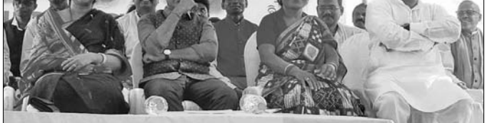
ସଙ୍କଳ୍ପ ସମାବେଶରେ ମହିଳା ଗହଣରେ କେନ୍ଦ୍ରମନ୍ତ୍ରୀଙ୍କ ସମେତ ମଞ୍ଚାସୀନ ଅତିଥି ।

ଆଗାମୀ ସାଧାରଣ ନିର୍ବାଚନକୁ ଦୃଷ୍ଟିରେ ରଖି ଭାଜପା ପକ୍ଷରୁ ବଡ଼ସାହି ନିର୍ବାଚନ ମଣ୍ଡଳୀ ଅଧୀନ ମାଣତ୍ରୀ ବଜ୍ରା ପତିଆରେ ବିଜୟ ସଙ୍କଳ୍ପ ସମାବେଶ ଅନୁଷ୍ଠିତ ହୋଇଯାଇଛି।