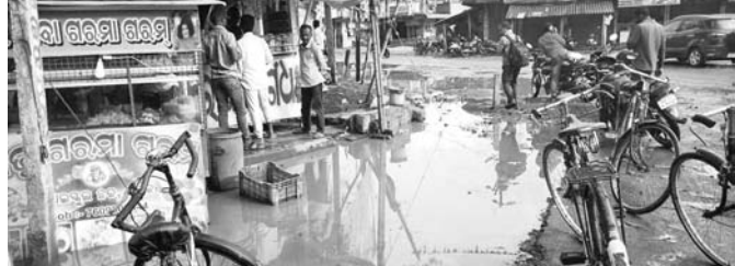
ମେଳାକୁ ପଡିଥିବା ରାସ୍ତାରେ ବର୍ଷାପାଣି ଜମିଛି।