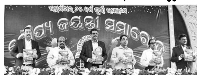
ଉତ୍ସବରେ ମଞ୍ଚାସୀନ ଅତିଥି।

କେବଳ ଦୃଢ଼ ପଢ଼ିବା କିମ୍ବା ଲେଖାଲେଖି କଲେ ଜଣେ ସଫଳତା ପାଇପାରେ ନାହିଁ। ଏହାକୁ ପାଇବାକୁ ହେଲେ ସ୍ଵପ୍ନ ଦେଖିବା ଜରୁରୀ।