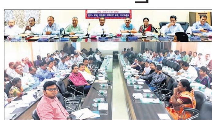
ଦିଶା ବୈଠକରେ ଉପସ୍ଥିତ ଏମ୍‌ପି, ବିଧାୟକ ଓ ଅଧିକାରୀମାନେ।

ବାଲେଶ୍ୱର ଜିଲା ପରିଷଦ ସମ୍ମିଳନୀ କକ୍ଷରେ ରୁଧିରୀଭାବରେ ଆନ୍ଦୋଳନ ଓ ତଦାରଖ କମିଟି (ଦିଶା) ଦ୍ୱିତୀୟ ବୈଠକରେ ବୈଠକ ଅନୁଷ୍ଠିତ ହୋଇଯାଇଛି।