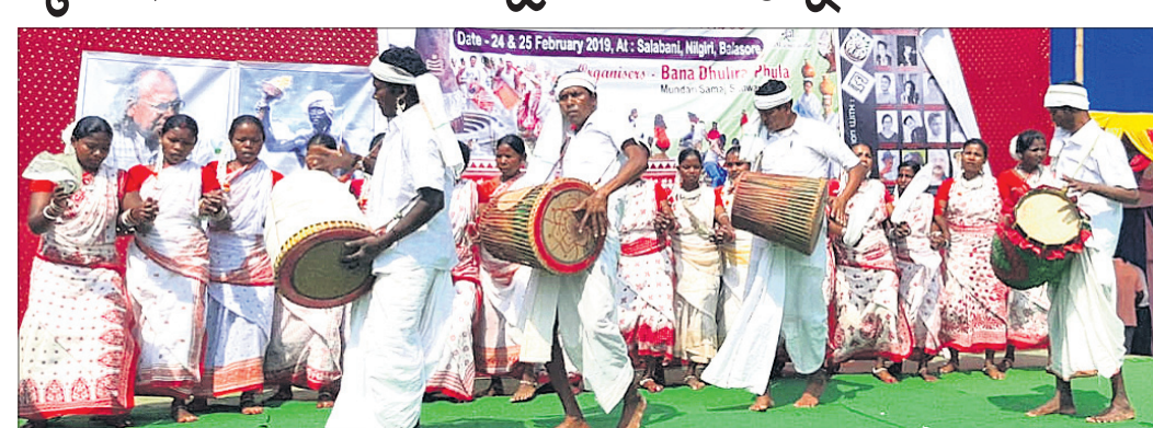
ମଞ୍ଚରେ ଆଦିବାସୀଙ୍କ ମାଦକ ନୃତ୍ୟ।

ବାଲେଶ୍ୱର ଜିଲା ନାକରିରି ବ୍ଲକ୍ ମହିଷାସପତା ପଞ୍ଚାୟତ ନିକେତ୍ତ ସ୍ୱର୍ଣ୍ଣଚୂଡ଼ ପାହାଡ଼ ପାଦଦେଶର ଅପରୂପ ସୌନ୍ଦର୍ଯ୍ୟ ସମଗ୍ରଣୀ ଆକର୍ଷଣ କରିଥାଏ। ଏହି ବଣମୂଳକରେ ବସବାସ କରୁଥିବା ମୁଖ୍ୟତା, ଭୂମିକ, ସାଗ୍ନାଳ, କୋଲୁ, ମାଡ଼ିଆ, ବାପୁଡ଼ି, ଖଡ଼ିଆ ଜନଜାତିଙ୍କ ମଧ୍ୟରେ ପ୍ରତିଭା ଅନୁଷ୍ଠାନ ଲାଗି ଅଭିନବ ପ୍ରୟାସ ନାକରିରି ଜନଜାତି ଉତ୍ସବ ଅନୁଷ୍ଠିତ ହୋଇଯାଇଛି।