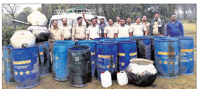
ମଦଭାଟି ଚଢ଼ାଉରେ ଜବତ ସାମଗ୍ରୀ।