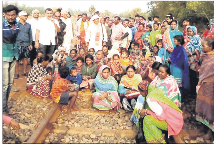
ରେଳ ରୋକ୍ତେ ଆନ୍ଦୋଳନରେ ସାମିଲ ହିଲିକାପୁରୁଷ।

ଦକ୍ଷିଣ-ପୂର୍ବ ରେଳପଥର ଖଡ଼ଗପୁର ଡିଭିଜନ ଅନ୍ତର୍ଗତ ରୁଝା-ବାଲିଚିପୋଷି ରେଳଲାଇନ୍‌ର ଭଗବାନପୁରଠାରେ ନୂତନ ଲିଙ୍କ୍‌ରୋଡ଼ ନିର୍ମାଣ ଦାବିରେ ରୁଧିରୀଭାବରେ ରେଳରୋକ୍ତେ ଆନ୍ଦୋଳନ କରାଯାଇଛି।