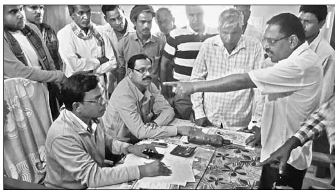
ଭଦଳା ଅଞ୍ଚଳର ଚାଷୀମାନେ ଏଆରସିଏସ୍ ସହିତ ସମ୍ମିଳିତ କରୁଛନ୍ତି।

ଧାନ କିଣା ନ ହେବା ଏବଂ ମିଲର ଓ ଏମଡିଙ୍କ ମଧ୍ୟସ୍ତରୀଣ ଅଭିଯୋଗ ଆଣି ଚାଷୀମାନେ ଲାମାସ୍‌ସ୍ କାର୍ଯ୍ୟାଳୟରେ ଏମଡିଙ୍କ ରୂମରେ ତାଲା ପକାଇବା ସହିତ ଏଆରସିଏସ୍‌ଙ୍କୁ ଘେରି ହୋଇଛାନ୍ତି।