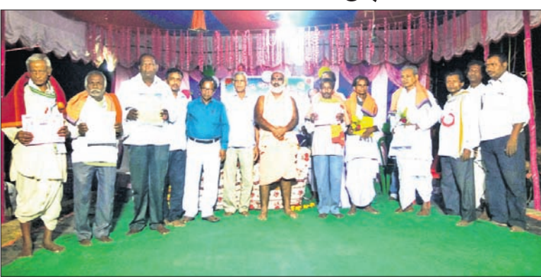
ସମ୍ବନ୍ଧିତ ପ୍ରତିବାକ ସହ ଉପସ୍ଥିତ ଅତିଥି।