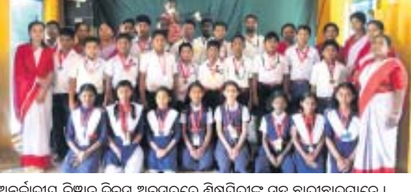
ଅନ୍ତର୍ଜାତୀୟ ବିଜ୍ଞାନ ଦିବସ ଅବସରରେ ଶିକ୍ଷାମନ୍ତ୍ରୀଙ୍କ ସହ ଛାତ୍ରଛାତ୍ରୀମାନଙ୍କର ମିଳନ

ବିଜ୍ଞାନ ଦିବସ ପାଇଁ ସରକାର କାର୍ଯ୍ୟକ୍ରମ ଆରମ୍ଭ କରିଛନ୍ତି। ଏଥିରେ ମାଲକାନଗିରି ପଞ୍ଚାୟତର ମଧ୍ୟରୁ ମାଲକାନଗିରି ପଞ୍ଚାୟତର ମଧ୍ୟରୁ