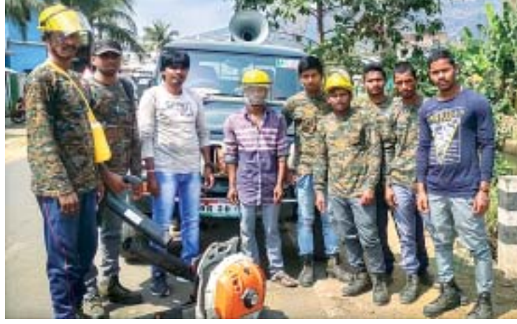
ବନାଞ୍ଚଳ ସ୍ୱାତନ୍ତ୍ର୍ୟ ମିଳିତା ଅଗ୍ନିନିର୍ବାପକ ସରଞ୍ଚାମା।

ବର୍ତ୍ତମାନ ମାଲକାନଗିରି ଜିଲ୍ଲାରେ ଗ୍ରୀଷ୍ମପ୍ରବାହ ଆରମ୍ଭ ହୋଇଲାଣି। ଜିଲ୍ଲାରେ ଠାପମାଡ଼ା ପ୍ରାୟ ୩୯ ଡିଗ୍ରୀ ରହିଛି। ଏହି ସମୟରେ ଜଙ୍ଗଲରେ ନିଆଁ ଲାଗି ଅନେକ ଦୁର୍ଘଟଣା ଏବଂ ବିଭିନ୍ନ ଗଛର ମଞ୍ଜି ପୋଡ଼ି ନଷ୍ଟ ହେବାସହ ବନ୍ୟଜନ୍ତୁଙ୍କ ପାଇଁ ବିପଦ ସୃଷ୍ଟି ହୋଇଥିବା।