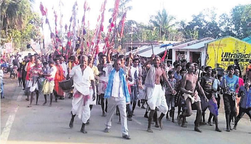
ମାଘ ମଣ୍ଡେଇରେ ଲାଠି, କୁର୍ତ୍ତି ଶୋଭାଯାତ୍ରାରେ ନିଆଯାଇଛି ।