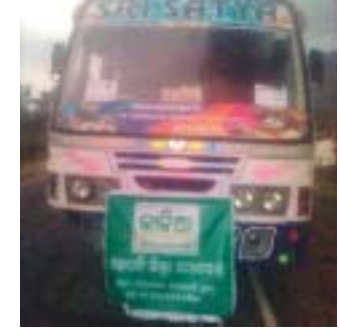
ଦୁର୍ଘଟଣା ଘଟାଇଥିବା ବସ୍।

ଗୋଷାଣି/ପାରଳାଖେମୁଣ୍ଡି, ୨୮୧୨ (ଡି.ଏନ.ଏ./ସ.ପ୍ର.)