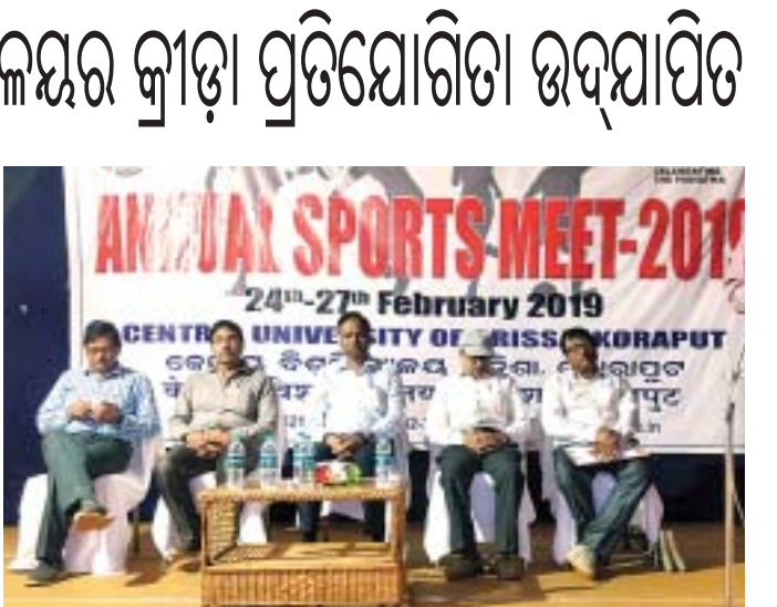
ଉଦ୍‌ଘାଟନା ଉତ୍ସବରେ ଉପସ୍ଥିତ ଅତିଥିମାନେ।

କୋରାପୁଟ, ୨୮୧୨ (ସ.ପ୍ର.) କ୍ରୀଡ଼ା ହେଉଛି ଶିକ୍ଷାର ଏକ ସ୍ୱତନ୍ତ୍ର ଅଙ୍ଗ। କ୍ରୀଡ଼ା କେବଳ ଶାରୀରିକ ଶକ୍ତିକୁ ନୁହେଁ, ବରଂ ମାନସିକ ଶକ୍ତିକୁ ମଧ୍ୟ ଦୃଢ଼ୀକରଣ କରେ।