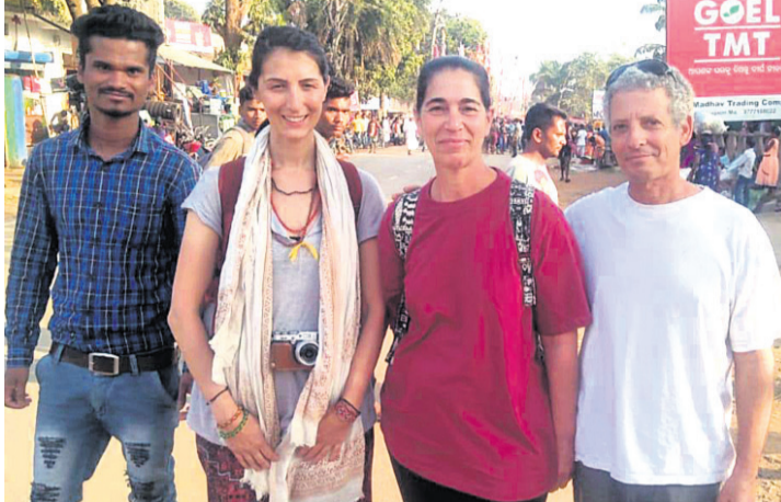
ମଣ୍ଡେଇ ଯାତ୍ରା ଦେଖିବାକୁ ଆସିଥିବା ବିଦେଶୀ ପର୍ଯ୍ୟଟକ

ନବରଙ୍ଗପୁର ଜିଲ୍ଲା ଡାକ୍ତରୀ କ୍ଷେତ୍ରରେ ସର୍ବମୁଖ୍ୟ ଭାବେ ଆଦିବାସୀମାନଙ୍କ ପର୍ଯ୍ୟନ୍ତ ମାଘ ମଣ୍ଡେଇ ଗୁରୁତ୍ଵପୂର୍ଣ୍ଣ ପାଳିତ ହୋଇଯାଇଛି । ରୁଗୀ, ବାଦ୍ୟ, ଡୋଳ, ମାଦକ ଓ ଡୋଳି ପରିବେଶରେ ଶେଷ ହୋଇଛି ଏହି ଉତ୍ସବ । ଏଥିରେ ଡାକ୍ତରୀ କ୍ଷେତ୍ର ସମେତ ଆଖପାଖ ୧୩୦ ଟି ଗ୍ରାମକୁ ଲାଠି, କୁର୍ତ୍ତି ଓ ପାଲିକ ଡୋଳି ପରିବେଶରେ ପୂଜାର୍ଚ୍ଚନା ହୋଇଥିଲା । ପରେ ଅପରାହ୍ଣରେ ସମସ୍ତ ଲାଠି, କୁର୍ତ୍ତି ମା' ବୁଲାଇଦେଇ ମନ୍ଦିରକୁ