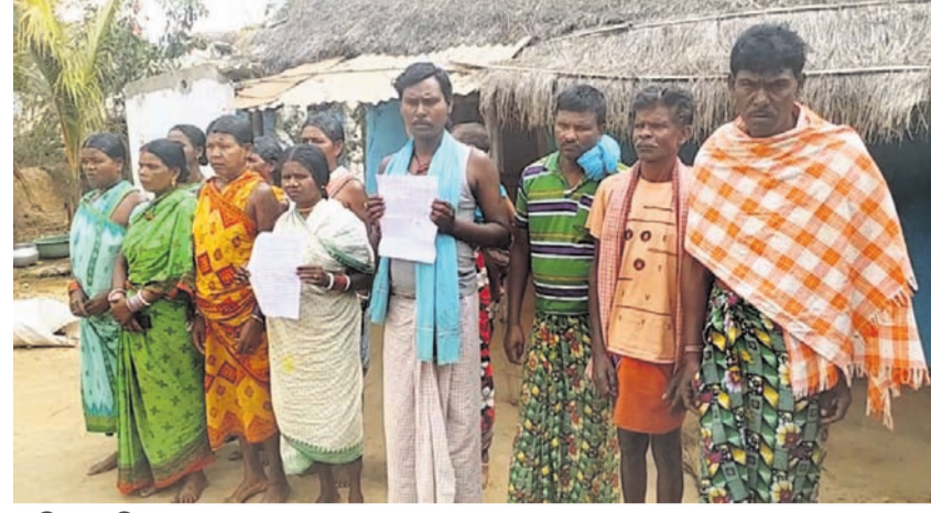
ଶ୍ରମିକଙ୍କ ପରିବାର ଲୋକେ ।