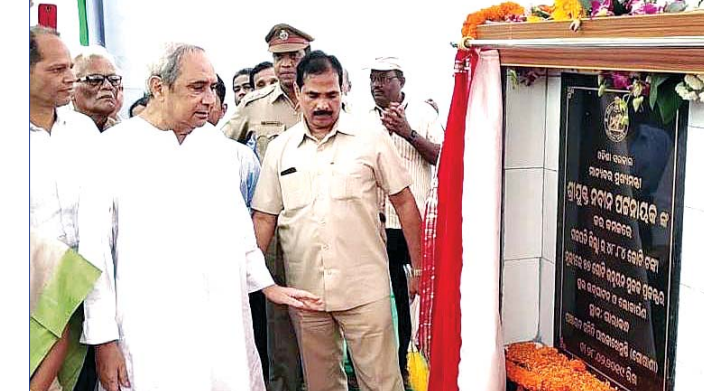
ମୁଖ୍ୟମନ୍ତ୍ରୀ ନବୀନ ପଟ୍ଟନାୟକ ବିଭିନ୍ନ ପ୍ରକଳ୍ପର ଲୋକାର୍ପଣ କରୁଛନ୍ତି।

ପାରଳାଖେମୁଣ୍ଡି ସହରରୁ ଗଜପତି ଅବତରଣ କରିଥିଲେ। ଚାଲୁ ଲିଲା ପ୍ରଶାସନ ଷ୍ଟାଡ଼ିୟମରେ ନିର୍ମିତ ହେଲିପ୍ୟାଡରେ ପକ୍ଷରୁ ସ୍ୱାଗତ କରାଯାଇଥିଲା। ପୁଷ୍ପା-୪