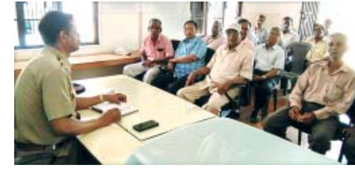
କାର୍ଯ୍ୟକ୍ରମରେ ପୋଲିସ୍ ସହ ବରିଷ୍ଠ ଅଧିକାରୀମାନେ ଆଲୋଚନା କରୁଛନ୍ତି।