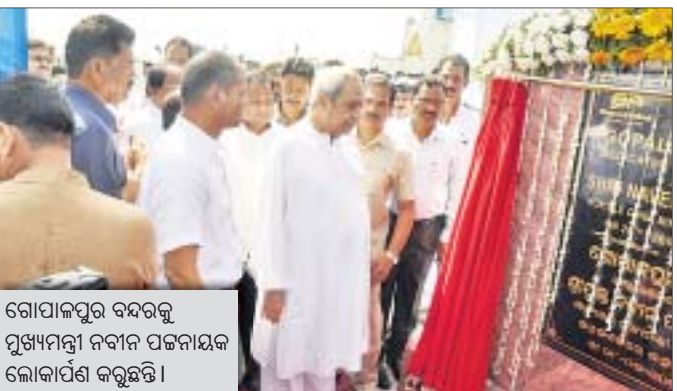
ଗୋପାଳପୁର ବନ୍ଦରକୁ ମୁଖ୍ୟମନ୍ତ୍ରୀ ନବୀନ ପଟ୍ଟନାୟକ ଲୋକାର୍ପଣ କରୁଛନ୍ତି।

ଛତ୍ରପୁର/ଶେରଗଡ଼/ବିନପହଣ୍ଡି/ପାଟପୁର, ୨୮୧୨ (ଡି.ଏନ.ଏ.)