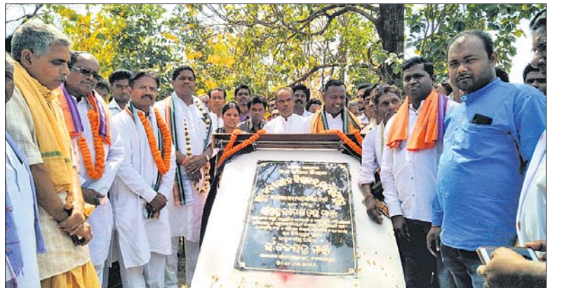
ମନ୍ତ୍ରୀ ଓ ଏମ୍ପି ବିକାସ ପ୍ରକଳ୍ପର ଶିଳାନିଧାସ କରୁଛନ୍ତି ।