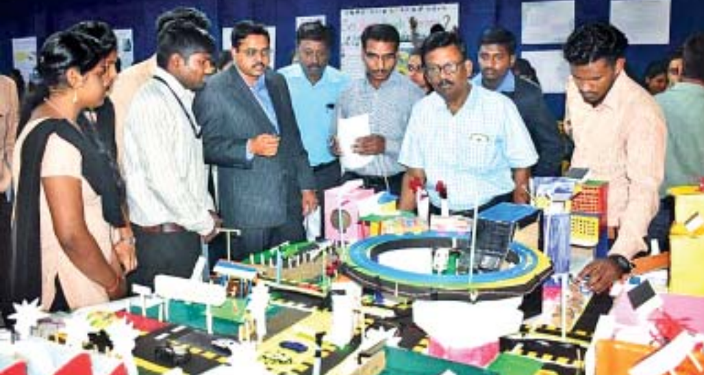
ଅତିଥିମାନେ ବିଜ୍ଞାନ ପ୍ରକଳ୍ପ ବୁଲି ଦେଖୁଛନ୍ତି।