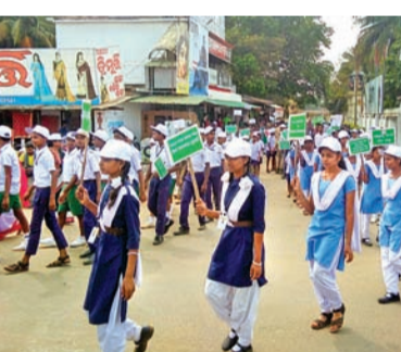
ସଚେତନତା ଶୋଭାଯାତ୍ରାରେ ସାମିଲ ହୋଇଥିବା ଛାତ୍ରଛାତ୍ରୀମାନେ ।

ନବରଙ୍ଗପୁର ଜିଲ୍ଲା ଡାକ୍ତରୀ କ୍ଷେତ୍ରରେ ଖାତିରୁଡ଼ାରେ ଜିଲ୍ଲା ବନବିଭାଗ ପକ୍ଷରୁ ସୂକ୍ଷ୍ମ ଓଡ଼ିଶା, ପୁସ୍ତକ ଓ ଗାଁ କଲ୍ୟାଣ ମାଧ୍ୟମରେ ପଲିଥିନ ବର୍ଜନ ପାଇଁ ସଚେତନତା କରାଯାଇଛି । ସରସ୍ଵତୀ ଶିଳ୍ପ ବିଦ୍ୟାଳୟ, ଶ୍ରୀଅରବିନ୍ଦ ପୁରୁଣା ଶିକ୍ଷାକେନ୍ଦ୍ର ଓ ଲମ୍ବାବତୀ ଉଚ୍ଚ ବିଦ୍ୟାଳୟ ଛାତ୍ରଛାତ୍ରୀ ଏହି