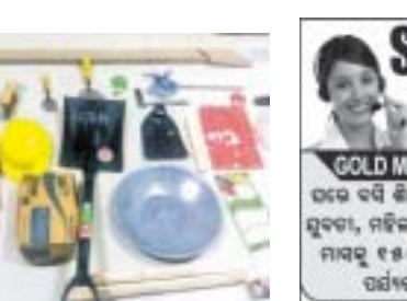
ଶ୍ରମିକମାନଙ୍କୁ ପ୍ରଦାନ କରାଯାଇଥିବା ପଦାର୍ଥଗୁଡ଼ିକର ଉପକରଣ।

ମାଲକାନଗିରି ଜିଲ୍ଲାରେ ପ୍ରତିବର୍ଷ ବାଦଳ ଖର୍ଚ୍ଚ ବାହାରେ ଶ୍ରମିକମାନଙ୍କୁ ସୁବିଧା ପ୍ରଦାନ କରାଯାଇଛି। ଏହାଛଡା ଶ୍ରମିକମାନଙ୍କୁ ସୁବିଧା ପ୍ରଦାନ କରାଯାଇଛି।