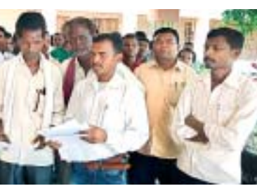
କୋଟି କୋଟି ଆଦିବାସୀ ଯେଉଁ ଗ୍ରହଣ ହେବେ

ଏକ ଦାବିପତ୍ର ପ୍ରଦାନ କରିଛନ୍ତି। ଏହି ଦାବିପତ୍ରରେ ଗତ ୧୩ ତାରିଖରେ ସର୍ବୋଚ୍ଚ ନ୍ୟାୟାଳୟ ଭାରତର ୨୧ ରାଜ୍ୟରେ ୧୧ ଲକ୍ଷ ୨୭ ହଜାର ୪୭୬ ଜଣ ଆଦିବାସୀ ପରିବାର ଜଙ୍ଗଲ ମଧ୍ୟରେ ଘର କରିଥିବା ଏବଂ ତାହା କରୁଥିବା ନେଇ