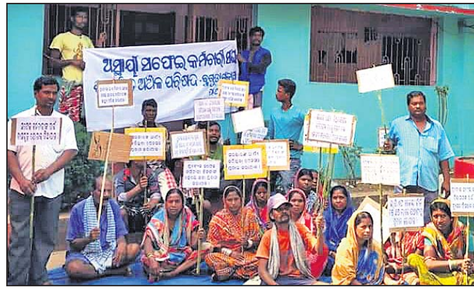
ଧାରଣାରେ ସଫେଇ କର୍ମଚାରୀ