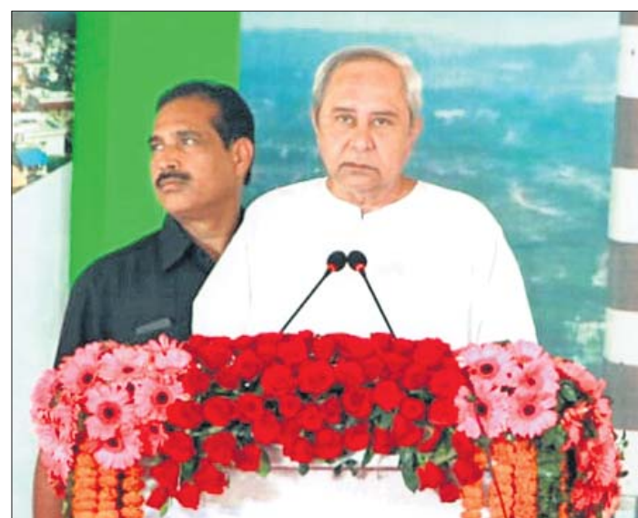
ମୁଖ୍ୟମନ୍ତ୍ରୀ ନବୀନ ପଟ୍ଟନାୟକ ଉଦ୍‌ଘାଟନ କଲେ ଓଡ଼ିଶା ବିଦ୍ୟୁତ୍ କ୍ଷେତ୍ରରେ ଇତିହାସ ସୃଷ୍ଟି କଲେ।