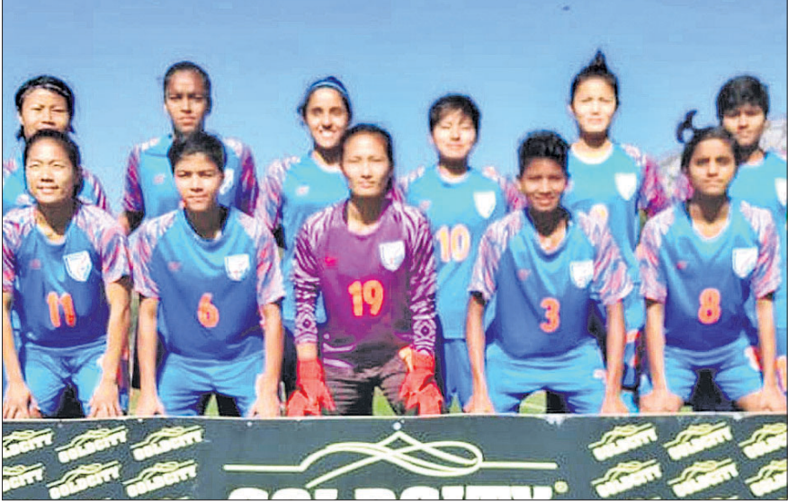
ଭାରତୀୟ ମହିଳା ଫୁଟବଲ ଦଳ।

ତୁର୍କମେନିସ୍ତାନ ବିପକ୍ଷ ମ୍ୟାଚର ୧୭, ୩୭ ଓ ୬୧ତମ ମିନିଟରେ ଗତି ଗୋଲ ଦେଇ ସଞ୍ଜୁକ୍ତ ତଳିତ। ତୁର୍କମେନିସ୍ତାନ ବିପକ୍ଷ ମ୍ୟାଚର ୧୭, ୩୭ ଓ ୬୧ତମ ମିନିଟରେ ଗତି ଗୋଲ ଦେଇ ସଞ୍ଜୁକ୍ତ ତଳିତ।