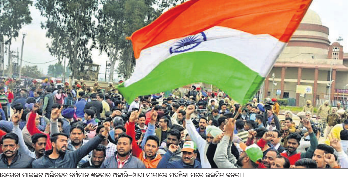
ବାୟୁସେନା ପାଇଲଟ ଅଭିନନ୍ଦନ ବର୍ଥମାନ ଶୁକ୍ରବାର ଅଜାରି-ଓଘା ସାମାଜରେ ପହଞ୍ଚିବା ପରେ ଭଲଭିତ ଜନତା।