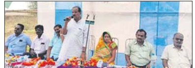
ବୈଠକରେ ବିଧାୟକ ଓ ଅନ୍ୟମାନେ। ରାଜ୍ୟରେ ପ୍ରଚଳିତ ଧାରାକୁ ଅଧିକ ଗଠିତ କରିବା ଲାଗି ନବୀନ ସରକାରଙ୍କୁ ପୁନଃ କ୍ଷମତାଶୀଳ କରିବା ଦିଗରେ ସଂକଳ୍ପବଦ୍ଧ ହେବାକୁ ଆସିକା ବିଧାନସଭା ନିର୍ବାଚନମଣ୍ଡଳ ବିଜେଡି ପକ୍ଷରୁ ଶୁଭକାରୀ ଆସିକା ବ୍ଲକ୍ ସରକାରଙ୍କୁ ପଞ୍ଚାୟତ ଠାକୁରାଣୀ ମନ୍ଦିର ନିକଟରେ ଖାର୍ଚ୍ଚକମିଟି ବୈଠକ ଅନୁଷ୍ଠିତ ହୋଇଯାଇଛି।

ଆସିକା ବିଧାନସଭା ନିର୍ବାଚନମଣ୍ଡଳ ବିଜେଡି ପକ୍ଷରୁ ଶୁଭକାରୀ ଆସିକା ବ୍ଲକ୍ ସରକାରଙ୍କୁ ପଞ୍ଚାୟତ ଠାକୁରାଣୀ ମନ୍ଦିର ନିକଟରେ ଖାର୍ଚ୍ଚକମିଟି ବୈଠକ ଅନୁଷ୍ଠିତ ହୋଇଯାଇଛି।