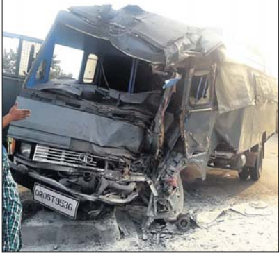
ଦୁର୍ଘଟଣାଗ୍ରସ୍ତ ସୋଲିସି ଭ୍ୟାନ । ବାଇପାସ ରାସ୍ତା ନିକଟରେ ଛତିଶଗଡ଼ରୁ ଆସୁଥିବା ଏକ ମାଲବାହି ଟ୍ରକ୍ (ନଂ. ସିଜିଏସ୍-୧୧୧୧-୪୧୧୭) ଓ ଭ୍ୟାନ (ନଂ. ଓଆର୍ଏସ୍-୧୨-୯୫୩୬) ମଧ୍ୟରେ ମହାଘାତ ଘଟିଥିଲା ।

୪୯ ନମ୍ବର ଜାତୀୟ ରାଜପଥ ଝାରସୁଗୁଡ଼ା ଜିଲ୍ଲା ବେଲପାହାଡ଼ ଶିଳିମିରି ନିକଟ ଶୁକ୍ରବାର ସକାଳେ ଏକ ମର୍ମହୀନ ଦୁର୍ଘଟଣା ଘଟିଛି ।