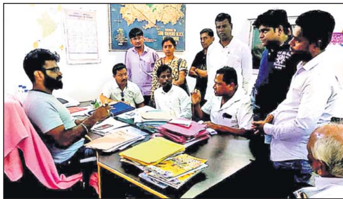
ବିତିଡ଼ଙ୍କ ସହ ଜନପ୍ରତିନିଧିଙ୍କ ଆଲୋଚନା।

ସାନଖେପୁଣ୍ଡି ବ୍ଲକ ପ୍ରଶାସନ ପକ୍ଷରୁ ପଞ୍ଚାୟତର ନିର୍ବାଚିତ ଜନପ୍ରତିନିଧିମାନଙ୍କୁ ଅଣଦେଖା କରାଯାଉଥିବା ଅଭିଯୋଗ ହୋଇଛି। ସରପଞ୍ଚ, ସମିତିସଭାମାନଙ୍କ ଅକାର୍ଯ୍ୟତାରେ ବିଭିନ୍ନ ସରକାରୀ ପ୍ରକଳ୍ପ ନିମନ୍ତେ ଅନୁମତି ମଞ୍ଜୁର କରାଯାଇଛି। ବିନା ପଲ୍ଲୀସଭା, ଗ୍ରାମସଭାରେ ସାମାଜିକ ସୁରକ୍ଷା ସମ୍ପର୍କିତ ହିତାଧିକାରୀ ଚୟନ କରାଯାଇଛି। ପଞ୍ଚାୟତର ବିନା ଅନୁମୋଦନରେ କିଛି ନିର୍ଦ୍ଦିଷ୍ଟ ବ୍ୟକ୍ତିଙ୍କୁ କାର୍ଯ୍ୟାଳୟ ପ୍ରଦାନ କରାଯାଇଛି।