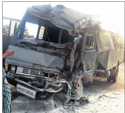
ଦୁର୍ଘଟଣାଗ୍ରସ୍ତ ସୋଲିସ ଭ୍ୟାନ।

୪୯ ନମ୍ବର ଜାତୀୟ ରାଜପଥ ଝାରସୁଗୁଡ଼ା ଜିଲ୍ଲା ବେଲପାହାଡ଼ ଶିଳ୍ପାଦାନ ନିକଟ ଶୁକ୍ରବାର ସକାଳେ ଏକ ମର୍ମହୀନ ଦୁର୍ଘଟଣା ଘଟିଛି ।