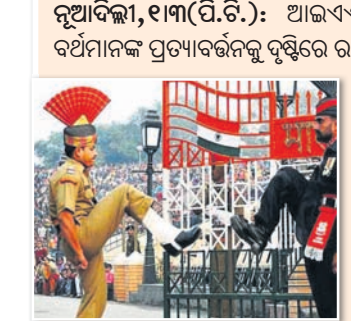
ଧୂଜାବତରଣ ଉତ୍ସବ ବନ୍ଦ କରିବା ପାଇଁ ପ୍ରଶାସନ ପକ୍ଷରୁ ଅନୁରୋଧ କରାଯାଇଥିଲା।

ପକ୍ଷରୁ ଅଜାରି-ଘାଘା ବର୍ତ୍ତରରେ ଶୁକ୍ରବାର ଧୂଜାବତରଣ ଉତ୍ସବକୁ ବାତିଲ କରି ଦିଆଯାଇଛି।