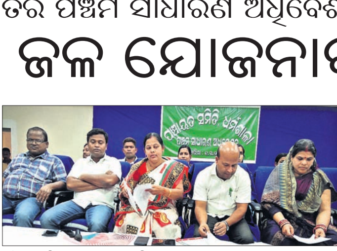
ବୈଠକରେ ବିଧାୟକଙ୍କ ସମେତ ଉପସ୍ଥିତ ଅନ୍ୟ ଅଧିକାରୀ।