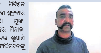
ପୁଣ୍ଡ କରିବା ପାଇଁ ପ୍ରଧାନମନ୍ତ୍ରୀ ଜମ୍ମିନ୍ ଖାନ୍ ଗୁରୁବାର ପାଇଁମେଣ୍ଟର ମିଳିତ ଅଧିବେଶନରେ ଘୋଷଣା କରିଛନ୍ତି।

ଭାରତୀୟ ବାୟୁସେନା ପାଇଲଟ ଅଭିନନ୍ଦନ ବର୍ଥମାନଙ୍କୁ ନ ମୁକ୍ତକରିବା ପାଇଁ ଇସ୍ଲାମାବାଦ ହାଇକୋର୍ଟରେ ଏକ ପିଟିଶନ ଦାଏର ହୋଇଥିଲା।