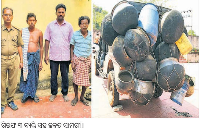
ଗିରଫ ୩ ବ୍ୟକ୍ତି ସହ ଜବତ ସାମଗ୍ରୀ ।

ପଡ଼ୁରିଆ, କୁମାରଖଣା ଆଦି ଗ୍ରାମର ବହୁ ଚାଷୀ ନଦୀକୂଳରେ ପନିପରିବା ଚାଷ କରି ଜୀବିକା ନିର୍ବାହ କରୁଛନ୍ତି । ପୁନରାବିଷ୍କୃତି, ୧୯୯୫ରୁ ୨୦୦୦ ମସିହା ମଧ୍ୟରେ ଗଣିଆ ବ୍ଲକର ଛାମୁଣିଆ, ଶିଶୁପୁର, ରାଉତପଡ଼ା ଓ ପଡ଼ୁରିଆଠାରେ ଉଠାଇକସେଚନ ପ୍ରକଳ୍ପ ନିର୍ମାଣ କରାଯାଇଥିଲା । ତେବେ ନିମ୍ନମାନର କାର୍ଯ୍ୟ ହେତୁ ଏହି ପ୍ରକଳ୍ପଗୁଡ଼ିକ ଆରମ୍ଭରୁ ଅଟକ ହୋଇପଡ଼ିଛି । ଫଳରେ ଜଳସେଚନ ସୁବିଧା ଅଞ୍ଚଳର ଚାଷୀମାନଙ୍କ ପାଇଁ ସାତସପନ ପାଲଟିଛି । ବର୍ଷା ଦିନ ବ୍ୟତୀତ ଅନ୍ୟ ଦିନଗୁଡ଼ିକରେ ଶହ ଶହ ଏକର ଚାଷକ୍ଷମି ପଡ଼ିଆ ପଡୁଥିବା ଦେଖିବାକୁ ମିଳୁଛି । ଅଞ୍ଚଳରେ ଜଳସେଚନ ସୁବିଧା ପାଇଁ ନିର୍ବାଚିତ ଲୋକପ୍ରତିନିଧି ଓ ଜିଲା ପ୍ରଶାସନ ନିକଟରେ ବହୁବାର ଦାବି କରିଆସୁଥିଲେ ମଧ୍ୟ କେବେକି ପ୍ରତିଶ୍ରୁତି ମିଳୁଛି । ଅଟକ ହୋଇପଡ଼ିଥିବା ଜଳସେଚନ ପ୍ରକଳ୍ପଗୁଡ଼ିକୁ ପୁଣିଥରେ କାର୍ଯ୍ୟକ୍ଷମ କରାଯାଇ ଚାଷକର୍ମୀଙ୍କୁ ଜଳସେଚନ ସୁବିଧା କରାଗଲେ ଚାଷୀମାନେ ଉପକୃତ ହୋଇପାରନ୍ତେ ବୋଲି ଚାଷୀ ଲକ୍ଷାଧିକ ସାମଲ କହିଛନ୍ତି ।