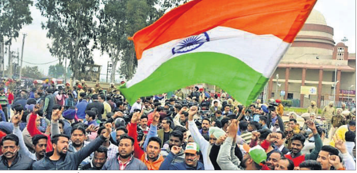
ବାୟୁସେନା ପାଇଲଟ ଅଭିନନ୍ଦନ ବର୍ଥମାନ ଶୁକ୍ରବାର ଅଜାରି-ଓଘା ସୀମାରେ ପହଞ୍ଚିବା ପରେ ଉଲ୍ଲାସରେ ଜନତା।

କାର୍ଯ୍ୟସୂଚୀରେ ପରିବର୍ତ୍ତନ ସମ୍ଭାବନା ଅଛି କି ବୋଲି ଉତ୍ତରପ୍ରଦେଶରେ ନିର୍ବାଚନ ପ୍ରସ୍ତୁତି ସମୀକ୍ଷା ଅବସରରେ ଖବରଦାତାଙ୍କ ପ୍ରଶ୍ନରେ ସେ ଉପରୋକ୍ତ ଉତ୍ତର ଦେଇଛନ୍ତି। ନୂଆ ବିଜୟ ଅନୁଯାୟୀ ପ୍ରାର୍ଥୀଙ୍କୁ ଦେଶ ଭିତରେ ଥିବା ସେମାନଙ୍କ ସମ୍ପର୍କିତ ସମ୍ପତ୍ତି ବିବେଚନାରେ ଥିବା ସମ୍ପର୍କିତ ସର୍ବଶେଷ ବିବରଣୀ ଦେବାକୁ ହେବ। ଆୟକର ବିଭାଗ ଏହାକୁ ଅନୁଧ୍ୟାନ କରିବ।