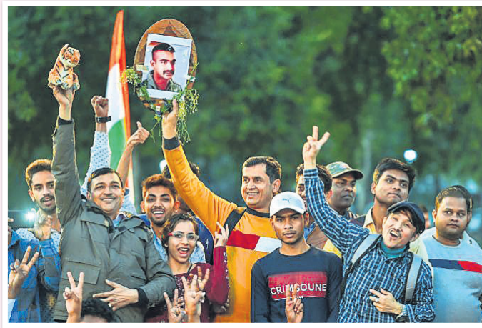
ବାୟୁସେନା ପାଇଲଟ ଅଭିନନ୍ଦନଙ୍କୁ ମୁକ୍ତି ନେଇ ନୂଆଦିଲ୍ଲୀରେ ଉତ୍ସବ ମନାଉଛନ୍ତି ଲୋକେ।

କନ୍ୟାକୁମାରୀ, ୧୩୩(ପି.ଟି.): ଫୁଲ୍ କମାଣ୍ଡର ଅଭିନନ୍ଦନ ବର୍ଥମାନଙ୍କୁ ନେଇ ସାରା ଦେଶ ଗର୍ବିତ ହୋଇ ପ୍ରଧାନମନ୍ତ୍ରୀ ନରେନ୍ଦ୍ର ମୋଦି କହିଛନ୍ତି।