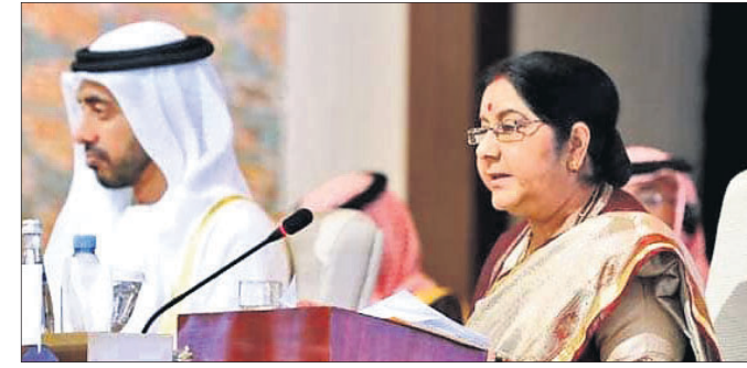
ତେଣୁ ଯେଉଁ ରାଷ୍ଟ୍ର ଆତଙ୍କବାଦୀ ସଂଗଠନଗୁଡ଼ିକୁ ସହାୟତା ଓ ସମର୍ଥନ ଦେଉଥିବା ନିବୃତ୍ତ ରହିବାକୁ ବହିର୍ଦ୍ଦେଶୀୟ ମନ୍ତ୍ରୀ ଆହ୍ଲାନ୍ ଦେଇଛନ୍ତି।

ଇସ୍ଲାମାବାଦ ସହଯୋଗ ସଂଗଠନ (ଓଆଇସି) ବୈଦେଶିକ ମନ୍ତ୍ରୀମାନଙ୍କ ସମ୍ମିଳନୀରେ ବହିର୍ଦ୍ଦେଶୀୟ ମନ୍ତ୍ରୀ ସୁସମା ସ୍ୱରାଜ ସମ୍ମାନିତ ଅଟିଥିବାବେଳେ ଯୋଗଦେଇ ଆତଙ୍କବାଦ ବିରୋଧରେ ଲଢ଼େଇ ପାଇଁ ଆହ୍ଲାନ୍ ଦେଇଛନ୍ତି।