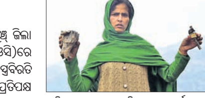
ପାକିସ୍ତାନ ସେନା ମାଡ଼ କରିଥିବା ଏକ ମୋର୍ଗୁରୁକୁ ପୁଣ୍ଡ ସେକ୍ଟର ମେନ୍‌ରାଜ କଣ୍ଠେ ମହିଳା ଦେଖାଉଛନ୍ତି।

କମ୍ପ୍ୟୁ-କମ୍ପାନର ରାଜୋରି ଓ ପୁଣ୍ଡ କିଲ୍ଲୀ ସଂଲଗ୍ନ ନିୟନ୍ତ୍ରଣରେଖା (ଏଲ୍‌ଏସ୍‌ଆର୍)ରେ ଜୁମାଗତ ୮ ଦିନ ଧରି ଅସ୍ତବିରତି ଉଲ୍‌ଘନ କରିଛି ପାକିସ୍ତାନ।