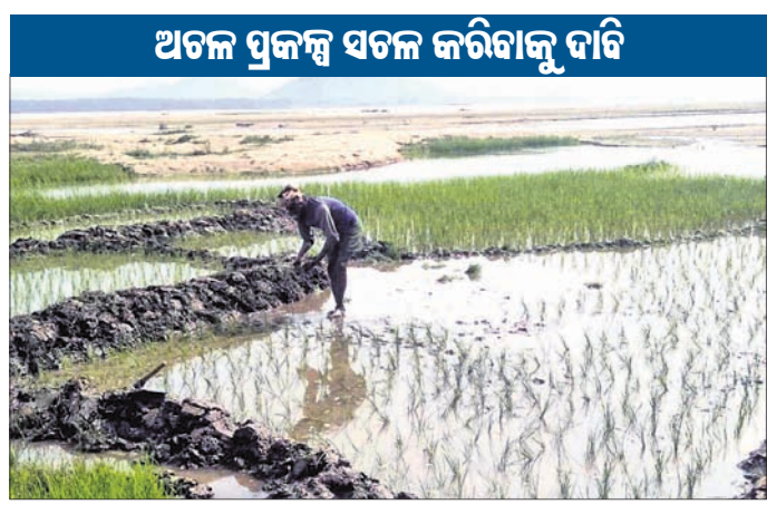
ମହାନଦୀ ପଠାରେ ଜଣେ ଚାଷୀ ଧାନଚଳି ପୋଡୁଛନ୍ତି ।

ଗଣିଆ ବ୍ଲକ୍ ଦେଇ ମହାନଦୀ, ବୃତ୍ତ ନଦୀ ପ୍ରବାହିତ ହେଉଥିବାବେଳେ ଖଳଖଳା ନାଳ ଭଳି ଜଳଭଣ୍ଡ ରହିଛି । ଏହା ସତ୍ତ୍ୱେ ଚାଷକର୍ମୀଙ୍କୁ ଜଳସେଚନ ବ୍ୟବସ୍ଥା ହୋଇପାରି ନାହିଁ । ମହାନଦୀ ଅବବାହିକାରେ ଛାମୁଣିଆ ପଞ୍ଚାୟତର ବଟପୁରଠାରୁ କିଶୋରପ୍ରସାଦ ପଞ୍ଚାୟତର ପଡ଼ୁରିଆ ଗ୍ରାମ ମଧ୍ୟରେ ୨୦୦୦ ଟଳେ କୋଟି କୋଟି ଟଙ୍କା ବ୍ୟୟରେ ୪ଟି ଉଠାଇକସେଚନ ପ୍ରକଳ୍ପ ନିର୍ମାଣ କରାଯାଇଥିଲା । ହେଲେ ଆରମ୍ଭରୁ ଏହି ପ୍ରକଳ୍ପଗୁଡ଼ିକ ଅଟକ ହୋଇ ପଡ଼ିରହିଛି