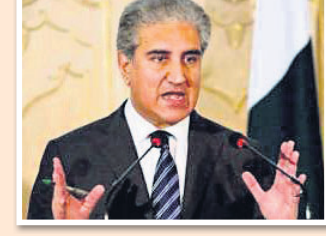
ପାକିସ୍ତାନ ସହଯୋଗ ସଂଗଠନର ପ୍ରତିଷ୍ଠାତା ସଦସ୍ୟ ହୋଇ ମଧ୍ୟ ପାକିସ୍ତାନ ଏହାର ବୈଠକକୁ ବର୍ଜନ କରିଛି।

ତେବେ ତାଙ୍କର ଅନୁରୋଧକୁ ଆୟୋଜକ ରାଷ୍ଟ୍ର ପ୍ରତ୍ୟାଖ୍ୟାନ କରିଦେବାକୁ ସେ ଉକ୍ତ ସମ୍ମିଳନୀରେ ଯୋଗଦେବେ ନାହିଁ ବୋଲି ପାର୍ଲିମେଣ୍ଟକୁ ସୂଚନା ଦେଇଛନ୍ତି।