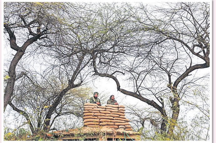
ପାଇଲଟ ଅଭିନନ୍ଦନ ବର୍ଥମାନ ଅଜାରି-ଘାଘା ସୀମାରେ ପହଞ୍ଚିବା ପରେ ନିକଟସ୍ଥ ଏକ ସେନା ଘାଟିରେ ସକାର ପୁରଣା ବନ୍ଧ।