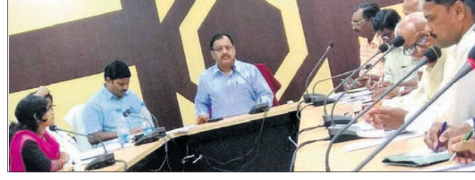
ବୈଠକରେ ଜିଲାପାଳଙ୍କ ସହିତ ଅନ୍ୟ ଅଧିକାରୀ।