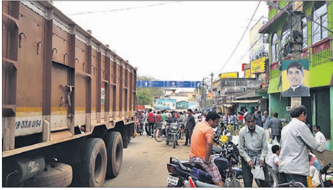
ପରିବା ଗୋଦାନ ସ୍ଥାନାନ୍ତର ନ ହେବାରୁ ଦେଖାଦେଇଥିବା ଗ୍ରାମିକ ସମସ୍ୟା ।

ଗତ ୧୧ ତାରିଖରେ ନୟାଗଡ଼ ଏନ୍ଏସିକୁ ମୁ୍ୟନିସିପାଲିଟି ଘୋଷଣା କରାଗଲା । ୨୩ ତାରିଖରେ ଏ ନେଇ ପୁରୁଣା ବସ୍ତାଘାଟରେ ଧୁମ୍‌ଧାମ୍‌ରେ ଉଦ୍‌ଘାଟନା ଉତ୍ସବ ପାଳନ ହେଲା । ହେଲେ ପୂର୍ବଭଳି ସହରରେ ବିଭିନ୍ନ ସମସ୍ୟା ଲାଗି ରହିଛି । ବକାଳରେ କୁଡ଼ କୁଡ଼ ଅଳିଆ ଅପରାହ୍ଣ ପର୍ଯ୍ୟନ୍ତ ଗପା ହୋଇ ରହୁଛି । ବିଶେଷ କରି ସହର ମଝିରେ ଥିବା ପରିବା ଗୋଦାନ ସ୍ଥାନାନ୍ତର ହୋଇପାରି ନାହିଁ । ଏହାକୁ ନେଇ ସୃଷ୍ଟି ହେଉଥିବା ଗ୍ରାମିକ ସମସ୍ୟା ଲୋକଙ୍କୁ ଅତିଷ୍ଠ କରିଦେଉଛି । ଏହାର ସମାଧାନ ପାଇଁ ବିଭିନ୍ନ ମହଲରେ ଦାବି ହେଉଥିବା ବେଳେ ପ୍ରଶାସନ ନିରାସ୍ତ୍ର ସାଧିତ୍ୱାଦେ ବେଶ୍‌ବାଳୁ ମିଳୁଛି । ସହରରେ ରହୁଥିବା ଜଣେ ବୁଦ୍ଧିବାକୀ କହିବା କଥା ହେଲା, ପୌରପାଳିକା ହୋଇଗଲେ କ'ଣ ହେବ, ସହରବାସୀଙ୍କ ସମସ୍ୟା ସମାଧାନ କିପରି ହେବ ପ୍ରଶ୍ନ ପଚାରିଲେ ପୌରପାଳିକା କହିଲେ ପ୍ରଶ୍ନର ଉତ୍ତର ଦେଲେ ନାହିଁ । ପ୍ରକାଶ ଯେ, ସହର ମଝିରେ ଥିବା ପରିବା ଗୋଦାନକୁ ସ୍ଥାନାନ୍ତର ପାଇଁ ବିଭିନ୍ନ ମହଲରୁ ଦାବି ହେବା ପରେ ଅଗାଧ ୨ ଏପ୍ରିଲ ୨୦୧୮ରେ ତତ୍କାଳୀନ ଜିଲାପାଳ