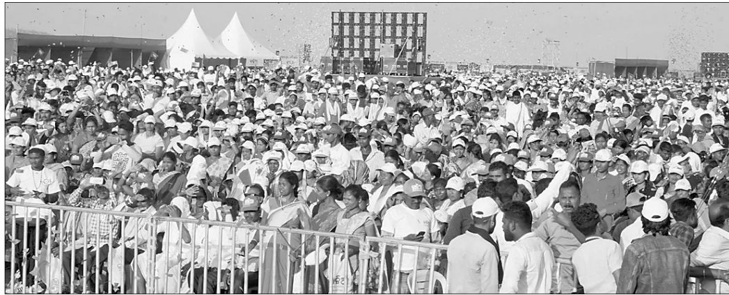
ରାଜ୍ୟରେ କାଳିଆ ଚାଷୀ ସମାବେଶରେ ଯୋଗଦେଇଥିବା ଚାଷୀମାନେ।

ମୋ ସରକାର ଗରିବ, ଚାଷୀ ମୂଲ୍ୟାଙ୍କନ ସରକାର କୃଷକଙ୍କ ଉନ୍ନତି ମୋ ସରକାର ମୂଳ ଲକ୍ଷ୍ୟ। ସେଥିପାଇଁ କୃଷକଙ୍କ ସମୂହ ପାଇଁ କାଳିଆ ଯୋଜନା କରାଯାଇଛି। ବାପୁଜୀଙ୍କ ସହିତ ଯୋଜନା ଓଡ଼ିଶାକୁ ନୂଆ ପରିଚୟ ଦେଇଛି। ଏହା ଦ୍ୱାରା ନାମମାତ୍ର କୃଷକଗଣ, ଭାଗଚାଷୀ ଓ କମି ନ ଥିବା ଚାଷୀ ଉପକୃତ ହୋଇପାରିବେ ବୋଲି ଶୁଭ୍ରବାର ରାଜ୍ୟରେ କାଳିଆ ଚାଷୀ ସମାବେଶରେ ଉଦ୍‌ଘୋଷଣା କରାଯାଇଛି।