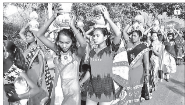
ନାମୟଙ୍କ ପାଇଁ ଗ୍ରାମବାସୀ କଳସଯାତ୍ରାରେ ପେଖରୀକୁ ଜଳ ଆଣୁଛନ୍ତି।

କୋକସରା, ୧୩(ଡି.ଏନ.ଏ.) କଳାହାଣ୍ଡି ଜିଲ୍ଲା କୋକସରା ରୁକ୍ମିଣୀ ଆପାପାଣି ଯାତ୍ରାରେ ଶୁକ୍ରବାର ସକାଳ ପ୍ରାୟ ୮ଟାରେ କଳସପୁର ପବ୍ଲୁ ଆପାପାଣି ସାଗରପତ୍ରକୁ ମାଛ ନେଇ ଆସୁଥିବା ଏକ ପିକଅପ୍ ଗାଡ଼ି (ନ. ଓଆର-୧୦୯୦୨-୯୩୦୨) ଆପାପାଣି ଯାତ୍ରା ବୁଲୁଣିରେ ଭାରସାମ୍ୟ ହରାଇ ଉଲଟି ପଡ଼ିଥିଲା। ଫଳରେ ଗାଡ଼ିରେ ଥିବା ମାଛ ରାସ୍ତାରେ ବିଛେଇ ହୋଇ ପଡ଼ିଥିଲା। ଗାଡ଼ି ଡ୍ରାଇଭରଙ୍କ ସମେତ ଅନ୍ୟ ଜଣେ ଅଧିକାରୀଙ୍କ ଯାତ୍ରା ଉପରେ ଧ୍ୟାନ ଦେଇ ଅଧିକାରୀଙ୍କୁ ଯାତ୍ରାରେ ଘାତୀ ହୋଇଥିବା ନେଇ ଗୋଟିଏ ଅଭିଯୋଗ ହୋଇ ନ ଥିବା ପ୍ରକାଶ କରିଛି। ଏଥିପ୍ରତି ପ୍ରଶାନ୍ତ ଦୁର୍ଘଟଣା ଉପରେ ଦାୟିତ୍ୱ ନେବାକୁ ଯାଆରଣେ ଦାବି ହେଉଛି।