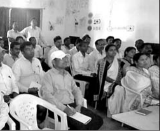
ଉତ୍ସବ-ଉତ୍ସାହ ପ୍ରଶିକ୍ଷଣ ଶିବିର ଉଦ୍‌ଘାଟିତ ହୋଇଯାଇଛି ।

ନୁଆପଡ଼ା ଅଧିକ, ୧୩୫୩ ନୂଆପଡ଼ା ବ୍ଲକ ଗୋଷ୍ଠୀ ଶିକ୍ଷା କାର୍ଯ୍ୟାଳୟର ପ୍ରତ୍ୟକ୍ଷ ତତ୍ତ୍ୱାବଧାନରେ ବ୍ଲକର ବିଭିନ୍ନ କେନ୍ଦ୍ରରେ ବ୍ଲକସ୍ତରୀୟ ଉତ୍ସବ-ଉତ୍ସାହ ପ୍ରଶିକ୍ଷଣ ଶିବିର ଉଦ୍‌ଘାଟିତ ହୋଇଯାଇଛି ।