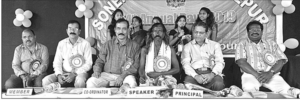
ଉତ୍ସବରେ ମହାସାଧନ ଅତିଥି ବୃନ୍ଦ ।