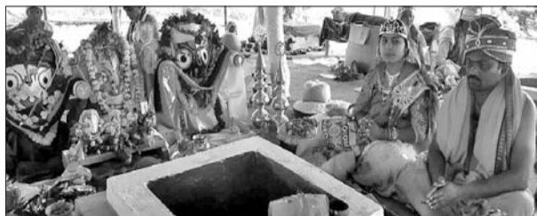
ମିହିର ପ୍ରତିଷ୍ଠା ଓ ବିଗ୍ରହ ସ୍ଥାପନ ପାଇଁ ପୂଜାର୍ଚ୍ଚନା କରାଯାଇଛି।

ରୁଧିରା ହିମା ପରୀକ୍ଷା ପରେ ସମ୍ପୂର୍ଣ୍ଣ କେନ୍ଦ୍ରର ଛାତ୍ରଛାତ୍ରୀଙ୍କୁ ବୋର୍ଡ଼ ଆସିଥିବା ସ୍ଥଳକୁ ଦୀର୍ଘ ସମୟ ଧରି ଘେରାଇ କରିବା ସହ ବୁକ୍ ଶିକ୍ଷା ଅଧିକାରୀଙ୍କୁ ଲିଖିତ ଅଭିଯୋଗ ଦେଇଥିଲେ।