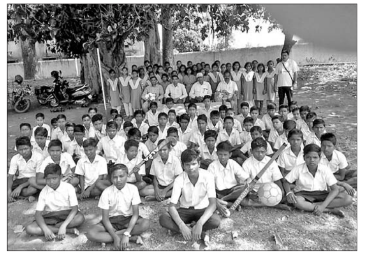
ରେଡ଼ାଖୋଲରେ ଅନୁଷ୍ଠିତ କ୍ରୀଡ଼ା ପ୍ରତିଭା ଚୟନ ଶିବିରରେ ଭାଗ ନେଇଥିବା ଛାତ୍ରଛାତ୍ରୀ