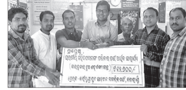
କଳାପୁଣ୍ଡା ଯୁବ ସତେଜ ନାଗରିକ ମଞ୍ଚ କର୍ମକର୍ତ୍ତାମାନେ ଶହୀଦ ପରିବାରଙ୍କ ସହାୟତା ଉଦ୍ଦେଶ୍ୟରେ ନଗର ଅର୍ଥ ରାଶି ଏସବିଆଇ କର୍ମଚାରୀଙ୍କୁ ପ୍ରଦାନ କରୁଛନ୍ତି।

କଳାହାଣ୍ଡି ଜିଲ୍ଲା କଳାପୁଣ୍ଡା ରୁକ୍ମିଣୀ ଆପାପାଣି ଯାତ୍ରାରେ ଶୁକ୍ରବାର ସକାଳ ପ୍ରାୟ ୮ଟାରେ କଳସପୁର ପବ୍ଲୁ ଆପାପାଣି ସାଗରପତ୍ରକୁ ମାଛ ନେଇ ଆସୁଥିବା ଏକ ପିକଅପ୍ ଗାଡ଼ି (ନ. ଓଆର-୧୦୯୦୨-୯୩୦୨) ଆପାପାଣି ଯାତ୍ରା ବୁଲୁଣିରେ ଭାରସାମ୍ୟ ହରାଇ ଉଲଟି ପଡ଼ିଥିଲା। ଫଳରେ ଗାଡ଼ିରେ ଥିବା ମାଛ ରାସ୍ତାରେ ବିଛେଇ ହୋଇ ପଡ଼ିଥିଲା। ଗାଡ଼ି ଡ୍ରାଇଭରଙ୍କ ସମେତ ଅନ୍ୟ ଜଣେ ଅଧିକାରୀଙ୍କ ଯାତ୍ରା ଉପରେ ଧ୍ୟାନ ଦେଇ ଅଧିକାରୀଙ୍କୁ ଯାତ୍ରାରେ ଘାତୀ ହୋଇଥିବା ନେଇ ଗୋଟିଏ ଅଭିଯୋଗ ହୋଇ ନ ଥିବା ପ୍ରକାଶ କରିଛି। ଏଥିପ୍ରତି ପ୍ରଶାନ୍ତ ଦୁର୍ଘଟଣା ଉପରେ ଦାୟିତ୍ୱ ନେବାକୁ ଯାଆରଣେ ଦାବି ହେଉଛି।