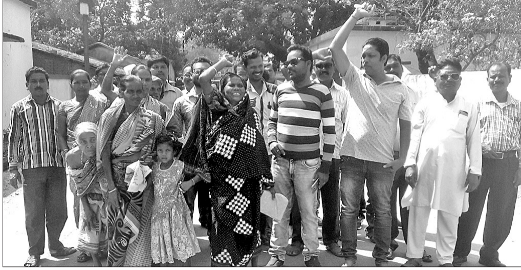
ଉପଜିଲ୍ଲାପାଳଙ୍କୁ ଦାବିପତ୍ର ଦେବାକୁ ଯାଉଥିବା ଅଭିଭାବକମାନେ ।

ଇଂଲିଶ ପରୀକ୍ଷା ସମୟରେ ବୋର୍ଡ ପକ୍ଷରୁ ଦୁର୍ଭିକ୍ଷ ହେବା ପରେ ଘୁନସର ପରୀକ୍ଷା କେନ୍ଦ୍ରରେ ସେହିଦିନ ଅନିଶ୍ଚିତ ହୋଇଥିଲେ।