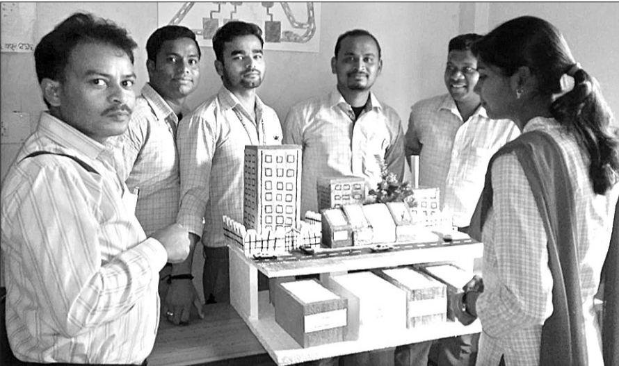
ଛାତ୍ରା ବିଭିନ୍ନ ଉପାଦାନ, ପ୍ରୟୋଗାତ୍ମକ, ସତେଜତା ସୃଷ୍ଟି ପାଇଁ ପ୍ରକଳ୍ପ ପ୍ରଦର୍ଶନା କରୁଛନ୍ତି ।

ଜିଲ୍ଲା ଶିକ୍ଷା ଓ ପ୍ରଶିକ୍ଷଣ ପ୍ରତିଷ୍ଠାନ ଡିଆଇଇଟିରେ ଜାତୀୟ ବିଜ୍ଞାନ ଦିବସ ପାଳନ ଅବସରରେ ଏକ ବିଜ୍ଞାନ ପ୍ରଦର୍ଶନା ଅନୁଷ୍ଠିତ ହୋଇଯାଇଛି ।