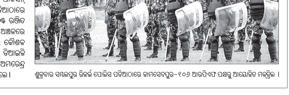
ଶୁକ୍ରବାର ସମ୍ବଲପୁର ରିଜର୍ଭ ପୋଲିସ ପଡ଼ିଆରେ କାମସେବକ-୧୦୬ ଆରମ୍ଭିତ ପକ୍ଷରୁ ଆୟୋଜିତ ମକଡ଼ୁଲି ।

ସମ୍ବଲପୁର, ୧୩ (ବୁଧବେଳ) - କାମସେବକ-୧୦୬ ଆରମ୍ଭିତ ଆକସର୍ ଫୋର୍ସ ପକ୍ଷରୁ ଶୁକ୍ରବାର ରିଜର୍ଭ ପୋଲିସ ଲାଇନ ପଡ଼ିଆରେ ମକଡ଼ୁଲି କରାଯାଇଛି ।