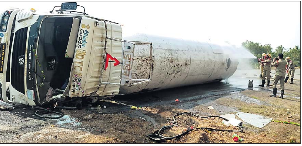
ଡେକାନାଲ ସଦର ଥାନା ଗୋବିନ୍ଦପୁର ଫାଣ୍ଡି ଅନ୍ତର୍ଗତ ୫୫ନଂ. କାତାୟ ରାଜପଥର ମଲିକେଶ୍ୱରୀ ମନ୍ଦିର ନିକଟରେ ଶୁକ୍ରବାର ମଧ୍ୟାହ୍ନରେ ଏକ ଗ୍ୟାସ୍ ବ୍ୟାଙ୍କର ଦୁର୍ଘଟଣାଗ୍ରସ୍ତ ହୋଇଛି । ନିଆଁ ଲାଗିଯିବା ଆଶଙ୍କାରେ ଅଗ୍ନିଶମ ବିଭାଗ କର୍ମଚାରୀ ପାଣି ସିଞ୍ଚନ କରୁଛନ୍ତି ।