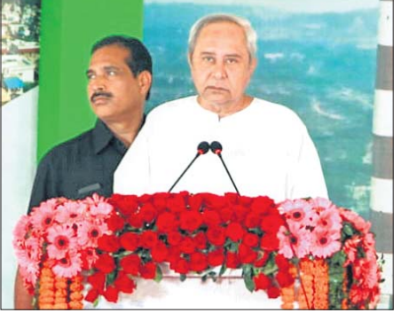
ମୁଖ୍ୟମନ୍ତ୍ରୀ ନବୀନ ପଟ୍ଟନାୟକ ଉଦ୍ଘାଟନ କରୁଛନ୍ତି ।

ଝାରସୁଗୁଡ଼ା ଜିଲ୍ଲା ବନହରପାଲିସ୍ଥିତ ଓଡ଼ିଶା ବିଦ୍ୟୁତ୍ ଉତ୍ପାଦନ ନିଗମ(ଓପିଜିସି)ର ୬୬୦ମେଗାଓୟର୍ ବିଶିଷ୍ଟ ୩ୟ, ୪ର୍ଥ ୟୁନିଟ୍‌କୁ ଶୁକ୍ରବାର ମୁଖ୍ୟମନ୍ତ୍ରୀ ନବୀନ ପଟ୍ଟନାୟକ ରାଜ୍ୟ ଉଦ୍ଦେଶ୍ୟରେ ଉଦ୍ଘାଟନ କରିଛନ୍ତି । ଏହି ଅବସରରେ ମୁଖ୍ୟମନ୍ତ୍ରୀ ପଟ୍ଟନାୟକ କହିଲେ, ରାଜ୍ୟ ସରକାରଙ୍କ ନିକଟ ବିଦ୍ୟୁତ୍ ନିଗମ ଓପିଜିସି ରହିଛି । ଏହାର ୩ୟ, ୪ର୍ଥ ୟୁନିଟ୍ ଆଜି କାର୍ଯ୍ୟକ୍ଷମ ହୋଇଛି । ଏଥିରୁ ୧୩୨୦ ମେଗାଓୟର୍ ବିଦ୍ୟୁତ୍ ଉତ୍ପାଦନ ହେବ । ଏହା ରାଜ୍ୟର ବିଦ୍ୟୁତ୍ ଚାହିଦା ପୂରଣ କରିବ । ଏହି ୨ ୟୁନିଟ୍ କାର୍ଯ୍ୟକ୍ଷମ ହେବା ପରେ ବିଦ୍ୟୁତ୍ କ୍ଷେତ୍ରରେ ଓଡ଼ିଶା ଏକ ନୂଆ ଇତିହାସ ସୃଷ୍ଟି କରିଛି । ଆସନ୍ତା ୨୫ବର୍ଷ ପାଇଁ