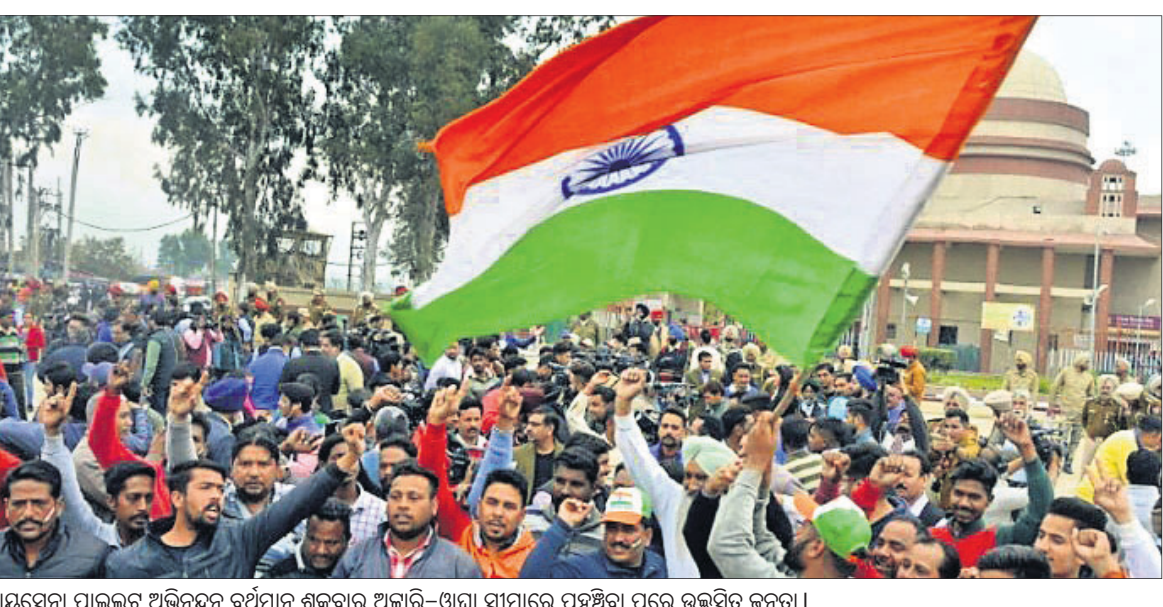
ବାୟୁସେନା ପାଇଲଟ ଅଭିନନ୍ଦନ ବର୍ଥମାନ ଶୁକ୍ରବାର ଅକାରି-ଓଘା ସାମାଜରେ ପହଞ୍ଚିବା ପରେ ଭଲଭିତ ଜନତା।