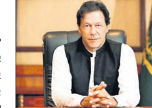
ଇସ୍ଲାମାବାଦ, ୪ମାର୍ଚ୍ଚ (ପି.ଟି.ବି.)

ସିଏ କମ୍ପାନୀ ପ୍ରସଙ୍ଗର ସମାଧାନ କରିପାରିବେ ଏବଂ ଉଚ୍ଚ ଉପମହାଦେଶରେ ଶାନ୍ତି ଓ ମାନବ ସମ୍ପଦ ବିକାଶକୁ ଆଗେଇ ନେବେ, ସେ ନୋବେଲ ଶାନ୍ତି ପୁରସ୍କାର ପାଇବାକୁ ଯୋଗ୍ୟ ହେବେ ବୋଲି ପାକିସ୍ତାନ ପ୍ରଧାନମନ୍ତ୍ରୀ ଇମ୍ରାନ ଖାନ୍ କହିଛନ୍ତି । ଭାରତ ସହ ଉତ୍ତରଜନା ହ୍ରାସ ଉଦ୍ୟମ ଲାଗି ତାଙ୍କୁ ନୋବେଲ ଶାନ୍ତି ପୁରସ୍କାର ପ୍ରଦାନ ନିମନ୍ତେ ଗତ ୨ ଚାରିଖରେ ପାଇଁ ପାର୍ଲିମେଣ୍ଟରେ ପ୍ରସ୍ତାବ ଆଗତ ହୋଇଥିଲା ।