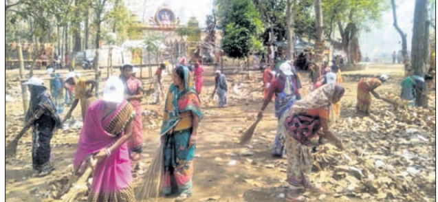
ମହିଳାମାନଙ୍କ ଦ୍ୱାରା ହିଜୁଳା ମେଳା ପଡ଼ିଆ ସଫେଇ କରାଯାଉଛି।