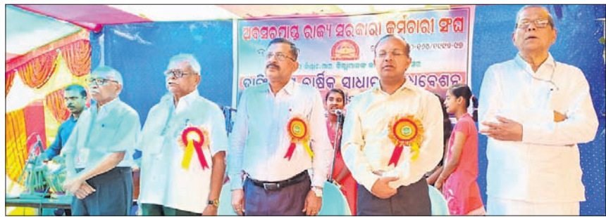
ଅବସରପ୍ରାପ୍ତ ସରକାରୀ କର୍ମଚାରୀ ସଂଘର ଜିଲା ସମ୍ମିଳନୀରେ ଉପସ୍ଥିତ ଅତିଥି।