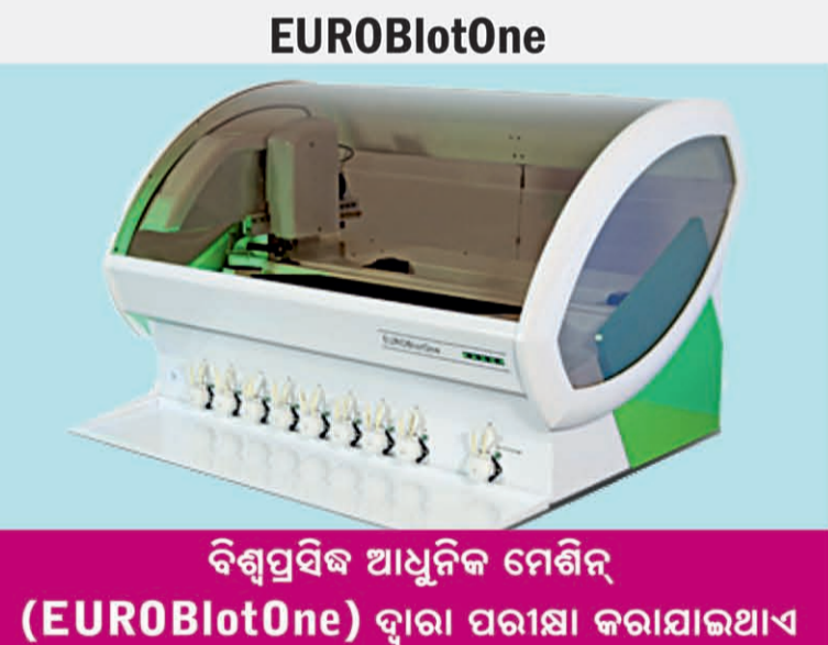
ବିଶ୍ୱପ୍ରସିଦ୍ଧ ଆଧୁନିକ ମେଶିନ୍ (EUROBlotOne) ଦ୍ୱାରା ପରୀକ୍ଷା କରାଯାଇଥାଏ

ଆସନ୍ତୁ ଜାଣିବା କିପରି ପାଇବେ ଆଲର୍ଜିରୁ ଉପଶମ ଉପାହରଣସ୍ୱରୂପ, କୌଣସି କର୍ମକାରୀ ବ୍ୟକ୍ତି ନିଜ ଘରେ ସମ୍ପୂର୍ଣ୍ଣ ଠିକ୍ ରହିଥାନ୍ତି କିନ୍ତୁ ପ୍ରତିଦିନ ସେ ଯେବେ ନିଜ କାର୍ଯ୍ୟାଳୟରେ ପହଞ୍ଚନ୍ତି ତା'ପରେ ହଠାତ୍ ତାଙ୍କୁ ଛିକ୍ ଆରମ୍ଭ ହୋଇଯାଇଥାଏ, ଏପରି ଛିତିରେ ସମ୍ପୂର୍ଣ୍ଣ ବ୍ୟକ୍ତି ତ ହଇରାଣ ହୁଅନ୍ତି ହିଁ, କିନ୍ତୁ ଏହି କାରଣରୁ ତାଙ୍କ ସହକର୍ମୀମାନେ ପ୍ରଭାବିତ ହୋଇଥାନ୍ତି । ଏପରି ଛିତି ସେହି ବ୍ୟକ୍ତିଙ୍କଠାରେ ହାନିମନତା ସୃଷ୍ଟି କରିଥାଏ । ନିଜର ଏହି ରୋଗକୁ ନେଇ ସେ ଅସହାୟ ଅନୁଭବ କରନ୍ତି, ତା' ସହିତ ସହକର୍ମୀମାନଙ୍କୁ ତାଙ୍କୁ ତାହାଲକ୍ଷ୍ୟ କରିବାର ବାହାନା ମଧ୍ୟ ମିଳିଯାଇଥାଏ । ଏପରି ବ୍ୟକ୍ତିଙ୍କୁ ଉକ୍ତ ଛିତିରୁ ରକ୍ଷା ପାଇବା ପାଇଁ ଯଥାଶୀଘ୍ର ନିଜର ରକ୍ତ ଯାଞ୍ଚ କରାଇନେବା ଉଚିତ ଯାହାଦ୍ୱାରା ତାଙ୍କ ଆଲର୍ଜିର କାରଣ ଜଣାପଡ଼ିଯିବ ଏବଂ ତାଙ୍କର ଚିକିତ୍ସା ସମ୍ଭବ ହୋଇପାରିବ । ସେହିଭଳି ଏପରି କୌଣସି ବ୍ୟକ୍ତି ଯିଏ ନିଃଶ୍ୱାସପ୍ରଶ୍ୱାସ ନେବାରେ କଷ୍ଟ ଅନୁଭବ କରନ୍ତି ଏବଂ ଅନ୍ତର୍ଦ୍ଧିକ ତଳାଠୁଳା କଲେ ଅଶନିଷ୍ଟାସୀ ହୋଇପଡ଼ନ୍ତି ତେବେ ତାଙ୍କୁ ଅନ୍ୟାନ୍ୟ ପରୀକ୍ଷା ସହିତ ନିଜର ଆଲର୍ଜି ମଧ୍ୟ ଚେଷ୍ଟ କରାଇନେବା ଆବଶ୍ୟକ, ଯାହାକି ନିପୁଣ ଡାକ୍ତରଙ୍କ ଦ୍ୱାରା କେବଳ ଗୋଟିଏ ରକ୍ତପରୀକ୍ଷା ପରେ ହିଁ ସହଜରେ ଜଣାପଡ଼ିଯାଇଥାଏ । କାରଣ ଜଣାପଡ଼ିଗଲେ କେତେକ ଔଷଧ ସହାୟତାରେ ସ୍ୱାସ୍ଥ୍ୟରେ ସୁଧାର ଅଣାଯାଇପାରିବ ।