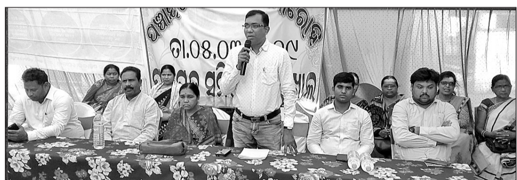
ରୁକ୍ମପୁରୀୟ ପଞ୍ଚାୟତରାଜ ଦିବସ ପାଳନ ଅବସରରେ ମଞ୍ଚାସୀନ ଅତିଥି।

ଚର୍ଚ୍ଚାର ବିଷୟ ହୋଇଛି। ପ୍ରକାଶ ଯେ, ଲୋଇସିଂହା ନିର୍ବାଚନ ମଣ୍ଡଳୀ ପାଇଁ ଅନୁସୂଚିତ ବର୍ଗର ପ୍ରାଥମିକ ପାଇଁ ସଂରକ୍ଷଣ ରହିଛି।