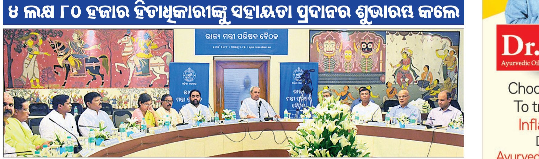
ସଚିବାଳୟରେ ମଙ୍ଗଳବାର ରାଜ୍ୟ ମନ୍ତ୍ରୀ ପରିଷଦ ବୈଠକ

ଭୁବନେଶ୍ୱର, ୫୩(ଝୁରୋ) ବିଜେତା ଶାସନର ୪ର୍ଥ ପାଲି ଶେଷ ହେବାକୁ ଯାଉଛି । ଆଉ କିଛିଦିନ ପରେ ନିର୍ବାଚନ ଚାରିଖ ଯୋଷଣା ହେବ ।