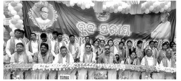
ପୁରିବାହାଳ ବ୍ଲକ୍‌ସ୍ତରୀୟ ପଞ୍ଚାୟତରାଜ ବିବସ୍ତାପନ ଅବସରରେ ମଞ୍ଚାସୀନ ଅତିଥି।