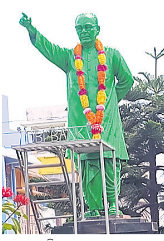
ସୋନପୁର ବିଜୁ ପଟ୍ଟନାୟକ ଛକରେ ଥିବା ବିଜୁଙ୍କ ପ୍ରତିମୂର୍ତ୍ତିକୁ ସବୁଜ କରାଯାଇଛି ।

ସୋନପୁର, ୫୩(ନି.ପ୍ର.) ସାଧାରଣ ନିର୍ବାଚନକୁ ଆଉ ଅଳ୍ପ ଦିନ ବାକି ଅଛି । ଏକଲି ଛୁଟିରେ ପାଲଟା ହାସଲ ପାଇଁ ରାଜନୈତିକ ଦଳଗୁଡ଼ିକ ବେଷ୍ଟ ଅଛନ୍ତି ।