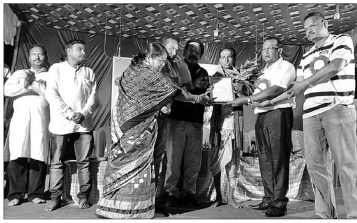
ବାଞ୍ଛାବଦ ନାଏକଙ୍କୁ ଜଳେଶ୍ୱର ସମ୍ମାନରେ ସମ୍ମାନିତ କରାଯାଇଛି।

ବଲାଙ୍ଗୀର ଜିଲା ଲୋକସିଂହା ଥାନା ଅଧୀନ ଆରମ୍ଭପୁର ବ୍ଲକ୍ ସାମ୍ବଲପୁର ଜଳେଶ୍ୱର ପାଠରେ ମହାଶିବରାତ୍ରି ଅବସରରେ ୧୨ତମ ଜଳେଶ୍ୱର ମହୋତ୍ସବ ଅନୁଷ୍ଠିତ ହୋଇଯାଇଛି।