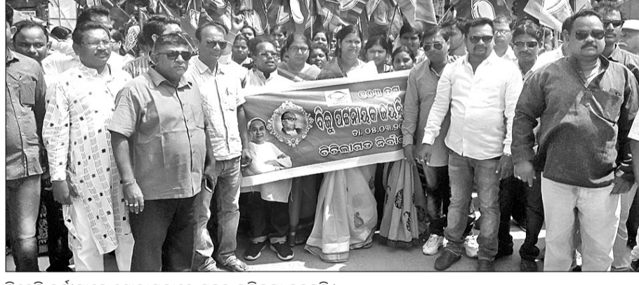
ବିଜେଡି କର୍ମୀମାନେ ଶୋଭାଯାତ୍ରାରେ ସହର ପରିକ୍ରମା କରୁଛନ୍ତି।

ଦିନତମାମ ସମସ୍ତ ସ୍କୁଲ, କଲେଜ, ଅଫିସ୍ ତଥା ଦୋକାନ ବନ୍ଦର ଆଦି ବନ୍ଦ ରହିଥିଲା।