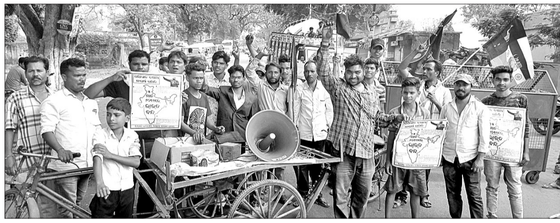
ଦେଓଗାଁ ବ୍ୟୟାଧିକ ନିକଟରେ ସମ୍ପାଦନା ବଞ୍ଚା ଅଂଘର ସମିତି ଦେଓଗାଁ ଶାଖାର କର୍ମକର୍ତ୍ତାମାନେ ବିକ୍ଷୋଳ ପ୍ରଦର୍ଶନ କରୁଛନ୍ତି।

ବଲାଙ୍ଗୀର ଜିଲା ପୁରିବାହାଳ ବ୍ଲକ୍‌ସ୍ତରୀୟ ପଞ୍ଚାୟତରାଜ ବିବସ୍ତାପନ ମଙ୍ଗଳଦୀର ବ୍ଲକ୍ ପରିସରରେ ପାଳିତ ହୋଇଯାଇଛି।