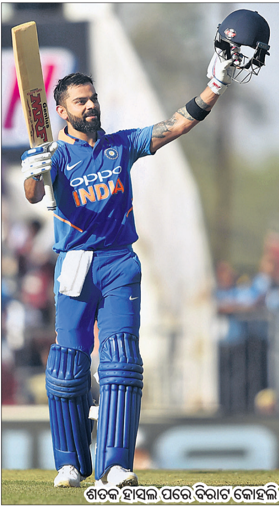
ଶତକ ହାସଲ ପରେ ବିରାଟ କୋହଲି