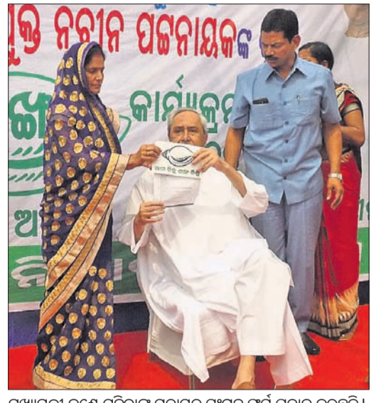
ମୁଖ୍ୟମନ୍ତ୍ରୀ ଜଣେ ମହିଳାଙ୍କୁ ମତାମତ ସଂଗ୍ରହ ପର୍ଯ୍ୟଟ ପ୍ରଦାନ କରୁଛନ୍ତି। ସହ ସହାୟତା ରାଶିକୁ ୧୦ ହଜାର ଟଙ୍କାକୁ ବୃଦ୍ଧି କରିବା ଆଦି ରହିଛି। ଏହିସବୁ ସମସ୍ୟା ମଧ୍ୟରୁ ନବୀନ କେନ୍ଦ୍ର ସରକାରଙ୍କ ନିକଟରେ କେଉଁ କେଉଁ ଦାବିକୁ ଉପସ୍ଥାପନ ଦୃଢ଼ତାର ସହ କରିବା ସହ ସଂଗ୍ରାମ କରି ରଖିବା ଉଚିତ ବୋଲି ମତାମତ ମଗାଯାଇଛି।

କାର୍ଯ୍ୟ କରନ୍ତୁ ବୋଲି ଆପଣ ଚାହୁଁଛନ୍ତି ବୋଲି ପଚରାଯାଇଛି। ଉପରୋକ୍ତ ଦୁଇଟି ଭାଗରେ ରାଜ୍ୟ ସରକାରଙ୍କ ବିକାଶମୁକ୍ତ କାର୍ଯ୍ୟ ଉପରେ ଉଲ୍ଲେଖ ରହିଥିବା ବେଳେ ତୃତୀୟ ଭାଗରେ ମଗାଯାଇଥିବା ୯ଟି ମତାମତରେ କେନ୍ଦ୍ର ସରକାରଙ୍କ ଅବହେଳାକୁ ପରୋକ୍ଷରେ ଚାର୍ଟର କରାଯାଇଛି। ଏଥିରେ ଓଡ଼ିଶାକୁ ସ୍ୱତନ୍ତ୍ର ରାଜ୍ୟପାତ୍ରା ମାମଲା, ପ୍ରତିବର୍ଷ ଦେଶରେ ୨ କୋଟି ନିଯୁକ୍ତି ଅନୁପାତରେ ରାଜ୍ୟର ୭ ଲକ୍ଷ ଯୁବତୀୟଙ୍କର ନିଯୁକ୍ତି ପ୍ରଦାନ କରିବା, ପ୍ରତି ପରିବାରର ବ୍ୟାଙ୍କ ଖାତାରେ ୧୫ ଲକ୍ଷ ଟଙ୍କା ଜମା ଦେବା, ଧାନର ସର୍ବନିମ୍ନ ସହାୟକ ମୂଲ୍ୟ ରୁଜୁଖାଇ ପଇସା ୧୯୩୦ ଟଙ୍କାକୁ ବୃଦ୍ଧି କରିବା, ମହାନଦୀ ଉପତ୍ୟକାରେ କ୍ଷତିଗ୍ରସ୍ତ ନିର୍ବାଣ କରୁଥିବା ସମସ୍ତ ବ୍ୟାରେଜ ଓ ବନ୍ଧ କାମ ବନ୍ଦ କରିବା, ଅନୁସୂଚିତ ଜାତି ଓ ଜନଜାତି ଛାତ୍ରାଭିଭୂତ ବୃଦ୍ଧି ଆଣିବା ବୃଦ୍ଧି କରିବା, ପିଏମ୍ କିଷାନ ଯୋଜନାରେ କାଳିଆ ଯୋଜନା ଭଳି ସମସ୍ତ ଗଞ୍ଜେଇ ଓ କୃଷି କାର୍ଯ୍ୟ ପାଇଁ ଅସମର୍ଥ କୃଷି ପରିସରକୁ ଅନ୍ତର୍ଭୁକ୍ତ କରାଯାଇ