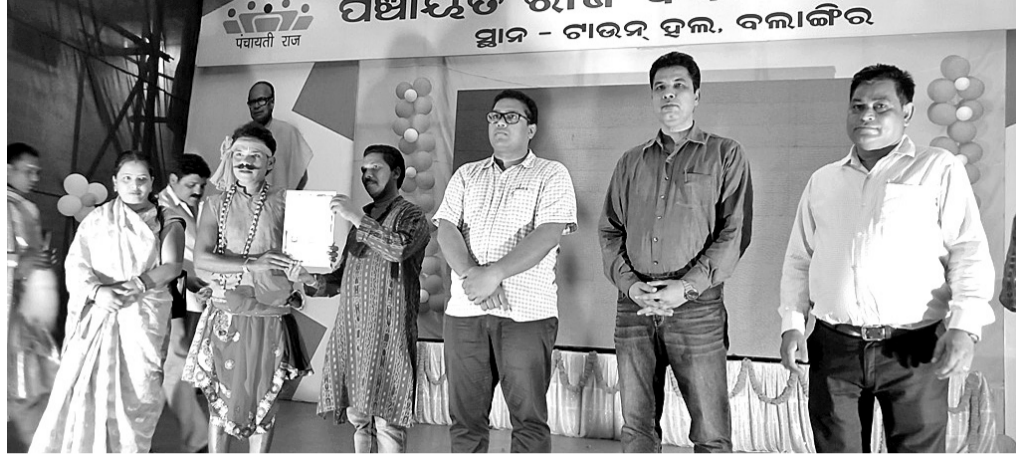
ପଞ୍ଚାୟତରାଜ ଦିବସ ଅବସରରେ ବଲାଙ୍ଗୀର ଚାଉଁଡ଼ ହଲଠାରେ କଳାକାରମାନଙ୍କୁ ସମର୍ଥନ କରାଯାଇଛି।

ବଲାଙ୍ଗୀର ଚାଉଁଡ଼ ହଲଠାରେ ଜିଲ୍ଲାସ୍ତରୀୟ ପଞ୍ଚାୟତରାଜ ଦିବସ ସମାରୋହ ଓ ପୂର୍ବତନ ମୁଖ୍ୟମନ୍ତ୍ରୀ ସ୍ମରଣ ବିଜୁ ପଟ୍ଟନାୟକଙ୍କ ଜୟନ୍ତୀ ପାଳିତ ହୋଇଛି।