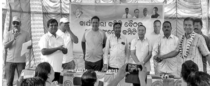
ବଲାଙ୍ଗୀର ନଗର କଂଗ୍ରେସର କାର୍ଯ୍ୟକାରୀତା ବୈଠକରେ ମଞ୍ଚାସୀନ କାର୍ଯ୍ୟକର୍ତ୍ତା।