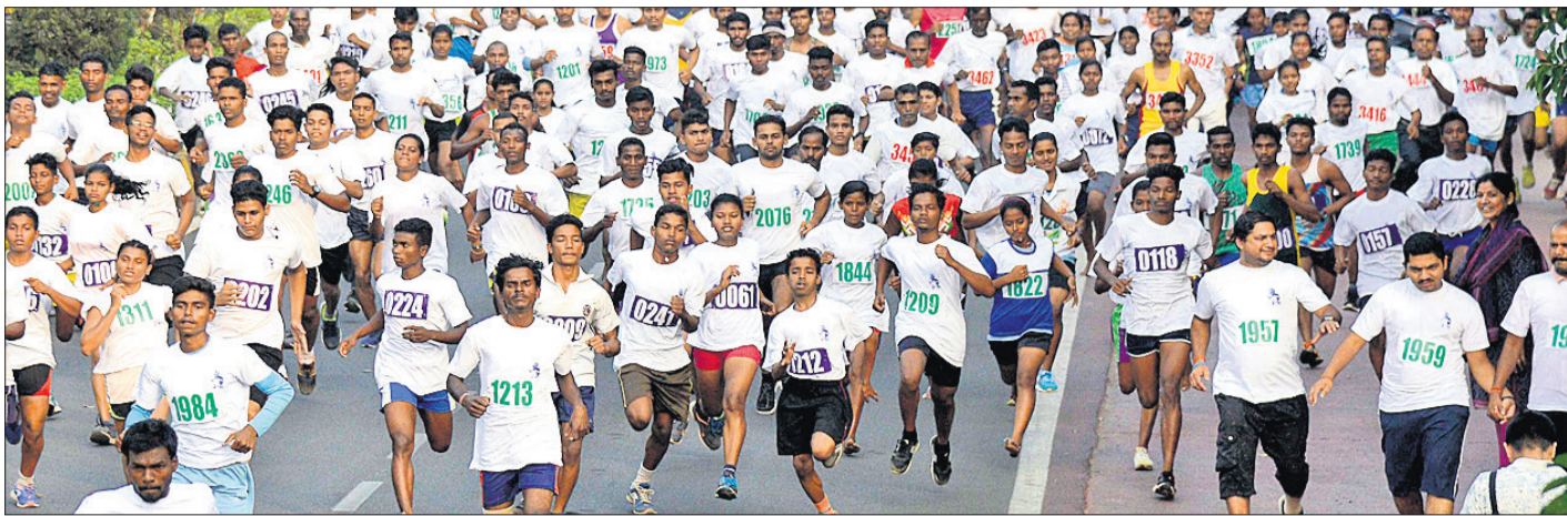
ବିଜୁ ପଟ୍ଟନାୟକ କଲେଜ ଅବସରରେ ଭୁବନେଶ୍ୱରରେ ମଙ୍ଗଳବାର ଅନୁଷ୍ଠିତ ମିନି ମାରାଥନ ।

ଗଣିତ ଉତ୍ତର ଖାତା ଗାଏବ ଯାଗା ପୁଣି ୨ ଶିକ୍ଷକ ନିଲମ୍ବିତ ଗିରଫ ୫୩ ମଧୁରୀ କୋଟ୍ଟୋଲାରା ମାଲକାନଗିରି, ୫୩(ଡି.ଏନ.ଏ.):