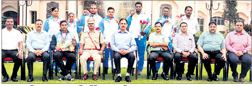
ସଫଳ କ୍ରୀଡ଼ାବିତ୍ତ ଗହଣରେ ପୋଲିସ ଡିଜି ଓ ଅନ୍ୟ ବରିଷ୍ଠ ଅଧିକାରୀମାନେ।