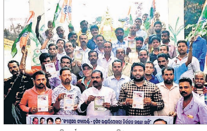
କଂଗ୍ରେସ ପକ୍ଷରୁ ଗ୍ୟାରେଣ୍ଡି କାର୍ଡ ବଣ୍ଟନ କରାଯାଇଛି ।