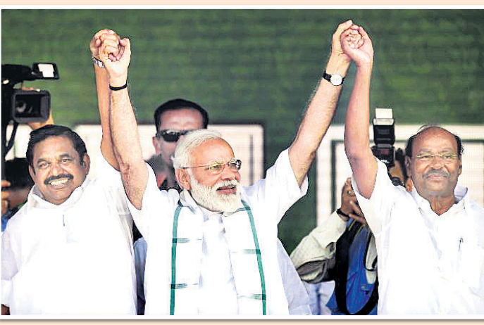
ତାମିଲନାଡୁ ରାଜଧାନୀ ଚେନ୍ନାଇରେ ରୂପରେ ଆୟୋଜିତ ଏକ ସଭାରେ ପ୍ରଧାନମନ୍ତ୍ରୀ ନରେନ୍ଦ୍ର ମୋଦିଙ୍କ ସହ ମୁଖ୍ୟମନ୍ତ୍ରୀ କେ. ପାଲାନିଆନ ଏବଂ ପିଏମ୍‌କେ ପ୍ରତିଷ୍ଠାତା ରାମଦୋସ୍ ।