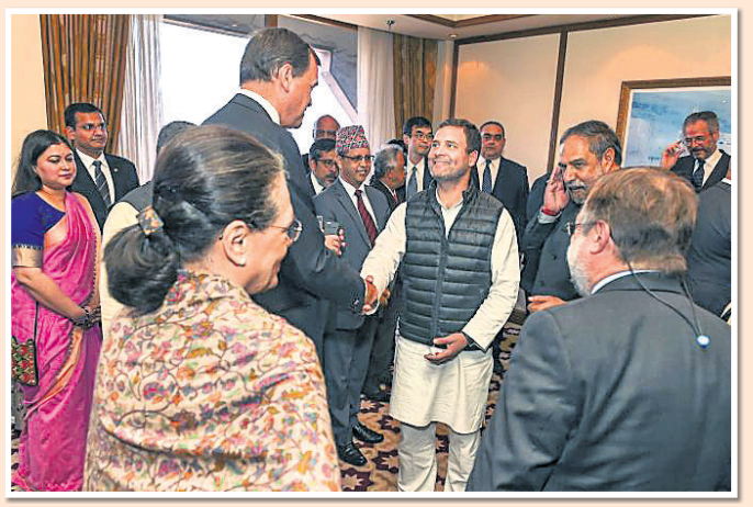
ଜି-୨୦ ରାଷ୍ଟ୍ରସମୂହର ରାଷ୍ଟ୍ରପତି ଓ ଉପାଧ୍ୟକ୍ଷଙ୍କ ସହ ନୂଆଦିଲ୍ଲୀରେ ଏକ ବୈଠକ ବେଳେ ଆଲୋଚନାରେ କଂଗ୍ରେସ ଅଧ୍ୟକ୍ଷ ରାହୁଲ ଗାନ୍ଧୀ ଓ ଦଳର ନେତୃବୃନ୍ଦ ।