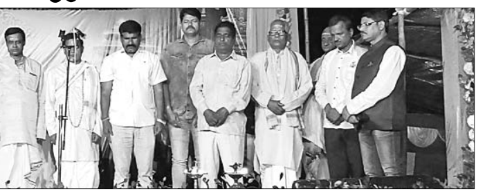
ଜାଗର ମହୋତ୍ସବରେ ଉପସ୍ଥିତ ଅତିଥି ।