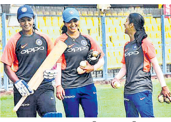
ଅଭ୍ୟାସ ସେସନ ଅବସରରେ ଭାରତୀୟ ମହିଳା ଦଳର ଖେଳାଳିମାନେ।

ଗୁଆହାଟୀ, ୨୩(ପି.ଟି.) ରୁକୁବାରିଠାରୁ ଏଠାରେ ଭାରତ ଓ ଭୃମାଣକାରୀ ଇଂଲଣ୍ଡ ମହିଳା ଦଳ ମଧ୍ୟରେ ଦ୍ୱିତୀୟ ଟି୨୦ ମ୍ୟାଚ୍ ଖେଳାଯିବ।