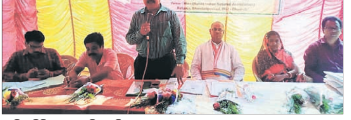
ଗାଲିମ ଶିବିରରେ ଉପସ୍ଥିତ ଅତିଥି ।