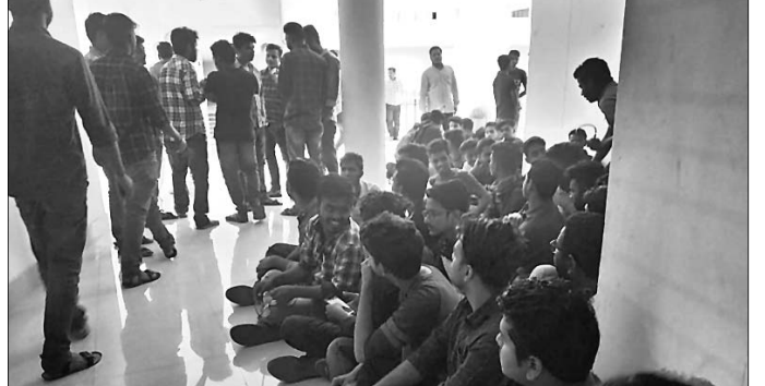
ଛାତ୍ରମାନେ କଲେଜ ଅଫିସକୁ ଆଗରେ ଧାରଣାରେ ବସିଛନ୍ତି ।

କେନ୍ଦୁଝର, ୬ମାର୍ଚ୍ଚ (ସ.ପ୍ର.): ସ୍ଥାନୀୟ ସରକାରୀ ଯାନ୍ତ୍ରିକ ବିଦ୍ୟାଳୟରେ ସାଂସ୍କୃତିକ କମିଟି ଗଠନ ନେଇ ବିବାଦ ଦେଖାଦେଇଛି । କମିଟି ସୁନାମର ଗଠନ କରିବା ବା ବିନା କମିଟିରେ ପିଲାମାନଙ୍କୁ ନେଇ ବାର୍ଷିକ ଉତ୍ସବ ପାଳନ କରିବା ଦାବିରେ ରୁଧିରୀ ଧରି ଚଳିଥିଲା । କମିଟି ମାଧ୍ୟମରେ କଲେଜର ବାର୍ଷିକ ଉତ୍ସବ ହେବାକୁ ଯାଉଛି । ଏଣୁ ଏହି ଅବସରରେ ଏକ ସାଂସ୍କୃତିକ କମିଟି ଗଠନ କରାଯାଇଛି । ତେବେ କଲେଜରେ ୭ ଟି ବିଭାଗ ଥିବା ବେଳେ ୩ ଟି ବିଭାଗର ପିଲାଙ୍କୁ ନେଇ କମିଟି ଗଠନ କରାଯାଇଥିବାରୁ ବିବାଦ ଦେଖାଦେଉଛି । ଏହାକୁ ବିରୋଧ କରି ଅନ୍ୟ ୪ ଟି ବିଭାଗର ପିଲା ମାନେ