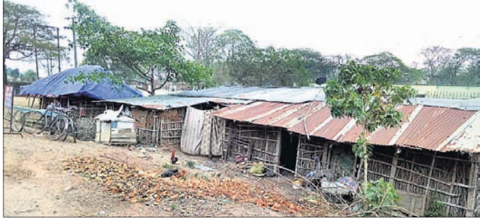
ଗ୍ରାମାଞ୍ଚଳ ଥାନା ସମ୍ମୁଖରେ ଜବରଦଖଲକାରୀଙ୍କ ନିର୍ମିତ ଘର ।

ଭଦ୍ରକ ପୌରପାଳିକା ଏବେ ଜବରଦଖଲକାରୀଙ୍କ କବ୍‌ଜାରେ । କେଉଁଠି ନୟନଯୋଗରେ ୨ ମହଲା କୋଠାଘର ତିଆରି ସରିଛି ତ ଆଉ କେଉଁଠି ତ୍ରେନ ଉପରେ ଶପିଂ ମଲ୍ ନିର୍ମାଣ ସରିଛି । ପୌରପାଳିକା ସବୁ ଜାଣି ନୀରବଦ୍ରଷ୍ଟା ସାଜିଛି । ଭଦ୍ରକ ସହରର ପ୍ରବେଶ ପଥ ନେହେରୁ ଷ୍ଟାଡ଼ିୟମଠାରୁ ପ୍ରସ୍ଥାନ ପଥ ମହତାବ ଛକ ଯାଏ ଜବରଦଖଲକାରୀଙ୍କ କବ୍‌ଜାରେ ରହିଛି । ସହରରୁ ବର୍ଷାକଳ ନିଷ୍ପାସନ ଲକ୍ଷ୍ୟରେ ପ୍ରଶାସନିକ ପଦକ୍ଷେପ ନେବାପାଇଁ ପ୍ରଶାସନ ପଥ ମହତାବ ଛକ ଯାଏ ଜବରଦଖଲକାରୀଙ୍କ କବ୍‌ଜାରେ ରହିଛି । ସହରରୁ ବର୍ଷାକଳ ନିଷ୍ପାସନ ଲକ୍ଷ୍ୟରେ ପ୍ରଶାସନିକ ପଦକ୍ଷେପ ନେବାପାଇଁ ପ୍ରଶାସନ ପଥ ମହତାବ ଛକ ଯାଏ ଜବରଦଖଲକାରୀଙ୍କ କବ୍‌ଜାରେ ରହିଛି ।