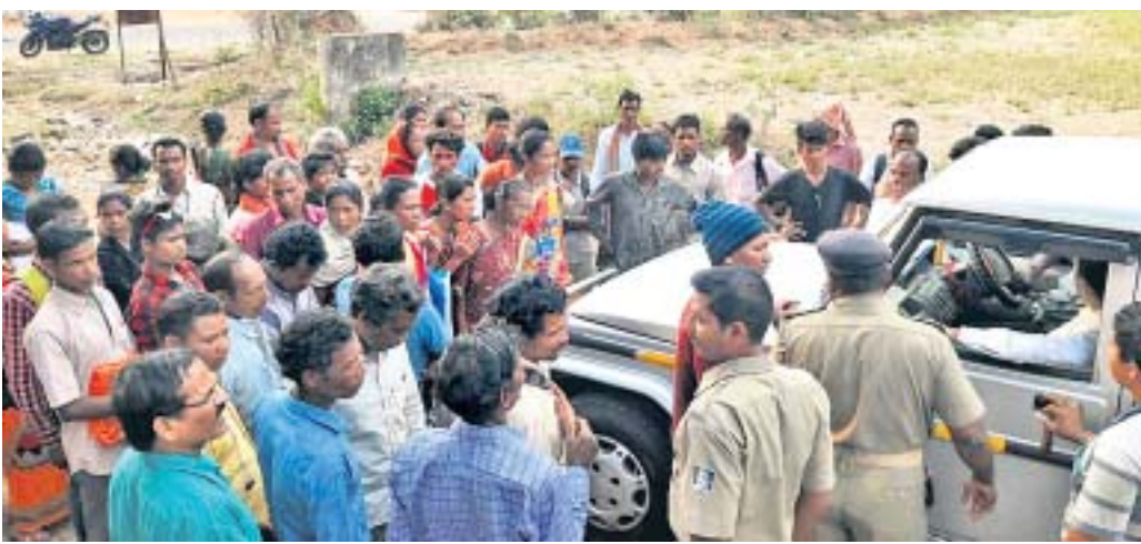
ବାଡ଼ିରେ ବସିଥିବା ତହସିଲଦାରଙ୍କୁ ଘେରାଇ କରିଛନ୍ତି ଏଙ୍ଗାଉସି ଗ୍ରାମବାସୀ ।

ଗଜପତି ଜିଲ୍ଲା ରାୟଗଡ଼ ବ୍ଲକର ଏଙ୍ଗାଉସି ଗ୍ରାମବାସୀ ଡିଡିଲି କ୍ଷତିପୂରଣ ପ୍ରଦାନ ଦାବିରେ ବୁଧବାର ତହସିଲଦାରଙ୍କୁ ଘେରାଇ କରିଥିଲେ । ବାତ୍ୟାର ଖମାସ ପରେ ବି ସେମାନେ ପ୍ରଶାସନ ପକ୍ଷରୁ ଉଚିତ କ୍ଷତିପୂରଣ ପାଇ ନ ଥିବା ଅଭିଯୋଗ ଆଣିଛନ୍ତି । କ୍ଷତିପୂରଣ ନ ମିଳିବା ପର୍ଯ୍ୟନ୍ତ ହରିବେ ନାହିଁ ବୋଲି ଗ୍ରାମବାସୀ ଜିଦ୍ ଧରିଥିଲେ । ଆସନ୍ତା ୭ଦିନ ମଧ୍ୟରେ ତଦନ୍ତ କରାଯିବା ନେଇ ତହସିଲଦାର ପ୍ରତିଶ୍ରୁତି ଦେବା ପରେ ସେମାନେ ଆନ୍ଦୋଳନରୁ ଓହରିଯାଇଥିଲେ ।