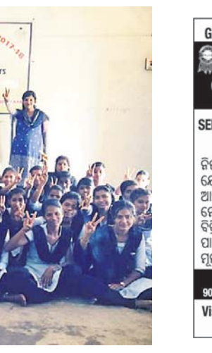
ଆତ୍ମରକ୍ଷା କୌଶଳ ଶିବିରରେ ଛାତ୍ରାମାନେ ।