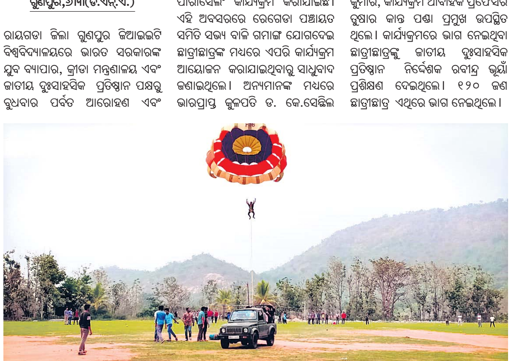
ଛାତ୍ରାଛାତ୍ରୀମାନେ ପାରାସେଲିଂ କରୁଛନ୍ତି।