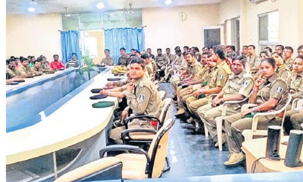
କର୍ମଶାଳାରେ ଉପସ୍ଥିତ ବନ ବିଭାଗ ଅଧିକାରୀ ।