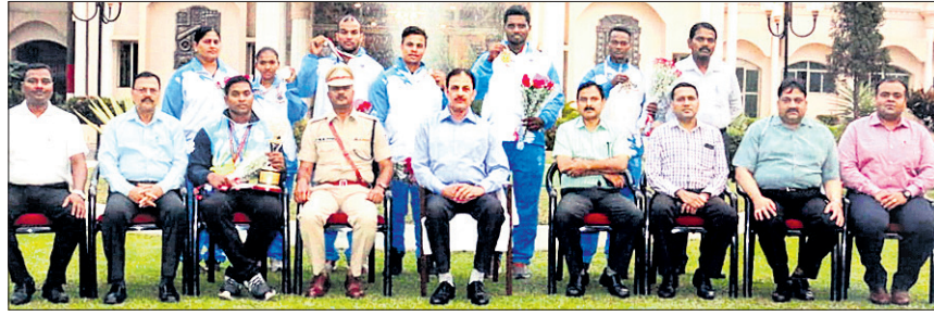
ସଫଳ କ୍ରୀଡ଼ାବିତ୍ତ ଗହଣରେ ପୋଲିସ ଡିଜିଟାଲ ଅଭିନନ୍ଦନ ଅଧିକାରୀଙ୍କ ସହିତ ଉପସ୍ଥିତ ଅଧିକାରୀମାନେ।