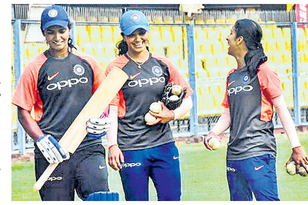
ଅଭ୍ୟାସ ସେସନ ଅବସରରେ ଭାରତୀୟ ମହିଳା ଦଳର ଖେଳାଳିମାନେ।

ସୁଆହାଣୀ, ୨୩ (ପି.ବି.) ସୁରାଜ୍ୟର ଟି୨୦ ମହିଳା ଦଳ ମଧ୍ୟରେ ଦ୍ରୁତ ମହିଳା ଟି୨୦ ମ୍ୟାଚ ଖେଳାଯିବ।