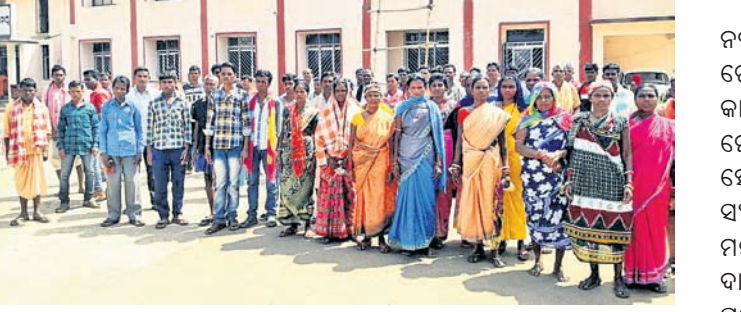
ଜିଲ୍ଲାପାଳଙ୍କୁ ଅଭିଯୋଗ କରିବାକୁ ଆସିଥିବା ଗ୍ରାମବାସୀ ।

ପ୍ରକାଶରେ ହିତାଧିକାରୀମାନେ ଅଭିଯୋଗ କରିଛନ୍ତି । ସେହିଭଳି ଝରିଗାଁ ଥାନା ଅଧୀନ ଚିତାବେତା ଓ ପୁସୁରା ପଞ୍ଚାୟତର ହିତାଧିକାରୀମାନଙ୍କୁ କବାଧିତ ମୌଜାରେ ୮୦ ଏକର ଜମିରେ ପୂଜିକା ସଂରକ୍ଷଣ ବିଭାଗ ପକ୍ଷରୁ କାଜୁ ବଗିଚା ସୃଷ୍ଟି କରି ତାହାର ରକ୍ଷଣାବେକ୍ଷଣ ସହ କାଜୁ ଫଳ ଭୋଗ କରିବାକୁ ୪୦ ଜଣ ହିତାଧିକାରୀ ପ୍ରଦାନ କରିଛନ୍ତି । କୋବାଧି, କାମଦରା ଓ କୁହୁରାକୋଟ ଗାଁର ୬ ଜଣ ବ୍ୟକ୍ତି କୌଣସି ପ୍ରକାର ଦଖଲ କିମ୍ବା ଅଧିକାର ନଥାଇ କାଜୁ ବଗିଚାକୁ ମାଡ଼ି ବସିଛନ୍ତି ବୋଲି ଜିଲ୍ଲାପାଳଙ୍କୁ ଅଭିଯୋଗ କରିଛନ୍ତି । ଏନେଇ ଥାନାରେ ଅଭିଯୋଗ କଲେ ମଧ୍ୟ କୌଣସି ସୁଫଳ ମିଳୁନାହିଁ ବୋଲି ଜଣାଗଲେ