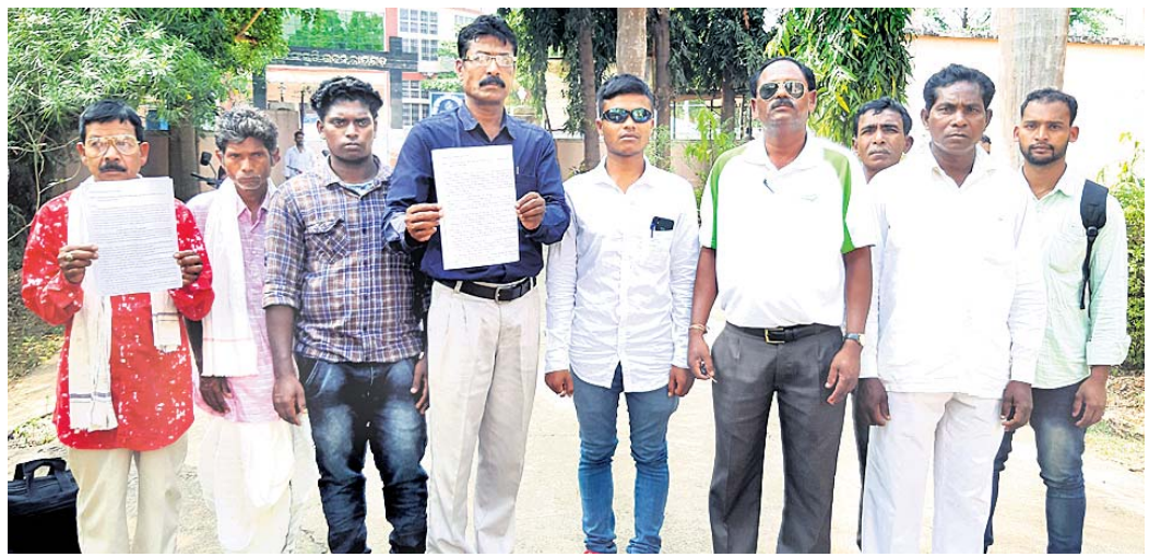
ଜିଲାପାଳଙ୍କୁ ଦାବି ଜଣାଇବାକୁ ଆସିଥିବା ରଘୁବୀରା ପଞ୍ଚାୟତବାସୀ।

ପଞ୍ଚାୟତର ଖଲିଆଖଡା, ସିଲବୁଡି, ଖେରାଣି, ଭାଲିଆପଦର, ହରିପୁର, ଝେରାଣି, ବେତାଗାଁ, ଉତ୍ତର ଗ୍ରାମବାସୀ ଜିଲାପାଳଙ୍କୁ ଅର୍ଥ ଆତ୍ମସାର୍ କରୁଛନ୍ତି ବୋଲି ଜଣାଇବାକୁ ଆସିଥିବା ରଘୁବୀରା ପଞ୍ଚାୟତବାସୀ। ପଞ୍ଚାୟତର ଖଲିଆଖଡା, ସିଲବୁଡି, ଖେରାଣି, ଭାଲିଆପଦର, ହରିପୁର, ଝେରାଣି, ବେତାଗାଁ, ଉତ୍ତର ଗ୍ରାମବାସୀ ଜିଲାପାଳଙ୍କୁ ଅର୍ଥ ଆତ୍ମସାର୍ କରୁଛନ୍ତି ବୋଲି ଜଣାଇବାକୁ ଆସିଥିବା ରଘୁବୀରା ପଞ୍ଚାୟତବାସୀ। ପଞ୍ଚାୟତର ଖଲିଆଖଡା, ସିଲବୁଡି, ଖେରାଣି, ଭାଲିଆପଦର, ହରିପୁର, ଝେରାଣି, ବେତାଗାଁ, ଉତ୍ତର ଗ୍ରାମବାସୀ ଜିଲାପାଳଙ୍କୁ ଅର୍ଥ ଆତ୍ମସାର୍ କରୁଛନ୍ତି ବୋଲି ଜଣାଇବାକୁ ଆସିଥିବା ରଘୁବୀରା ପଞ୍ଚାୟତବାସୀ।