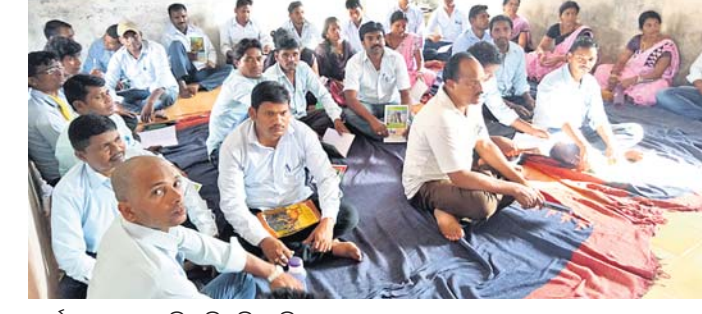
କାର୍ଯ୍ୟକ୍ରମରେ ଉପସ୍ଥିତ ଶିକ୍ଷୟିତ୍ରୀ ଶିକ୍ଷକ।

ରାୟଗଡ଼ା ଜିଲା ଚନ୍ଦ୍ରପୁର ବ୍ଲକ୍ ପ୍ରଧାନ କରୁଥିବା ଏହାର ଉଦ୍ଦେଶ୍ୟ ବୋଲି ଡାକ୍ତରୀସରଠା କୁସୁର ସିଆରସିସି ଦିଲ୍ଲୀପ ଶବ୍ଦରେ କହିଛନ୍ତି। ଏହି କାର୍ଯ୍ୟକ୍ରମ ଧିନିଧିନି ଚାଲିବ। ଏଥିରେ ୪୮ ଜଣ ଶିକ୍ଷୟିତ୍ରୀ ଶିକ୍ଷକ ପାଠ୍ୟାଳୟ ସରକାରୀ ଉଚ୍ଚ ପ୍ରାଥମିକ ବିଦ୍ୟାଳୟରେ ବୁଧବାର ଉତ୍କଳ କାର୍ଯ୍ୟକ୍ରମ କରାଯାଇଛି। ବୁଣାମୁକ ଶିକ୍ଷା ପ୍ରଦାନ କରିବା ଏହାର ଉଦ୍ଦେଶ୍ୟ ବୋଲି ଡାକ୍ତରୀସରଠା କୁସୁର ସିଆରସିସି ଦିଲ୍ଲୀପ ଶବ୍ଦରେ କହିଛନ୍ତି। ଏହି କାର୍ଯ୍ୟକ୍ରମ ଧିନିଧିନି ଚାଲିବ। ଏଥିରେ ୪୮ ଜଣ ଶିକ୍ଷୟିତ୍ରୀ ଶିକ୍ଷକ ପାଠ୍ୟାଳୟ ସରକାରୀ ଉଚ୍ଚ ପ୍ରାଥମିକ ବିଦ୍ୟାଳୟରେ ବୁଧବାର ଉତ୍କଳ କାର୍ଯ୍ୟକ୍ରମ କରାଯାଇଛି।