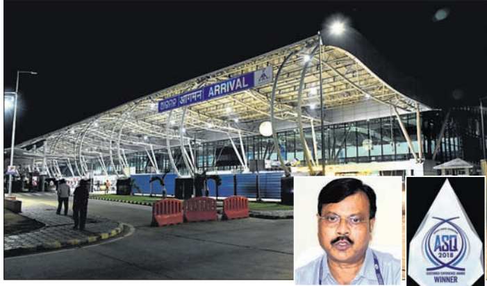
ଭୁବନେଶ୍ୱର ବିମାନବନ୍ଦର ଗୁରୁତ୍ୱପୂର୍ଣ୍ଣ ସମ୍ପାଦନା ଦୃଶ୍ୟ।