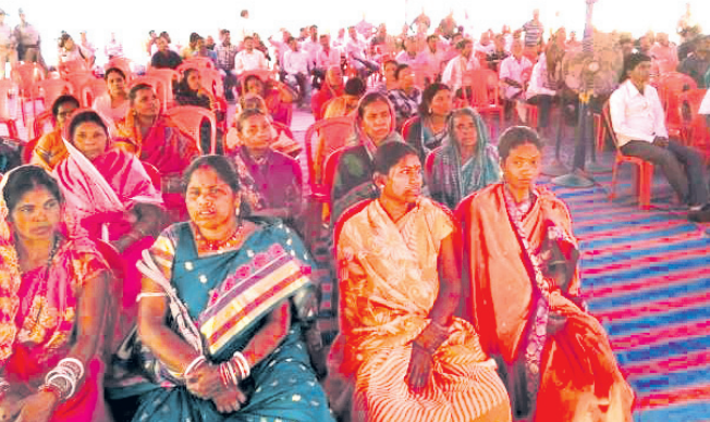
ଶିବିରରେ ଉପସ୍ଥିତ ଜନ ସାଧାରଣ।