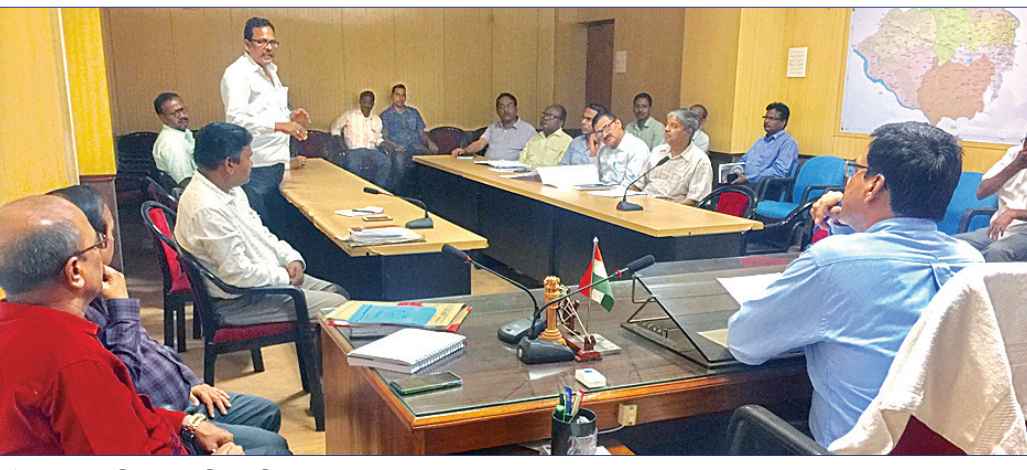
ଟିଏଫ୍ରେ ଉପସ୍ଥିତ ପ୍ରଶାସନିକ ଓ ବିଭାଗୀୟ ଅଧିକାରୀ।

ଜିଲାପାଳଙ୍କ ଅଧିକାରୀରେ ଅନୁଷ୍ଠିତ ଟିଏଫ୍ରେ ପୂର୍ବତନ ରେଳପଥ, ବ୍ୟବସାୟୀ ସଂଘ, ଏମ୍ପିଏଏଲ୍ ଓ ତାଳଚେର ସୁରକ୍ଷା ମଞ୍ଚ କର୍ମଚାରୀମାନେ ଯୋଗ ଦେଇଥିଲେ। ସ୍ଥାନୀୟ ବ୍ୟବସାୟୀ ସଂଘ ଓ ଜନସାଧାରଣଙ୍କ ସ୍ୱାର୍ଥକୁ ଦୃଷ୍ଟିରେ ରଖି ଶର୍ମା ଛକ ଓ ହାଣ୍ଡିଧୁଆ ଛକ ମଧ୍ୟରେ ଓଭରବ୍ରିଜ୍ ବଦଳରେ ଅଣ୍ଡରପ୍ରିଜ୍ କରାଯିବ ବୋଲି ଜିଲାପାଳ ସ୍ପଷ୍ଟ କରିଥିଲେ। ଏ ନେଇ ରେଳ ବିଭାଗ ପକ୍ଷରୁ ପୂର୍ଣ୍ଣ ବିଭାଗକୁ ସବିଶେଷ ତଥ୍ୟ ୭ ଦିନ ମଧ୍ୟରେ ପ୍ରଦାନ କରାଯିବ ବୋଲି ଜିଲାପାଳ କହିଥିଲେ। ଏହାପରେ ଅଣ୍ଡରପ୍ରିଜ୍ରେ ଡିଜାଇନ ଥିବା ସହ ୪ ମାସ ମଧ୍ୟରେ ନିର୍ମାଣ ଶେଷ ହେବ ବୋଲି ଜିଲାପାଳ ସୂଚନା ଦେଇଥିଲେ। ଏମ୍ପିଏଏଲ୍