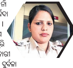
—ରାତାରାଣୀ ପ୍ରଧାନ ସରକାରଙ୍କୁ ବନ୍ଧୁକରି, ବର୍ଅଁରପାଳ ଥାନା

ସ୍ୱାମିକି ହେଉ ଅବା ଅର୍ଥନୈତିକ, ପ୍ରତି କ୍ଷେତ୍ରରେ ନାରୀ ଆଜି ବହୁ ଉଜ୍ଜ୍ୱଳ । ବିଶେଷକରି ସ୍ୱୟଂ ସହାୟକ ଗୋଷ୍ଠୀ ଗଠନ କରି ଅନେକ ନାରୀ ସ୍ୱାବଲମ୍ବୀ ହୋଇପାରିଛନ୍ତି । ସରକାରଙ୍କ ପକ୍ଷରୁ ମିଳୁଥିବା ଆର୍ଥିକ ସହାୟତା ସେମାନଙ୍କ ଦୈନିକର ବହୁ ସମସ୍ୟା ଦୂର କରିପାରୁଛି । ବିଭିନ୍ନ ସମୟରେ ରଣ ଆଣି ଠିକଣା ସମୟରେ ପରିଶୋଧ କରିବା ସେମାନଙ୍କ ଦକ୍ଷତାର ପ୍ରମାଣ ଦେଉଛି ।