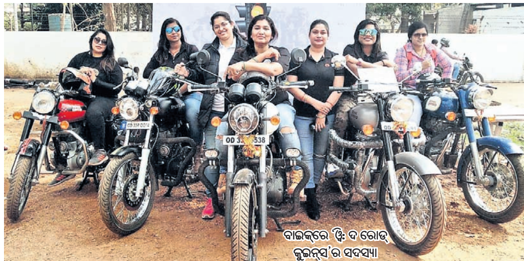
ବାଇକ୍‌ରେ ଝି: ଦ ରୋଡ୍ କୁଇନ୍ସ'ର ସଦସ୍ୟା

ମାନେ ରାସ୍ତାର ରାଣୀ। ରାସ୍ତାରେ ବାଇକ୍ ଚଳାଇବାକୁ ଲୋକେ ଏମାନଙ୍କୁ ଗାଡ଼ି ଅଟକାଇ ଅନାନ୍ଦି। ଯେଉଁ ବାଇକ୍ ଚଳାଇବାକୁ ଅନେକ ପୁରୁଷ ଭୟ କରନ୍ତି, ତାକୁ ଏମାନେ ବେଶ୍ ଆରାମରେ ଚଳାନ୍ତି। ୧୦୦, ୨୦୦ ସିସି ନୁହେଁ, ୮୦୦, ୧୦୦୦ ସିସି ବାଇକ୍ ଚଳାଇବା ଏମାନଙ୍କ ପାଇଁ ସାମାନ୍ୟ କଥା। ବୁଲେଇ, ହାଲି ଚାଉଁଡ଼, ଅଣ୍ଡରବାଟ୍, ଆଭେଞ୍ଜର ଭଳି ବାଇକ୍ ଉପରେ ରାଇ କରୁଥିବା ଏହି ମହିଳାମାନେ ହେଲେ ଆଜିର ରୋଡ୍ କୁଇନ୍। କେତେବେଳେ ଓଡ଼ିଶା ବେଶ୍‌ପୋଷାକରେ ତ କେତେବେଳେ ବାଇକ୍ କ୍ୟାକେଟ୍ ସହ ଏମାନେ ବାଇକ୍ ନେଇ ରାସ୍ତାକୁ ଓହ୍ଲାଇଛନ୍ତି। ଝିଅ ଓ ମହିଳା ବାଇକ୍ ଚଳାଇବା ଆଜି ବି ସମାଜ ପାଇଁ ଅଗ୍ରହଣୀୟ ହୋଇଥିବା ବେଳେ ଏହି ମହିଳା ବାଇକ୍ ଗ୍ରୁପ୍ କିମ୍ବଦନ୍ତୀ ପ୍ରତିବନ୍ଧକ ତେଜ ମାଲକୀଶୁକ୍ତ ପ୍ରତିଷ୍ଠା କରିଛନ୍ତି। ଏହା କେବଳ ଅନ୍ୟମାନଙ୍କ ପାଇଁ ଉଦାହରଣ ସୃଷ୍ଟି କରିନି, ବରଂ ମହିଳାମାନେ ଯେକୌଣସି କ୍ଷେତ୍ରରେ ସଫଳ ହୋଇପାରିବେ, ତାହା ପ୍ରମାଣିତ କରିଛନ୍ତି।