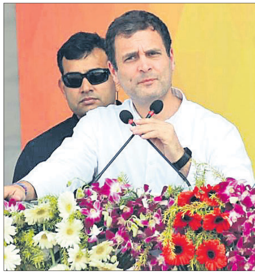
ସମାବେଶରେ କଂଗ୍ରେସ ଅଧ୍ୟକ୍ଷ ରାହୁଲ ଗାନ୍ଧୀ ଉଦ୍‌ବୋଧନ ଦେଉଛନ୍ତି ।

ଜୟପୁର, ୮ମ (ଡି.ଏନ୍.ଏ./ନି.ପ୍ର.) ଓଡ଼ିଶାରେ ମୁଖ୍ୟମନ୍ତ୍ରୀ ଶାସନ କରୁନାହାନ୍ତି । ବର୍ଷ ୪ରୁ ୫ ଜଣ ଅଫିସରଙ୍କ ଦ୍ୱାରା ପରିଚାଳିତ ହେଉଛନ୍ତି ରାଜ୍ୟ ସରକାର । ରାଜ୍ୟାଳ ପ୍ରସଙ୍ଗରେ ମୋଦି ସରକାର ସୁନାବେଢ଼ା ସ୍ଥିତ ହାଲ୍ ବଦଳରେ ଅଧୀନକୁ ଅନୁକମ୍ପା ଦେଖାଇ ଗ୍ଲାମାୟ ମୁଦତା ମୁଦକଙ୍କୁ ବେକାର କରିଛନ୍ତି । କଂଗ୍ରେସ ଅଧ୍ୟକ୍ଷ ରାହୁଲ ଗାନ୍ଧୀ କୋରାପୁଟ ଜିଲ୍ଲା ଜୟପୁର ସମାବେଶକୁ ଶୁକ୍ରବାର ସାଫଲ୍ୟପୂର୍ଣ୍ଣ କରି ଉତ୍ତର ରାଜ୍ୟ ଓ କେନ୍ଦ୍ର ସରକାରଙ୍କୁ ଏହିଭଳି କହି ଟାଣିବେ କରିଛନ୍ତି । ଏହାସହ ମହିଳା ଭୋତରକୁ ନିଜ ଫୋକସରେ ରଖି ସେମାନଙ୍କ ପାଇଁ ବିଭିନ୍ନ ପ୍ରତିଷ୍ଠିତି ମଧ୍ୟ ବାଡ଼ିଛନ୍ତି ।