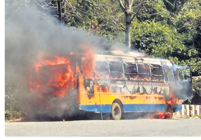
ଜଳିଯାଇଥିବା ବସ୍। ପାଣି ପକାଇ ଆୟତ୍ତ କରିବାକୁ ଚେଷ୍ଟା କରିଥିଲେ ମଧ୍ୟ ନିଆଁ ଚାପ ଥିନି ନ ଥିଲା। ଯାତ୍ରୀମାନେ ବସ୍‌ରେ ନ ଥିବାରୁ କାହାକୁ ବସ୍ ଜଳିଗଲା ବୋଲି ଡାକ ଛାଡ଼ିଥିଲେ।

ମୟୂରଭଞ୍ଜ ଜିଲ୍ଲା ବାଲିଗୋଷ୍ଠି ଘାଟି ଉପରେ ଅଟକିଥିବା ଏକ ଯାତ୍ରୀବାହୀ ବସ୍ ଠିଆ ଠିଆ ଜଳିଯାଇଛି। ବସ୍‌ଟି ଜଳିପାଉଁଶ ହୋଇଯାଇଛି। ତେବେ ଏଥିରେ ଯାତ୍ରୀ ନ ଥିବାରୁ କେହି ହତାହତ ହୋଇନାହାନ୍ତି। ଶୁକ୍ରବାର ସକାଳେ ଏକ ଘରରାଜ ବସ୍ (ଓଡି ୦୯ କେ ୧୮୮୭)କରଖିଆ , ସିଙ୍ଗଡ଼ା ଅଞ୍ଚଳରୁ ପ୍ରାୟ ୫୦ ଲୋକଙ୍କୁ ଛଡ଼ାରେ ନେଇ ସର୍ବଶ୍ୱା ଆ ଛୋଟି ପାଇଁ ବେନଟି ଅଞ୍ଚଳକୁ ଆସୁଥିବାବେଳେ ଘାଟିରେ ଅଟକିଥିଲା। ଯାତ୍ରୀମାନେ ଓହ୍ଲାଇ ଦ୍ୱାରଶୁଣି ମିନିରବର୍ତ୍ତନ ନିମନ୍ତେ ଯାଇଥିଲେ। ହେଲେ ହଠାତ୍ ବସ୍‌ରେ ନିଆଁ ଲାଗି ହୁ ହୁ ହୋଇ ଜଳିବାକୁ ଲାଗିଥିଲା। ଘାନୀୟ ଲୋକେ ଦେଖି ବସ୍ ଜଳିଗଲା ବୋଲି ଡାକ ଛାଡ଼ିଥିଲେ।