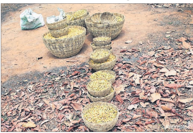
ଶୁଖିଲା ଓ କଞ୍ଚା ମହୁଳ ସଂଗ୍ରହ କରି ରଖାଯାଇଛି।

କରୁଥିବାରୁ ବୃଦ୍ଧ ଅଞ୍ଚଳରେ ଆଦିବାସୀ ସମ୍ପ୍ରଦାୟ ରୋଜଗାରପତ୍ତା ହରାଇ ହତାଶ ହୋଇପଡିଛନ୍ତି। ସରକାରଙ୍କ ପରିବର୍ତ୍ତନ ନିୟମ ଅନୁଯାୟୀ ଜଙ୍ଗଲଜାତ ବ୍ରହ୍ମଚ୍ୟୁ ସଂଗ୍ରହ ଉପରେ କେତେକ କଟକଣା ଜାରି କରାଯାଇଛି। ଆଦିବାସୀମାନେ ଜଙ୍ଗଲକୁ ଜୀବନ ଜୀବିକାରେ ସଙ୍କଟରେ ପକାଇଛି। ସରକାର ଓ ପ୍ରଶାସନ ମହୁଳ ଭଳି ଲଘୁବନଜାତ ବ୍ରହ୍ମଚ୍ୟୁ ସମ୍ପୂର୍ଣ୍ଣ ଅଣଦେଖା