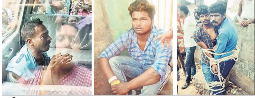
ପୋଲିସ ବ୍ରାଉନର ମାତ ଖାଇବା ପରେ ୩ ବ୍ରାଉନ ସୁଗାର ବେପାରୀଙ୍କୁ ବାନ୍ଧି ମାତ ମାଗୁଛନ୍ତି ବସ୍ତ୍ରବାସିନୀ । ତାଙ୍କୁ ଆନାକୁ ନିଆଯାଉଛି ।

ଭୁବନେଶ୍ୱର, ୮ମ (ବୁଧବେଳା) କବଚ ଆକରେ ପୋଲିସ ବ୍ରାଉନ ସୁଗାର ଲୁଚାଇବା ଘଟଣାରେ ଧରାପଡ଼ି ଗ୍ଲାମାୟ ଲୋକଙ୍କଠାରୁ ଛେଚା ଖାଇଛି । ଏଥିସହ ଲୋକେ ବ୍ରାଉନ ସୁଗାର କାରବାର କରୁଥିବା ୩ ମୁଦକଙ୍କୁ ମଧ୍ୟ ଏକ ଖୁଣ୍ଟରେ ବାନ୍ଧି ନିର୍ଧାରି ପିଟିଛନ୍ତି । ଶୁକ୍ରବାର ଏକକି ଘଟଣା ନୟାପଲ୍ଲୀ ଥାନା ଅଧୀନ ସାଲିଆସାହିରେ ଘଟିଛି ।