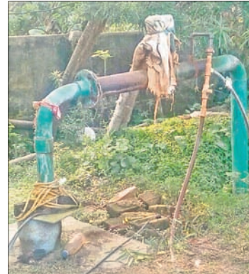
ଅଟଳ ହୋଇପଡ଼ିଥିବା ପାଣିପଞ୍ଚ।

ଦୀର୍ଘ ୫ରୁ ୬ ବର୍ଷ ଧରି ଗ୍ରାମ୍ୟ ଜଳଯୋଗାଣ ବିଭାଗ ତରଫରୁ ଏହି ଗ୍ରାମରେ ପାଇପ୍ ଯୋଗେ ପାନୀୟ ଜଳଯୋଗାଣ ବ୍ୟବସ୍ଥା ହୋଇଥିଲା। ଗ୍ରାମର ପ୍ରାୟ ୩୦୦ରୁ ଊର୍ଦ୍ଧ୍ୱ ପରିବାର ଏହା ଉପରେ ନିର୍ଭର କରି ଚଳିଆଥିଲେ। ଗତ କିଛିଦିନ ତଳେ ପାଣି ପଞ୍ଚାୟତ ସଂଲଗ୍ନ ବାସନ୍ତୀ ପ୍ରତିକାର ନ କରି ନୀରବ ରହିବା ବିଭାଗର ପାରିବାପଣିଆ ଉପରେ ପ୍ରଶ୍ନବାଚୀ ସୃଷ୍ଟି କରିଛି। ଆଗରୁ ଏହି ସମସ୍ୟା ଆହୁରି ଉଚ୍ଚତ ହେବ ଏଥିରେ ସନ୍ଦେହ ନାହିଁ। ଏଭଳି ଏକ ନିଜର ଦେଖିବାକୁ ମିଳିଛି ବାଲିଆପାଳ ବ୍ଲକ୍ ଅନ୍ତର୍ଗତ କୁନ୍ଦରା ଗ୍ରାମରେ।