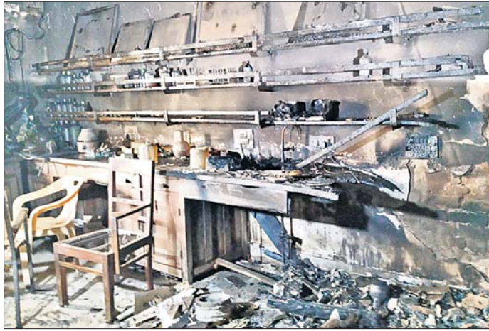
କଳିଯାଇଥିବା ଯନ୍ତ୍ରପାତି ଓ ଆସବାବପତ୍ର ।

ଏସ୍‌ସିବି ମେଡିକାଲ ପାଥୋଲୋଜି ବିଭାଗର ପାଥୋଲୋଜି ଯୁନିଟ୍‌ରେ ଅଗ୍ନିକାଣ୍ଡ ଘଟିଛି । ଯୁନିଟ୍‌ରେ ଅଗ୍ନି ଓ ଘୋର କ୍ଷତି ହୋଇଛି । ଯୁନିଟ୍‌ରେ ଅଗ୍ନି ଓ ଘୋର କ୍ଷତି ହୋଇଛି । ଯୁନିଟ୍‌ରେ ଅଗ୍ନି ଓ ଘୋର କ୍ଷତି ହୋଇଛି ।