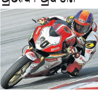
ଦେଶର, ୮ ମାର୍ଚ୍ଚ (ପି.ଟି.): ମାଲେସିଆର ସେପକ୍‌ସ୍‌ର ନ୍ୟାସନାଲ୍ ସର୍କ୍ସରେ ଏସିଆ ରୋଡ୍‌ରେସିଂ ଚାମ୍ପିୟନଶିପ୍ (ଏଆର୍ଆରସିଂ)ର ପ୍ରଥମ ରାଉଣ୍ଡ ଶନିବାର ଆରମ୍ଭ ହେବା ୨୦୧୯ ସିଜନର ଏହି ପ୍ରଥମ ରାଉଣ୍ଡରେ ୬ ଦେଶର ୨୫ ରାଜ୍ୟର ଭାରତବନ୍ଦୀ କାର୍ଯ୍ୟକ୍ରମ ରହିଛି । ଏହି ସମ୍ମାନଜନକ କ୍ଷେତ୍ର ପାଇଁ ଭିଡିଓ ପୁସ୍ତକ ହୋଇଛି । ଭେଦିଂ ଇଣ୍ଡିଆ ଟିମ୍ ନିଜକୁ ପ୍ରସ୍ତୁତ କରିଛି । ଦଳର ୨ ଦିନିଆ ପ୍ରି-ସିଜନ ଟ୍ରେନ୍ସିଂ ଗୁରୁଦିନ ସଫଳତାର ସହ ଶେଷ ହୋଇଛି । ହୋଇଛି । ଭେଦିଂ ଇଣ୍ଡିଆ ଟିମ୍‌ର ଅଭିଜ୍ଞ ଗାଜା ସେଥି ଯୁବ ରାଜ୍ୟର ସେହିଲି କୁମାର ପ୍ରି-ସିଜନ ଟ୍ରେନ୍ସିଂରେ ସମାପନକ ଗାଜାମିଂରେ ଭବିତ ଆସିଛି ।