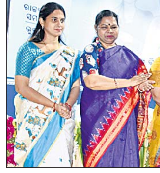
ରାଜ୍ୟସ୍ତରୀୟ ଆନ୍ତର୍ଜାତିକ ମହିଳା ଦିବସ ସମାରୋହରେ ଜଣେ ମହିଳାଙ୍କୁ ସମ୍ମାନିତ କରାଯାଇଛି ।

ମହିଳାମାନଙ୍କ ସଫଳତାର ଜୟଗାନ ସହିତ ସେମାନଙ୍କୁ ନ୍ୟାୟ ଅଧିକାର ଦେବା ଓ ସମ୍ମାନ କରିବା ଆନ୍ତର୍ଜାତିକ ମହିଳା ଦିବସ ପାଳନର ମୁଖ୍ୟ ଉଦ୍‌ଦେଶ୍ୟ ।