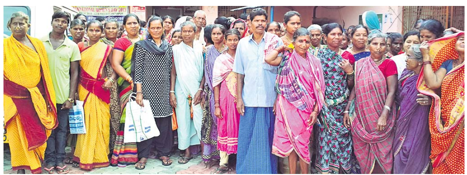
ବଡ଼ଠକ୍ ଅଭିଯୋଗ କରିବାକୁ ଆସିଥିବା ମହିଳା ଓ ପୁରୁଷ।

ପାତ୍ରପୁର, ୮ମାର୍ଚ୍ଚ(ଡି.ଏନ୍.ଏ.) ପାତ୍ରପୁର ବ୍ଲକ୍ ସାମାଜିକସେବା ପଞ୍ଚାୟତ କ୍ଷେତ୍ରାଧିକାରୀ ଗ୍ରାମରେ ଥିବା ଏକ ପୋଖରୀ କାମରେ ଦୁର୍ଗାତି ହୋଇଥିବା ଶୁକ୍ରବାର ବହୁ ମହିଳା ପୁରୁଷ ବିଭିନ୍ନ ନିକଟରେ ଅଭିଯୋଗ କରିଛନ୍ତି। ଗ୍ରାମରେ ଥିବା ଗୋଷାଳ ପୋଖରୀ ଖୋଳା ୨ ସପ୍ତାହ ହେଲା ଚାଲୁଥିବା ବେଳେ ଆକାଶକୁ ଚଳା ଆସିଛି କିନ୍ତୁ ୧୨ ଦିନ କାମକୁ ୧୧୦ ଟଙ୍କା ହିସାବରେ ୧୧ ଦିନର ଚଳା ଆସିଛି। ଏନେଇ ଶ୍ରମିକମାନେ ଅସରୋଷ ବ୍ୟତୀ କରିଛନ୍ତି। ପୂର୍ବରୁ ପୋଖରୀ କାମରେ ୧୬୦ରୁ ୧୭୦ ଟଙ୍କା ମଧୁର ମିଳୁଥିବା ବେଳେ ଏଥର ଏତେ କମ୍ ଟଙ୍କାରେ କିଛି କାମ କରିବେ ବୋଲି ସେମାନେ କହିଛନ୍ତି। ସରକାର ଶ୍ରମିକଙ୍କୁ କାମ ଯୋଗାଇ ଦେଇଥିବାବେଳେ ପାତ୍ରପୁର ବ୍ଲକ୍‌ରେ ଶ୍ରମିକମାନଙ୍କ ପାଇଁ ମାରଣା ନୀତି ଅବଲମ୍ବନ କରାଯାଉଛି ବୋଲି ସେମାନେ କହିଛନ୍ତି। କେବଳ କୁଡ଼ିଆଳି ବୁହୁ ବ୍ଲକ୍‌ରେ ବହୁ କାମରେ ଦୁର୍ଗାତି ହେଉଛି। କମ୍ ଶ୍ରମିକ କାମ କରୁଥିବାବେଳେ ଅଧିକ ଶ୍ରମିକ ଦର୍ଶାଯାଉଛି, ଉପଯୁକ୍ତ ପାତ୍ରଣା ମିଳୁନାହିଁ ବୋଲି ଶ୍ରମିକମାନେ ଅଭିଯୋଗ କରିଛନ୍ତି। ସରକାର ଓ ଜିଲ୍ଲା ପ୍ରଶାସନ ଏଥିପ୍ରତି ଦୃଷ୍ଟି ଦେବାକୁ ସାଧାରଣରେ ଦାବି ହୋଇଛି। ଏ ନେଇ ବିଭିନ୍ନ ପ୍ରକାଶ ଚକ୍ର ବେହେରାଙ୍କୁ ପରାମର୍ଶ ଦେଇ ପ୍ରକୃତ ତଥ୍ୟ ଜଣାପଡ଼ିବ ବୋଲି କହିଛନ୍ତି।