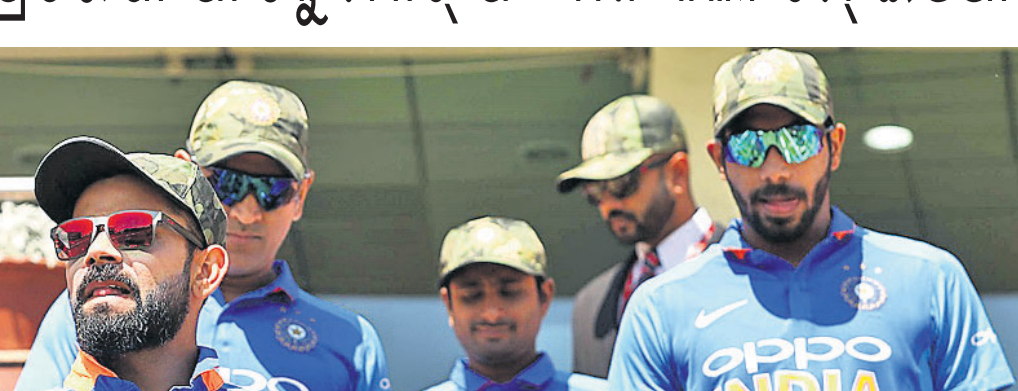
କ୍ଷତକୁ ମିଳିତାରା କ୍ୟାପ ପରିଧାନ ସହ ଭାରତୀୟ ଦଳର ଖେଳାଳିମାନେ ।

ରାଞ୍ଚି, ୮ ମାର୍ଚ୍ଚ । ଭାରତୀୟ କ୍ରିକେଟ ଦଳ ଏଠାରେ ପୁଲଫାନ୍ ଆଡକବାଦୀ ଆକ୍ରମଣରେ ଶହାଦ ହୋଇଥିବା ସ୍ୱାଧୀନକ ହେବାପରେ ଶ୍ରଦ୍ଧାଞ୍ଜଳୀ ଛାପି ନ ଥିବାରୁ ବିକେ ସେମାନଙ୍କ ଗୋଟିଏ ଦିନର ମ୍ୟାଚ୍ ଫି'କୁ ପ୍ରତିରକ୍ଷା ପାଣ୍ଡିକୁ ଦାନ କରିଛି । ଏଠାରେ ଅଷ୍ଟ୍ରେଲିଆ ବିପକ୍ଷ ୩୬ ଦିନିକିଆ ମ୍ୟାଚରେ ଭାରତୀୟ କ୍ରିକେଟ ଦଳର ସର୍ବନିମ୍ନ ମିଲିଟାରୀ କ୍ୟାପ୍ ପରିଧାନ କରିଥିଲେ । ଗୁଳି ସେନାର ଅବିଚାରିକ ଲ୍ୟୁଟନାଣ୍ଟ କର୍ନେଲ ପଦରେ ଥିବା ପୂର୍ବତନ ଅଧିନାୟକ ମହେନ୍ଦ୍ର ସିଂ