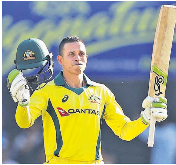
ଶତକ ହାସଲ ପରେ ଉତ୍ସାହୀନ ଖାଜା ଓ ବିରାଟ କୋହଲି ।