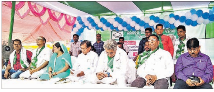
ଶରଣଶୁକଳାରେ ହୋଇଥିବା କାର୍ଯ୍ୟକ୍ରମରେ ବ୍ୟାନରରେ ଦଳୀୟ ଚିହ୍ନ ।

ନୟାଗଡ଼ ଜିଲ୍ଲାରେ ବିଭିନ୍ନ ସରକାରୀ କାର୍ଯ୍ୟକ୍ରମରେ ଦଳୀୟ ଚିହ୍ନ ଥିବା ବ୍ୟାନର ଲଗାଯାଉଥିବା ଦେଖିବାକୁ ମିଳୁଛି । ଯାହାକୁ ନେଇ ବିଭିନ୍ନ ମହଲରେ ଅସନ୍ତୋଷ ପ୍ରକାଶ ପାଉଛି । ଲୋକମାନେ ଏହାକୁ ସରକାରୀ କାର୍ଯ୍ୟକ୍ରମ ନା ଦଳୀୟ କାର୍ଯ୍ୟକ୍ରମ କହିବେ ସେ ନେଇ ଦୃଷ୍ଟରେ ପଡ଼ି ଯାଉଛି ।