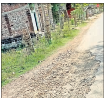
ନିର୍ମମାନ କାର୍ଯ୍ୟ ଯୋଗୁ ଏକ ରାସ୍ତାକୁ ପିଚୁର ଠିକାଦାର ଦୃଷ୍ଟି ହୋଇଛି ।

ନୟାଗଡ଼ ଜିଲ୍ଲା ନୂଆଗାଁ ବ୍ଲକରେ ଗ୍ରାମ୍ୟ ଉନ୍ନୟନ (ଆରଡି) ବିଭାଗ ଦ୍ୱାରା ଦ୍ୱାରା ଦିତ ହେଉଥିବା ରାସ୍ତାକାର୍ଯ୍ୟ ଅତି ନିର୍ମମାନ ବୋଲି ଅଭିଯୋଗ ହୋଇଆସୁଛି । ସରକାରଙ୍କ ନିୟମ ଅନୁସାରେ ଆରଡି ବିଭାଗ ଦ୍ୱାରା ହେଉଥିବା ରାସ୍ତାକାର୍ଯ୍ୟ ଶେଷହେବା ପରେ ୫ବର୍ଷ ପର୍ଯ୍ୟନ୍ତ ତାହାର ରକ୍ଷଣାବେକ୍ଷଣ ଦାୟିତ୍ୱ ଠିକାଦାର ବହନ କରିବେ । ଠିକାଦାର ଏହା ଠିକ୍ ଭାବେ କରୁନାହାନ୍ତି ନାହିଁ ତାହାକୁ ବିଭାଗୀୟ ଅଧିକାରୀ ତଦାରଖ କରିବାକୁ କିଛି ଏଥିରେ ଅବହେଳା କରାଯାଉଛି । ଫଳରେ ନିର୍ମାଣ ହୋଇଥିବା ରାସ୍ତା ଖୁବ୍ ଅଳ୍ପଦିନ ମଧ୍ୟରେ ଶୋଚନୀୟ ହୋଇପଡୁଛି ।