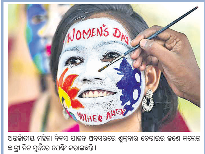
ଅନ୍ତର୍ଜାତୀୟ ମହିଳା ଦିବସ ପାଳନ ଅବସରରେ ଶୁକ୍ରବାର ଚେନାଇର ଜଣେ ଜଣେକ ଛାତ୍ରୀ ନିଜ ମୁହଁରେ ପେଣ୍ଟିଂ କରାଇଛନ୍ତି।