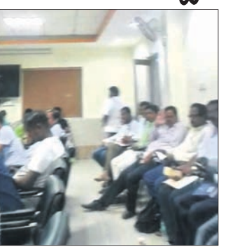
ପଞ୍ଚାୟତ ସମିତି ଅଧିବେଶନରେ ମହିଳାଙ୍କ ପରିବର୍ତ୍ତେ ପୁରୁଷମାନେ ବସିଛନ୍ତି ।

ନୟାଗଡ଼ ଜିଲ୍ଲା ସଦର ବ୍ଲକ ପଞ୍ଚାୟତ ସମିତି ଅଧିବେଶନ ନିୟମିତ ବସୁ ନ ଥିବା ଅଭିଯୋଗ ହେଉଛି । ପ୍ରତି ୨ ମାସରେ ଥରେ ଅଧିବେଶନ ବସିବାର ନିୟମ ଥିବାବେଳେ ଏହାକୁ ଅଣଦେଖା କରାଯାଉଛି । କେତେବେଳେ ୪ ମାସ ତ ଆଉ କେତେବେଳେ ୫ ମାସ ପରେ ବସୁଛି ସମିତି ଅଧିବେଶନ । ଗୁରୁତ୍ୱପୂର୍ଣ୍ଣ କଥା ହେଉଛି ମହିଳା ପ୍ରତିନିଧିମାନଙ୍କ ପରିବର୍ତ୍ତେ ଚାକ୍ଷୁଷାମାନେ ବୈଠକରେ ଉପସ୍ଥିତ ରହି ଆଲୋଚନାରେ ସାମିଲ ହେଉଛନ୍ତି । ଯାହାକି ପ୍ରଶ୍ନାସନର ପାରିଲାପଣିଆ ଦିନ ପ୍ରତି ଅକ୍ଷୁଳ ନିର୍ଦ୍ଦେଶ କରୁଛି । ଏ ନେଇ ସାଧାରଣରେ ବିଭିନ୍ନ ଚର୍ଚ୍ଚା ହେଉଛି ।