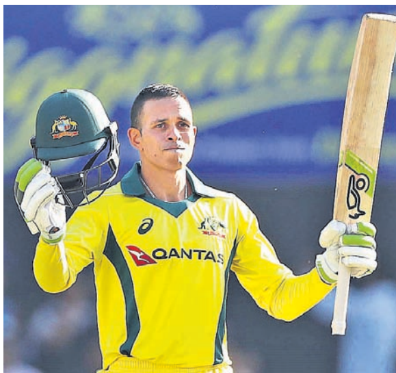
ଶତକ ହାସଲ ପରେ ଭାରତୀୟ ଖ୍ରୀଣୀ ଓ ବିରାଟ କୋହଲି ।