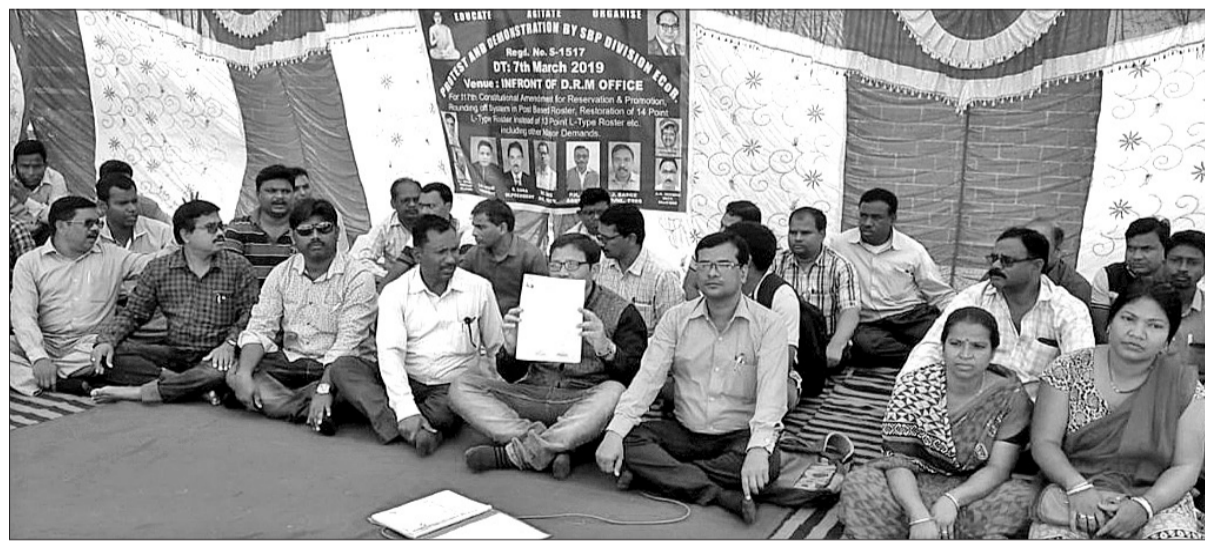
ଶୁଭକାରୀ ସମ୍ବଲପୁର ତିଆରବନ ଅଫିସ୍ ସମ୍ମୁଖରେ ଅଧିକ ଭାରତୀୟ ତହସିଲ କାଟି ଓ ଜନକାଟି ରେକର୍ଡ଼ କର୍ମଚାରୀ ସଂସ୍ଥ ପକ୍ଷରୁ ଧାରଣା ଦିଆଯାଇଛି ।