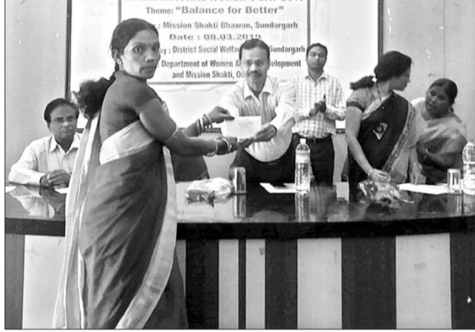
ଅନ୍ତର୍ଜାତୀୟ ମହିଳା ଦିବସ ପାଳନ ଅବସରରେ ଜଣେ ଆଶାକର୍ମୀଙ୍କୁ ପୁରସ୍କୃତ କରାଯାଇଛି।

ସୁରକ୍ଷିତ ସମାଜ ବ୍ୟବସ୍ଥାରେ ମହିଳାମାନେ ଏକ ଗୁରୁତ୍ୱପୂର୍ଣ୍ଣ ଭୂମିକା ନିର୍ବାହ କରିଆସୁଛନ୍ତି। ପରିବାରରୁ ଆରମ୍ଭ କରି ରାଷ୍ଟ୍ର ବିକାଶରେ ମହିଳାମାନଙ୍କ ସହଭାଗିତା ରହିଆସିଛି।