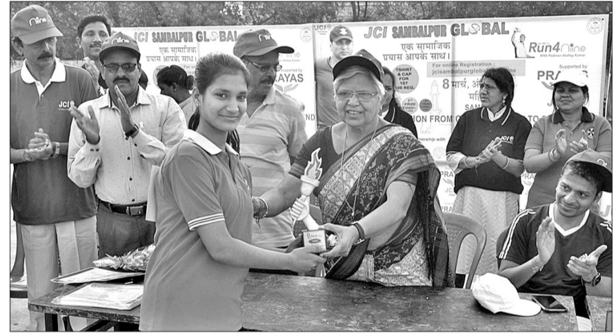
ମିନି ମାରାଥାନର ଜଣେ କୃତୀ ପ୍ରତିଯୋଗୀଙ୍କୁ ବିଧାୟକା ରାସେଶ୍ୱରୀ ପାଣିଗ୍ରାହୀ ପୁରସ୍କୃତ କରୁଛନ୍ତି ।