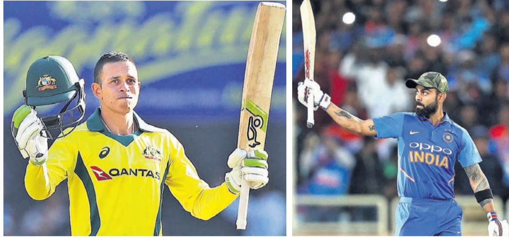
ଶତକ ହାସଲ ପରେ ଭବନୀନ ଖାଜା ଓ ବିରାଟ କୋହଲି।

ଅଧିନେତା ଭାବେ କୋହଲିଙ୍କ ୧୨୩ ରନର ଶତକାୟ ପାଳି (୯୫ ବଲ, ୧୬ ଟେକା, ୧ ଛକା) ସତ୍ତ୍ୱେ ଭାରତ ଦଳର ଦିନିଆ ନ୍ୟାଟ୍ରେ ଭ୍ରମଣକାରୀ ଅଷ୍ଟ୍ରେଲିଆଠାରୁ ୩୨ ରନରେ ପରାସ୍ତ ହୋଇଛି।