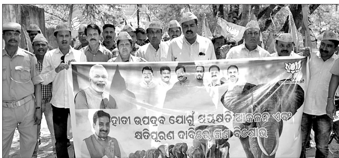
ଭାଜପା ପକ୍ଷରୁ ହାତୀ ଉପଦ୍ରବ ଯୋଗୁଁ ସ୍ତନ୍ୟପାନ ଅଧିକାରୀ ଓ ସ୍ତନପିଣ୍ଡର ଦାବିରେ ସମ୍ବଲପୁର ତିଏପଠ ଅଫିସ୍ ସମ୍ମୁଖରେ ବିକ୍ଷୋଭ କରାଯାଇଛି ।