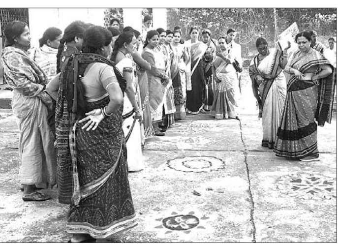
ରୁକ୍ଷ ଅଧ୍ୟକ୍ଷା ଓ ସିପିପିଓ ଖୋଟି ପ୍ରତିଯୋଗିତା ଦେଖୁଛନ୍ତି।

୨୦୧୫ ଏପ୍ରିଲ ୧ ପରଠାରୁ ବ୍ୟାଙ୍କରୁ ରଣ ନେଇ ନିୟମିତ କିଛି ପରିଶୋଧ କରୁଥିବା ବ୍ୟବସ୍ଥା କରାଯାଇଛି।