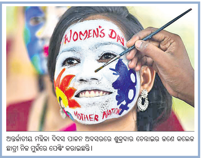
ଅନ୍ତର୍ଜାତୀୟ ମହିଳା ଦିବସ ପାଇଁ ଅବସରରେ ଶୁକ୍ରବାର ଚେନାଇର ଜଣେ କଲେଜ ଛାତ୍ରୀ ନିଜ ପୂର୍ଣ୍ଣରେ ପେଣ୍ଟି କରାଇଛନ୍ତି।

କର୍ମୀର ଚିପୋଟ୍ରେ ଭେଦ ହୋଇନାହିଁ। ଭାରତର ଆତଙ୍କବାଦ ନିରୋଧୀ ଦକ୍ଷତା ବୃଦ୍ଧିରେ ଆମେରିକା ସହାୟକ ହୋଇପାରିବ।