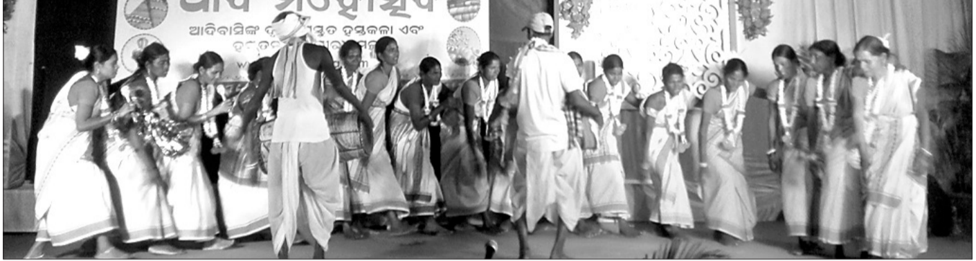
ଆଦି ଉତ୍ସବ ଉଦ୍‌ଯାପନା ସନ୍ଧ୍ୟାରେ ପରିବେଷିତ ଆଦିବାସୀ ନୃତ୍ୟ।