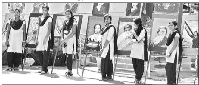
କଳାୟତନ ଛାତ୍ରଛାତ୍ରୀଙ୍କୁ ଛବି ଆଙ୍କିବାକୁ ଅନୁରୋଧ କରାଯାଇଛି।

ଅନ୍ତର୍ଜାତୀୟ ମହିଳା ଦିବସ ଅବସରରେ ସୁନ୍ଦରଗଡ଼ ଚାଲୁ ଓ କାରୁକଳା ମହାବିଦ୍ୟାଳୟ କଳାୟତନ ପକ୍ଷରୁ ପ୍ରାୟ ୩୦ ଛାତ୍ରୀଙ୍କୁ ଛବି ଆଙ୍କିବା କୌଶଳ ପ୍ରଦାନ କରାଯାଇଛି।