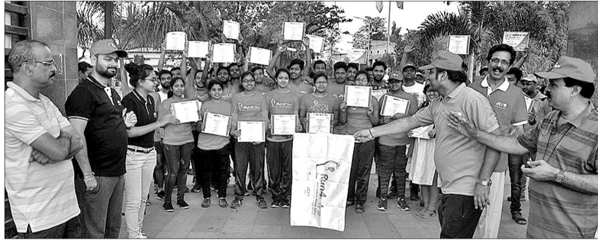
ଶୁଭକାରୀ ସମ୍ବଲପୁର କେଏସ୍ଆଇ ଦ୍ୱାରା ଆୟୋଜିତ ମିନି ମାରାଥନକୁ ଅତିଥିମାନେ ପତାକା ଦେଖାଇ ଉଦ୍ଘାଟନ କରୁଛନ୍ତି ।