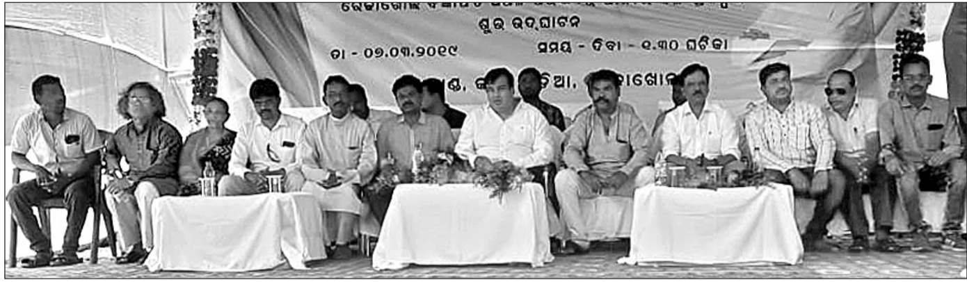
ରେଡ଼ାଖୋଲକୁ ମହାନଦୀରୁ ଜଳ ଯୋଗାଣ ପ୍ରକଳ୍ପ ଉଦ୍ଘାଟନ ଅବସରରେ ଆୟୋଜିତ ସଭାରେ ମହାଧିକାରୀ ବିଧାୟକ ଓ ଅନ୍ୟମାନେ ।

ରେଡ଼ାଖୋଲ/ସମ୍ବଲପୁର, ୮୩୩ (ଡି.ଏନ.ଏ./ବ୍ୟୁରୋ)