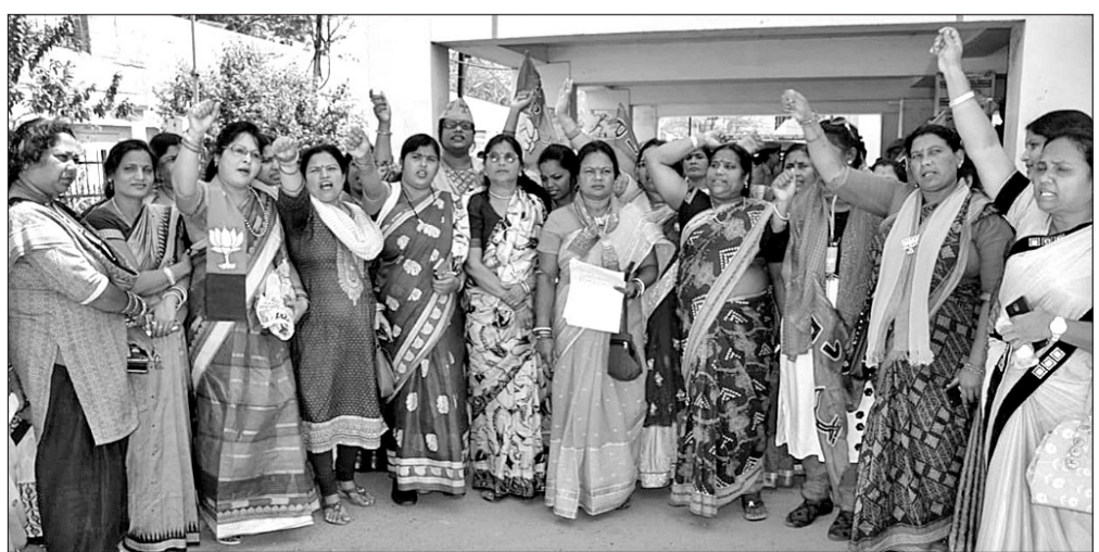
ସମ୍ବଲପୁର ଜିଲ୍ଲାପାଳଙ୍କ ଅଫିସ୍ ସମ୍ମୁଖରେ ମହିଳା ଭାଜପା କର୍ମୀ ଓ ନେତାମାନେ ମଦ ବିରୋଧରେ ବିକ୍ଷୋଭ ପ୍ରଦର୍ଶନ କରୁଛନ୍ତି ।