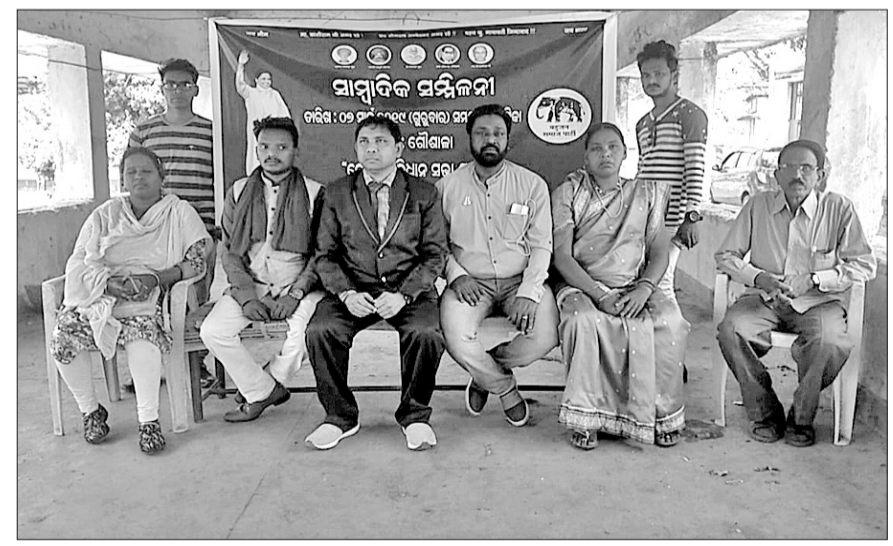
ରେଡ଼ାଖୋଲ ନିର୍ବାଚନ ମଞ୍ଚଳରେ ବିକାଶ ହୋଇ ନ ଥିବା ରୋଗୀଙ୍କ ମାର୍ଗଦର୍ଶନରେ ବିସ୍ତୃତ ଅଭିଯୋଗ କରୁଛି ।