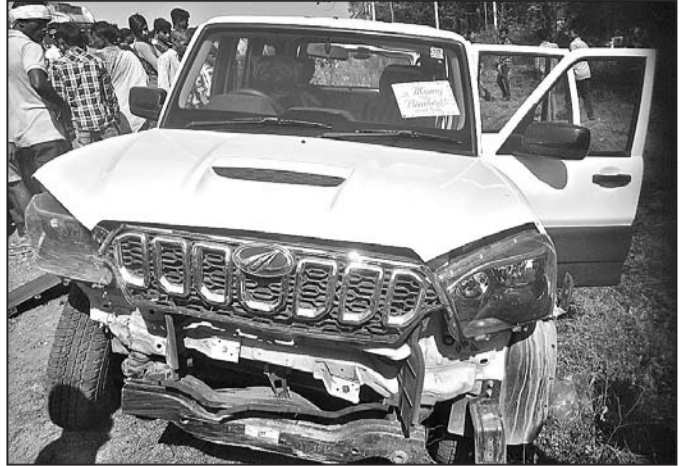
ଦୁର୍ଘଟଣାଗ୍ରସ୍ତ ଷ୍ଟେର୍ସ ଓ ଗାଡ଼ି।

ଓ ଯୋଜନାର ଲାଭ କିପରି ଉଠାଇବେ ସେ ନେଇ ବୁଝାଇଥିଲେ। ଆନ୍ତର୍ଜାତୀୟ ମହିଳା ଦିବସ ପାଳନ ଅବସରରେ ବିଭିନ୍ନ ପ୍ରତିଯୋଗିତା ହୋଇଥିଲା।