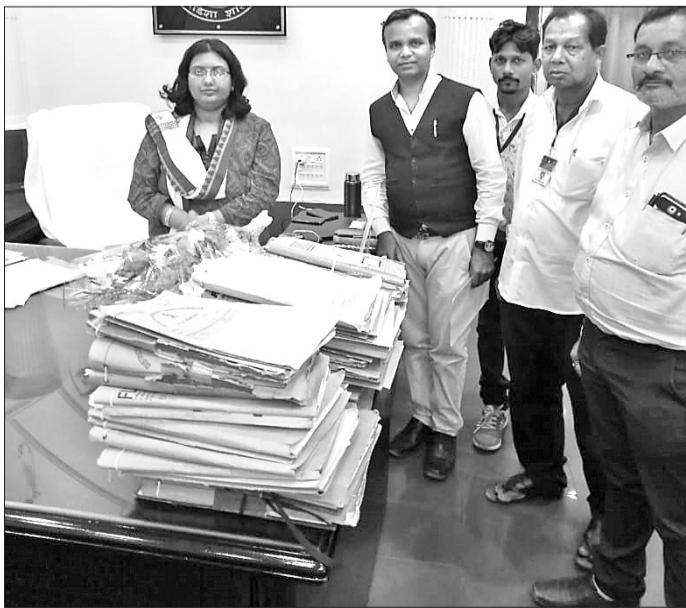
ମାନବାଧିକାର ସଙ୍ଗଠନ ତରଫରୁ ନୂତନ ଜିଲ୍ଲାପାଳଙ୍କୁ ସମ୍ବର୍ଦ୍ଧନା ଜଣାଯାଇଛି।