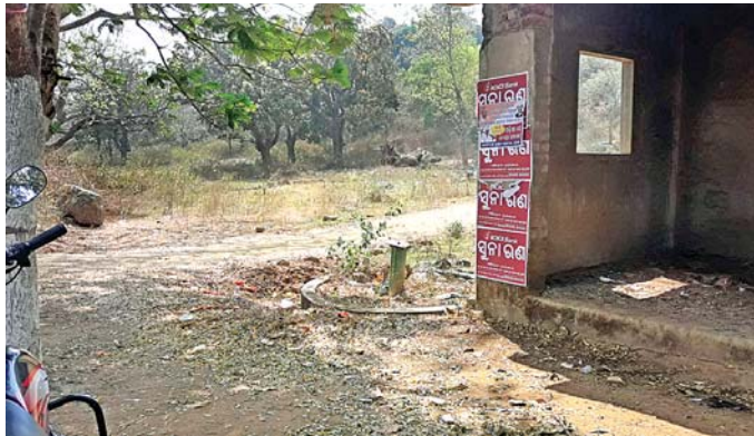
ମଜୁରିଆପକାଠାରେ ଏକ ନଳକୂପ ଖରାପ ହୋଇ ପଡ଼ିରହିଛି।

ଆଫୁଲି ଗ୍ରାମ ରୁ ଜିଲାର ବିଭିନ୍ନ ଗ୍ରାମରେ ଜଳସଂକଟ ଦେଖାଦେବାର ଆଶଙ୍କା ରହିଛି। ଏହାକୁ ଆଖି ଆଗରେ ରଖି ପ୍ରଶାସନ ପକ୍ଷରୁ ବ୍ୟାପକ ବ୍ୟବସ୍ଥା କରାଯାଇଛି।