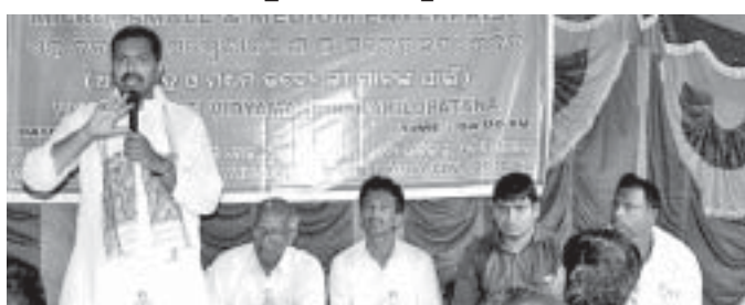
ଶିବିରରେ ଖଦୀ ଓ ଗ୍ରାମୋଦ୍ୟୋଗ ବୋର୍ଡ ଅଧ୍ୟକ୍ଷ ଓ ଅନ୍ୟମାନେ।

ରାଜ୍ୟ ଖଦୀ ଓ ଗ୍ରାମୋଦ୍ୟୋଗ ବୋର୍ଡ ତରଫରୁ ଅଣ୍ଟା, କ୍ଷୁଦ୍ର ଓ ମଧ୍ୟ ଉଦ୍ୟୋଗମାନଙ୍କ ପାଇଁ ଏକ ଦିନିକିଆ ସଚେତନତା ଶିବିର ଶନିବାର ମାର୍ଗାଘାଟ ବ୍ଲକ କରଲୋପାଟଣା ବ୍ଲକସ୍ତରୀୟ ବିଦ୍ୟାଳୟରେ ଅନୁଷ୍ଠିତ ହୋଇଯାଇଛି।