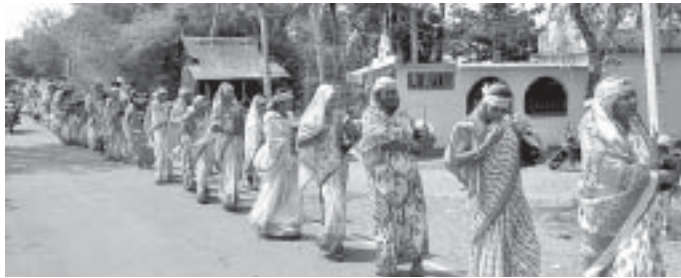
ସମ୍ମିଳନୀ ଅବସରରେ ମହିଳାଙ୍କ କବସ ଶୋଭାଯାତ୍ରା।

ରାଜନଗର ବ୍ଲକ କେରଡ଼ାଗଡ଼ଠାରେ ନାମାଚାର୍ଯ୍ୟ ଶ୍ରୀମତୀ ବାୟାବାବାଙ୍କ ପ୍ରାଦେଶିକ ଭଲ ସମ୍ମିଳନୀ ଆରମ୍ଭ ହୋଇଛି।