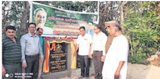
ପ୍ରକଳ୍ପ ଉଦ୍‌ଘାଟନ କରାଯାଉଛି।

ଖଣ୍ଡପଡ଼ା ବ୍ଲକ ଅନ୍ତର୍ଗତ ସିଧାପୁଳା ଗୋକୁଳାନନ୍ଦ ପୀଠ ପରିବେଶ ପର୍ଯ୍ୟଟନସ୍ଥଳରେ ଶନିବାର ସୌରଶକ୍ତି ପ୍ରକଳ୍ପର ଉଦ୍‌ଘାଟନ ଉତ୍ସବ ବିଧାୟକ ଅନୁକର ପକ୍ଷରୁ କରାଯାଇଛି।