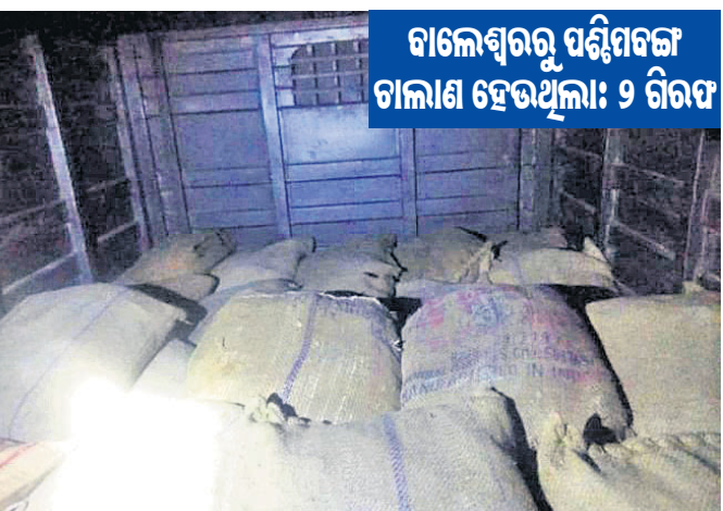
ବାଲେଶ୍ୱରରୁ ପଶ୍ଚିମବଙ୍ଗ ଚାଲାଣ ହେଉଥିଲା: ୨ ବିଟ

କବଚ ବିଦ୍ୟୋତକ ସାମଗ୍ରୀ। ବସ୍ତା/ରୂପସା, ୯।୩।(ବି.ଏନ.ଏ.) ନିକଟସ୍ଥ ଅଞ୍ଚଳରେ ଯୋଗ୍ୟ ତରଫରୁ କରାଯାଇଥିବା ବିଦ୍ୟୋତକ ସାମଗ୍ରୀ ଉପରେ ଉଚ୍ଚ ରାଜସ୍ୱରୁ ଜମା ହେଉଥିବା ଏହା ଉପରେ ବିଦ୍ୟୋତକ ସାମଗ୍ରୀର ମୂଲ୍ୟ ୧୦ କୋଟିରୁ ବୃଦ୍ଧି ପାଇଛି।