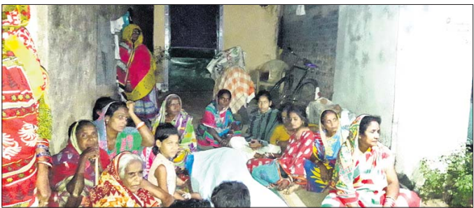
ଶୋକାଳୁକ ପରିବାର ଓ ସମ୍ପର୍କୀୟ।

ନୟାଗଡ଼ ଜିଲା ସଦର ଥାନା ଅନ୍ତର୍ଗତ ବାରବାଟୀ ଗ୍ରାମର ଜଣେ ଯୁବକ ଏକ ବିବାହ ଉତ୍ସବକୁ ବରଯାତ୍ରୀ ହୋଇ ଯିବାବେଳେ ବାଟରେ ଡାକର ମୃତ୍ୟୁ ଘଟିଛି। ଏହି ଘଟଣାକୁ କେନ୍ଦ୍ର କରି ଉଦ୍‌ବେଗିତା ପ୍ରକାଶ ପାଇଛି।