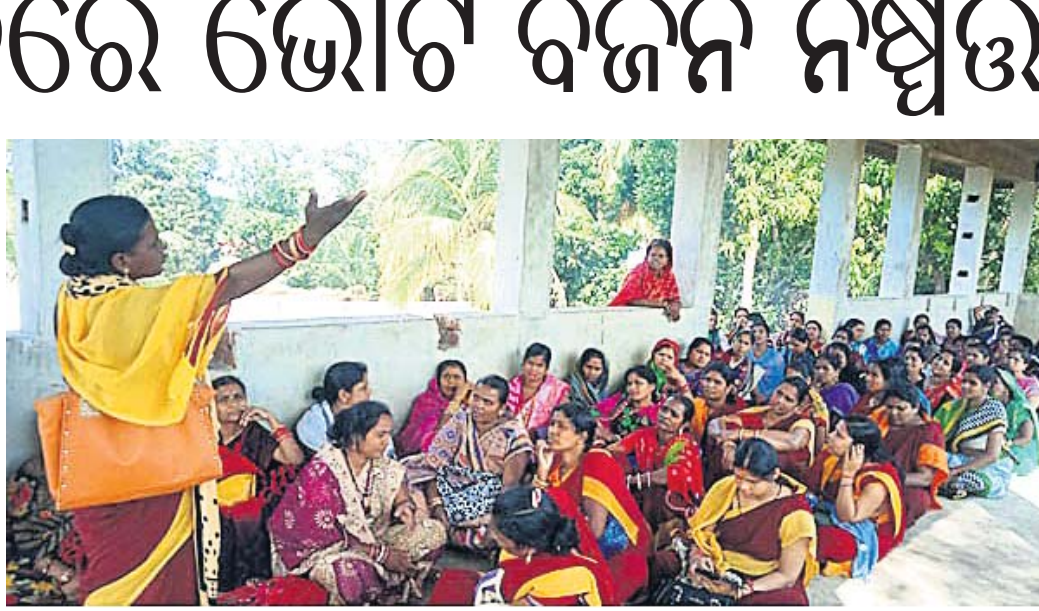
ଅଜ୍ଞାନତାକର୍ମୀ ଓ ସହାୟକାଙ୍କ ଦେଖିବା।

କେନ୍ଦ୍ର ଓ ରାଜ୍ୟ ସରକାର ଅଜ୍ଞାନତା କର୍ମୀ ଓ ସହାୟକାଙ୍କ ନ୍ୟାୟ ଦାବି ପ୍ରତି ଗୁରୁତ୍ୱ ଦେବ ନ ଥିବାରୁ ଖଣ୍ଡପଡ଼ା ବ୍ଲକ ଅନ୍ତର୍ଗତ ୧୨୯ ଅଜ୍ଞାନତା କର୍ମୀ ଓ ସହାୟକାମାନେ ଅସନ୍ତୋଷ ପ୍ରକାଶ କରିଛନ୍ତି।