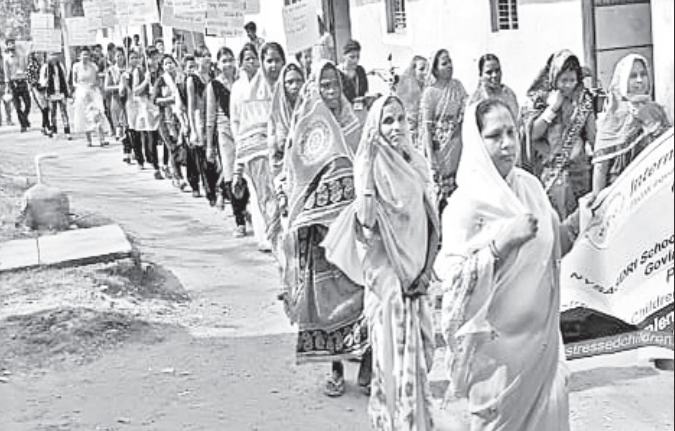
ମହିଳା ଦିବସରେ ବାହାରିଥିବା ସଚେତନତା ଶୋଭାଯାତ୍ରା।