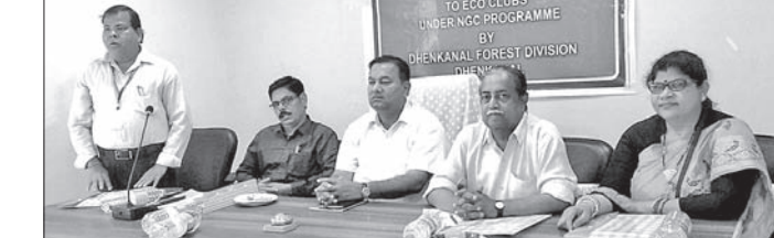
ଡେକାନାଲ ଅଫିସ, ୯୩