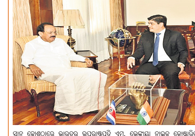
ସାନ୍ ଜୋସ୍‌ରେ ଭାରତର ଉପରାଷ୍ଟ୍ରପତି ଏମ୍. ବେଙ୍କରାୟା ନାଲୁ କୋଷ୍ଟାରିକା ରାଷ୍ଟ୍ରପତି କାର୍ଲୋସ୍ ଆଲଭାରାଡୋ ଚେବେରାଙ୍କ ସହ ସାମାଜିକ ଆତଙ୍କବାଦ ବନ୍ଦନ ଏବଂ ବୃତ୍ତାନ୍ତ ସମ୍ପର୍କ ବୃଦ୍ଧି ନେଇ ଆଲୋଚନା କରୁଛନ୍ତି।

ବାଗୁରୁ ଗ୍ରାମକୁ ନିଶ୍ଚିତ କରିବା ଲାଗି ଅପରେଶନ୍ କାରି ରଖିଛନ୍ତି। ନିଜକୁ ବଞ୍ଚାଇବା ପାଇଁ ଏବେ ଆଇଏସ୍ ଆତଙ୍କବାଦୀ ନିରାହ ଲୋକଙ୍କୁ ଡାକି କରୁଛନ୍ତି। ନିଜର ସୁରକ୍ଷା ଲାଗି ସେମାନେ ସାଧାରଣ ନାଗରିକଙ୍କ ଘରେ ଆଶ୍ରୟ ନେଉଥିବା ସିରିଆ ମାନବାଧିକାର ପର୍ଯ୍ୟବେକ୍ଷଣ ସଂସ୍ଥା କହିଛି। ଏସ୍‌ଡିଏଫ୍ ଉଚ୍ଚ ଅଞ୍ଚଳକୁ ସାଧାରଣ ନାଗରିକଙ୍କୁ ଅନ୍ୟତ୍ର ସ୍ଥାନାନ୍ତର ପ୍ରକ୍ରିୟା ଆରମ୍ଭ କରିଛି। ଶୁକ୍ରବାର ୪୦୦ ଉର୍ଦ୍ଧ୍ୱ ଟ୍ରକ୍ରେ ପୁରୁଷ, ମହିଳା ଓ ପିଲାମାନେ ଉଚ୍ଚ ଅଞ୍ଚଳ ଛାଡ଼ିଛନ୍ତି। ଏହାପରେ ବାଗୁରୁର ଆଇଏସ୍ ଆତଙ୍କବାଦୀଙ୍କୁ ନିପାତ କରିବା ଲାଗି ଶେଷ ଆକ୍ରମଣ କରାଯିବ ବୋଲି ଏସ୍‌ଡିଏଫ୍ ପକ୍ଷରୁ କୁହାଯାଇଛି।