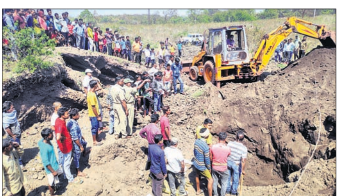
ଅତଡ଼ା ତଳେ ଯୋଡ଼ିହୋଇଥିବା ବ୍ୟକ୍ତିଙ୍କୁ ଉଦ୍ଧାର କରାଯାଇଛି ।

କେନ୍ଦୁଝର ଜିଲ୍ଲା ବଡ଼ବିଲ ଆନା ମାଟକାମଦେଠାସ୍ଥିତ କଳିଙ୍ଗ ଲୋହି କାରଖାନା(ଇଡକଲ କଳିଙ୍ଗ ଆଇରନ ଖାର୍ବ୍ ଲିମିଟେଡ)ର ବିପଦପୂର୍ଣ୍ଣ ଡ଼ିଞ୍ଚିଆରୁ ଚାଉଳକୋଳ ସଂଗ୍ରହ କରୁଥିବାବେଳେ ଅତଡ଼ା ଧସିଯିବାରୁ ଅତଡ଼ା ଧସିଯିବାରୁ ଚୋଳାଲୁଣ ଲୁଗା ଫେରିବେ ବୋଲି ପ୍ରକାଶ କରିଥିଲେ । ବଣପାହାଡ଼ ମୂଳକରେ ଆଜି ବି ଅନେକ ଗରିବ ବନ୍ଦାବାହି ଜଙ୍ଗଲ ଉପରେ ନିର୍ଭର କରି ରହୁଛନ୍ତି । ସେମାନେ ଜାଳକାଠ ସାଙ୍ଗକୁ ବିଭିନ୍ନ ରତୁକାଳାନ କାଳକାଠ ଆଣି ବିକିଥିବା କହିଥିଲେ । ବିକ୍ରି ପଇସାରେ ସେମାନେ ଚୋଳାଲୁଣ ଲୁଗା ଫେରିବେ ବୋଲି ପ୍ରକାଶ କରିଥିଲେ ।