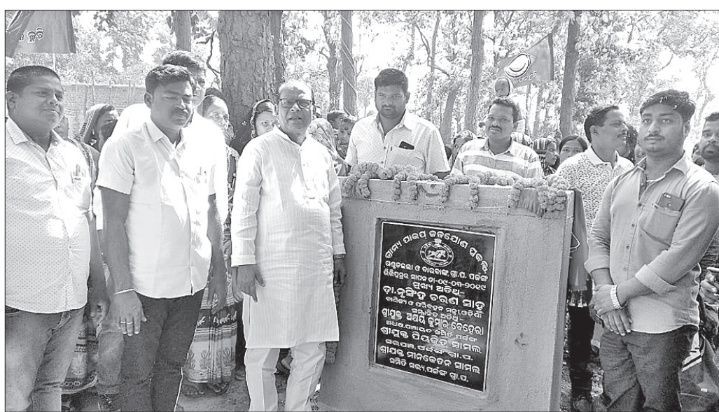
ପାନୀୟ ଜଳ ପ୍ରକଳ୍ପ ଶିଳାନିର୍ମାଣ ଅବସରରେ ମନ୍ତ୍ରୀଙ୍କ ସମେତ ଅନ୍ୟମାନେ।