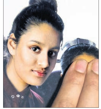
ନିମୋନିଆରେ ମୃତ୍ୟୁ ହୋଇଛି। ଏହା ପୂର୍ବରୁ ଶମିମା ଅନ୍ୟ ଦୁଇଟି ସନ୍ତାନଙ୍କୁ ଜନ୍ମ

ବିକ୍ରମ, ୯ମାର୍ଚ୍ଚ: ବ୍ରିଟେନ ଜନ୍ମିତ ଆଇଏସ୍ ସଦସ୍ୟା ଶମିମା ବେଗମଙ୍କର ୩ ସପ୍ତାହର ଶିଶୁପୁତ୍ରଙ୍କ ମୃତ୍ୟୁ ଘଟିଛି। ସେ ଗତ ମାସରେ ଉତ୍ତରପୂର୍ବ ସିରିଆସ୍ଥିତ ଏକ ଶରଣାଗତ ଶିବିରରେ ଶିଶୁଟିକୁ ଜନ୍ମ ଦେଇଥିଲେ। ୪ ବର୍ଷ ତଳେ ମାତ୍ର ୧୫ ବର୍ଷ ବୟସରେ ଲଣ୍ଡନ ଛାଡ଼ି ଇସ୍ଲାମାବାଦ ଷ୍ଟେଟ୍ ସ୍ତ୍ରୀ (ଆଇଏସ୍)ରେ ସାମିଲ ହୋଇଥିଲେ ଶମିମା। ସେ ନିଜ ଦେଶକୁ ଫେରିବାକୁ ଚାହୁଁଥିଲେ ମଧ୍ୟ ବ୍ରିଟେନ ସରକାର ତାଙ୍କ ନାଗରିକତାକୁ ରଦ୍ଦ କରିଦେଇଥିଲେ। ତାଙ୍କୁ ନିରାପଣ ଅନୁଯାୟୀ ତାଙ୍କ ଶିଶୁପୁତ୍ରଙ୍କର