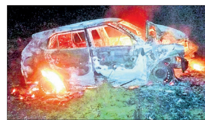
ସୁର୍ୟଗଣାରେ କାରଟି ଜଳିଯାଇଛି।