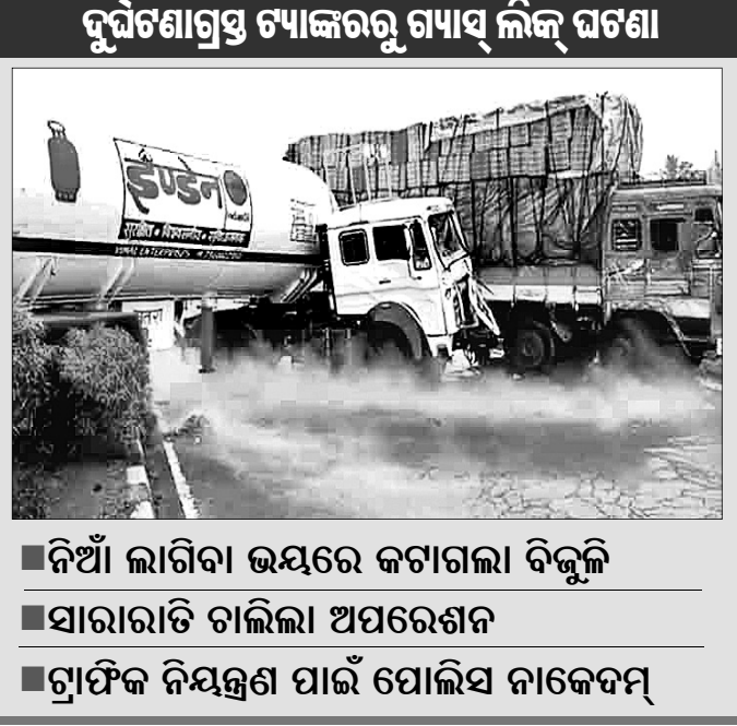
ଦୁର୍ଘଟଣାଗ୍ରସ୍ତ ଟ୍ରାକ୍ଟରରୁ ଗ୍ୟାସ୍ ଲିକ୍ ଘଟଣା ■ ନିଆଁ ଲାଗିବା ଭୟରେ ଜଟାଗଲା ବିଜୁଳି ■ ସାରାରାତି ଚାଲିଲା ଅପରେଶନ ■ ଟ୍ରାଫିକ୍ ନିୟନ୍ତ୍ରଣ ପାଇଁ ପୋଲିସ୍ ନାକେଦମ୍

ଏକ ଦୁର୍ଘଟଣାଗ୍ରସ୍ତ ଟ୍ରାକ୍ଟର ଗ୍ୟାସ୍ ଲିକ୍ ହେବା ଯୋଗୁ ୧୬ ନମ୍ବର ଜାତୀୟ ରାଜପଥରେ ଚଳାଚଳ ଦୀର୍ଘ ୧୩ ଘଣ୍ଟା ଧରି ବନ୍ଦ ରହିଥିଲା । ଶୁକ୍ରବାର ସନ୍ଧ୍ୟା ୭ଟା ୩୫ମିନିଟର ସମୟରେ ଟ୍ରାକ୍ଟର ଗ୍ୟାସ୍ ଲିକ୍ ବନ୍ଦ କରିବାକୁ ଚାଲିଥିଲା ଅପରେଶନ । ଟ୍ରାକ୍ଟର ନିୟନ୍ତ୍ରଣ କରିବାକୁ ଯୋଗ୍ୟ ହେବା ପରେ ଟ୍ରାକ୍ଟର ଗ୍ୟାସ୍ ପ୍ରଭାବ ଘାତୀୟ ଅଞ୍ଚଳକୁ ବ୍ୟାପିବାର ଆଶଙ୍କା ଯୋଗୁ ଲୋକେ ଭୟଭୀତ ହୋଇପଡ଼ିଥିଲେ । ସୁରକ୍ଷା ଦୃଷ୍ଟିକୋଣରୁ ଜାତୀୟ ରାଜପଥକୁ ବନ୍ଦ କରାଯାଇ ପୋଲିସ୍ ପୁତୁରା କରାଯାଇଥିଲା । ଏହାଛଡ଼ା ଗ୍ୟାସ୍ ଲିକ୍ କାରଣରୁ କାଳେ ଅଗ୍ନିକାଣ୍ଡ ଘଟିବ ସେଥିପାଇଁ ଲୋକଙ୍କୁ ଘରେ ରହି ନ ଛାଡ଼ିବାକୁ ପ୍ରଶାସନ ପକ୍ଷରୁ ପ୍ରଚାର କରାଯାଇଥିଲା । ଆଖପାଖ ଗାଁରେ ମଧ୍ୟ ବିସ୍ଫୋର ସରବରାହ