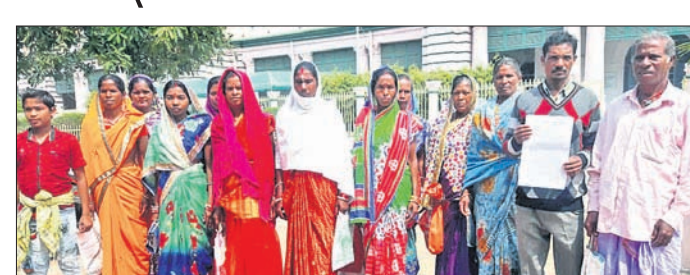
ଜିଲ୍ଲାପାଳଙ୍କ କାର୍ଯ୍ୟାଳୟ ସମ୍ମୁଖରେ ଗ୍ରାମବାସୀ ।