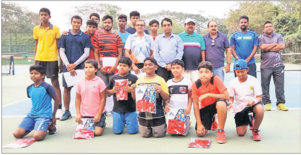
ଭୁବନେଶ୍ୱର: କଳିଙ୍ଗ ଷ୍ଟାଡିୟମ ପରିସରରେ ଓଡ଼ିଶା ଟେନିସ୍ ଆସୋସିଏଶନ ଆନୁକୂଲ୍ୟରେ ଅନୁଷ୍ଠିତ ହୋଇଯାଇଥିବା ଟେନିସ୍ କୋର୍ଟିଂ କ୍ୟାମ୍ପରେ ଅଂଶଗ୍ରହଣ କରିଥିବା ଖେଳାଳି।