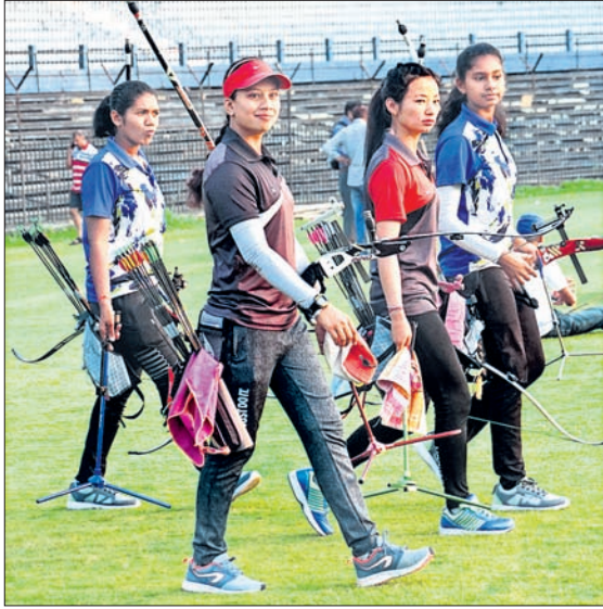
ଜାତୀୟ ସିନିୟର ଚାରୋକୀ ପ୍ରତିଯୋଗିତା ପୂର୍ବରୁ ଶନିବାର ବାରବାଟୀ ଷ୍ଟାଡିୟମରେ ବିଭିନ୍ନ ରାଜ୍ୟର ଚାରୋକୀମାନଙ୍କ ଅଭ୍ୟାସ।

ରବିବାରଠାରୁ ବାରବାଟୀ ଷ୍ଟାଡିୟମରେ ଆରମ୍ଭ ହେବ ୩୯ତମ ସିନିୟର ଜାତୀୟ ଚାରୋକୀ ଚାମ୍ପିୟନଶିପ। ଦୀର୍ଘ ୨୬ ବର୍ଷ ପରେ ରାଜ୍ୟରେ ହେଉଥିବା ଏହି ଜାତୀୟ ସିନିୟର ଚାରୋକୀ ଚାମ୍ପିୟନଶିପ ନିମନ୍ତେ ସମସ୍ତ ପ୍ରସ୍ତୁତି ତୁରାନ୍ତ ପର୍ଯ୍ୟାୟରେ। ଉଭୟ ପୁରୁଷ ଓ ମହିଳା ବର୍ଗରେ ହେବାକୁ ଥିବା ଏହି ପ୍ରତିଯୋଗିତାରେ ସମସ୍ତ ରାଜ୍ୟ, କେନ୍ଦ୍ର ଶାସିତ ଅଞ୍ଚଳ ଓ ଅନୁବନ୍ଧିତ ସ୍ଥାନରୁ ପ୍ରାୟ ୧୧୦୦ଜଣ ଚାରୋକୀ ଅଂଶଗ୍ରହଣ କରିବେ। ପ୍ରତିଯୋଗୀମାନେ କଟକରେ ପହଞ୍ଚି ସାରିଲେଣି। ଅନ୍ତର୍ଜାତୀୟ ତଥା ଅର୍ଦ୍ଧ ପୁରସ୍କାର ବିଜେତା ଖେଳାଳିମାନଙ୍କ ରହଣି ବ୍ୟବସ୍ଥା ହୋଟେଲ ଓ ସରକାରୀ ଡାକବଙ୍ଗଳାରେ ହୋଇଥିବା ବେଳେ ଅବଶିଷ୍ଟ ଖେଳାଳିମାନେ ବାରବାଟୀ ଷ୍ଟାଡିୟମରେ ବିଭିନ୍ନ ପ୍ରକାଶରେ ରହିଛନ୍ତି। ରବିବାର ସକାଳ ୭.୩୦ରୁ ଆରମ୍ଭ ହେବ ଅଫିସିଆଲ ପ୍ରାୟାଣ। ୮.୩୦ରେ ମଇଦାନକୁ ଓହ୍ଲାଇବେ ପ୍ରତିଯୋଗୀମାନେ। ପ୍ରଥମ ଦିବସରେ ରିକର୍ଡ ରାଉଣ୍ଡ ପ୍ରତିଯୋଗିତା ହେବ। ଅଲିମ୍ପିଆନ ତଥା ଅର୍ଦ୍ଧ ପୁରସ୍କାର ବିଜେତା ତଥା