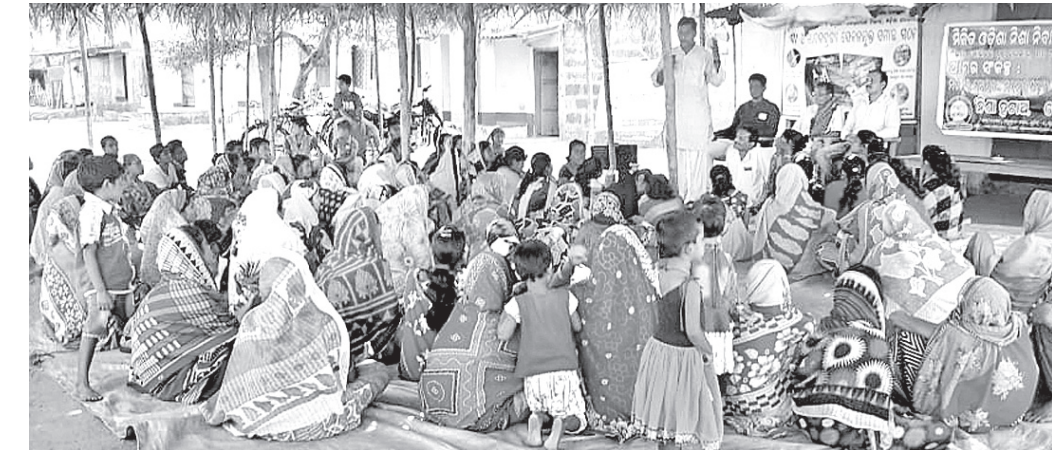
ବୈଠକରେ ଏକାଠି ହୋଇଥିବା ମହିଳାମାନେ।