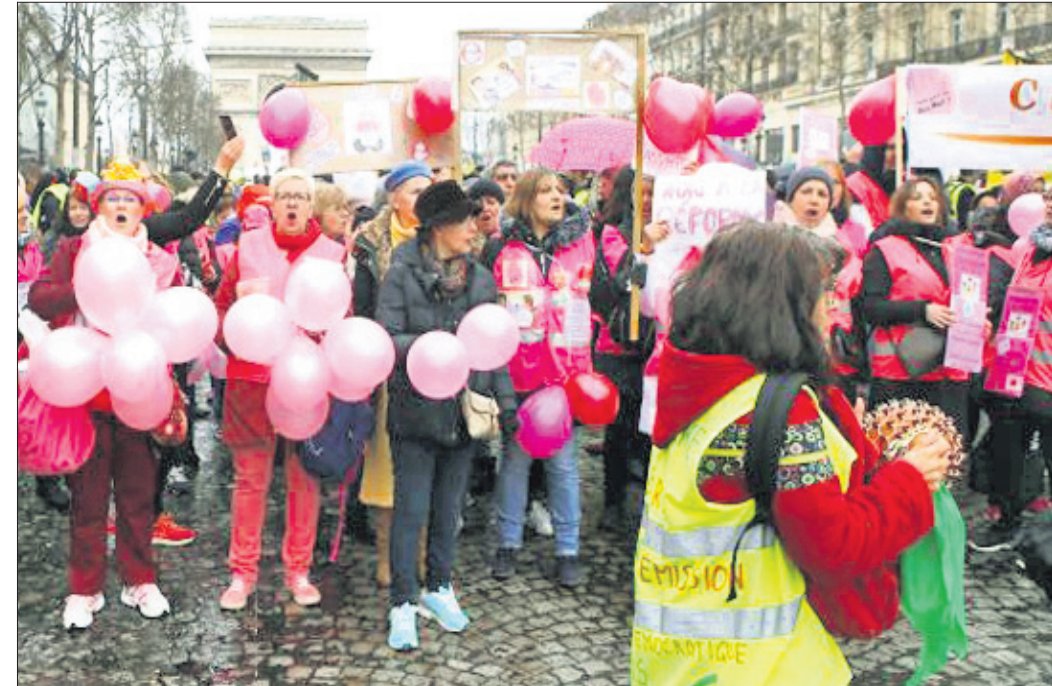
ପ୍ରାୟ ସରକାର ଆର୍ଥିକ ନୀତିଗୁଡ଼ିକ ଧନିକ ବର୍ଗର ଲୋକଙ୍କୁ ସୁହାରୁଥିବା ପ୍ରତିବାଦରେ ଯୋଗାଣ କାଳେ ଆନ୍ଦୋଳନ ୧୭ତମ ସପ୍ତାହରେ ପହଞ୍ଚିଛି। ଏହି ପରିପ୍ରସାରେ ଶନିବାର ଯୋଗାଣ ଭେଷ୍ଟ ବିଶୋଭାକାରୀ ଓ ମହିଳାମାନେ ରାଜଧାନୀ ପ୍ୟାରିସର ରାଜରାସ୍ତାକୁ ଓହ୍ଲାଇଛନ୍ତି।