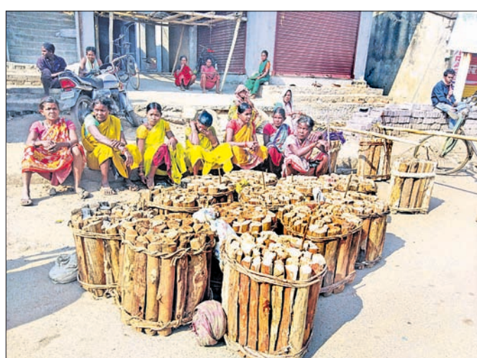
ଜାଳକାଠ ବିକ୍ରି ପାଇଁ ଗ୍ରାହକଙ୍କ ଅପେକ୍ଷାରେ ।

କେନ୍ଦୁଝର ଜିଲ୍ଲା ବଣପାହାଡ଼ ମୂଳକରେ ଆଜି ବି ଦ୍ରାବିଡ଼୍ୟ ବନ୍ଦାବାହି ରହିଛି । ଗୁରୁବାର ସବୁଠି ଆନ୍ତର୍ଜାତିକ ମହିଳା ଦିବସ ପାଳନ ହେଉଥିବା ବେଳେ ନିର୍ଦ୍ଦିଷ୍ଟ ଭଳି ଗରିବ, ଅସହାୟ ପରିବାରର ମହିଳା ବଣପାହାଡ଼କୁ ଜାଳକାଠ ସଂଗ୍ରହ ଏହାକୁ ପୁଣିରେ ଲୁଚି ରାଜି ରାଜି ଆସି କେନ୍ଦୁଝର ସହର ରାସ୍ତା କଡ଼ରେ ଗ୍ରାହକ ଅପେକ୍ଷାରେ ଅପେକ୍ଷା କରିଥିବା ଦେଖିବାକୁ ମିଳିଥିଲା । ଏଭଳି ଅଭାବୀ, ଅସହାୟ ମହିଳାଙ୍କ ପ୍ରତି କାହାରି ନକର ନ ଥିଲା । ସବୁଠି ମହିଳାମାନଙ୍କ ଲାଗି ଦିବସ ପାଳନ ହେଉଥିବା କଥା ପଚାରିବାରୁ ସେମାନେ ଏ ବିଷୟରେ ଅଜ୍ଞ ଥିବା ଜଣାପଡ଼ିଥିଲା । ପେଟ ଓ ପରିବାର ପୋଷିବା ଲାଗି ଏହି ବନ୍ଦାବାହି ମହିଳାମାନେ ଖରା ଡାକିବା ଖାତର ନ କରି ଜାଳକାଠ ଆଣି ବିକିଥିବା କହିଥିଲେ । ବିକ୍ରି ପଇସାରେ ସେମାନେ ଚୋଳାଲୁଣ ଲୁଗା ଫେରିବେ ବୋଲି ପ୍ରକାଶ କରିଥିଲେ । ବଣପାହାଡ଼ ମୂଳକରେ ଆଜି ବି ଅନେକ ଗରିବ ବନ୍ଦାବାହି ଜଙ୍ଗଲ ଉପରେ ନିର୍ଭର କରି ରହୁଛନ୍ତି । ସେମାନେ ଜାଳକାଠ ସାଙ୍ଗକୁ ବିଭିନ୍ନ ରତୁକାଳାନ କାଳକାଠ ଆଣି ବିକିଥିବା କହିଥିଲେ । ବିକ୍ରି ପଇସାରେ ସେମାନେ ଚୋଳାଲୁଣ ଲୁଗା ଫେରିବେ ବୋଲି ପ୍ରକାଶ କରିଥିଲେ । ବଣପାହାଡ଼ ମୂଳକରେ ଆଜି ବି ଅନେକ ଗରିବ ବନ୍ଦାବାହି ଜଙ୍ଗଲ ଉପରେ ନିର୍ଭର କରି ରହୁଛନ୍ତି । ସେମାନେ ଜାଳକାଠ ସାଙ୍ଗକୁ ବିଭିନ୍ନ ରତୁକାଳାନ କାଳକାଠ ଆଣି ବିକିଥିବା କହିଥିଲେ । ବିକ୍ରି ପଇସାରେ ସେମାନେ ଚୋଳାଲୁଣ ଲୁଗା ଫେରିବେ ବୋଲି ପ୍ରକାଶ କରିଥିଲେ ।