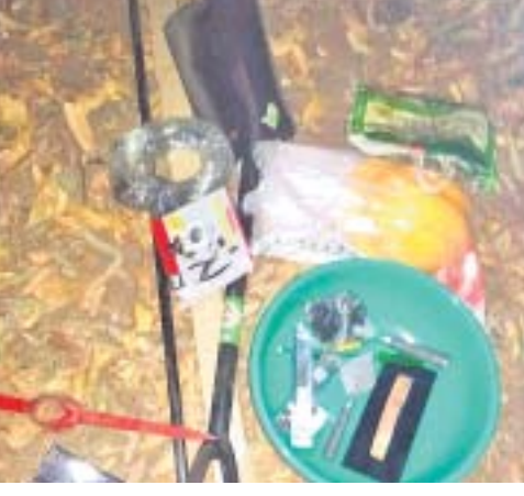
ଅଭିଯୋଗ ହେଉଛି । ସାମଗ୍ରୀର ଓ ରୁଲ୍ କଟ୍ କ୍ରୟର ଭିଲ୍ଲାପୁ ତଦନ୍ତ କରିବାକୁ ସାଧାରଣରେ ଦାବି ହେଉଛି।