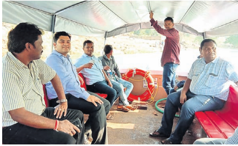
ସାବୁକୁ ମିଳିଥିବା ଡ଼ଙ୍ଗା ।

ମାଲକାନଗିରି ଜିଲାର ଐତିହ୍ୟ ପରମ୍ପରା ବହନ କରୁଥିବା ପ୍ରସିଦ୍ଧ ବଡ଼ଯାତ୍ରାର ଯୋଗବାର ଶୁଭାରମ୍ଭ ହେବ ।