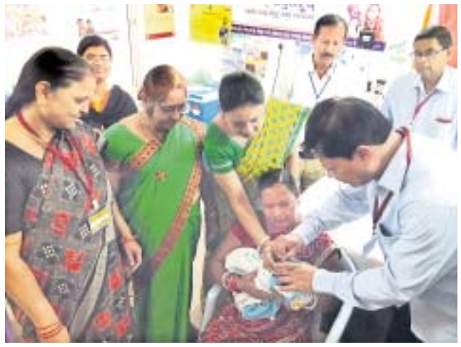
ଜିଲାପାଳ ଜଣେ ଶିଶୁଙ୍କୁ ପୋଲିଓ ବୁଦ୍ଧା ଖୁଆଉଛନ୍ତି ।