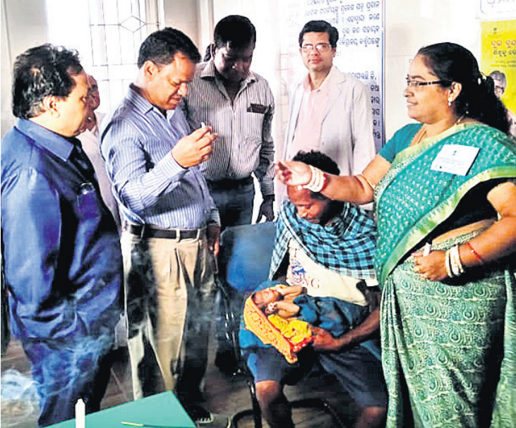
ସିଡିଏମ୍ଠି ଜଣେ ଜବଜାତ ଶିଶୁକୁ ପୋଲିଓ ବୁଦ୍ଧା ଦେଉଛନ୍ତି।