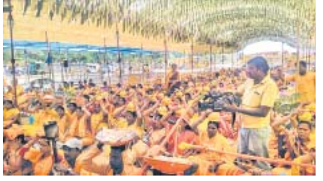
ଶୋଭାଯାତ୍ରା ପରେ ମହାଯଜ୍ଞ ପୂର୍ଣ୍ଣ କଳସ ଯାତ୍ରା ଯଜ୍ଞସ୍ଥଳ ନିକଟରେ ଏକାଠି ହୋଇଛନ୍ତି ।