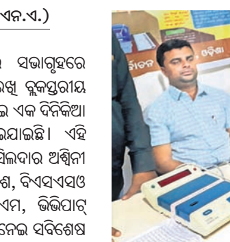
ଇଭିଏମ୍, ଭିଭିପାର୍ ବ୍ୟବହାର ସମ୍ପର୍କରେ ସଚେତନ କରାଯାଇଛି ।

ମାଲକାନଗିରି ଜିଲ୍ଲା ଖଇରପୁଟ ବ୍ଲକର ସଭାଗୃହରେ ରବିବାର ଆଗାମୀ ନିର୍ବାଚନକୁ ଦୃଷ୍ଟିରେ ରଖି ବ୍ଲକସ୍ତରୀୟ ଇଭିଏମ୍, ଭିଭିପାର୍ ମେଣ୍ଟି ବ୍ୟବହାର ନେଇ ଏକ ଦିନିଆ ସଚେତନତା କାର୍ଯ୍ୟକ୍ରମ ଅନୁଷ୍ଠିତ ହୋଇଯାଇଛି ।