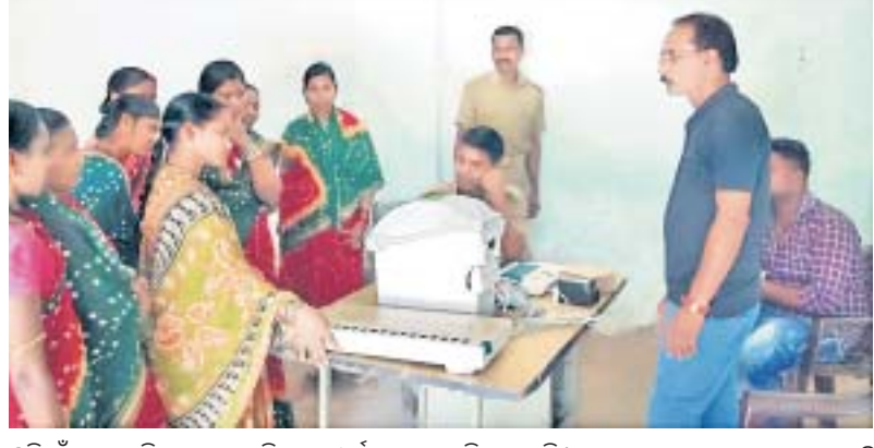
ଝରିଗାଁଠାରେ ମହାଯଜ୍ଞ ପୂର୍ଣ୍ଣ କଳସ ଯାତ୍ରା ପୂର୍ଣ୍ଣ କଳସ ଯାତ୍ରା ପୂର୍ଣ୍ଣ କଳସ ଯାତ୍ରା