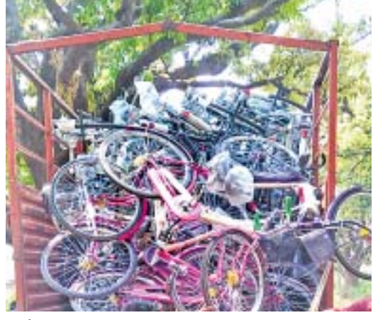
ନିର୍ମାଣ ଶ୍ରମିକଙ୍କୁ ଦିଆଯାଇଥିବା ସାମଗ୍ରୀ, ରୁଲ୍ କଟ୍ ।

ରାଜ୍ୟ ସରକାର ନିର୍ମାଣ ଶ୍ରମିକମାନଙ୍କ ପାଇଁ ବିଭିନ୍ନ ଯୋଜନା ଲାଗୁ କରିଛନ୍ତି। ପଞ୍ଜିକୃତ ନିର୍ମାଣ ଶ୍ରମିକମାନଙ୍କ ପାଇଁ ଚାରି ହଜାର ଟଙ୍କାର ସୁଧାହାଣ୍ଡି, ଚାରି ହଜାର ଟଙ୍କାର ବିଭିନ୍ନପ୍ରକାର ଉପକରଣ ଯଥା ବେଳେ, ଶାବଳ, କୋଡି, କୋଦାଳ, ୨ଟି ସ୍କୁଲଭାଉସ, ଲେବୁଲ ପାଇପ ଇତ୍ୟାଦି ସହ ଏକ ହଜାର ଟଙ୍କାର ହେଲମେଟ, ହାଣ୍ଡ ଗ୍ଲୋଭସ, ଜୋତା, ଚଷମା, ସେଫ୍ଟି ବେଲ୍ଟ ଇତ୍ୟାଦି ମାଗଣାରେ ଦେବାର ବ୍ୟବସ୍ଥା କରିଛନ୍ତି। ତେବେ ନିର୍ମାଣ ଶ୍ରମିକମାନଙ୍କୁ ଏହି ସବୁ ସାମଗ୍ରୀ ପାଇବା ଆଶା ଦେଖାଇ କାର୍ଯ୍ୟକ୍ରମ କରାଯାଉଛି ଏବଂ ଅନାମ୍ୟ ଖର୍ଚ୍ଚ ଥିବା କହି ରଦାହାଣ୍ଡି ରୁକ୍ମିଣୀ ୪୪୨ ଜଣ ନିର୍ମାଣ ଶ୍ରମିକଙ୍କ ପାଖରୁ ୩୫୦ଟି ଲେଖାଏଁ ମଧ୍ୟସ୍ତରୀୟ କର୍ମିଆରେ ଆବେଦନ କରାଯାଇଥିବା ଅଭିଯୋଗ ହୋଇଛି। ଜଣେ ନିର୍ମାଣ ଶ୍ରମିକ ନାମ ଗୋପନ ରଖି ଏ ସମ୍ପର୍କରେ କହିଛନ୍ତି। ସେହିପରି ବିଭାଗୀୟ ଅଧିକାରୀଙ୍କ ସହ ସମାଲୋଚନା ହୋଇ ଝରିଗାଁ ଏବଂ ନବରଙ୍ଗପୁରର ବ୍ୟବସାୟମାନେ ଅତ୍ୟନ୍ତ ନିମ୍ନମାନର ଓ ସରକାରଙ୍କ ଧାର୍ଯ୍ୟ ଦରଠାରୁ କମ ମୂଲ୍ୟର ସାମଗ୍ରୀ, ରୁଲ୍ କଟ ଓ ନିରାକମ୍ପ