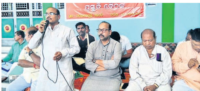
ବୈଠକରେ ଉପସ୍ଥିତ ଦଳୀୟ କର୍ମୀ ।