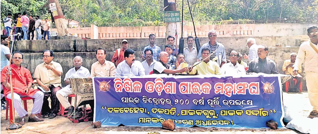
ସମାବେଶରେ ଯୋଗଦେଇଥିବା ପାଇକ ସଂଗଠନର କର୍ମକର୍ତ୍ତା।