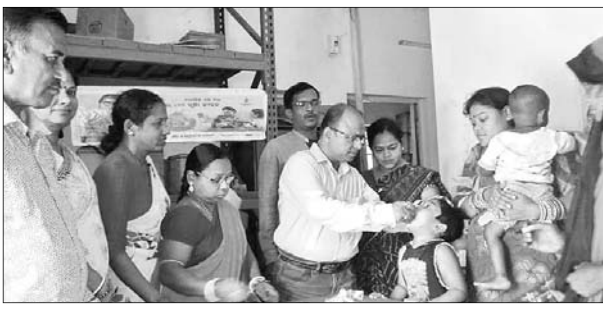
ଜଣେ ଶିଶୁଙ୍କୁ ଟିକା ଦିଆଯାଇଛି।