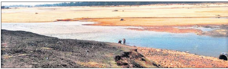
ମହାନଦୀରେ ଅସ୍ଥାୟୀ ରାସ୍ତା ନିର୍ମାଣ ହୋଇଥିବା ସ୍ଥାନ।

ହେଉଥିବାରୁ ସରକାରୀ ଅର୍ଥର ସୁବିଧାଯୋଗ ନହୋଇ ବରବାଦ ହେବା ସାର ହେଉଛି। ଏହି ଖରାଦିନିଆ ରାସ୍ତା ନିର୍ମାଣ ହେଲେ ତିର୍ତ୍ତୋଲ ମହାନଦୀ-ପାଇକା ବୁଝାଞ୍ଚଳରେ ଥିବା କୃଷାକମ୍ପୁର, ବିଷୁନପୁର, କନିମୁଲ, ଗୋପାଳପୁର-ଶଙ୍ଖେଶ୍ୱର, ଦାଳିଲୋ, ଆମିରି, କୋଲର ପ୍ରଭୃତି ୬ ପଞ୍ଚାୟତର ଲୋକମାନଙ୍କ