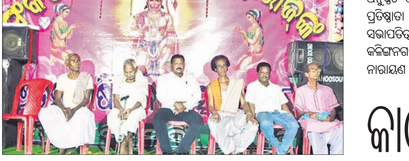
ପ୍ରତିଷ୍ଠା ଉତ୍ସବରେ ଉପସ୍ଥିତ ଅତିଥି।