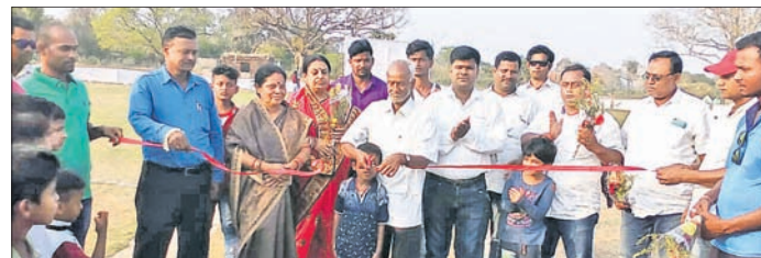
ଅତିଥିମାନେ ମ୍ୟାଚ୍ ଉଦ୍‌ଘାଟନ କରୁଛନ୍ତି।