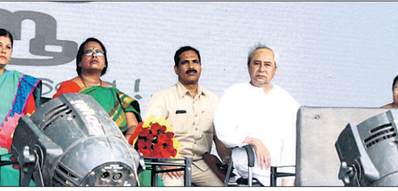
ମଞ୍ଚରେ ପୁଷ୍ପାମନ୍ତ୍ରୀ ନବାନ ପଦନାୟକ ଓ ମହିଳାମାନେ ।