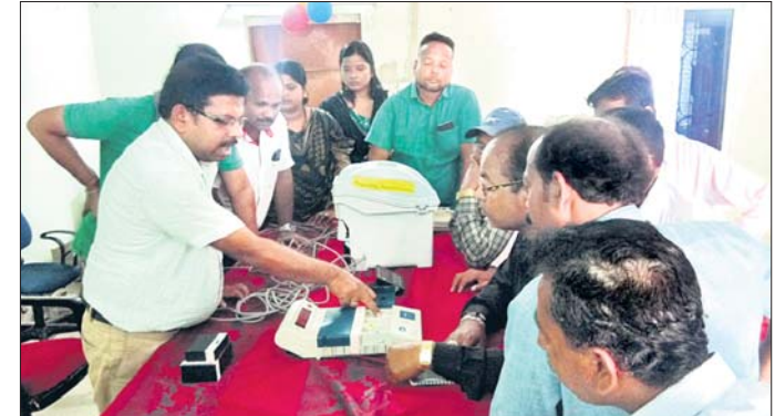
ଭିଜିପାଟ୍ ବ୍ୟବହାର ସମ୍ପର୍କରେ ସଚେତନତା କରାଯାଉଛି।

ଅବାଧ ଓ ନିରପେକ୍ଷ ନିର୍ବାଚନ ପାଇଁ ପ୍ରଶାସନ ପକ୍ଷରୁ ପ୍ରସ୍ତୁତି ଆରମ୍ଭ ହୋଇଛି।