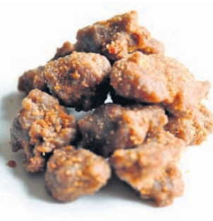
ବିହାରୁ ଏହା କେତେକାଂଶରେ ଉପଶମ ଦେଇଥାଏ । ଦାନ୍ତର ସେହି ଦରକ ସ୍ଥାନରେ ଛୋଟ ହେଲୁଟିଏ ରଖିଦେଲେ ସେଥିରୁ ଉପଶମ ମିଳିଥାଏ ।

ହେଲୁରେ ଅନେକ ସାମ୍ବୋପକାରୀ ଗୁଣ ଭରି ରହିଛି । ଏହାକୁ ଖାଇଲେ ରକ୍ତରେ ସୁଗାର ପରିମାଣ ସମ୍ବଳିତ ରହିଥାଏ । ଜଣେ ତାଳବେଟିସ ରୋଗୀ ନିୟମିତ ଏହାକୁ ଖାଇଲେ କିଛି କ୍ଷତି ନାହିଁ । ଆଶ୍ଚର୍ଯ୍ୟ ଦରକାର ନେଇ ଆପଣ ଚିନ୍ତିତ କି ? ଯଦି ହଁ, ତେବେ ପାଣିରେ ଅଳ୍ପ ହେଲୁ ମିଶାଇ ଯନ୍ତ୍ରଣା ସ୍ଥାନରେ ମାଲିସ କରନ୍ତୁ । ଏହାଦ୍ୱାରା ସେଥିରୁ କେତେକାଂଶରେ ଉପଶମ ମିଳିଥାଏ । ଅଳ୍ପ ପାଣିରେ ଚିପୁଟାଏ ହେଲୁ ଏବଂ ଅଳ୍ପ ଖାଇବା ସୋଡ଼ା ମିଶାଇ ପିଇଲେ କଫଜନିତ ସମସ୍ୟା ଦୂର ହୋଇଥାଏ । ଦାନ୍ତ ଦରକ ଏବଂ