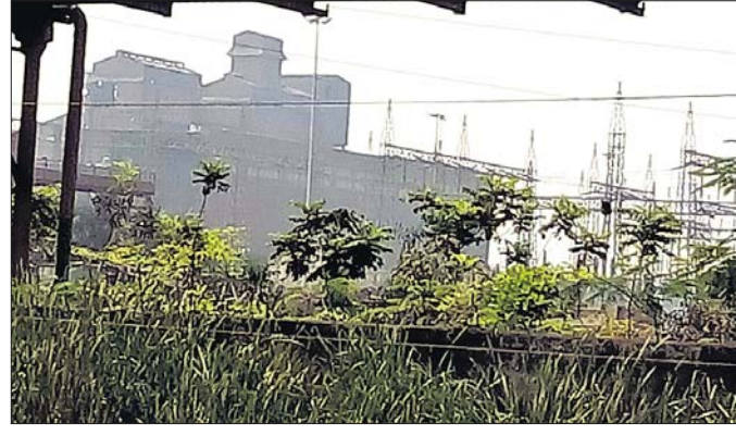
ପାରାଦୀପରେ ଥିବା ଏସାର ଷ୍ଟିଲ୍ କାରଖାନା।

ମିଆଦି ପ୍ରକଳ୍ପର ମାଲିକାନା ବଦଳିଯିବ। ଏପରି କି ପାରାଦୀପରେ ଗଢ଼ି ଉଠୁଥିବା