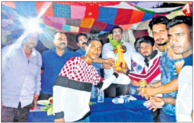
ଚାମ୍ପିୟନ ଦଳକୁ ଅତିଥି ପୁରସ୍କୃତ କରୁଛନ୍ତି।

ବିରିଡ଼ି ବ୍ଲକ୍ ଅଭିଜ୍ଞମାନଙ୍କୁ ଲଗାତର କ୍ଲବ ଆନୁକୂଲ୍ୟରେ ଚାଲିଥିବା ୭ମ ବାର୍ଷିକ