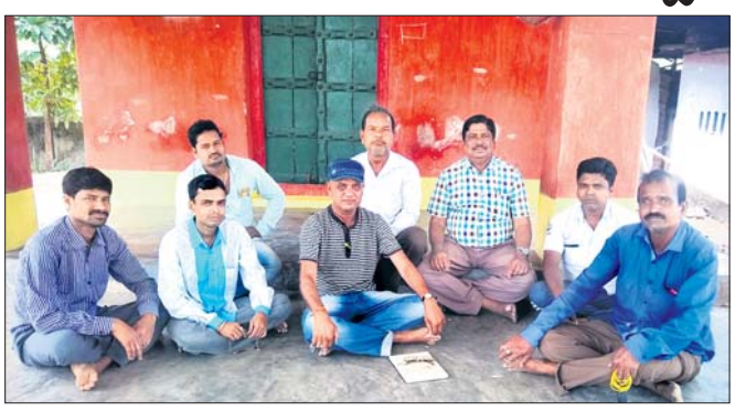
ବୈଠକରେ ଉପସ୍ଥିତ ଭାଜପା କର୍ମକର୍ତ୍ତା।

ବାଲିଆ, ୧୦ମାର୍ଚ୍ଚ(ସ.ପ୍ର.) ବାଲିଆ ବ୍ଲକ୍ ପକ୍ଷରୁ ସେବାର ଇତିହାସ ଓ ଭିଜିପାଟ୍ ମେସିନ ପରିଚାଳନା ସମ୍ପର୍କିତ