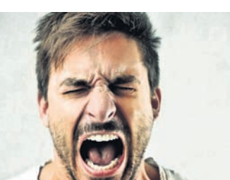
ରାଗିଲେ ଏହାକୁ ତୁରନ୍ତ ତାଙ୍କର ବାହୁରେ ବାନ୍ଧି ଦେଲେ ତାଙ୍କର ରାଗ ଅଳ୍ପ ସମୟ ଭିତରେ କମି ଯାଇଥାଏ । ଏହାକୁ କିପରି ଆହୁରି ଉନ୍ନତ ଜ୍ଞାନକୌଶଳବିଶିଷ୍ଟ କରାଯାଇପାରିବ ସେ ନେଇ ତାଲନୀୟ ବୈଜ୍ଞାନିକମାନେ ଚେଷ୍ଟା କରି ରଖୁଛନ୍ତି ।

ଅଧିକ ରାଗିବା କ୍ଷତିକାରକ । ତଥାପି ଏହାକୁ କେତେକ ଗୁରୁତ୍ୱ ଦେଇ ନ ଥାନ୍ତି । ହଠାତ୍ ରାଗିବା ଦ୍ୱାରା ହୁଏ ତ କାହାକୁ କ୍ଷଣିକ ମାନସିକ ଶାନ୍ତି ମିଳିଥାଇପାରେ, ହେଲେ ଏହାର କୁପ୍ରଭାବ ଶରୀର ଉପରେ ପଡ଼ିଥାଏ । ବିଶେଷଭାବରେ ସବୁବେଳେ ଅଧିକ ରାଗିଲେ ତାହା କୁଟପ୍ରେସର, ହାର୍ଟ ଆଗାକ ପରି ଗୁରୁତର ସମସ୍ୟାକୁ ପରୋକ୍ଷରେ ତାକି ଆଣିଥାଏ । କିନ୍ତୁ ନିକଟରେ ଏଭଳି ଏକ ଡିଭାଇସ୍ ପ୍ରସ୍ତୁତ କରାଯାଇଛି ଯାହାଦ୍ୱାରା ଜଣେ ଏଭଳି ଅଭ୍ୟାସଠାରୁ ନିଜକୁ ଅନେକାଂଶରେ ଦୂରରେ ରଖିପାରିବ । ତାରବିହୀନ ଏପରି ଏକ ଡିଭାଇସ୍‌କୁ ତାଲନୀୟ ବୈଜ୍ଞାନିକମାନେ ପ୍ରସ୍ତୁତ କରିଛନ୍ତି । ଜଣେ ବ୍ୟକ୍ତି