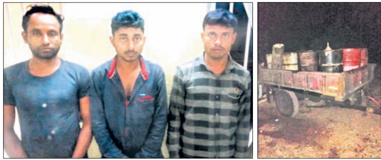
ଗିରଫ ହୋଇଥିବା ଅଭିଯୁକ୍ତ ଓ ଜବତ ତେଲ।

■ ୨ ସିପି କମ୍ପାନୀ କର୍ମଚାରୀ ସମ୍ପୃକ୍ତ ■ ଜଣେ ଅଭିଯୁକ୍ତ ଫେରାର