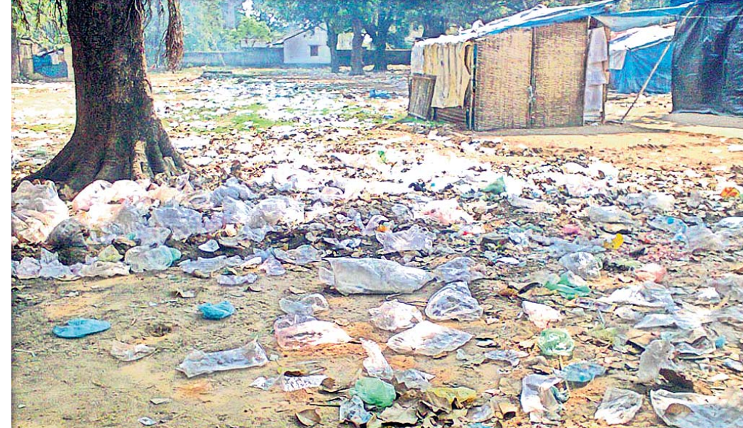
ଆବର୍ଜନାପୂର୍ଣ୍ଣ ମାଘମେଳା ପଡିଆ।

ଦୀର୍ଘ ୧୮ ଦିନ ହେଲା ଚାଲିଥିବା କଷ୍ଟିଲୋ ନାଳମାଧବ ଜାଉଜ ପବିତ୍ର ମାଘମେଳା ଶେଷ ହୋଇଛି । ମେଳା ନିମନ୍ତେ ଖୋଲିଥିବା ବିଭିନ୍ନ ବ୍ୟବସାୟ ପ୍ରତିଷ୍ଠାନ, ଦୋକାନ ଏବଂ ମନୋରଞ୍ଜନ ପ୍ରଦାନକାରୀ ସଂସ୍ଥା ବିଶେଷ ଭାବେ ଅପେରା ଦଳ ରାମଦୋଳି ଆଦି ସଂସ୍ଥା ଫେରିଲେଣି। ତେବେ ବର୍ତ୍ତମାନ ପର୍ଯ୍ୟନ୍ତ ପଡିଆଟି ଅଲିଆ, ଆବର୍ଜନା ତଥା ପଲିଥ୍‌ ଅଦିରେ ଭରପୁର ହୋଇରହିଛି। ମେଳା ପରେ ଦୂଷିତ ପରିବେଶ ଯୋଗୁ ଏହା ନିକଟରେ ଯାତାୟତ କଳାବେଳେ ଦୁର୍ଗନ୍ଧରେ ନାକ ଫାଟିପଡୁଛି। ଏ ପର୍ଯ୍ୟନ୍ତ ଉତ୍ତମ ପରିମଳ ନିମନ୍ତେ ସରକାରୀ କିମ୍ବା ବେସରକାରୀ ସଂସ୍ଥାର ଦୃଷ୍ଟି ପଡୁ ନ ଥିବା ବିଭିନ୍ନ ମହଲରେ ଅଭିଯୋଗ ହେଉଛି। ରାଜ୍ୟର ବିଭିନ୍ନ ପ୍ରାନ୍ତରୁ ଆସିଥିବା ବ୍ୟବସାୟ ପ୍ରତିଷ୍ଠାନଗୁଡ଼ିକ ଖଣ୍ଡପଡା ବେବୋଭର ବିଭାଗକୁ ଧାୟି ଚଳା କମା ବେଳ ଖୁଲି ଖୋଲିଥିଲେ । ତେବେ ମେଳା ପରେ ଦୁର୍ଗନ୍ଧ କାର୍ଯ୍ୟକ୍ଷେତ୍ର ହେଲେ ସେ ନେଇ ସାଧାରଣରେ ପ୍ରଶ୍ନବାରୀ ଦୃଷ୍ଟି ହୋଇଛି। ଶିକ୍ଷାନୁଷ୍ଠାନ, ପୋଲିସ୍ ଫାଷ୍ଟି, ସରକାରୀ ସ୍ୱାସ୍ଥ୍ୟକେନ୍ଦ୍ର, ପୂର୍ଣ୍ଣ ବିଭାଗ ଡାକ୍ତରୀ, ସୁନା, ମୁକୋ ବ୍ୟାଙ୍କ, ଡାକଘର ଏବଂ ଅନ୍ୟାନ୍ୟ ସଂସ୍ଥାଗୁଡ଼ିକ ପଡିଆକୁ ଲାଗିରହିଛି। ଏହାର ପାର୍ଶ୍ୱପୂର୍ଣ୍ଣ ବିଭାଗ ରାସ୍ତା ମଧ୍ୟ ବେଳ ପ୍ରତ୍ୟହ