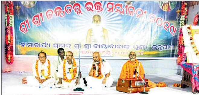
ଧର୍ମସଭାରେ ଉପସ୍ଥିତ ସାଧୁସଙ୍ଗମାନେ ।