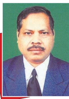
ଡ଼. ମାନ୍ୟଧର ସ୍ୱାଇଁ