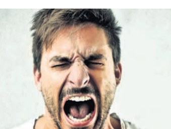
ରାଗିଲେ ଏହାକୁ ତୁରନ୍ତ ତାଙ୍କର ବାହୁରେ ବାନ୍ଧି ଦେଲେ ତାଙ୍କର ରାଗ ଅଳ୍ପ ସମୟ ଭିତରେ କମି ଯାଇଥାଏ । ଏହାକୁ କିପରି ଆହୁରି ଉନ୍ନତ ଜ୍ଞାନକୌଶଳବିଶିଷ୍ଟ କରାଯାଇପାରିବ ସେ ନେଇ ତାଲନୀୟ ବୈଜ୍ଞାନିକମାନେ ଚେଷ୍ଟା କରିଛନ୍ତି ।

ଅଧିକ ରାଗିବା କ୍ଷତିକାରକ । ତଥାପି ଏହାକୁ କେତେକ ଗୁରୁତ୍ୱ ଦେଇ ନ ଥାନ୍ତି । ହଠାତ୍ ରାଗିବା ଦ୍ୱାରା ହୁଏ ତ କାହାକୁ କ୍ଷତିକାରକ ମାନସିକ ଶକ୍ତି ମିଳିଥାଇପାରେ, ହେଲେ ଏହାର କୁପ୍ରଭାବ ଶରୀର ଉପରେ ପଡ଼ିଥାଏ । ବିଶେଷତାରେ ସବୁବେଳେ ଅଧିକ ରାଗିଲେ ତାହା କୁଟପ୍ରେସର, ହାର୍ଟ ଆଗାକ ପରି ଗୁରୁତର ସମସ୍ୟାକୁ ପରୋକ୍ଷରେ ତାକି ଆଣିଥାଏ । କିନ୍ତୁ ନିକଟରେ ଏଭଳି ଏକ ତାଲିକା ପ୍ରସ୍ତୁତ କରାଯାଇଛି ଯାହାଦ୍ୱାରା ଜଣେ ଏଭଳି ଅଭ୍ୟାସଠାରୁ ନିଜକୁ ଅନେକାଂଶରେ ଦୂରରେ ରଖିପାରିବ । ତାରବିହୀନ ଏପରି ଏକ ତାଲିକାକୁ ତାଲନୀୟ ବୈଜ୍ଞାନିକମାନେ ପ୍ରସ୍ତୁତ କରିଛନ୍ତି । ଜଣେ ବ୍ୟକ୍ତି