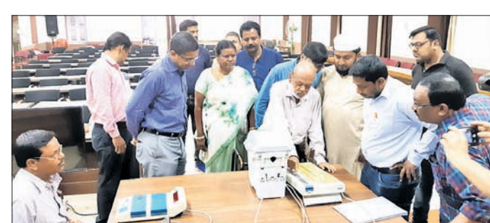
ଭିଜିପାଟ ମେଣିନ ବ୍ୟବହାର ନେଇ ବରବାରହଲରେ ସଚେତନତା କାର୍ଯ୍ୟକ୍ରମ ।