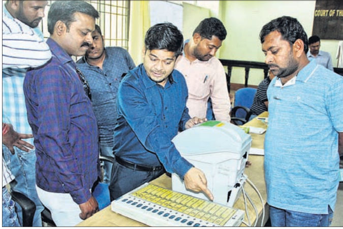
ଭିଡିଏମ୍ ଓ ଭିଡିପାଟ୍ ସମ୍ପର୍କରେ ସଚେତନ କରାଯାଇଛି।