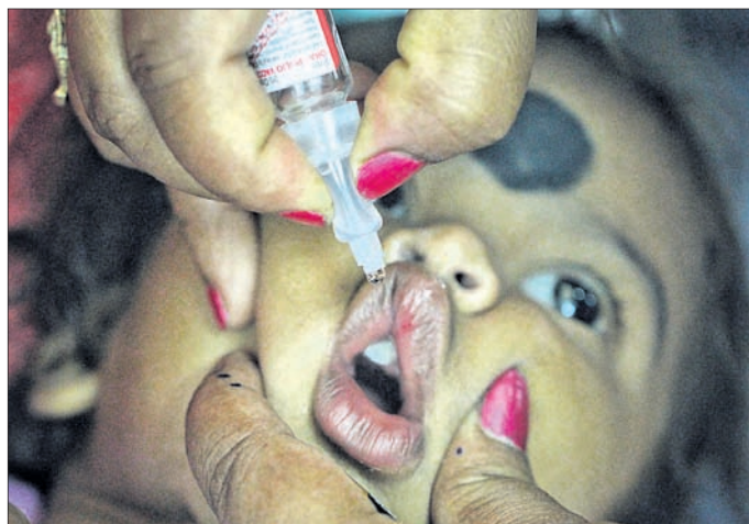
ଜଣେ ଶିଶୁକୁ ପୋଲିଓ ବୁଦା ଦିଆଯାଉଛି।