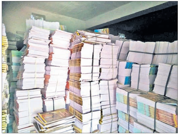
ବ୍ଲକ ଶିକ୍ଷା କାର୍ଯ୍ୟକ୍ରମକୁ ଆସିଥିବା ମାଗଣା ପୁସ୍ତକ।

ପ୍ରାଥମିକ ଶିକ୍ଷାର ଅଗ୍ରଗତି ପାଇଁ ସର୍ବଶିକ୍ଷା ଅଭିଯାନ ଭିତ୍ତିରେ ସରକାର ଛାତ୍ରାଛାତ୍ରୀମାନଙ୍କୁ ମାଗଣାରେ ବହି ଯୋଗାଣ ଦେବାର ବ୍ୟବସ୍ଥା କରିଛନ୍ତି। କିନ୍ତୁ ଅନେକ ସମୟରେ ସମସ୍ତ ଛାତ୍ରାଛାତ୍ରୀଙ୍କ ନିକଟରେ ଠିକ୍ ସମୟରେ ଏହି ମାଗଣା ପୁସ୍ତକ ପହଞ୍ଚିପାରେ ନ ଥିବା ଦେଖାଯାଇଥାଏ। ଅନୁଗୋଳ ଜିଲ୍ଲା ବର୍ଷରପାଇ ବ୍ଲକକୁ ଉଦାହରଣ ଭାବେ ନିଆଯାଇପାରେ। ଆସନ୍ତା ଏପ୍ରିଲ ୩ରେ ନୂତନ ଶିକ୍ଷା ବର୍ଷ ଆରମ୍ଭ ହେବାକୁ ଯାଉଥିବା ବେଳେ ଏଯାଏ ଆବଶ୍ୟକତା ଅନୁଯାୟୀ ବର୍ଷରପାଇ ବ୍ଲକ ଶିକ୍ଷା ବିଭାଗକୁ ବହି ଯୋଗାଣ ହୋଇପାରି ନାହିଁ। ପ୍ରାୟ ୯୦ ହଜାର ସ୍ଥାନରେ ବର୍ଷରପାଇ ବ୍ଲକ ୫୯ ହଜାର ୮୬୧ ଖଣ୍ଡ ବହି ବିଭାଗକୁ ଆସିଛି। ଏ ନେଇ ଅଭିଭାବକ ମହଲରେ ଅସନ୍ତୋଷ ପ୍ରକାଶ ପାଇଛି।