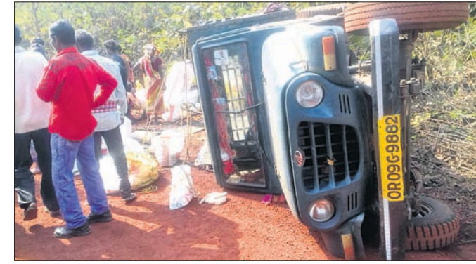
ଦୁର୍ଘଟଣା ଘଟିଥିବା ପିକଅପ୍ ଭ୍ୟାନ ।