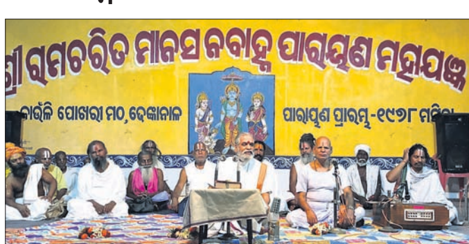
ଶ୍ରୀରାମଚରିତ ମାନସ ନବାହ୍ମ ପାରାୟଣ ମହାଯଜ୍ଞ

ଶ୍ରୀରାମଚରିତ ମାନସ ନବାହ୍ମ ପାରାୟଣ ମହାଯଜ୍ଞ ଅବସରରେ ପ୍ରବଚନ କାର୍ଯ୍ୟକ୍ରମ। ଦେଶାନ୍ତରାଳ ଅଫିସ୍, ୧୦୩