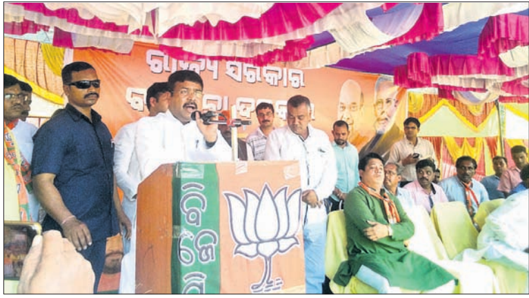
ଭାଜପା ସଂକଳ୍ପ ଯାତ୍ରା ଅବସରରେ କେନ୍ଦ୍ରମନ୍ତ୍ରୀ ଧର୍ମେନ୍ଦ୍ର ପ୍ରଧାନ ଉଦ୍‌ଘୋଷଣା କରୁଛନ୍ତି।