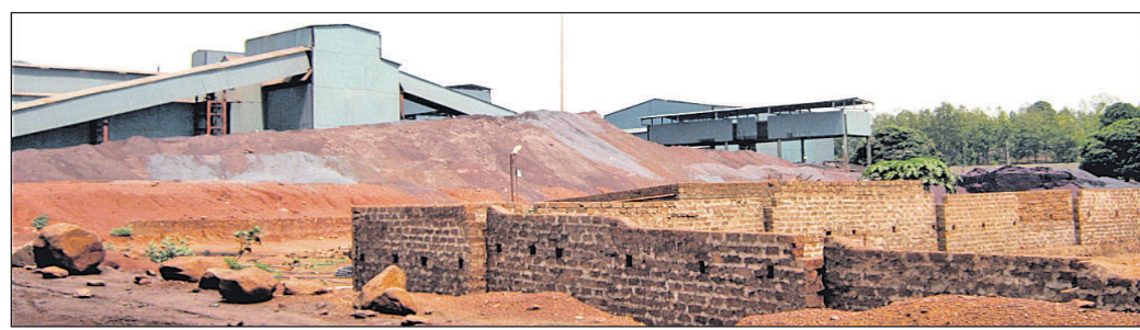
କାରଖାନାର ଖଣିଜ ସାମଗ୍ରୀ ପଡ଼ି ରହିଥିବାରୁ ରାସ୍ତା ଅବରୋଧ ।

୧୦ବର୍ଷ ତଳେ ଏହି ଅଞ୍ଚଳରେ ଆରଡେସ୍ ଷ୍ଟିଲ କାରଖାନା ହେବା ସମୟରେ ଘୁଞ୍ଚୁରା ଲୋକେ ନିଯୁକ୍ତି ସୁବିଧା ପାଇବେ ବୋଲି ଆଶା କରିଥିଲେ। କାରଖାନା ପକ୍ଷରୁ ମଧ୍ୟ ଅନେକ ପ୍ରତିଶ୍ରୁତି ଦିଆଯାଇଥିଲା। ପରେ ଏସବୁ ପ୍ରତୀକ୍ଷାରେ ପରିଣତ ହୋଇଛି। ନିଯୁକ୍ତି ସୁଯୋଗ ସୃଷ୍ଟି କରିବା ଦୂରରେ ଥିବା ପରିପାଶ୍ଚାତ୍ୟ ଉନ୍ନତ ପ୍ରତି ଘୁଞ୍ଚୁରା କର୍ତ୍ତୃପକ୍ଷ ଆଶ୍ଚର୍ଯ୍ୟ ଦେଇଛନ୍ତି ବୋଲି ଗ୍ରାମବାସୀ ଅଭିଯୋଗ କରିଛନ୍ତି। ଭଲକ୍ଷମତା ଯେ, କାରଖାନା ସମ୍ପ୍ରସାରଣ ପାଇଁ ଗତ ମାସ