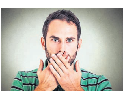
ବାଟି ସେଥିରେ ଅଳ୍ପ ଚିନି ମିଶାଇ ଖାଇଲେ ହାକୁଟି ବନ୍ଦ ହୋଇଥାଏ । ଯଦି ଅଧିକ ହାକୁଟି ଆସୁଛି ତେବେ ତାହାରକ ସହ ପରାମର୍ଶ କରିବାକୁ ଭୁଲନ୍ତୁ ନାହିଁ ।

କାକୁଟି ହେଉଛି ଯେ ହାକୁଟି ମାରିଲେ କେହି ନିକଟତର ଲୋକ ଆପଣଙ୍କୁ ମନେ ପକାଇଥାଆନ୍ତି । ହେଲେ ଏଭଳି ଧାରଣା ଅନୁକମ୍ପା ସାଧାରଣତଃ ଶରୀରରେ ଜଳାୟ ଅଂଶ କମିଗଲେ ହାକୁଟି ଆସିଥାଏ । ଛାତି ଏବଂ ପେଟ ମଧ୍ୟ ଭାଗରେ ତାହାପ୍ରାମ ନାମକ ଏକ ପରଦା ରହିଛି । ଏଥିରେ କମ୍ପନ ସୃଷ୍ଟି ହେଲେ ଶ୍ୱାସକ୍ରିୟାରେ ବାଧା ସୃଷ୍ଟି ହୁଏ ଏବଂ ହାକୁଟି ଆସେ । ଏଥିରୁ ଉପଶମ ପାଇବା ପାଇଁ କେତୋଟି ଘରୋଇ ଉପଚାର ଆପଣେଇ ପାରନ୍ତି । ବାରମ୍ବାର ହାକୁଟି ଆସିଲେ ଅଳ୍ପ ପାଣି ପିଅନ୍ତୁ । ଯଦି ଆପଣ ବାହାରେ ଅଛନ୍ତି ତେବେ ଏପରି ସମସ୍ୟା ସୃଷ୍ଟି ହେଲେ ଦୁଇ କାନରେ ଆଣ୍ଡୁ ଦେଇ କିଛି ସମୟ ନିଶ୍ୱାସ ବନ୍ଦ କରିଦିଅନ୍ତୁ । ଏହାଦ୍ୱାରା ହାକୁଟିରୁ ଆରାମ ମିଳେ । ଶୁଦ୍ଧ ଦେଶୀ ଘିଅକୁ ଉଷୁମ କରି ଖାଇପାରନ୍ତି । ତୁଳସୀ ପତ୍ରକୁ