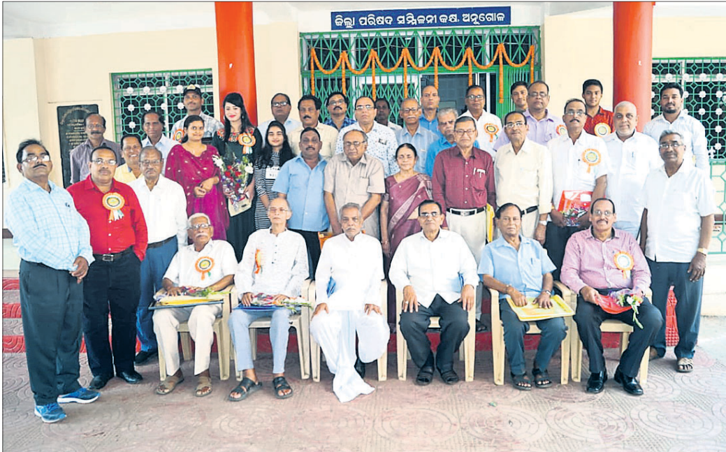
ଉପସ୍ଥିତ ଅତିଥି, କର୍ମକର୍ତ୍ତା ଓ ସମ୍ବର୍ଦ୍ଧିତ ପ୍ରତିଭାମାନେ।