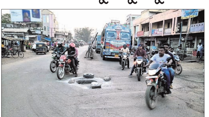
ସହରର ଗାଣୀ ଛକ ରାସ୍ତା ପାଇଁ ଖାଲଖମା ମରଣଯଜ୍ଞ ।