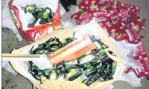
ଜବତ ହୋଇଥିବା ଚା'ପତି ଓ ତେଲ ।

ଡେରାବାଟି, ୧୧୩ (ସ.ପ୍ର.) ଚାନ୍ଦୋଳ ଫାକ୍ତି ଅଧୀନ ଖରିଦାସାହି ଗ୍ରାମର ଜନେକ ବ୍ୟକ୍ତିଙ୍କ ଘରେ ସୋମବାର ପୋଲିସ୍ ଚଢ଼ାଉ କରି ନକଲି ଚା'ପତି, ନକଲି ତାବର ଅମଳା ତେଲ ଓ ନିହାର ତେଲ ଜବତ କରିଛି ।