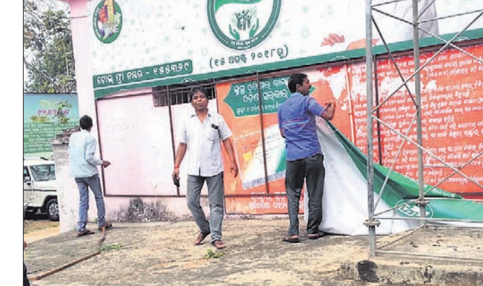
ବିଭିନ୍ନ ସ୍ଥାନରୁ ବ୍ୟାନର ଓ ହୋର୍ଡ଼ିଂ ହଟାଯାଇଛି।