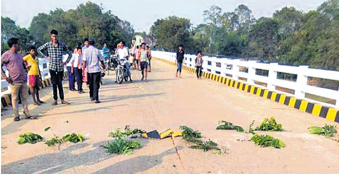
ବଲ୍ଲଭିଘାଟ ସେତୁ ।