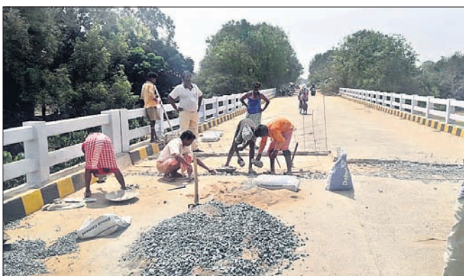
ବଲ୍ଲଭୀଘାଟ ସେତୁର ମରାମତି କାର୍ଯ୍ୟ ଚାଲିଛି।

ବିରଜାକ୍ଷେତ୍ର, ୧୨୩୩(ଡି.ଏନ.ଏ.): ସେତୁର ଯୋଗୁ ଏପରି ଘଟଣା ବୋଲି କହିବା ସହ ରୁଚକ ମରାମତି ପାଇଁ ଧରି କରୁଥିଲେ। ପୂର୍ବ ବିଭାଗ କନିଷ୍ଠ ସମ୍ପା ମହେଶ୍ୱର ସାହୁ ଘଟଣାସ୍ଥଳରେ ପହଞ୍ଚି ଅନୁଧ୍ୟାନ କରିଥିଲେ। ସୂଚନାଯୋଗୀ, ୨୦୦୨ରେ ଉପରଭାଗକୁ ଖୋଲାଖୋଲି କରାଯାଇ ପୁନଶ୍ଚ କଂକ୍ରିଟ୍ ଢଳେଇ କରାଯାଇଛି। ଯାଜପୁର ସହର ନିକଟ ବଲ୍ଲଭୀଘାଟ ସେତୁ ଯୋଗଦାନ ଅପରାହ୍ୱରେ ଦରକାରୀଙ୍କୁ ଦେଖିବାକୁ ମିଳିଥିଲା। ଖବରପାଇଁ ମଣିଆଅପୁର ଗ୍ରାମବାସୀ ଘଟଣାସ୍ଥଳରେ ପହଞ୍ଚି ନିମ୍ନମାନର କାର୍ଯ୍ୟ