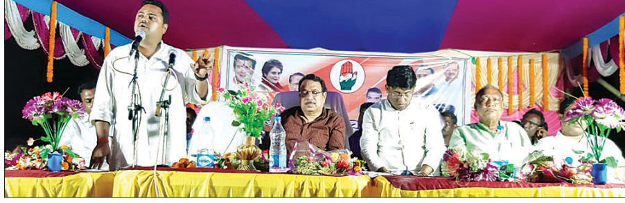
ସମାବେଶରେ ବିଧାୟକ ଓ ଅଧ୍ୟକ୍ଷମାନେ

ରାଜନଗର ରୁକ୍ମର ବର୍ଷାଭାଗ୍ୟ ଆଞ୍ଚଳିକ କଂଗ୍ରେସ ତାର ନିର୍ବାଚନ ପ୍ରଚାର ଆରମ୍ଭ କରିଛି। ଏହି କୁଳ ତାଲିକାଠାରେ ସୋମବାର ସଂଘରେ କଂଗ୍ରେସ ପକ୍ଷରୁ ପରିବର୍ତ୍ତନ ସଂକଳ୍ପ ସମାବେଶ ଅନୁଷ୍ଠିତ ହୋଇଥିଲା।