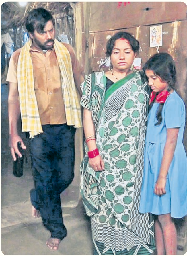
ଚେଲି ଫିଲ୍ମ 'ସଞ୍ଜ ସକାଳ'ର ଏକ ଦୃଶ୍ୟ।

ସତ୍ୟବାନ ଜଣେ ମଜୁରିଆ। ଯାହା କିଛି ରୋଜଗାର କରେ ପରିବାର ତଳାଳ ବର୍ଣ୍ଣ ମଦ ପିଇବାରେ ଖର୍ଚ୍ଚ କରିଦିଏ। ନିଜ ପିଲାକୁ ଖାଇବାକୁ ଦେବାକୁ ଡା' ସ୍ତ୍ରୀ ସାବିତ୍ରୀ ନିଜକୁ ମଦ ବିରୋଧୀ ଅଭିଜ୍ଞାନରେ ସାମିଲ କରେ। ସେଥିରୁ ଯେଉଁଦି ପଇସା ମିଳେ ସେଥିରେ ପରିବାର ତଳାଏ। ହେଲେ ଏହି ସମୟରେ ସେ ରିଟର୍ ଫୋଲୋ ହାତରେ ଥିବା ବେଳେ ପୋଲିସ୍ ଦ୍ୱାରା ଧର୍ଷିତା ହୁଏ। ହେଲେ ଏହାର ଫାଇଦା ନିଏ ମଦ୍ୟ ପ ସ୍ୱାମୀ। ନିଜ ସ୍ୱାକୁ ଗଣିକା ସକାଳ ପଇସା ରୋଜଗାର କରି ମଦ ପିଇବାରେ ନିଜକୁ ହକାଳ ଦିଏ। ଏହାର ପରିଣାମ ସ୍ୱରୂପ ନିଜ ପିଲାକୁ ବିଷ ଦେଇ ନିଜେ ବିଷ ପିଇଦିଏ ସାବିତ୍ରୀ। ଆଉ ଡା'ପରେ ? ଅକାଳରେ ପିଲାଟିକୁ