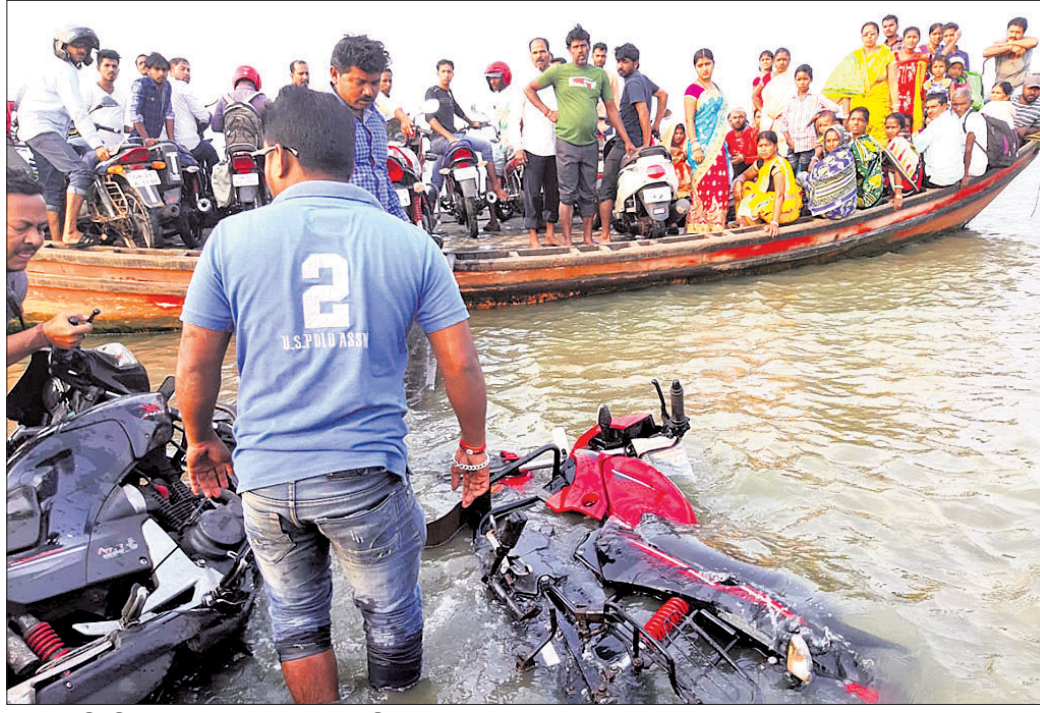
ଡଙ୍ଗାରୁ ଖସିପଡ଼ିଥିବା ବାଇକ୍ ଉଦ୍ଧାର କରାଯାଇଛି। ପଶ୍ଚିମରେ ଦେଖି ଘାଟ ଦେଇ ଉପକରଣ ପ୍ରଦାନ କରାଯାଇନାହିଁ ବୋଲି ପ୍ରତିବନ୍ଧିତ ବନ୍ଧୁ ଲୋକେ ବିପଦପୂର୍ଣ୍ଣ ଭାବେ

ପାରାଦୀପ ଲଫ୍ଟିକୋ ସାର କାରଖାନା ପଛରେ ଥିବା ମହାନଦୀ ବାହାଳୁଦ ଘାଟରେ ରୁଧିବାର ଏକ ଯାତ୍ରାବାହୀ ଡଙ୍ଗାରୁ ୨ ବାଇକ୍ ଖସିପଡ଼ିଛି। ତେବେ ଡଙ୍ଗାରେ ବସିଥିବା ପ୍ରାୟ ୬୦ରୁ ଉର୍ଦ୍ଧ୍ୱ ଯାତ୍ରୀ ବର୍ତ୍ତି ଯାଇଛନ୍ତି। ଡଙ୍ଗାଟି କୁଳ ପାଖରେ ଥିବାରୁ କୌଣସି ଯାତ୍ରୀଙ୍କ କ୍ଷତି ଘଟିନାହିଁ। ନିକଟରେ ଥିବା ଅନ୍ୟ ଏକ ଡଙ୍ଗା ଓ ଯାତ୍ରୀଙ୍କ ସହାୟତାରେ ବାଇକ୍ ଦୁଇଟିକୁ ଉଦ୍ଧାର କରାଯାଇଛି।