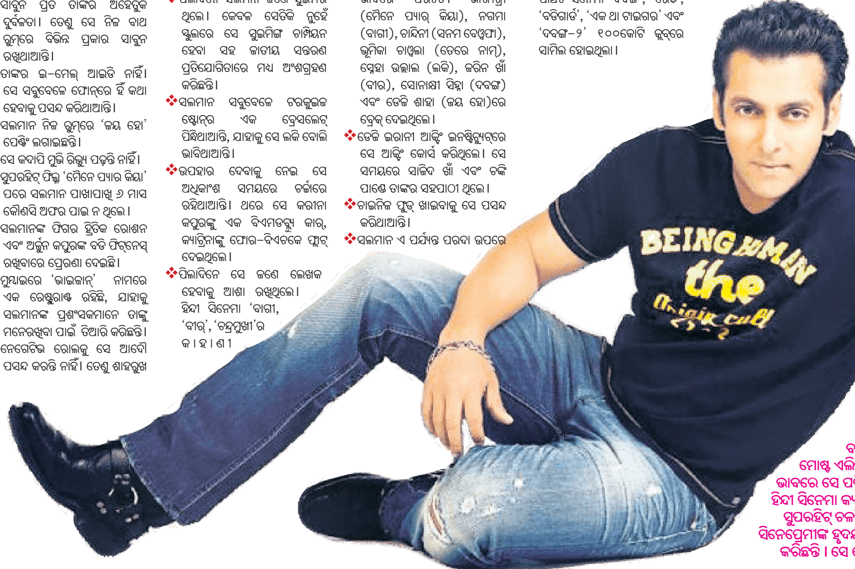
ବଲିଉଡର ମୋଷ୍ଟ ଏଲିଜିବଲ ବ୍ୟାଚେଲର ଭାବରେ ସେ ପରିଚିତ। ଦୀର୍ଘ ୨୫ବର୍ଷର ହିନ୍ଦୀ ସିନେମା କ୍ୟାରିୟରରେ ସେ ଅନେକ ସୁପରହିର୍ ଚଳଚ୍ଚିତ୍ରରେ ଅଭିନୟ କରି ସିନେପ୍ରେମୀଙ୍କ ହୃଦୟରେ ସ୍ୱତନ୍ତ୍ର ସ୍ଥାନ ଅଧିକାର କରିଛନ୍ତି। ସେ ହେଲେ ସଲମାନ ଖାଁ...

କିସିଙ୍ଗ୍ ଶର୍ ଡେଇନାହାନ୍ତି। ଏକଦା ପଛକୁ ପଛ ତାଙ୍କ ଅଭିନୀତ ପାଞ୍ଚଟି ସିନେମା 'ଦବଙ୍ଗ', 'ରେଡି', 'ବଡିଗାଡି', 'ଏକ ଥା ଗାଜର' ଏବଂ 'ଦବଙ୍ଗ-୨' ୧୦୦କୋଟି ଲୁକ୍‌ରେ ସାମିଲ ହୋଇଥିଲା।