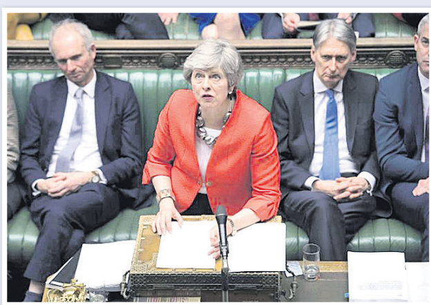
ବ୍ରିଡେନ ପ୍ରଧାନମନ୍ତ୍ରୀ ଥରେଯା ମେ ଲଣ୍ଡନସ୍ଥିତ ପାର୍ଲିମେଣ୍ଟରେ ଆଇନପ୍ରଣେତାଙ୍କୁ ଉଦ୍‌ବୋଧନ ଦେଇଛନ୍ତି।

୧୯୬୫ ମାର୍ଚ୍ଚ ୧୪ରେ ବଲିରତ ଅଭିନେତା ଆମିର ଖାନଙ୍କ ଜନ୍ମ ଦିନରେ ହୋଇଥିଲା। ତାଙ୍କ ପୁରାତନ ମହମ୍ମଦ ଆମିର ହୁସେନ୍ ଖାନ ୩୦ ବର୍ଷର ଫିଲ୍ମ କ୍ୟାରିୟର ମଧ୍ୟରେ ସେ ନିଜକୁ ଭାରତୀୟ ସିନେମାରେ ସବୁଠୁ ଲୋକପ୍ରିୟ ଏବଂ ପ୍ରଭାବଶାଳୀ ଅଭିନେତା ଭାବେ ପ୍ରତିଷ୍ଠିତ କରିପାରିଛନ୍ତି।