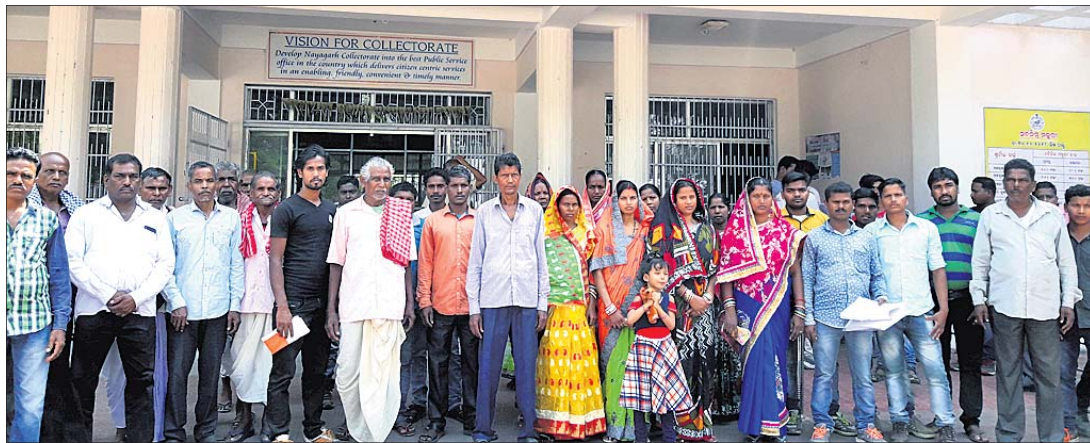
ଅଭିଯୋଗ କରିବାକୁ ଆସିଥିବା ବଳଭଦ୍ରପ୍ରସାଦ ପଞ୍ଚାୟତବାସୀ। କରୁଥିବାବେଳେ ପଞ୍ଚାୟତର ଅନ୍ୟ ଗ୍ରାମର ଲୋକେ ବିରୋଧ କରୁଛନ୍ତି। ଖେଳପଡ଼ିଆ ଠାରେ ପଞ୍ଚାୟତ କାର୍ଯ୍ୟାଳୟ ହେଲେ ପିଲାମାନେ ହଇରାଣ ହେବେ। ତେଣୁ ନିର୍ବାଚନ ପରେ ପଞ୍ଚାୟତ କାର୍ଯ୍ୟାଳୟ ନିର୍ମାଣ କରିବା ନିମନ୍ତେ ସେମାନେ ଦାବି କରିଛନ୍ତି।

ନୟାଗଡ଼ ଜିଲ୍ଲା ଖଣ୍ଡପଡ଼ା ବ୍ଲକ୍ ବଳଭଦ୍ରପ୍ରସାଦ ପଞ୍ଚାୟତର ପଞ୍ଚାୟତ ଗୃହ ନିର୍ମାଣକୁ ନେଇ ବିବାଦ ଦେଖାଦେଇଛି। ଏହାର ସମାଧାନ ପାଇଁ ରୁଧିରୀ ପୂର୍ବରୁ ପଞ୍ଚାୟତବାସୀ ଜିଲ୍ଲାପାଳଙ୍କ ଦ୍ୱାରସ୍ଥ ହୋଇଛନ୍ତି।