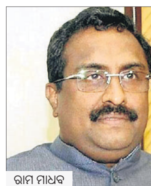
ବୋତୋଲାଣ୍ଡ ପିପୁଲ୍ସ ପାର୍ଟି (ପିପିଏଫ୍), ଉତ୍ତରକେନ୍ଦ୍ର ପିପୁଲ୍ସ ପ୍ରଫ୍ଟ ଅଫ୍ ଟ୍ରିଭୁଟା

ଉତ୍ତର-ପୂର୍ବରେ ବିରୋଧୀ ଦଳଗୁଡ଼ିକ ମହାମେଣ୍ଟ ପାଇଁ ଯୋଜନା ଚଳାଇଥିବାବେଳେ ସହଯୋଗୀଙ୍କୁ ନେଇ ମେଣ୍ଟ ଦୁହାନ୍ତ କରିଛି ଭାରତୀୟ। ୮ ରାଜ୍ୟର ୨୫ ଲୋକ ସଭା ଆସନ ମଧ୍ୟରୁ ୨୨ଟି ଆସନ ଦଖଲ କରିବା ପାଇଁ ଭାରତୀୟ ଲକ୍ଷ୍ୟ ରଖିଛି ବୋଲି ଦଳର ସାଧାରଣ ସମ୍ପାଦକ ରାମ ମାଧବ ବୁଧବାର କହିଛନ୍ତି। ଉତ୍ତର-ପୂର୍ବ ରାଜ୍ୟଗୁଡ଼ିକର ଭାରତୀୟ ପ୍ରଭାବ ରାମ ମାଧବ କହିଛନ୍ତି, ଅସନ ଗଣପରିଷଦ (ଏନପି),