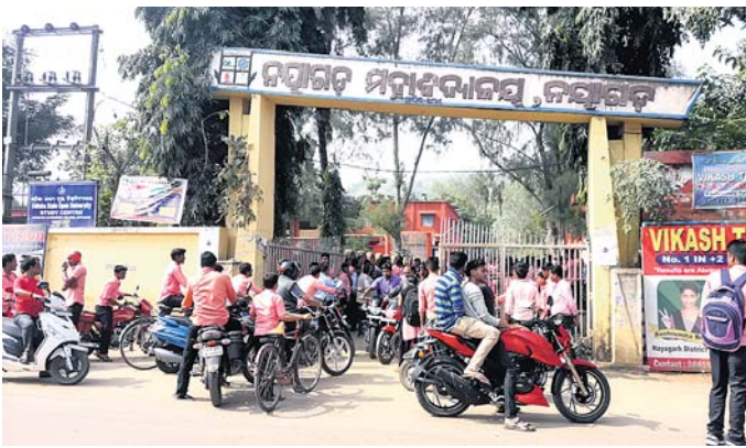
ନୟାଗଡ଼ ସ୍ୱୟଂଶାସିତ ମହାବିଦ୍ୟାଳୟ ।

ନୟାଗଡ଼ ସ୍ୱୟଂଶାସିତ ମହାବିଦ୍ୟାଳୟ ଅବ୍ୟବସ୍ଥା ଦେଇ ଗତି କରୁଛି । ଜିଲାରେ ଥିବା ଏକମାତ୍ର ସ୍ୱୟଂଶାସିତ ମହାବିଦ୍ୟାଳୟକୁ ୮ ବର୍ଷ ହେଲାଣି ନାକ୍ (ନ୍ୟାଶନାଲ ଆସୋସିଏସନ୍ ଅଫ୍ ଆକ୍ରିଡେଣ୍ଡ ନାଉନର୍ସିଲ) ଚିମ୍ ଆସିନାହାଁ । ଫଳରେ ମହାବିଦ୍ୟାଳୟର ଉନ୍ନତନିମ୍ନକ କାର୍ଯ୍ୟ ପାଇଁ ଯୁକ୍ତିସି (ୟୁନିଭରସିଟି ଗ୍ରାଣ୍ଟ କମିଶନ)ଠାରୁ ଅର୍ଥ ଆସିପାରୁନାହିଁ । ପୂର୍ବରୁ ୨୦୦୬ ମସିହାରେ ନାକ୍ ଚିମ୍ ଆସି ମହାବିଦ୍ୟାଳୟକୁ ବିଏ ଗ୍ରେଡ୍ ପ୍ରଦାନ କରିଥିଲା । ୫ ବର୍ଷ ପୂରଣ ହେବା ପରେ ୨୦୧୧ରେ ନାକ୍ ଗ୍ରେଡ୍‌ତରଣ ସରିଥିଲା । ୮ ବର୍ଷ ବିତିଯାଇଥିଲେ ମଧ୍ୟ ଏ ଦିଗରେ କଲେଜ କର୍ତ୍ତୃପକ୍ଷ ଆଣ୍ଡ ବୁକିଂଦେଇଛନ୍ତି । ପ୍ରକାଶ ଯେ, ୧୯୬୧ ମସିହାରେ ପ୍ରତିଷ୍ଠିତ ଏହି କଲେଜ ୨୦୦୬-୦୭ ଶିକ୍ଷା ବର୍ଷରେ ସ୍ୱୟଂଶାସିତ ମହାବିଦ୍ୟାଳୟର ମାନ୍ୟତା ପାଇଥିଲା । ଜିଲା ତଥା ରାଜ୍ୟରେ ନୟାଗଡ଼ ସ୍ୱୟଂଶାସିତ ମହାବିଦ୍ୟାଳୟର ସୁନାମ