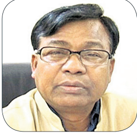
ଭକ୍ତ ଚରଣ ଦାସ