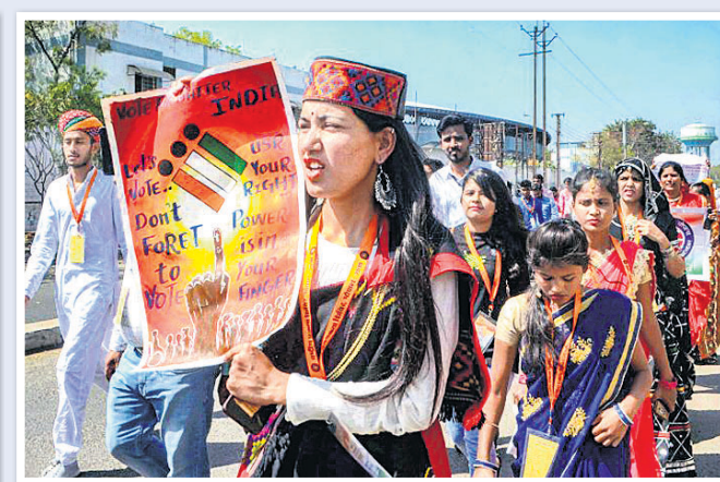
ସାରା ଭାରତରୁ ଭୋପାଳରେ ଏକତ୍ରିତ ହୋଇଥିବା ନ୍ୟାଶନାଲ ସର୍ଭିସ ସ୍ୱେଚ୍ଛାସେବୀ ମତବାଦ ଅଧିକାର ନେଇ କନସାଧାରଣଙ୍କୁ ସଚେତନ କରାଉଛନ୍ତି।