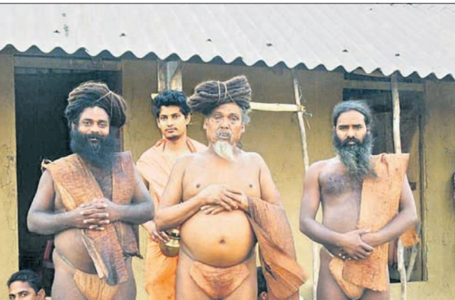
ରାଜନଗରର ମହିମା ଅଲେଖ ଆଶ୍ରମରେ ଅଲେଖ ଧର୍ମାବଲମ୍ବୀ ସାଧୁସଙ୍ଗମାନେ ।