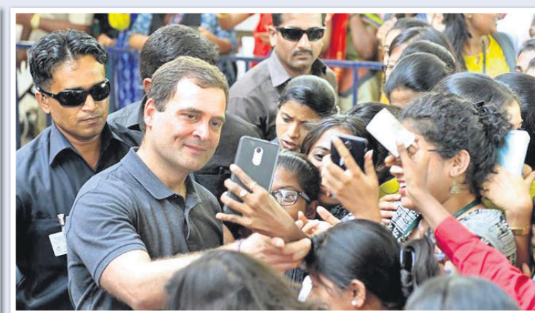
ଚେନ୍ନାଇସ୍ଥିତ ଷ୍ଟେଲୀ ମାରିସ୍ ମହିଳା ମହାବିଦ୍ୟାଳୟ ଛାତ୍ରୀମାନେ ବୁଧବାର କଂଗ୍ରେସ ଅଧ୍ୟକ୍ଷ ରାହୁଲ ଗାନ୍ଧୀଙ୍କ ସହ ସେଲ୍ଫି ନେଉଛନ୍ତି।