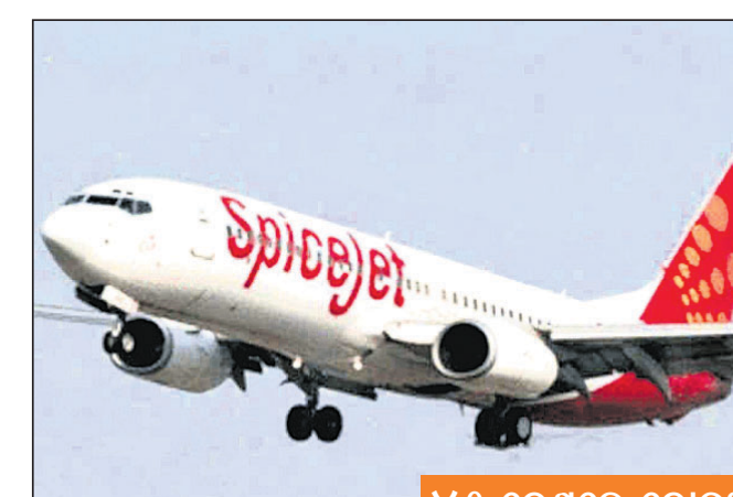
୪୫ ଦେଶରେ ବୋଇଁର ଏହି ମଡେଲ ବନ୍ଦ ହୋଇଛି।