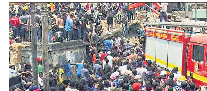
ସ୍କୁଲ ବିଲ୍ଡିଂରେ ଫସିରହିଥିବା ଛାତ୍ରଛାତ୍ରୀଙ୍କୁ ଉଦ୍ଧାର କରାଯାଇଛି।

ଉତ୍ତରୀୟ ଦେଖାଦେଇଛି। ଉକ୍ତ ବିଲ୍ଡିଂ ଚତୁର୍ଥୀ ମହଲରେ ସ୍କୁଲ ଚାଲିଥିଲା ଯେଉଁଠି ଶତାଧିକ ପିଲା ପଢୁଥିଲେ ବୋଲି ସ୍ଥାନୀୟ ଲୋକେ କହିଛନ୍ତି। ପୋଲିସ ଓ ରେଡକ୍ରସ୍ ବାହିନୀ ଉଦ୍ଧାର କାର୍ଯ୍ୟରେ ନିୟୋଜିତ ଅଛନ୍ତି। ନାଇଜେରିଆରେ ନିମ୍ନ ମାନର ନିର୍ମାଣ ସାମଗ୍ରୀର ବ୍ୟବହାର ଏବଂ ନିୟମାବଳୀର ଉପହୁଳ୍ଲ ପାଳନ କରାଯାଇ ନଥିବାରୁ ଅନେକ ସମୟରେ ବିଲ୍ଡିଂ ଭୁଣ୍ଡୁଡିଆଏ। ୨୦୧୬ରେ ଏକ ଚର୍ଚ୍ଚିତ ଭୁଣ୍ଡୁଡି ଶତାଧିକ ଅପେକ୍ଷାରେ ଅଛନ୍ତି। ଘଟଣାସ୍ଥଳରେ ଲୋକଙ୍କ ମୃତ୍ୟୁ ହୋଇଥିଲା।