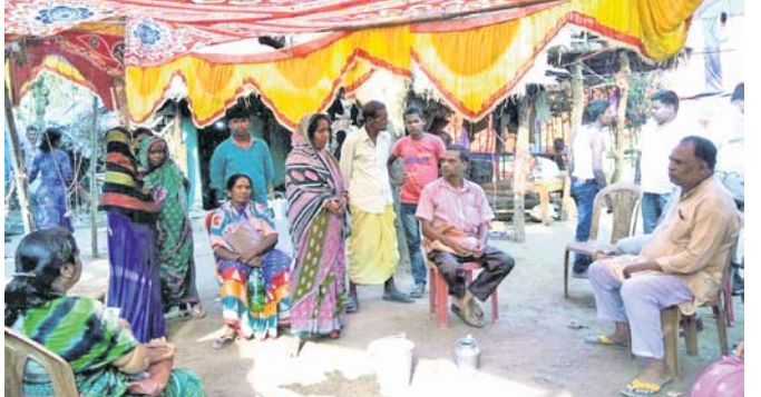
ଚାଲୁଲାଇନ୍ ଡରଫ୍ଟରୁ ବାଲ୍ୟ ବିବାହ ରୋକାଯାଇଛି ।