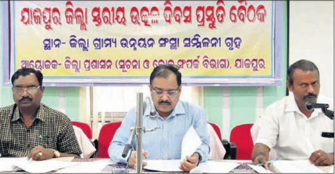
ପ୍ରସ୍ତୁତି ବୈଠକରେ ଜିଲାପାଳଙ୍କ ସହିତ ଅନ୍ୟ ଅଧିକାରୀମାନେ।