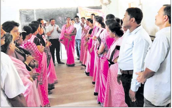
କାର୍ଯ୍ୟକ୍ରମରେ ଉପସ୍ଥିତ ଶିକ୍ଷୟିତ୍ରୀ-ଶିକ୍ଷକ ।

ନୟାଗଡ଼ ଜିଲା ଅନ୍ତର୍ଗତ ରଙ୍ଗପୁର ଶିକ୍ଷା ବ୍ଲକରେ ଶିକ୍ଷାଆମାନଙ୍କର ପ୍ରଶିକ୍ଷଣ ଦକ୍ଷତା ବୃଦ୍ଧି କରିବା ଉଦ୍ଦେଶ୍ୟରେ ବ୍ଲକସ୍ତରୀୟ ୧୩ ପର୍ଯ୍ୟାୟ ଉତ୍କଳ ଓ ଉତ୍ତାନ ତାଲିମ ଶିବିର ଅନୁଷ୍ଠିତ ହୋଇଯାଇଛି । ଏହି ତାଲିମ ଶିବିର ଚଳିତ ମାସ ୧୧ ତାରିଖରୁ ଆରମ୍ଭ ହୋଇଥିଲା । ଗୁରୁବାର ଶିବିର ଉଦ୍‌ଘାଟିତ ହେବା ବୋଲି ସିଆରସିସି ଶକ୍ତି ପ୍ରସାଦ ଆଚାର୍ଯ୍ୟ ସୂଚନା ଦେଇଛନ୍ତି । ୨ୟ ଶ୍ରେଣୀରୁ ୫ମ ଶ୍ରେଣୀ ପିଲାମାନଙ୍କର ପ୍ରଶିକ୍ଷଣ ଦକ୍ଷତା ଅଭିବୃଦ୍ଧି ପାଇଁ ଶିକ୍ଷକ/ଶିକ୍ଷୟିତ୍ରୀମାନଙ୍କୁ ଉତ୍କଳ ତାଲିମ ଦିଆଯାଉଥିବାରୁ ୬୫୫୫ ୮ମ ଶ୍ରେଣୀର ପିଲାମାନଙ୍କର ଶିକ୍ଷଣ ଦକ୍ଷତା ଅଭିବୃଦ୍ଧି ପାଇଁ ଶିକ୍ଷକ/ଶିକ୍ଷୟିତ୍ରୀମାନଙ୍କୁ ଉତ୍ତାନ ତାଲିମ ଦିଆଯାଉଛି । ଏହି ପର୍ଯ୍ୟାୟରେ ୨୦୦ ଜଣଙ୍କୁ ଉତ୍କଳ ତାଲିମ ଓ ୬୦ ଜଣଙ୍କୁ ଉତ୍ତାନ ତାଲିମ ଦିଆଯାଉଛି । ଉତ୍କଳ ବିଭାଗରେ ଶକ୍ତି ପ୍ରସାଦ ଆଚାର୍ଯ୍ୟ, ଅପେନ୍ଦ୍ର ବିଶ୍ୱାଳ, ସୁଶୀଳା କୁମାର ରଣା, ଅଶୋକ ସାମନ୍ତରାୟ, ପ୍ରଭାତ ପଣ୍ଡା, ରାଜ କିଶୋର ଦାସ, ପବିତ୍ର ସାମନ୍ତରାୟ, ମାନସ ପଟ୍ଟନାୟକ, ଭାଗୀରଥ ସାହୁ,