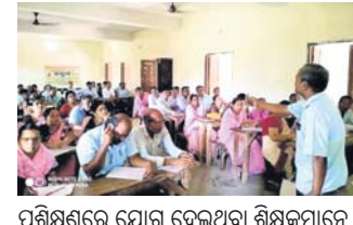
ପ୍ରଶିକ୍ଷଣରେ ଯୋଗ ଦେଇଥିବା ଶିକ୍ଷକମାନେ ।