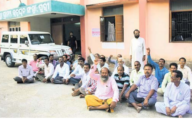
ଧାରଣରେ କୃଷକ ମହାସଂଘର କର୍ମକର୍ତ୍ତା। ପହଞ୍ଚି ଧାରଣରେ କୃଷକମାନଙ୍କ ସହ ଆଲୋଚନା କରିଥିଲେ। ଚାଷ ପାଇଁ ଦାବି କରାଯାଇଥିଲା।

ପୁରୀ ଜିଲ୍ଲା ଚାଷୀଙ୍କ ବିଭିନ୍ନ ଦାବି ସମ୍ପର୍କରେ ନୀଳାଚଳ କୃଷକ ମହାସଂଘ ସହ ଆଲୋଚନା କରିବା ଲାଗି ଜିଲ୍ଲା ପ୍ରଶାସନ ରୁଧିରୀ ସମୟ ନିର୍ଦ୍ଧାରଣ କରିଥିଲା।