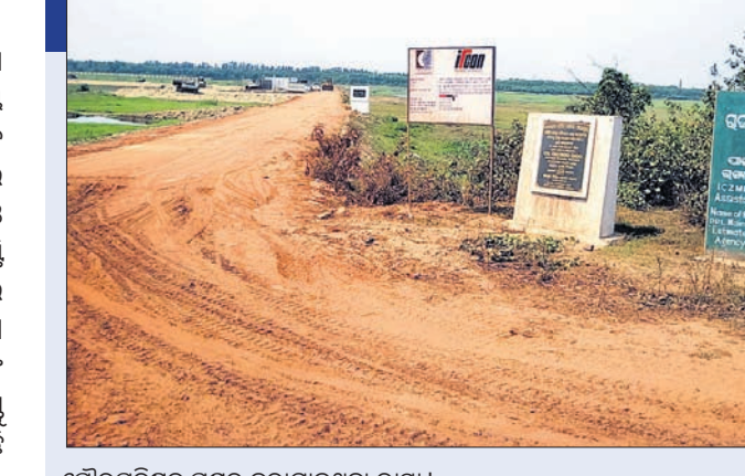
ପୌରପରିଷଦ ପକ୍ଷରୁ କରାଯାଇଥିବା ରାସ୍ତା।

ଆହୁରି ଭଲ ରାସ୍ତା କରିବାକୁ ପାରାଦୀପ ବନ୍ଦରର ପ୍ରତିଶ୍ରୁତି