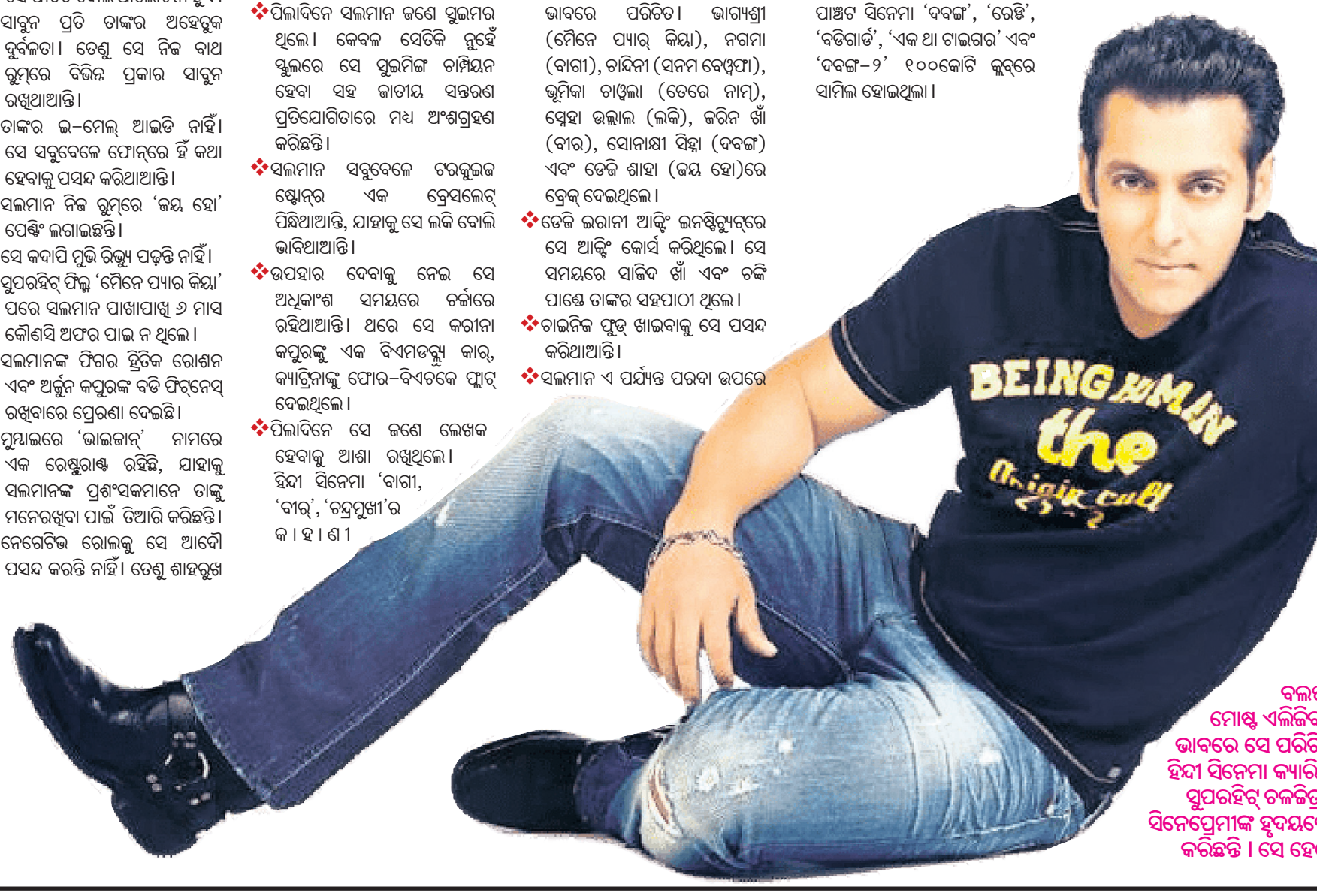
ବଲିଉଡର ମୋଷ୍ଟ ଏଲିଜିବଲ ବ୍ୟାଚେଲର ଭାବରେ ସେ ପରିଚିତ। ଦୀର୍ଘ ୨୫ବର୍ଷର ହିନ୍ଦୀ ସିନେମା କ୍ୟାରିୟରରେ ସେ ଅନେକ ସୁପରହିର୍ ଚଳଚ୍ଚିତ୍ରରେ ଅଭିନୟ କରି ସିନେପ୍ରେମୀଙ୍କ ହୃଦୟରେ ସ୍ୱତନ୍ତ୍ର ସ୍ଥାନ ଅଧିକାର କରିଛନ୍ତି। ସେ ହେଲେ ସଲମାନ ଖାଁ...

କିସିଙ୍ଗ ଶର୍ ଦେଇନାହାନ୍ତି। ଏକଦା ପଛକୁ ପଛ ତାଙ୍କ ଅଭିନୀତ ପାଞ୍ଚଟି ସିନେମା 'ଦବଙ୍ଗ', 'ରେଡି', 'ବଡିଗାଡି', 'ଏକ ଥା ଗାଜରର' ଏବଂ 'ଦବଙ୍ଗ-୨' ୧୦୦କୋଟି ଲୁକ୍‌ରେ ସାମିଲ ହୋଇଥିଲା।