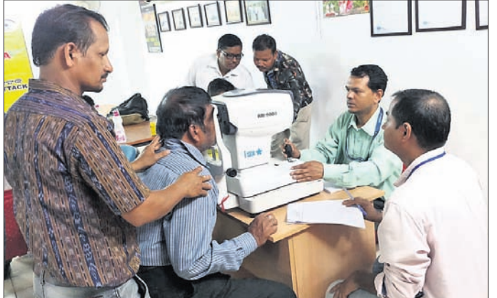
ଜଣେ ବ୍ୟକ୍ତିଙ୍କ ଚକ୍ଷୁ ପରୀକ୍ଷା କରାଯାଇଛି।