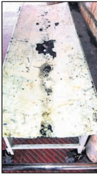
ଭଙ୍ଗା ଦବରା ଅବସ୍ଥାରେ ଥିବା ସ୍ତେର ।

ଥାନୁ ଚାତୁ ଅବସ୍ଥାରେ ପ୍ରକାଶ ପାଇଛି । ଅନୁଗୋଳ ମେଡିକାଲକୁ ଜିଲା ଭଲ ସ୍ତେରଟିଏ ନାହିଁ ।