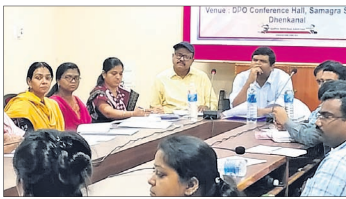
ବୈଠକରେ ପ୍ରଶାସନିକ ଅଧିକାରୀମାନେ।