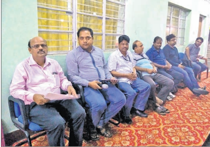
ସଭାରେ ଅଫିସର ସଂଘର ସଦସ୍ୟମାନେ।

ସମସ୍ତ ନିର୍ଦ୍ଦେଶାବଳୀକୁ ପାଳନ କରିବାକୁ ପ୍ରଶାସନ ପକ୍ଷରୁ ଆହ୍ୱାନ ଦିଆଯାଇଛି। ୨୦୧୯ ସାଧାରଣ ନିର୍ବାଚନ ଶାନ୍ତିଶୃଙ୍ଖଳାରେ ଶେଷ କରିବାକୁ ଜିଲ୍ଲାପାଳ ଦୃଢ଼ ଆଶା ପୋଷଣ କରିଛନ୍ତି।