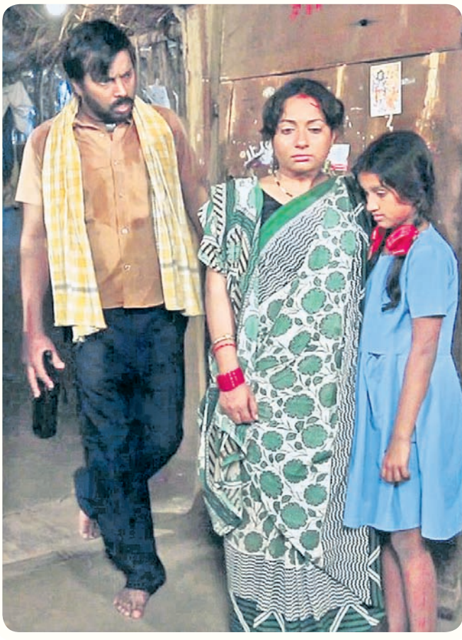
ତେଲି ଫିଲ୍ମ 'ସଞ୍ଜ ସକାଳ'ର ଏକ ଦୃଶ୍ୟ।

ସତ୍ୟବାନ ଜଣେ ମଜୁରିଆ। ଯାହା କିଛି ରୋଜଗାର କରେ ପରିବାର ତଳାଳ ବର୍ଣ୍ଣ ମନ୍ଦ ପିଲାବେଳେ ଖର୍ଚ୍ଚ କରିଦିଏ। ନିଜ ପିଲାକୁ ଖାଇବାକୁ ଦେବାକୁ ଚା' ସ୍ତ୍ରୀ ସାବିତ୍ରୀ ନିଜକୁ ମନ୍ଦ ବିରୋଧୀ ଅଭିଜ୍ଞାନରେ ସାମିଲ କରେ। ସେଥିରୁ ଯେଉଁଦି ପଲ୍ଲୀ ନିଜେ ସେଥିରେ ପରିବାର ତଳାଏ। ହେଲେ ଏହି ସମୟରେ ସେ ଗିରଫ ହୋଇ ହାଜତରେ ଥିବା ବେଳେ ପୋଲିସ୍ ଦ୍ୱାରା ଧର୍ଷିତା ହୁଏ। ହେଲେ ଏହାର ପାଇଦା ନିଏ ମଦ୍ୟପ ସ୍ୱାମୀ। ନିଜ ସ୍ୱାକୁ ଗଣିକା ସକାଳ ପଇସା ରୋଜଗାର କରି ମନ୍ଦ ପିଲାବେଳେ ନିଜକୁ ହକାଳ ଦିଏ। ଏହାର ପରିଣାମ ସ୍ୱରୂପ ନିଜ ପିଲାକୁ ବିଷ ଦେଇ ନିଜେ ବିଷ ପିଇଦିଏ ସାବିତ୍ରୀ। ଆଉ ଚା'ପରେ ? ଅକାଳରେ ପିଲାଟିକୁ