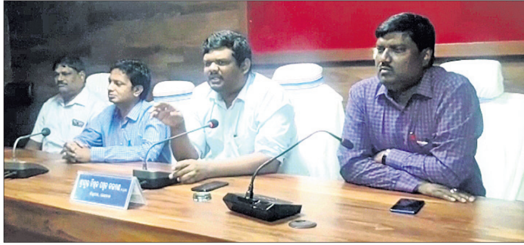
ସାଧାରଣ ନିର୍ବାଚନକୁ ନେଇ ଖବରଦାତା ସମ୍ମିଳନୀ।

ସାଧାରଣ ନିର୍ବାଚନକୁ ସ୍ୱଳ୍ପ ଏବଂ ଅଧିକାଂଶ କରିବାକୁ ଢେଙ୍କାନାଳ ଜିଲ୍ଲା ପ୍ରଶାସନ ପକ୍ଷରୁ ଭୋଟରମାନଙ୍କୁ ପ୍ରସ୍ତୁତି କରାଯାଇଛି।