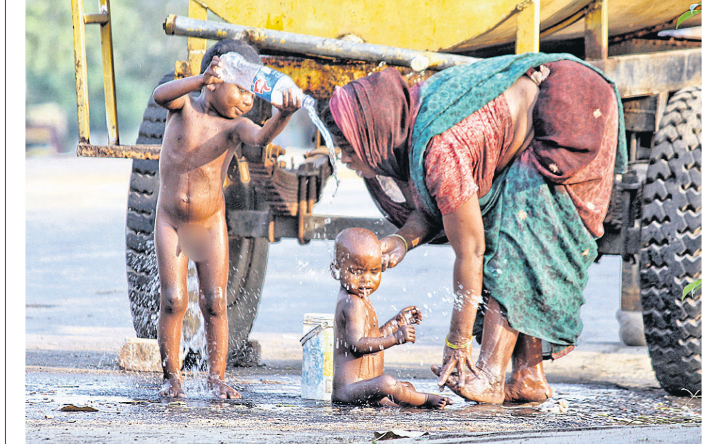
ଅନୁଗୋଳ ସହରରେ ବୁଧବାର ଚାନ୍ଦିନୀରୁ ବୁଜି ଶିଶୁ ।