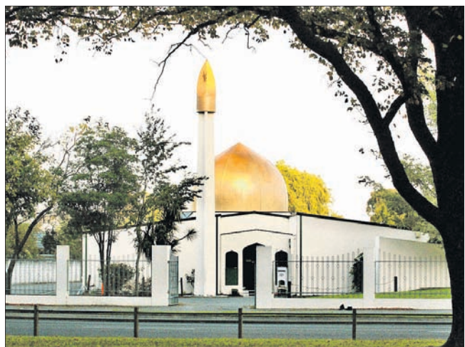
ଖ୍ରୀଷ୍ଟଚର୍ଚ୍ଚ ସହରରେ ଥିବା ଅଲ୍ ରୁସ୍ ମସ୍ଜିଦ୍ ।