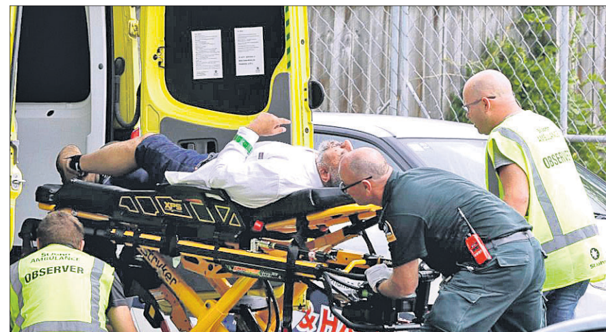
ଆକ୍ରମଣରେ ଆହତ ଜଣେ ବ୍ୟକ୍ତିଙ୍କୁ ସୁରକ୍ଷାକର୍ମୀମାନେ ହସ୍ତଗତ ନେଉଛନ୍ତି ।