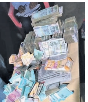
ଜବତ କରାଯାଇଥିବା ଟଙ୍କା ।

ନୂଆପଡ଼ା ଅତିସ, ୧୫୩ ପଡୋଶୀ ଛତିଶଗଡ଼ରେ ଲୋକସଭା ନିର୍ବାଚନକୁ ଦୃଷ୍ଟିରେ ରଖି ପୋଲିସ ଛାନଭିନ ଜାରି ରଖିଛି।