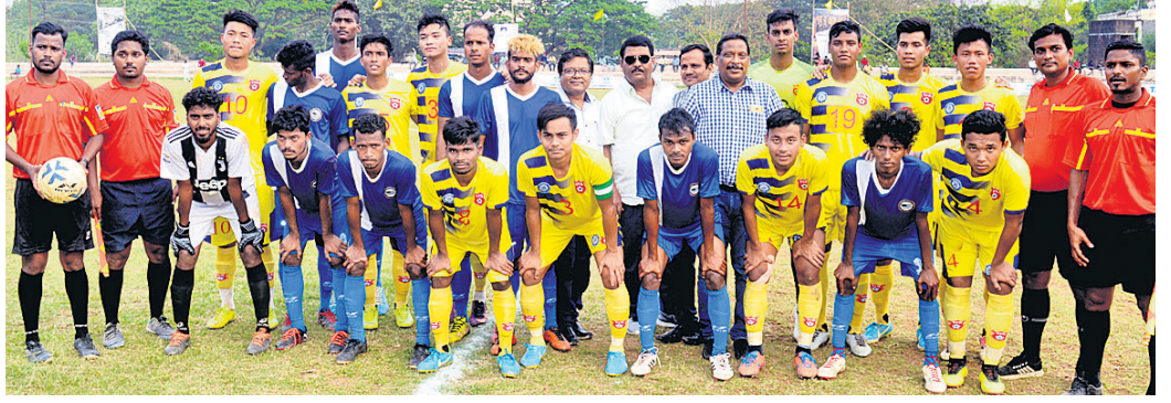
ଦୁଇ ଦଳର ଖେଳାଳିମାନେ ଅତିଥିକ୍ ଗହଣରେ। ଏକାଡେମୀର ମାନସକ୍ ଏକ ଆନୁଷ୍ଠାନିକ ଅଫିସରଙ୍କ ଦ୍ୱାରା ପ୍ରଦାନ କରାଯାଇଥିଲା। ଖେଳାଳିଙ୍କ ସହ ପରିଚିତ ହୋଇଥିଲେ। ମ୍ୟାଚ୍ ପ୍ରତିଷ୍ଠାକାରୀ କରିଥିଲେ ଡୋକ୍ଟରାଟ୍ ସାଲ୍, ପ୍ରଦୀପ ଅଫ୍ ଦି ମ୍ୟାଚ୍ ପୁରସ୍କାର ପ୍ରଦାନ କରାଯାଇଥିଲା। ଖେଳାଳିଙ୍କ ସହ ପରିଚିତ ହୋଇଥିଲେ। ମ୍ୟାଚ୍ ପ୍ରତିଷ୍ଠାକାରୀ କରିଥିଲେ ଡୋକ୍ଟରାଟ୍ ସାଲ୍, ପ୍ରଦୀପ ଅଫ୍ ଦି ମ୍ୟାଚ୍ ପୁରସ୍କାର ପ୍ରଦାନ କରାଯାଇଥିଲା। ଖେଳାଳିଙ୍କ ସହ ପରିଚିତ ହୋଇଥିଲେ। ମ୍ୟାଚ୍ ପ୍ରତିଷ୍ଠାକାରୀ କରିଥିଲେ ଡୋକ୍ଟରାଟ୍ ସାଲ୍, ପ୍ରଦୀପ ଅଫ୍ ଦି ମ୍ୟାଚ୍ ପୁରସ୍କାର ପ୍ରଦାନ କରାଯାଇଥିଲା।