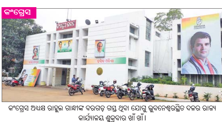
କଂଗ୍ରେସ ଅଧ୍ୟକ୍ଷ ରାହୁଲ ଗାନ୍ଧୀଙ୍କ ବରଗଡ଼ ଗସ୍ତ ଥିବା ଯୋଗୁ ଭୁବନେଶ୍ୱରସ୍ଥିତ ଦଳର ରାଜ୍ୟ କାର୍ଯ୍ୟାଳୟ ଶୁକ୍ରବାର ଖାଁ ଖାଁ ।