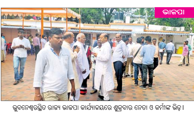
ଭୁବନେଶ୍ୱରସ୍ଥିତ ରାଜ୍ୟ ଭାଜପା କାର୍ଯ୍ୟାଳୟରେ ଶୁକ୍ରବାର ନେତା ଓ କର୍ମୀଙ୍କ ଭିଡ଼ ।