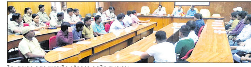
ଜିଲା ପ୍ରଶାସନ ପକ୍ଷରୁ ଆୟୋଜିତ ବୈଠକରେ ଉପସ୍ଥିତ ଅଧିକାରୀ ।