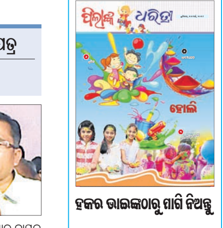
ହଜର ଭାଇଜନଠାରୁ ମାଗି ନିଅନ୍ତୁ

କିଛି ତଥ୍ୟ ଦେଶର ବାଣିଜ୍ୟ ନିଅଣ୍ଟ ପରିମାଣ ଫେବୃୟାରୀରେ ୯.୬୦ ବିଲିୟନ ଟଙ୍କାରୁ ଥିବ ପଡିଛି। - ବାଣିଜ୍ୟ ମନ୍ତ୍ରାଳୟ