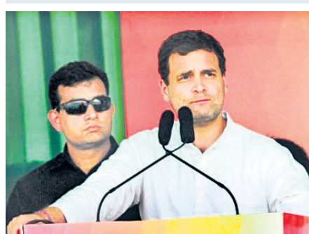
ରାହୁଲ ଗାନ୍ଧୀ ଉଦ୍‌ବୋଧନ ଦେଇଛନ୍ତି ।

ରାହୁଲଙ୍କ ଅଭିଭାଷଣର ଫୋକସରେ ରହିଥିଲା। ସେ କହିଥିଲେ, ବରଗଡ଼ ଜିଲ୍ଲା ରାଜ୍ୟର ଭାଗଭାଗି। ଏଠାରେ ସର୍ବାଧିକ ଧାନ ଉତ୍ପାଦନ ହୋଇଥାଏ। କିନ୍ତୁ ଧାନ ଉତ୍ପାଦନ କରି ଦେଶବାସୀଙ୍କୁ ଆହାର ଯୋଗାଉଥିବା ଗାନ୍ଧୀ ଏଠାରେ ଆତ୍ମହତ୍ୟା କରୁଛି। ସାରା ଦେଶରେ ଏଭଳି ପରିସ୍ଥିତି ଉପୁଜିଛି ଏବଂ ପ୍ରତିଦିନ ଜଣେ ନା ଜଣେ ଗାନ୍ଧୀ ଆତ୍ମହତ୍ୟା କରୁଛନ୍ତି। ଏହା ଉଭୟ ରାଜ୍ୟ ଓ କେନ୍ଦ୍ର ସରକାରଙ୍କ ଅପାରଗତାର ନିଦର୍ଶନ।