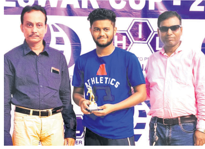
ଅନୁଷ୍ଠିତ ବିତୀୟ ସେମିଫାଇନାଲରେ ପ୍ରଗତି ସ୍ଫୋର୍ଟିଂ ଓ ଗ୍ରୀସ୍ କ୍ରିକେଟ୍ ଏକାଡେମୀ ମଧ୍ୟରେ ଅନୁଷ୍ଠିତ ଏକ ମ୍ୟାଚ୍ରେ ରାଜନୈତିକ ବିଜ୍ଞାପନ ଦେଖିବାକୁ ମିଳିଥିଲା।