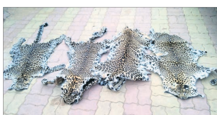
ଜବତ ହୋଇଥିବା କଲରାପତରିଆ ବାଘ ଚମଡ଼ା ।

ଭୁବନେଶ୍ୱର, ୧୫ମାର୍ଚ୍ଚ(ବୁଧି) କ୍ରାନ୍ତମୁଖୀ ଶ୍ରେଣୀର ଟ୍ୟାକ୍ସ ଫୋର୍ସ(ଏସ୍‌ଟିଏଫ୍) ସମ୍ବଲପୁରର କୁଟିଆଠାରେ ଚଢ଼ାଉ କରି ୪ କଲରାପତରିଆ ବାଘ ଚମଡ଼ା ଜବତ କରିଛି। ଏହାସହ ଏଥିରେ ସମ୍ପୃକ୍ତ ଥିବା ୭ଜଣ ଶିକାରୀଙ୍କୁ ଗିରଫ କରାଯାଇଛି। ଶନିବାର ସେମାନଙ୍କୁ କୋର୍ଟଚାଲାଣ କରାଯିବ। ଏହି ଅପରେଶନ ପାଇଁ ଏସ୍‌ଟିଏଫ୍ ପ୍ରାୟ ଦୁଇମାସ ଚଳୁ ଚାଲି ବିଚ୍ଛାଳିଥିଲା। ଗତ ମାସରେ ଏସ୍‌ଟିଏଫ୍‌ର ଏକ ଟିମ୍ ସେଠାକୁ ଯାଇ ସେମାନଙ୍କ ସହିତ ମୁଲଗାଳ କରିଥିଲା। ଚିତ୍ର ସଦସ୍ୟମାନେ କିଛି ନୂଆ ସାମଗ୍ରୀ ଆଣିବାକୁ ଅର୍ଥର ମଧ୍ୟ ଦେଇଥିଲେ। ଆବଶ୍ୟକ ତଥ୍ୟ ହାସଲ ପରେ ଚଢ଼ାଉ ପାଇଁ ଯୋଜନା ହୋଇଥିଲା। ଶୁକ୍ରବାର ଅପରାହ୍ନ ପ୍ରାୟ ୪ଟାରେ ଏସ୍‌ଟିଏଫ୍ ଓ କୁଟିଆ ଥାନା ପୋଲିସର