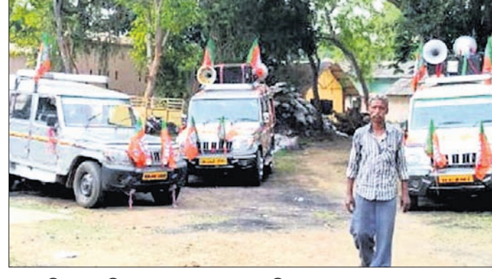
ଗାନ୍ଧବାଲି ଆନା ପରିସରରେ ଅଟକ ୩ ପ୍ରଚାର ଗାଡ଼ି ।

ପୋଲିସର ଧରପତ୍ର ପରେ ନେତାଙ୍କ ପ୍ରଚାରରେ ଅକ୍ଷୁଣ୍ଣ ଲାଗିଛି । ଧାମରା ଅଞ୍ଚଳରେ ନେତାଙ୍କ ହୋର୍ଟିକ୍ସ ହଟାଯାଇଥିବା ଜଣାପଡ଼ିଛି । ରାଜନୈତିକ ଦଳର ନେତାଙ୍କୁ ସେମାନଙ୍କ ହୋର୍ଟିକ୍ସ କାଟି ନେବାକୁ ସୂଚନା ଦିଆଯାଇଥିଲେ ମଧ୍ୟ କେହି ଶୁଣି ନ ଥିଲେ । ଫଳରେ ଧାମରା ବଜାର, କଲଥୋଗାଲା, କରମାଳ, କରଣପଲ୍ଲୀ ଓ ଦୋସିଙ୍ଗା ପଞ୍ଚାୟତରେ ଲାଗିଥିବା ହୋର୍ଟିକ୍ସ ରାଜସ୍ୱ ବିଭାଗର କର୍ମଚାରୀ ପୋଲିସ୍ ଉପସ୍ଥିତରେ ଖୋଲି ନେଇଥିଲେ । ଗାନ୍ଧବାଲି ଏନ୍‌ଏସିର ବିଜିନ ବିକ୍ଷୁଦ୍ ପୋଲରେ ଲଗାଯାଇଥିବା ଦଳୀୟ ବ୍ୟାନର ଓ ପତାକାକୁ ହଟାଯାଇ ବିଜେଡି ନେତାଙ୍କ ଖାଲିରେ କଳାରଙ୍ଗ ବୋଳା ଯାଇଥିଲା । ପ୍ରଶାସନ ଓ