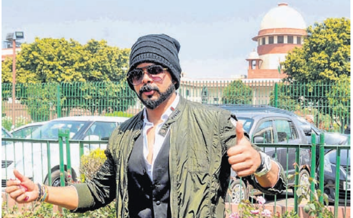
ସୁଆସିଲା, ୧୫ମା (ପି.ଟି.)

କ୍ରିକେଟର ଏସ୍. ଶ୍ରୀସଙ୍କଳ୍ପ ବଡ଼ ଆଶ୍ଚର୍ଯ୍ୟା ମିଳିଛି। ସୁପ୍ରିମକୋର୍ଟ ଶ୍ରୀସଙ୍କଳ୍ପ ଉପରେ ଲାଗିଥିବା ଆଜୀବନ ବାସନ୍ଦକୁ ହଟାଇ ଦେବାକୁ ବିଧିବିଧିଆର ଶୁଣାଣୀ କରାଯାଇଥିବା ବାବଦରେ ମାଧ୍ୟମରେ କୋର୍ଟ ନିର୍ଦ୍ଦେଶ ଦେଇଛନ୍ତି।