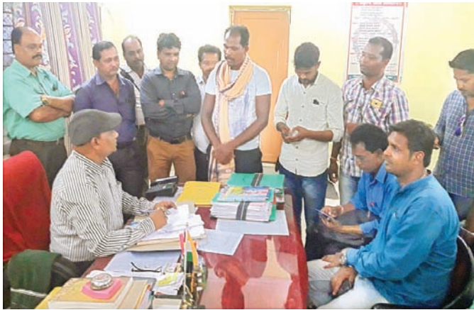
ଅଭିଭାବକମାନେ ଜିଲ୍ଲା ଶିକ୍ଷାଧିକାରୀଙ୍କ ସହ ଆଲୋଚନା କରୁଛନ୍ତି ।

୬୭ ଘରୋଇ ଶିକ୍ଷାନୁଷ୍ଠାନ ମଧ୍ୟରୁ ୧୨ଟି ବିଦ୍ୟାଳୟର ଏନଓସି ରହିଛି