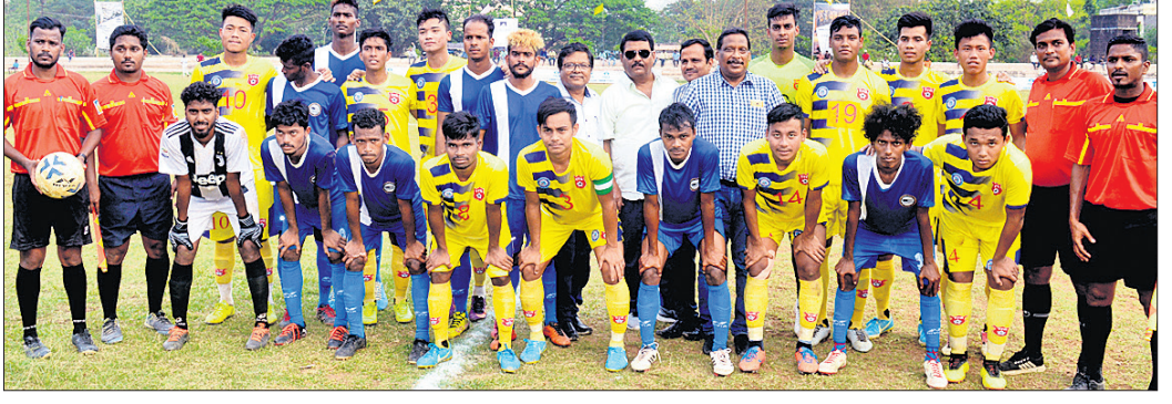
ଭୁବନେଶ୍ୱର ଖେଳାଳିମାନେ ଅତିଥିକ୍ ଗହଣରେ।

ୟୁନିଟ୍-୬ ଆଥଲେଟିକ୍ ଆସୋସିଏସନ୍ ଆୟୁଷକ୍ରମରେ ଚାଲିଥିବା ୨୯ତମ ଉତ୍ତମ ଖେଳ କପ୍ ଫୁଟବଲ ଚୁନାବଳରେ ସେମିଫାଇନାଲରେ କାମସେଦପୁର ଟାଟା ଫୁଟବଲ ଏକାଡେମୀ ପ୍ରବେଶ କରିଛି।