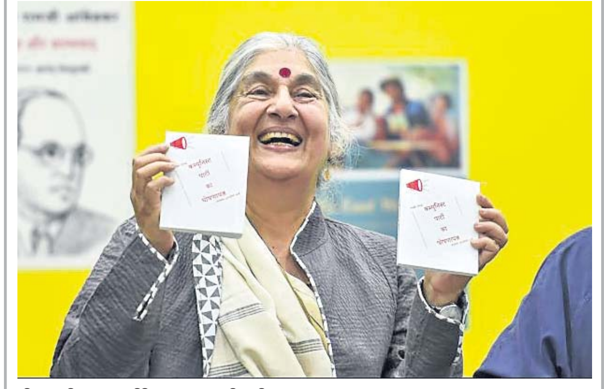
ଦିଲ୍ଲୀର କର୍ମସୂଚୀଶୀଳ କର୍ମରେ ସିପିଆଇଏମ୍ ନେତ୍ରୀ ସୁଭାଶିନୀ ଅଲି ଶୁକ୍ରବାର ଦଳୀୟ ଇପ୍ରାହାର (ବି କମ୍ୟୁନିଷ୍ଟ ମେନିଫେଷ୍ଟୋ)ର ହିନ୍ଦୀ ସଂସ୍କରଣ ଉନ୍ମୋଚନ କରୁଛନ୍ତି ।

ନୂଆଦିଲ୍ଲୀ, ୧୫ମାର୍ଚ୍ଚ (ପି.ଟି.): ସାଧାରଣ ନିର୍ବାଚନ ପାଇଁ ଭାଜପାର ପ୍ରଥମ ପର୍ଯ୍ୟାୟ ପ୍ରାର୍ଥୀ ତାଲିକା ଶନିବାର ପ୍ରକାଶ ପାଇପାରେ । ନୂଆଦିଲ୍ଲୀରେ କେନ୍ଦ୍ରୀୟ ନିର୍ବାଚନ କମିଟି ଚୈଠକରେ ଏନେଇ ନିଷ୍ପତ୍ତି ନିଆଯିବାର ସମ୍ଭାବନା ରହିଛି । ଏପ୍ରମ୍ ୧୧ରେ ୯୧ ଆସନରେ ହେବାକୁ ଥିବା ପ୍ରଥମ ପର୍ଯ୍ୟାୟ ନିର୍ବାଚନ ପାଇଁ ଭାଜପା ପକ୍ଷରୁ ପ୍ରାର୍ଥୀ ତାଲିକା ଘୋଷଣା କରାଯିବ । ଚୈଠକରେ ପ୍ରଧାନମନ୍ତ୍ରୀ ନରେନ୍ଦ୍ର ମୋଦି ଓ ଭାଜପା ରାଷ୍ଟ୍ରୀୟ ଅଧ୍ୟକ୍ଷ ଅମିତ୍ ଶାହଙ୍କ ସମେତ ବିଶିଷ୍ଟ ନେତାମାନେ ଯୋଗଦେବେ ।