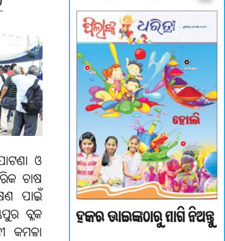
ହଜର ଭାଇଜନମାନଙ୍କୁ ମାଗି ନିଅନ୍ତୁ

କିଛି ତଥ୍ୟ ଦେଶର ବାଣିଜ୍ୟ ନିଅଣ୍ଟ ପରିମାଣ ଫେବୃୟାରୀରେ ୯.୬୦ ବିଲିୟନ ଡଲାରରୁ ଥିବା ଘଟିଛି। - ବାଣିଜ୍ୟ ମନ୍ତ୍ରାଳୟ