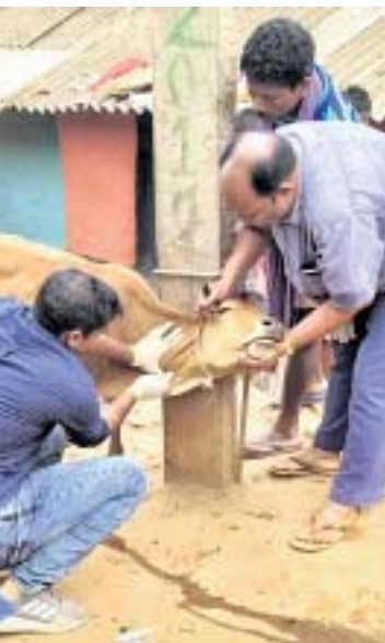
ଆକ୍ରାନ୍ତରେ ଆକ୍ରାନ୍ତ ରାଜାଠାରୁ ରକ୍ତ ନମୁନା ସଂଗ୍ରହ କରାଯାଉଛି ।

ସହି ଦେବତା ପାଠରେ ପୂଜା ପାଉଥିବା ମା' ଏଲମା । ଏକ ବୃକ୍ଷ ମୂଳେ ଅସ୍ଥାୟୀ ଭାବେ ମାଙ୍କ ପୂଜାର୍ଚ୍ଚନା କରାଯିବା ପରେ ପୁନଶ୍ଚ ମା ଡାକ ଝାନିଯାତ୍ରା ଶୁକ୍ରବାର ଅନୁଷ୍ଠିତ ହୋଇଯାଇଛି । ଦିନକ ପାଇଁ ଅନୁଷ୍ଠିତ ଏହି ଯାତ୍ରାରେ ଲୋକଙ୍କ ପ୍ରବୃତ୍ତ ଭିତ୍ତ ଜମିଥିଲା । ଦେବୀ ଏଲମାଙ୍କ ଏହି ଯାତ୍ରା ଝାନିଯାତ୍ରା ଭାବେ ଅଞ୍ଚଳରେ ଖୁବ୍ ପରିଚିତ । ଗୁଣାପୁର ସହର ଖାର୍ତ୍ତି ନଂ-୪ ବଂଶଧାରୀ ନଦୀ ତଟେ ଥିବା କାଞ୍ଜିପୁଟିରେ