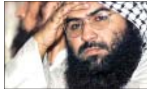
ସମେତ ଆମେରିକା ଓ ବ୍ରିଟେନ ଆଖାରଙ୍କୁ ବିଶ୍ୱ ଆତଙ୍କବାଦୀ ଘୋଷଣା କରିବା ଲାଗି ଜାତିସଂଘ ସୁରକ୍ଷା ପରିଷଦରେ ଆବେଦନ କରିଥିଲେ । ତେବେ ତାଙ୍କଦ୍ୱାର ବିରୋଧ ଯୋଗୁ ଆଖାର ପୁଣି ଥରେ ଜାତିସଂଘ କଟକଣାକୁ ବର୍ତ୍ତୀୟାଛନ୍ତି । ଆତଙ୍କବାଦ ନିରୋଧୀ ସଂଗ୍ରାମରେ ପ୍ରାନ୍ତ ସବୁବେଳେ ଭାରତ ପକ୍ଷରେ ରହିଆସିଛି ଓ ରହିବ ବୋଲି ବିକୃତିରେ କୁହାଯାଇଛି ।

ନୂଆଦିଲ୍ଲୀ, ୧୫ମାର୍ଚ୍ଚ (ପି.ଟି.): ଜୈଶ-ଇ-ମହମ୍ମଦ (କେଇଏମ୍) ଆତଙ୍କବାଦୀ ସଂଗଠନର ପ୍ରତିଷ୍ଠାତା ମୁଖ୍ୟ ମାସୁଦ ଆଖାରଙ୍କ ସମ୍ପତ୍ତି ବାଜ୍ୟାପ୍ତ କରିବା ଲାଗି ପ୍ରାନ୍ତ ନିଷ୍ପତ୍ତି ନେଇଛି । ଏଥିସହିତ ଯୁବୋପାୟ ସଂଘ (ଇୟୁ)ର ସଦସ୍ୟ ଆତଙ୍କବାଦୀ ତାଲିକାରେ ଆଖାରଙ୍କୁ ସାମିଲ କରିବା ପାଇଁ ଉଦ୍ୟମ କରାଯିବ ବୋଲି ପ୍ରାନ୍ତ ଅଧିକାରୀଙ୍କର ଏବଂ ବହିଷ୍କାର ପାଇଁ ମନ୍ତ୍ରଣାଳୟ ପକ୍ଷରୁ ମିଳିତ ଯାଦବ, ଏଏପି ଆବାହକ ଅରବିନ୍ଦ କେଜ୍ଜିଠ୍ଯଲ, ସମାଜବାଦୀ ପାର୍ଟି ଅଧ୍ୟକ୍ଷ ଅଶ୍ୱକେଶ ଯାଦବ, ଚୁକ୍ତମୂଳ କଂଗ୍ରେସ ନେତା ତେରେକ୍ ଓ'ଗ୍ରୀଏବ ଏବଂ ଡିଏମ୍‌କେ ନେତା ଏମ୍.କେ. ଷ୍ଟାଲିନ୍ ପ୍ରମୁଖ ସୁପ୍ରିମକୋର୍ଟରେ ଆବେଦନ କରିଥିଲେ । ୫୦ ପ୍ରତିଶତ ରୁଥିବେ ଭିଡିପିଏଟି ବ୍ୟବସ୍ଥା କରିବା ଲାଗି ବିରୋଧୀ ଦଳ ଅନୁରୋଧ କରିଥିଲେ ।