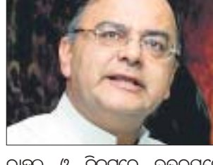
ରାହୁଲ ଓ ନିକଟରେ ଉତ୍ତରପ୍ରଦେଶ ପୂର୍ବ କଂଗ୍ରେସ ସାଧାରଣ ସମ୍ପାଦକ ଭାବେ ନିଯୁକ୍ତ ହୋଇଥିବା ପ୍ରିୟଙ୍କାଙ୍କୁ ତାହୁଲ୍ୟ କରି ସେ ଏପରି କହିଛନ୍ତି ।

ନୂଆଦିଲ୍ଲୀ, ୧୫ମାର୍ଚ୍ଚ (ପି.ଟି.): କଂଗ୍ରେସ ଅଧ୍ୟକ୍ଷ ରାହୁଲ ଗାନ୍ଧୀଙ୍କ ଭଉଣୀ ପ୍ରିୟଙ୍କା ଗାନ୍ଧୀ ଭଦ୍ରା ସକ୍ରିୟ ରାଜନୀତିକୁ ଆସିବା ନେଇ ଅର୍ଥମନ୍ତ୍ରୀ ଅରୁଣ ଜେଟ୍‌ଲାଇଁ ଶୁକ୍ରବାର କଟାକ୍ଷ କରିଛନ୍ତି । ଜେଟ୍‌ଲାଇଁ କହିଛନ୍ତି, ପିଢ଼ି ପରେ ପିଢ଼ି କଂଗ୍ରେସ ଦଳର ନେତୃତ୍ୱ ଗୋଟିଏ ପରିବାରର ସଦସ୍ୟଙ୍କ ପାଇଁ ସଂରକ୍ଷିତ ରହିଛି । ଏବେ ଜଣେ ବିଫଳ ଓ ଅନ୍ୟ ଜଣେ ଉପରକୁ ଉଠି ପାରୁନାହାନ୍ତି ।