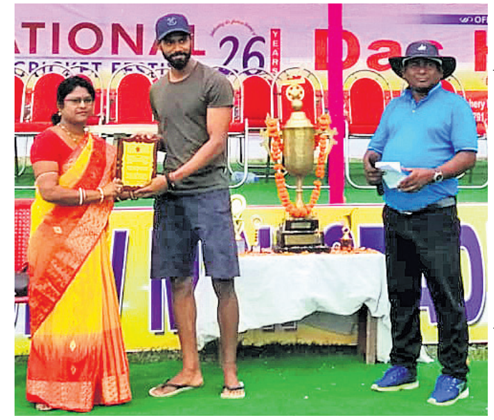
ସୁପିଟ କ୍ରୀଡ଼ାକୁ ମ୍ୟାଚ୍ ଅଫ୍ ଦି ମ୍ୟାଚ୍ ପୁରସ୍କାର ପ୍ରଦାନ କରାଯାଇଛି।

ଭଦ୍ରକ ଜିଲ୍ଲା ବନ୍ଦ କୁଳ ଚିଲୋ ହନୁମାନଜୀଉ ନିଷ୍ଠାପତିମଣ୍ଡଳରେ ଚିଲୋ ଆଧିକାରୀଙ୍କ ଆୟୋଜିତ ଆନୁକୁଲ୍ୟରେ ଚଳୁଥିବା ଉତ୍ତରାଖଣ୍ଡ ପ୍ରଦେଶ ଟ୍ରଫି ଫୁଟବଲ୍ ଟୁର୍ନାମେଣ୍ଟର ଫାଇନାଲରେ କଟକ କ୍ରୀଡ଼ା ଛାଡ଼ାବସ ପ୍ରଦେଶ କରିଛି।