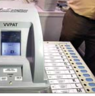
ଅବାଲତଙ୍କ ଦ୍ୱାରା ହୋଇଥିଲେ ୨୧ ବିରୋଧୀ ଦଳ

ନୂଆଦିଲ୍ଲୀ, ୧୫ମାର୍ଚ୍ଚ (ପି.ଟି.): ପ୍ରତି ବିଧାନସଭା ନିର୍ବାଚନ ମଣ୍ଡଳୀର ଅନୁମତ ୫୦ ପ୍ରତିଶତ ଇଲେକ୍ଟ୍ରୋନିକ୍ ଭୋଟି ମେଶିନ୍ (ଭିଡିପିଏଟି)ର ଭିଡିପିଏଟି ସ୍ଲିପ୍ ଯାଞ୍ଚ କରିବା ପାଇଁ ୨୧ଟି ବିରୋଧୀ ଦଳ ସୁପ୍ରିମକୋର୍ଟଙ୍କ ଦ୍ୱାରା ହୋଇଥିବାବେଳେ ଏହାର ଶୁଣାଣି ପାଇଁ ରାଜି ହୋଇଛନ୍ତି । ୬ଟି ଜାତୀୟ ଦଳ ଏବଂ ୧୫ଟି ଆଞ୍ଚଳିକ ଦଳର ନେତାମାନେ ମୋଟ ଜନସଂଖ୍ୟାର ୭୦ରୁ ୭୫ ପ୍ରତିଶତ ପାଇଁ ପ୍ରତିନିଧିତ୍ୱ କରୁଥିବାର ଦାବି କରିବା ସହ ଯେକୌଣସି ଗୋଟିଏ ବିଧାନସଭା ଆସନର ଯାଞ୍ଚ ପାଇଁ ନିର୍ବାଚନ କମିଶନଙ୍କ ଗାଇଡଲାଇନ୍ସୁ ଖାରଜ କରିବା ନିମନ୍ତେ ଆବେଦନ କରିଛନ୍ତି । ସହାୟତା କରିବା ଲାଗି ଜଣେ ଅଧିକାରୀ ନିଯୋଜିତ କରିବାକୁ ହିଁସିଦ୍ଧିତ୍ୱ ଏଥିସହିତ ବିରୋଧୀ ଦଳଗୁଡ଼ିକର ଆବେଦନ ଉପରେ ରୁଜ୍ଜ ସପାହ ମଧ୍ୟରେ ଜବାବ ରଖିବାକୁ ଇସିଙ୍କୁ କୁହାଯିବା ସହ ପରବର୍ତ୍ତୀ ଶୁଣାଣି ଆସନ୍ତା ୨୫ ତାରିଖକୁ ଧାର୍ଯ୍ୟ କରାଯାଇଛି । ଆନ୍ଧ୍ରପ୍ରଦେଶ ମୁଖ୍ୟମନ୍ତ୍ରୀ ଡା. ଚିତ୍ତେପି ଅଧ୍ୟକ୍ଷ ଏନ୍. ଚନ୍ଦ୍ରାବାବୁ ନାଭିକୃତ ସମେତ ଏହିସିଦ୍ଧି ଅଧ୍ୟକ୍ଷ ଶରଦ ପାଠ୍ଯର, ନ୍ୟାଶନାଲ କର୍ଫରେଟ୍ ଅଧ୍ୟକ୍ଷ ଫାଲୁକ ଅବଦୁଲ୍ଲା, ଏକ୍ସକେଟିଭ ଶରଦ ଯାଦବ, ଏଏପି ଆବାହକ ଅରବିନ୍ଦ କେଜ୍ଜିଠ୍ଯଲ, ସମାଜବାଦୀ ପାର୍ଟି ଅଧ୍ୟକ୍ଷ ଅଶ୍ୱକେଶ ଯାଦବ, ଚୁକ୍ତମୂଳ କଂଗ୍ରେସ ନେତା ତେରେକ୍ ଓ'ଗ୍ରୀଏବ ଏବଂ ଡିଏମ୍‌କେ ନେତା ଏମ୍.କେ. ଷ୍ଟାଲିନ୍ ପ୍ରମୁଖ ସୁପ୍ରିମକୋର୍ଟରେ ଆବେଦନ କରିଥିଲେ । ୫୦ ପ୍ରତିଶତ ରୁଥିବେ ଭିଡିପିଏଟି ବ୍ୟବସ୍ଥା କରିବା ଲାଗି ବିରୋଧୀ ଦଳ ଅନୁରୋଧ କରିଥିଲେ ।