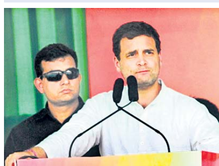
ରାହୁଲ ଗାନ୍ଧୀ ଉଦ୍‌ବୋଧନ ଦେଉଛନ୍ତି ।

ରାହୁଲଙ୍କ ଅଭିଭାଷଣର ଫୋକସରେ ରହିଥିଲା। ସେ କହିଥିଲେ, ବରଗଡ଼ ଜିଲ୍ଲା ରାଜ୍ୟର ଭାଗଭାଗି। ଏଠାରେ ସର୍ବାଧିକ ଧାନ ଉତ୍ପାଦନ ହୋଇଥାଏ। କିନ୍ତୁ ଧାନ ଉତ୍ପାଦନ କରି ଦେଶବାସୀଙ୍କୁ ଆହାର ଯୋଗାଉଥିବା ବାଷ୍ପୀ ଏଠାରେ ଆତ୍ମହତ୍ୟା କରୁଛି। ସାରା ଦେଶରେ ଏଭଳି ପରିସ୍ଥିତି ଉପୁଜିଛି ଏବଂ ପ୍ରତିଦିନ ଜଣେ ନା ଜଣେ ବାଷ୍ପୀ ଆତ୍ମହତ୍ୟା କରୁଛନ୍ତି। ଏହା ଉଭୟ ରାଜ୍ୟ ଓ କେନ୍ଦ୍ର ସରକାରଙ୍କ ଅପାରଗତାର ନିଦର୍ଶନ।