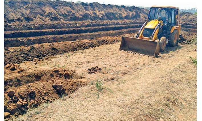
ମେଶିନ ଦ୍ୱାରା ପୋଖରୀ ଖୋଳା ଯାଇଛି

ନବରଙ୍ଗପୁର/ପାପଡ଼ାହାଣ୍ଡି, ୧୫୩୩(ବି.ପ୍ର./ବି.ଏନ.-୪)-