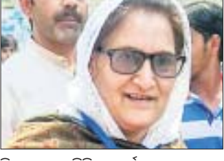
ବିରୋଧୀଙ୍କ ମିଳିତ ପ୍ରାର୍ଥୀ ହୋଇଥିଲେ । ଏହା ପୂର୍ବରୁ ଏସପି ୧୧ ଜଣିଆ ୩ ପ୍ରାର୍ଥୀ ତାଲିକା ଘୋଷଣା କରିସାରିଛି ।