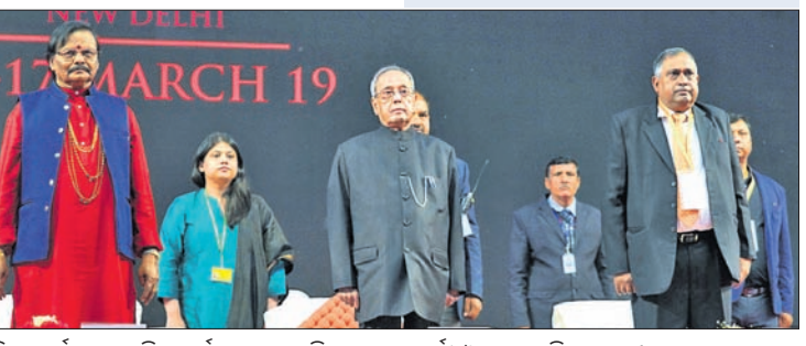
ଓଡ଼ିଶା ପର୍ବରେ ଉପସ୍ଥିତ ପୂର୍ବତନ ରାଷ୍ଟ୍ରପତି ପ୍ରଣବ ମୁଖାର୍ଜୀ ଓ ଅନ୍ୟ ଅତିଥିମାନେ।

ନୂଆଦିଲ୍ଲୀରେ ଆରମ୍ଭ ହେଲା 'ଓଡ଼ିଶା ପର୍ବ' ବିଶୋଦ୍ଧିତ କଳା ସାଂସ୍କୃତିକ କାର୍ଯ୍ୟକ୍ରମ