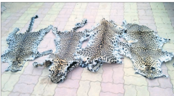
ଜବତ ହୋଇଥିବା କଲରାପତରିଆ ବାଘ ଚମଡ଼ା ।

ଭୁବନେଶ୍ୱର, ୧୫ମାର୍ଚ୍ଚ(ବ୍ୟବହାର) ଜ୍ୱାଳମୁଖୀ ଶ୍ରେଣୀର ଚମଡ଼ା ଫୋର୍ସ(ଏସ୍‌ଟିଏସ୍) ସମ୍ବଲପୁରର କୁଟିଆଠାରେ ଚମଡ଼ା ଜବତ କରି ୪ କଲରାପତରିଆ ବାଘ ଚମଡ଼ା ଜବତ କରିଛି । ଏହାସହ ଏଥିରେ ସମ୍ପୂର୍ଣ୍ଣ ଥିବା ୭ଜଣ ଶିକାରୀଙ୍କୁ ଗିରଫ କରାଯାଇଛି । ଶନିବାର ସେମାନଙ୍କୁ କୋର୍ଟଚାଲାଣ କରାଯିବ । ଏହି ଅପରାଧର ପାଇଁ ଏସ୍‌ଟିଏସ୍ ପ୍ରାୟ ଦୁଇମାସ ତଳୁ କାଳ ବିଚ୍ଛାଉଥିଲା । ଗତ ମାସରେ ଏସ୍‌ଟିଏସ୍‌ର ଏକ ଟମ୍ ସେଠାକୁ ଯାଇ ବେପାରୀଙ୍କ ସହିତ ମୂଲ୍ୟାଙ୍କନ କରିଥିଲା । ଟମ୍ ସହ ସମ୍ପର୍କରେ କିଛି ନୁହାଁ । ସାମଗ୍ରୀ ଆଣିବାକୁ ଅତିର ମଧ୍ୟ ଦେଇଥିଲେ । ଆବଶ୍ୟକ ତଥ୍ୟ ହାସଲ ପରେ ଚମଡ଼ା ପାଇଁ ଯୋଜନା ହୋଇଥିଲା । ଶୁକ୍ରବାର ଅପରାହ୍ଣ ପ୍ରାୟ ୪ଟାରେ ଏସ୍‌ଟିଏସ୍ ଓ କୁଟିଆ ଥାନା ପୋଲିସର ମିଳିତ