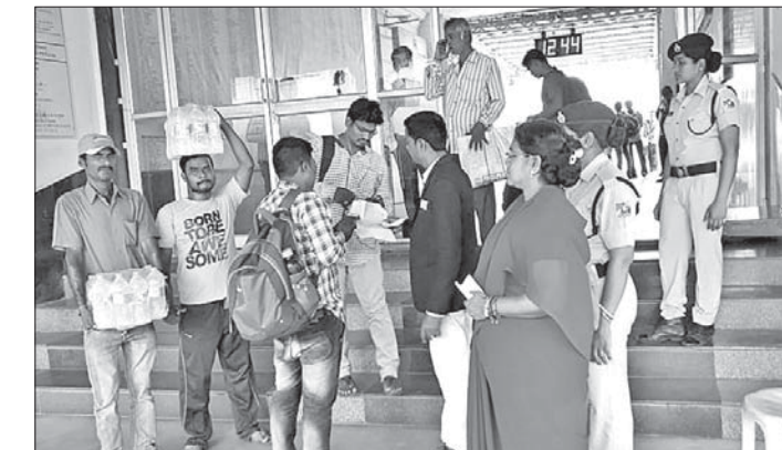
ଖୋର୍ଦ୍ଧାରୋଡ଼ ରେଳଷ୍ଟେଶନରେ ଟିକେଟ ଯାଞ୍ଚ କରାଯାଉଛି।