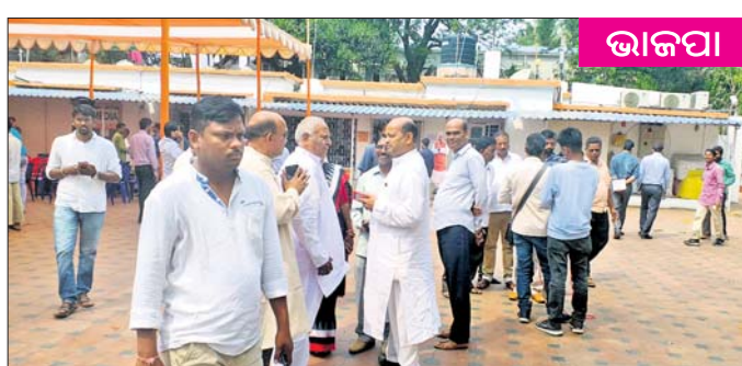
ଭୁବନେଶ୍ୱରସ୍ଥିତ ରାଜ୍ୟ ଭାଜପା କାର୍ଯ୍ୟାଳୟରେ ଶୁକ୍ରବାର ନେତା ଓ କର୍ମୀଙ୍କ ଭିଡ଼।