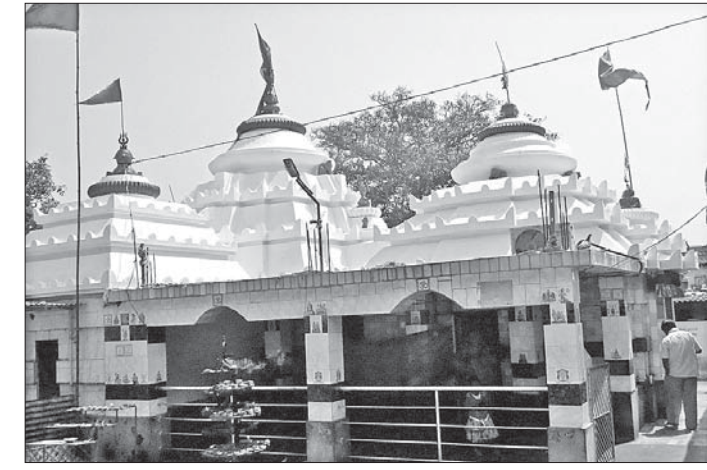
ପଣ୍ଡିମାଖଣ୍ଡ ସୋମନାଥ ମହାଦେବଙ୍କ ମନ୍ଦିର।

ଓ ରାଜାରାଣୀ ନାଚରେ ଚତୁଃପାର୍ଶ୍ୱ ପ୍ରକମ୍ପିତ ହେବା ସହ ଏକ ଆଧ୍ୟାତ୍ମିକ ପରିବେଶ ସୃଷ୍ଟି କରିଥାଏ। ମେଳଣ ପଡିଆରେ ବିଭିନ୍ନ ଗ୍ରାମରୁ ନିମନ୍ତ୍ରିତ ହୋଇ ୮୦ଟି ହରିହର ବିଗ୍ରହ ବୋଲିମାନରେ ଉପବିଷ୍ଣୁ ହୋଇଥାନ୍ତି। ଧର୍ମ ରହଣି ମଧ୍ୟରେ ଦୈନିକ ହରୀରାଜପୁର ସଂଖ୍ୟା ଭକ୍ତ ଠାକୁରମାନଙ୍କୁ ଫୁଲ ସଜନା କରିବା ସହ ଭୋଗ କରିଥାନ୍ତି। ଜମାଣ ରାତ୍ରିରେ ବିଭିନ୍ନ ଅଞ୍ଚଳରୁ ଆସିଥିବା ବାଣକାରମାନଙ୍କ ବ୍ୟତୀତ ମାନସିକ ପୁରଣା ହୋଇଥିବା ବହୁ ଭକ୍ତ ଏଠାରେ ରାତିତମାମ ବାଣ ଯୁକ୍ତାଭିଆନ୍ତି।