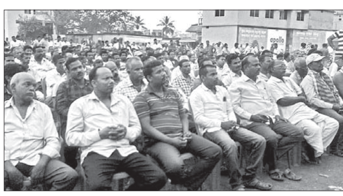
ସମାବେଶରେ ଯୋଗଦେଇଥିବା ଜନସାଧାରଣ।