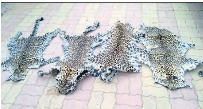
ଜବତ ହୋଇଥିବା କଲରାପତରିଆ ବାଘ ଚମଡ଼ା ।

ଜ୍ୱାଳମୁଖୀର ଶ୍ରେଣୀର ଚ୍ୟାକ୍ସ ଫୋର୍ସ(ଏସ୍‌ଟିଏଫ୍) ସମ୍ବଲପୁରର କୁଟିଆଠାରେ ଚଡ଼ାଉ କରି ୪ କଲରାପତରିଆ ବାଘ ଚମଡ଼ା ଜବତ କରିଛି । ଏହାସହ ଏଥିରେ ସମ୍ପୂର୍ଣ୍ଣ ଥିବା ୭ଜଣ ଶିକାରୀଙ୍କୁ ଶିରଷ କରାଯାଇଛି । ଶନିବାର ସେମାନଙ୍କୁ କୋର୍ଟଚାଲାଣ କରାଯିବ । ଏହି ଅପରେଶନ ପାଇଁ ଏସ୍‌ଟିଏଫ୍ ପ୍ରାୟ ଦୁଇମାସ ତଳୁ କାଳ ବିଛାଇଥିଲା । ଗତ ମାସରେ ଏସ୍‌ଟିଏଫ୍‌ର ଏକ ଟମ୍ ସେଠାକୁ ଯାଇ ବେପାରୀଙ୍କ ସହିତ ମୁଲଗାଳ କରିଥିଲା । ଚିମ୍ବର ସଦସ୍ୟମାନେ କିଛି ନୁଆ ସାମଗ୍ରୀ ଆଣିବାକୁ ଅର୍ଡର ମଧ୍ୟ ଦେଇଥିଲେ । ଆବଶ୍ୟକ ତଥ୍ୟ ହାସଲ ପରେ ଚଡ଼ାଉ ପାଇଁ ଯୋଜନା ହୋଇଥିଲା । ଶୁକ୍ରବାର ଅପରାହ୍ନ ପ୍ରାୟ ୪ଟାରେ ଏସ୍‌ଟିଏଫ୍ ଓ କୁଟିଆ ଥାନା ପୋଲିସର ମିଳିତ