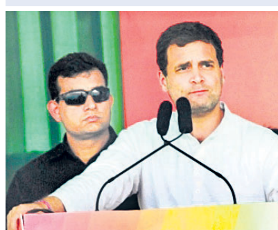
ରାହୁଲ ଗାନ୍ଧୀ ଉଦ୍‌ବୋଧନ ଦେଉଛନ୍ତି ।

ଖ୍ରୀଷ୍ଟଚର୍ଚ୍ଚ, ୧୫ମାର୍ଚ୍ଚ ନ୍ୟୁଜିଲାଣ୍ଡର ରୁକ୍ମି ମସ୍ଜିଦରେ ଶୁକ୍ରବାର ନମାଜ ପାଠ ବେଳେ ଜଣେ ଆତଙ୍କବାଦୀ ପ୍ରବେଶ କରି ଆଖୁକୁଟା ବୁଲି ଚଳାଇବାକୁ ୪୯ ଜଣଙ୍କର ମୃତ୍ୟୁ ହେବା ସହ ୨୦ରୁ ଊର୍ଦ୍ଧ୍ୱ ଗୁରୁତର ଆହତ ହୋଇଛନ୍ତି । ମୃତକଙ୍କ ମଧ୍ୟରେ ୩ ଜଣ ବାଲାଦେଶୀ ଅଛନ୍ତି । ଏହା ଦେଶର ସବୁଠୁ ବଡ଼ ଗଣହତ୍ୟା । ପ୍ରଧାନମନ୍ତ୍ରୀ ଜାସିଦ୍ ଆର୍ଡେନ ଏଭଳି ଆତଙ୍କବାଦର ନିନ୍ଦାକରିବା ସହ ଶୁକ୍ରବାରକୁ ନ୍ୟୁଜିଲାଣ୍ଡ ପାଇଁ ଅକ୍ଷୟ ବିଦ୍ୟ ବୋଲି କହିଛନ୍ତି । ଆକ୍ରମଣକାରୀ