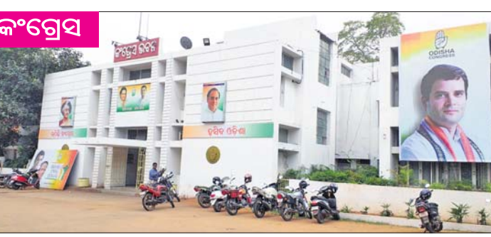
କଂଗ୍ରେସ ଅଧ୍ୟକ୍ଷ ରାହୁଲ ଗାନ୍ଧୀଙ୍କ ବରଗଡ଼ ଗସ୍ତ ଥିବା ଯୋଗୁ ଭୁବନେଶ୍ୱରସ୍ଥିତ ଦଳର ରାଜ୍ୟ କାର୍ଯ୍ୟାଳୟ ଶୁକ୍ରବାର ଖାଁ ଖାଁ।