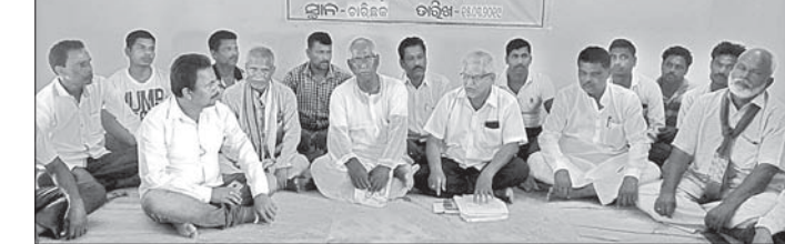
ଖବରଦାତା ସମ୍ମିଳନୀରେ ଯୋଗଦେଇଥିବା ସଂସଦ ସଦସ୍ୟ।

ଖୋର୍ଦ୍ଧାରୋଡ଼ ରେଳ ଡିଭିଜନ ପକ୍ଷରୁ ଚାଲିଥିବା ବିନା ଟିକେଟ ଯାତ୍ରୀ ଧରପଗଡ଼ ଯୋଗୁ ୧୪ କୋଟି ୯୮ ଲକ୍ଷ ୮୦ ହଜାର ୭୯ ଟଙ୍କା ଭରିମାନା ଆଦାୟ ହୋଇଛି। ୨୦୧୮ ଏପ୍ରିଲରୁ ୨୦୧୯ ମାର୍ଚ୍ଚ ୧୫ ମଧ୍ୟରେ ହୋଇଥିବା ଏହି ଧରପଗଡ଼ ଦ୍ୱାରା ୩ ଲକ୍ଷ ୨୫ ହଜାର ୬୬୦ ଜଣ ବିନା ଟିକେଟ ଯାତ୍ରୀଙ୍କ ଠାରୁ ରହିବ ବୋଲି ସେ ସୂଚନା ଦେଇଛନ୍ତି।