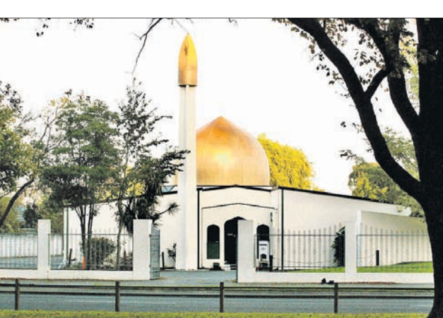
ଖ୍ରୀଷ୍ଟଚର୍ଚ୍ଚ ସହରରେ ଥିବା ଅଲ୍ ଲୁର୍ ମସ୍ଜିଦ୍ ।