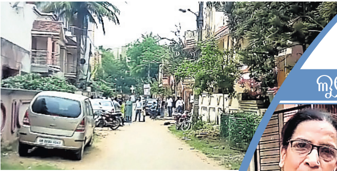
ଶୈଳଶ୍ରୀବିହାର ଫେଜ୍-୭ରେ ଲୁଚ୍ ହୋଇଥିବା ଗ୍ରାମ।