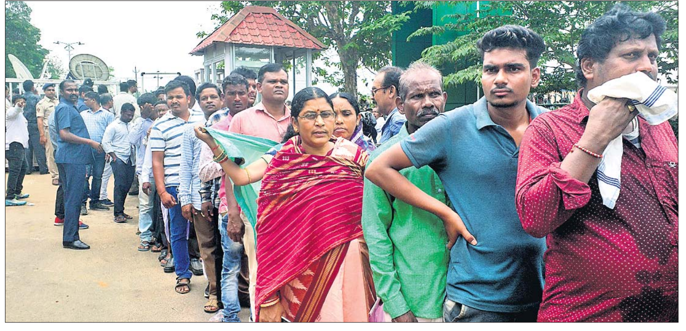
ବିଜେଡି ପକ୍ଷରୁ ପ୍ରାର୍ଥୀ ଚୟନ ପ୍ରକ୍ରିୟା ଜାରି ରହିଥିବା ବେଳେ ଶୁକ୍ରବାର ନବୀନ ନିବାସରେ ଆଶାୟୀ ଓ ନେତାମାନଙ୍କ ଭିଡ଼।