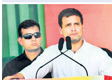
ରାହୁଲ ଗାନ୍ଧୀ ଉଦ୍‌ବୋଧନ ଦେଉଛନ୍ତି ।

ରାଜ୍ୟରେ ଦୋଷୀବୋଧିତା ଚାଷୀ ଆତ୍ମହତ୍ୟା, ମରୁଡ଼ି, ବେରୋଜଗାର, ନାରୀ ନିର୍ଯ୍ୟାତନା ମଧ୍ୟ ରାହୁଲଙ୍କ ଅଭିଭାଷଣର ଫୋକସରେ ରହିଥିଲା । ସେ କହିଥିଲେ, ବରଗଡ଼ ଜିଲ୍ଲା ରାଜ୍ୟର ଭାତହାଣ୍ଡି । ଏଠାରେ ସର୍ବାଧିକ ଧାନ ଉତ୍ପାଦନ ହୋଇଥାଏ । କିନ୍ତୁ ଧାନ ଉତ୍ପାଦନ କରି ଦେଶବାସୀଙ୍କୁ ଆହାର ଯୋଗାଉଥିବା ପୃଷ୍ଠା-୪