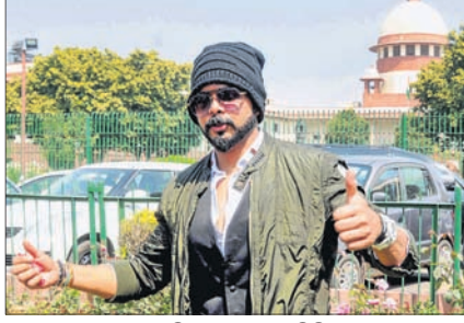
ସୁଧାବିକା, ୧୫୩୩ (ପି.ଟି.)

କ୍ରିକେଟ୍‌ର ଏକ୍ ଶ୍ରୀସଛଙ୍କୁ ବଡ଼ ଆଶ୍ଚର୍ଯ୍ୟ ମିଳିଛି। ସୁପ୍ରିମକୋର୍ଟ ଶ୍ରୀସଛଙ୍କ ଉପରେ ଲାଗିଥିବା ଆଜୀବନ ବାସନ୍ଦକୁ ହଟାଇ ଦେବାକୁ ବିସିଏଆଇର ଶୁଣାଣୀ କମିଟିକୁ ନିର୍ଦ୍ଦେଶ ଦେଇଛନ୍ତି। ମାଧ୍ୟମରେ କୋର୍ଟ ବିସିଏଆଇକୁ ୩ ମାସ ମଧ୍ୟରେ ପୂର୍ବତନ ବୋଲରଙ୍କ ଉପରେ ଲାଗିଥିବା ବାସନ୍ଦବେଶର ଅବସ୍ଥା ସମ୍ପର୍କରେ ପୁନଃ ବିଚାର କରିବାକୁ କୁହାଯାଇଛି। କିନ୍ତୁ ସ୍ୱର୍ ଫିକ୍ସ ମାମଲାକୁ ତାଙ୍କୁ ପୁଣି କରାଯାଇଥିବାରୁ ତାଙ୍କୁ