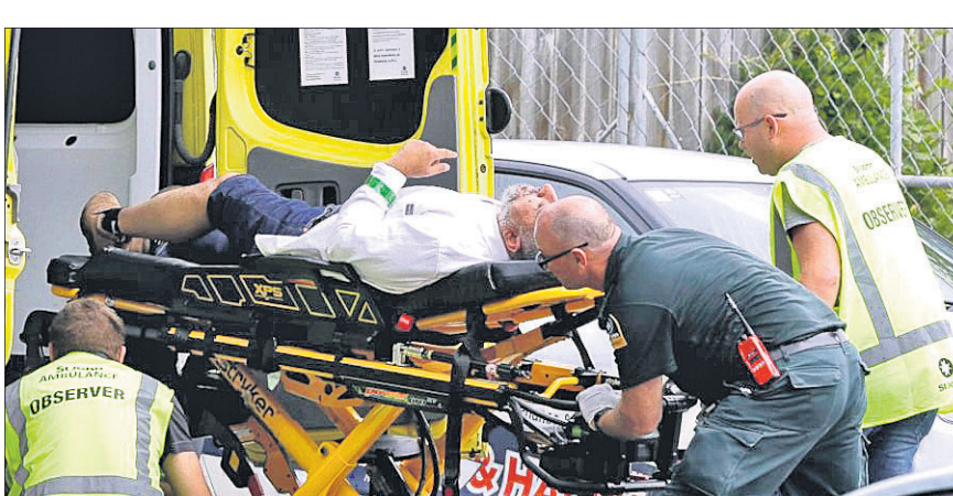
ଆକ୍ରମଣରେ ଆହତ ଜଣେ ବ୍ୟକ୍ତିକୁ ସୁରକ୍ଷାକର୍ମୀମାନେ ହସ୍ତଗତ ନେଉଛନ୍ତି ।

ବରଗଡ଼ ଅଫିସ, ୧୫ମାର୍ଚ୍ଚ ଓଡ଼ିଶାରେ ୫୦ହଜାର କୋଟି ଟଙ୍କାର ଖଣି ଦୁର୍ନୀତି ହୋଇଛି । ମୁଖ୍ୟମନ୍ତ୍ରୀ ନବୀନ ପଟ୍ଟନାୟକ ସାଧାରଣ ଲୋକଙ୍କ ଟଙ୍କା ଠାକ ବନ୍ଧୁମାନଙ୍କୁ ଦେଇଛନ୍ତି । ସାରା ରାଜ୍ୟ ଜାରିଛି ଚିତ୍କଣ୍ଠ ଦୁର୍ନୀତିରେ ୫୦ହଜାର କୋଟି ଟଙ୍କା ଲୁଟ୍ ହୋଇଛି । ଦିଲ୍ଲୀ ହେଉ ନିଓଡ଼ିଶା, କଂଗ୍ରେସ ସରକାର କ୍ଷମତାକୁ ଆସିବା ମାତ୍ରେ ସବୁ ଦୁର୍ନୀତିର ଚକ୍ର ହେବ । ଦୋଷୀଙ୍କ ବିରୋଧରେ କାର୍ଯ୍ୟାନୁଷ୍ଠାନ ଗ୍ରହଣ କରାଯିବ ବୋଲି କଂଗ୍ରେସ ଅଧ୍ୟକ୍ଷ ରାହୁଲ ଗାନ୍ଧୀ କହିଛନ୍ତି । ଶୁକ୍ରବାର ବରଗଡ଼ ସହର ଉପକଣ୍ଠ ନୂଆ ସରକାର ପଡ଼ିଆରେ ଆୟୋଜିତ ସାଧାରଣ ସଭାରେ ଉଦ୍‌ବୋଧନ ଦେଇ ରାହୁଲ କହିଥିଲେ, ଓଡ଼ିଶାକୁ କେତେଜଣ ବନ୍ଧା ବନ୍ଧା ଅଫିସର ଶାସନ କରୁଛନ୍ତି । ସେଥିପାଇଁ ଜନତାକ ସ୍ୱର ଶୁଣାଯାଉ ନାହିଁ । ନବୀନ ପଟ୍ଟନାୟକ ଶାସନର ମଜ୍ଜା ଧରିଥିଲେ ମଧ୍ୟ ତାଙ୍କୁ ପ୍ରଧାନମନ୍ତ୍ରୀ ନରେନ୍ଦ୍ର ମୋଦି ରିମୋଟ କଣ୍ଟ୍ରୋଲ ଦ୍ୱାରା ପରିଚାଳନା କରୁଛନ୍ତି । ରାଜ୍ୟରେ ଆଦିବାସୀ ମହଲାଇ ସ୍ୱର ସରକାରଙ୍କ ପାଖରେ ପହଞ୍ଚେ ନାହିଁ । ସାରା ଓଡ଼ିଶାରେ ପ୍ରାୟ ଦେଢ଼ଲକ୍ଷ ସରକାରୀ ପଦବୀ ଖାଲି ପଡ଼ିଛି । ସେଥିମଧ୍ୟରୁ ୩୦ ହଜାର ଶିକ୍ଷକ ପଦବୀ ଓ ୫ହଜାର ମେଡିକାଲ କର୍ମଚାରୀ ପଦବୀ ଖାଲି ପଡ଼ିଛି । ଓଡ଼ିଶାରେ ଆବଶ୍ୟକ ସଂଖ୍ୟକ ଶାନ୍ତକଣ୍ଠଣ ନାହିଁ । କଂଗ୍ରେସ କ୍ଷମତାକୁ ଆସିବା ମାତ୍ରେ ଖାଲିଥିବା ପଦବୀ ପୂରଣ କରାଯିବ ବୋଲି ରାହୁଲ ପ୍ରତିଶ୍ରୁତି ଦେଇଛନ୍ତି ।