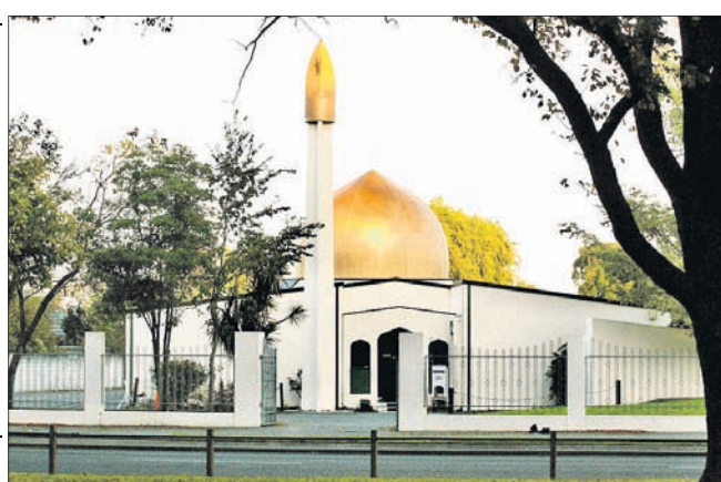
ଖ୍ରୀଷ୍ଟଚର୍ଚ୍ଚ ସହରରେ ଥିବା ଅଲ୍ ନୁର୍ ମସ୍ଜିଦ୍ ।