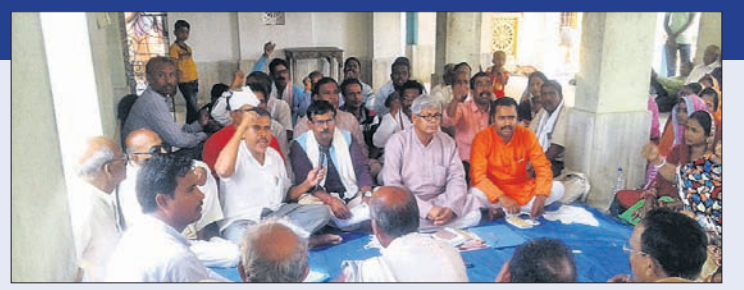
ବୈଠକରେ ଉପସ୍ଥିତ ନବ ନିର୍ମାଣ କୃଷକ ସଂଗଠନ କର୍ମକର୍ତ୍ତା

ବ୍ୟବସ୍ଥା ବିରୋଧରେ ଭୋଟଦାନ ପ୍ରକ୍ରିୟାକୁ ବିରୋଧ ସିଏସ୍‌ଓଙ୍କ କାର୍ଯ୍ୟାଳୟ ସମ୍ମୁଖରେ ଧାରଣା