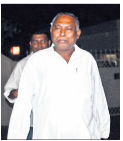
ବିଜେଡି ପକ୍ଷରୁ ପ୍ରାର୍ଥୀ ଚୟନ ପ୍ରକ୍ରିୟା କାରି ରହିଥିବା ବେଳେ ଶନିବାର ନବୀନ ନିବାସରେ ଆଶାୟୀ ଓ ନେତାମାନଙ୍କ ଭିଡ଼।