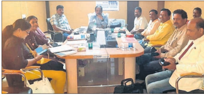
ବୈଠକରେ ଉପସ୍ଥିତ ଅଧିକାରୀ।