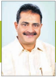
ଚାରାପ୍ରସାଦ ବାହିନୀ ପତି