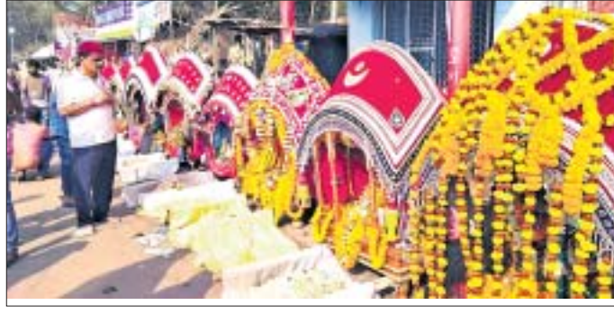
ମେଳଣ ପଡ଼ିଆରେ ପୂଜା ପାଉଥିବା ବିମାନ (ଫାଇଲ ଫଟୋ) ।

ଫୁଲ ଶୁକ୍ଳ ପକ୍ଷ ଦଶମୀ ତିଥିରୁ ଆରମ୍ଭ ହୁଏ ବୋଲିଯାଉଛି । ଓଡ଼ିଆ ସଂସ୍କୃତି ଓ ପରମ୍ପରାର ରୁଚିତ ବହନ କରୁଥିବା ଏହି ଦୋଳ ପର୍ବ ବିଭିନ୍ନ ସ୍ଥାନରେ ନିଆରା ଭଙ୍ଗରେ ପାଳନ କରାଯାଏ । ଦୋଳ ଦଶମୀଠାରୁ ପୂର୍ଣ୍ଣିମା, ହୋଲି ଓ ଯମୁନା ସ୍ନାନ ପର୍ଯ୍ୟନ୍ତ ଉତ୍ସବମୂଳକ ହୁଏ ଗାଁଗଣା । ରାଧାକୃଷ୍ଣଙ୍କ ଯୁଦ୍ଧ ମୂର୍ତ୍ତି ସାହି ସାହି ବୁଲି ଭୋଗ ଖାଇବା ଓ ଫୁଲ ଖେଳରେ କମ୍ପିଉଣେ ଗାଁ ଦାଣ୍ଡ । କେନ୍ଦ୍ରାପଡ଼ା ଜିଲ୍ଲା