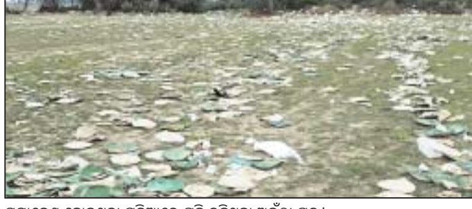
ସମାବେଶ ହୋଇଥିବା ପଡ଼ିଆରେ ପଡ଼ି ରହିଥିବା ଅଳିଠା ପତ୍ର ।

କେନ୍ଦ୍ରାପଡ଼ା ରୁକ୍ଷ ବାଲୁଅସ୍ଥିତ ସିଦ୍ଧପଠ ପଡ଼ିଆରେ ରାଜ୍ୟ ସରକାରଙ୍କ ପକ୍ଷରୁ ଫେବୃଆରୀ ୧୫ରେ କାଳିଆ ସମାବେଶ ଓ ମାର୍ଚ୍ଚ ୧୦ ତାରିଖରେ ମହିଳା ସମାବେଶ ଅନୁଷ୍ଠିତ ହୋଇଥିଲା । ମାତ୍ର ସମାବେଶ ପରେ ଏହି ସ୍ଥଳକୁ ସଫା କରାଯାଇନାହିଁ । ଫଳରେ ଏହା ଏବେ ଅଳିଆ ଆବର୍ଜନାରେ ପରିପୂର୍ଣ୍ଣ ହୋଇଯାଇଛି । ଏନେଇ ଚାଷୀ ଓ ସ୍ଥାନୀୟ ଅଧିବାସୀଙ୍କ ମଧ୍ୟରେ ଅସନ୍ତୋଷ ପ୍ରକାଶ ପାଇଛି । ସୂଚନାଯୋଗ୍ୟ, ଏହି ୨ ସମାବେଶ ପାଇଁ ଜିଲ୍ଲା ପ୍ରଶାସନ ପକ୍ଷରୁ ୪୬ ଏକର କ୍ଷେତ ଜମି ସହ ସିଦ୍ଧ ପଠ ପଡ଼ିଆକୁ ବ୍ୟବହାର କରାଯାଇଥିଲା । ପ୍ରାୟ ୧୫ ଏକର କ୍ଷେତ ଜମି ଉପରେ କାର୍ପେଟ ବିଛା ଯାଇ ଅଣ୍ଡା ବୋତଲ ଠିପି ଉପରେ ୩ ଲକ୍ଷ ଲାସି କଣ୍ଡା ବାଡ଼ିଆ ହୋଇଥିଲା । କାର୍ପେଟ କଢ଼ାଯିବା ପରେ କ୍ଷେତରେ