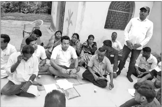
ବୈଠକରେ ଉପସ୍ଥିତ ବିଜେଡି ନେତା ଓ କର୍ମୀ।