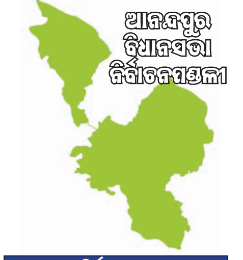
ଆନନ୍ଦପୁର ବିଧାନସଭା ନିର୍ବାଚନମଣ୍ଡଳୀ