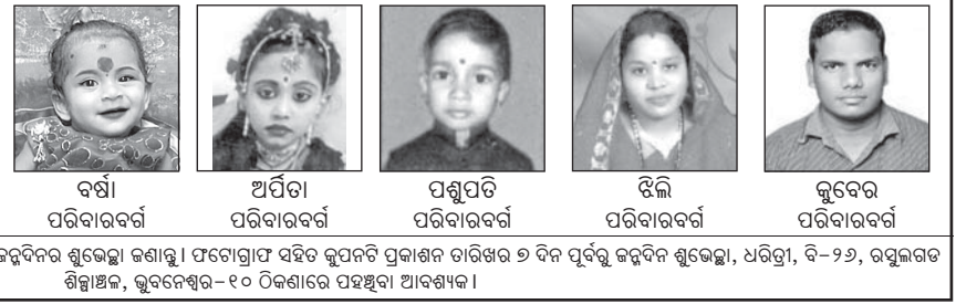
ସର୍ବାଦା: ଏହି କୁପନ ବ୍ୟବହାର କରି ସମସ୍ତ ମାଗଣାରେ ଜନ୍ମଦିନର ଶୁଭେଚ୍ଛା ଜଣାନ୍ତୁ।