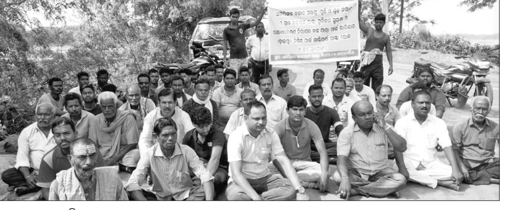
ରାସ୍ତାରେକୋରେ ସାମିଲ ହୋଇଥିବା ଲୋକମାନେ।

ଗୁମାସ୍ତା ଆଲିପିଙ୍ଗଳ ଯୋଲର ଉତ୍ତମ ପାର୍ଶ୍ୱରେ ଜଗତ୍ସିଂହପୁର ପୂର୍ବ ବିଭାଗ ପକ୍ଷରୁ ୨ଟି ଲୁହା ଗୋଟ କରାଯାଇଛି। ଏହାକୁ ବିରୋଧ କରି ଜଗତ୍ସିଂହପୁର ଓ କଟକ ଜିଲ୍ଲାର ଲୋକେ ପୃଥକ ଗୁମାସ୍ତା ଆନ୍ଦୋଳନ କରିଛନ୍ତି। ଏଥିସହ ବାଲି ବୋଝେଇ ହାଇଡ୍ରା, ଟ୍ରକ ଓ ଭାରିୟାନ ଚଳାଏ ଉପରେ ଅକୃଷ୍ଣ ଲଗାଇବାକୁ ଦାବି କରିଛନ୍ତି। ସୂଚନା ଅନୁଯାୟୀ, ଭାରିୟାନ ଚଳାଏ ନ କରିବା ପାଇଁ ଯୋଲର ବକାର ପଟେ କିଛିଦିନ ତକେ ଏକ ଲୁହା ଗୋଟ ହୋଇଥିଲା।