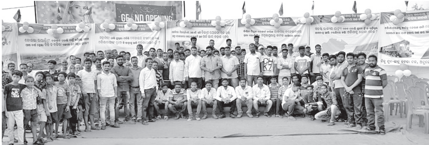
ହେଲିଆପଡ଼ାଠାରେ ବିଜୁ ଯୁବ ଛାତ୍ର ଜନତା ଦଳ ପକ୍ଷରୁ ହକ୍ ମାଗୁଛି ଓଡ଼ିଶା କାର୍ଯ୍ୟକ୍ରମରେ ଆୟୋଜିତ ପଥପ୍ରାନ୍ତ ସଭା ।