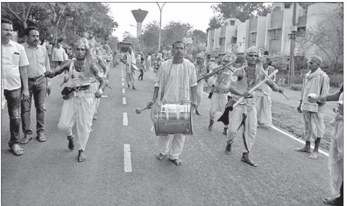
ନାଲ୍‌କୋନେ ଅନୁଷ୍ଠିତ ଫଗୁ ଦଶମୀରେ ଲଉଡ଼ି ଖେଳ ପ୍ରଦର୍ଶନ କରାଯାଇଛି।

ନାଲକୋ ଗାଉନଶିପ୍ କଲୋନୀ ପରିସରରେ ଶନିବାର ଫଗୁ ଦଶମୀ ଉତ୍ସବ ପାଳିତ ହୋଇଯାଇଛି। ଏହି ଅବସରରେ ମାଉସୀ ମା ମନ୍ଦିରରୁ ଏକ ଶୋଭାଯାତ୍ରାରେ ଫଗୁ ଖେଳ ସହ ଲଉଡ଼ି ଖେଳ ପ୍ରଦର୍ଶିତ ହୋଇଥିଲା। ପ୍ରକୃତ ରାଧାକୃଷ୍ଣଙ୍କୁ ବିମାନରେ ଯାଦବ ସମାଜ ପକ୍ଷରୁ ଶୋଭାଯାତ୍ରା କରାଯାଇଥିଲା। ଅପରାହ୍ନରେ ଜଗନ୍ନାଥ ମନ୍ଦିର ପରିସରରେ ପୂଜାର୍ଚ୍ଚନା