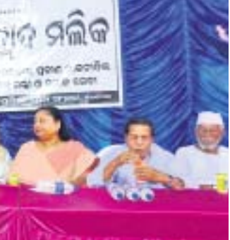
ସଭାରେ ମନ୍ତ୍ରୀସଭା ଅତିଥିତ୍ୱ।