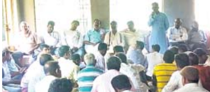
ବୈଠକରେ କଂଗ୍ରେସ ନେତା ଓ କର୍ମୀମାନେ।