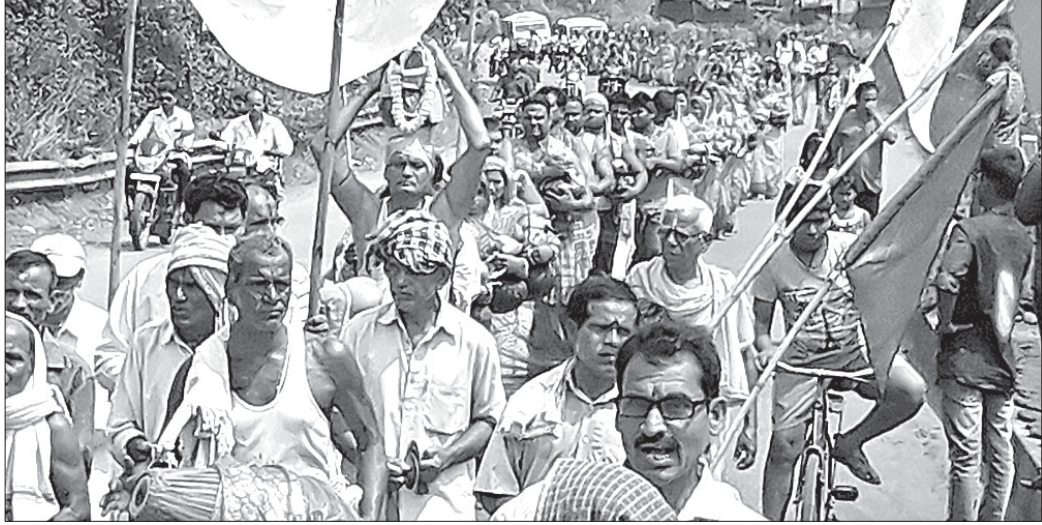
ମାର୍ଗାଘାଟରେ ଯଜ୍ଞ ପାଇଁ କଳସ ଶୋଭାଯାତ୍ରା ।