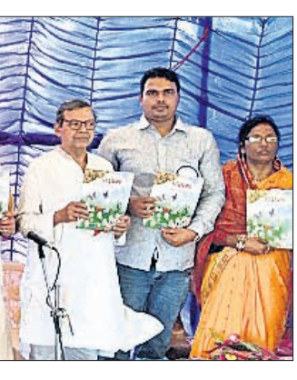
ଅତିଥି ମୁଖପତ୍ର 'ପ୍ରେରଣା' ଉଦ୍ଘୋଷଣ କରୁଛନ୍ତି

ରାଜଧାନୀରେ ତେରା ପକାଇଛନ୍ତି ନେତା ବାଚାବରଣ ଉତ୍ତମ କରୁଛି ସୋସିଆଲ ମିଡିଆ