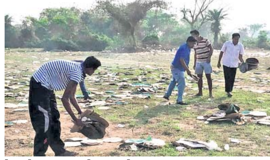
ବିକ୍ରୟ ବାହିନୀ ସଦସ୍ୟ ଓ ଅନ୍ୟମାନେ ପଡ଼ିଆ ସଫାକରିବା କରୁଛନ୍ତି।

କେନ୍ଦ୍ରାପଡ଼ା ରୁକ୍ ବାଉଁଶସ୍ଥିତ ସିଦ୍ଧିପଠ ପଡ଼ିଆ ଓ ନିକଟସ୍ଥ ସମାବେଶସ୍ଥଳର ସଫାକରିବା ଆରମ୍ଭ ହୋଇଛି। ଗତ ୧୦ ତାରିଖରେ ଉକ୍ତ ପଡ଼ିଆରେ ନିଶ୍ଚଳ ଶକ୍ତି ମହିଳା ସମାବେଶ ଅନୁଷ୍ଠିତ ହୋଇଥିବା ବେଳେ ଏହା ପରେ ପଡ଼ିଆରେ ଅଳ୍ପା ପତ୍ର, କାଗଜ, ପଲିଥିନ୍ ଆଦି ପଡ଼ି ରହିଥିଲା। ଏହାର ସଫାକରିବା କାର୍ଯ୍ୟ ଧାର୍ଯ୍ୟ ନିକଟରେ ଶୁଭ ଖବର ମିଳିବ ବୋଲି ଧରଣୀ କୁମାରୀଙ୍କୁ ମୁଖ୍ୟ ମାୟୁଦ ଆଖ୍ୟାଙ୍କୁ ବିଶ୍ୱ ଆତଙ୍କବାଦୀ ଘୋଷଣା ପାଇଁ ଭାରତର ପ୍ରତ୍ୟେକ ଚାଇନା ବିଦ୍ୟୋଗୀ କରୁଛି। ଏଥିପାଇଁ ଚାଇନା ସାମଗ୍ରୀକୁ କୁମାର ରାଉତ କୁହନ୍ତି, ଜିଲ୍ଲା ପ୍ରଶାସନ ଏହି ନିଷ୍ପତ୍ତି ସ୍ୱାଗତଯୋଗ୍ୟ ପଦକ୍ଷେପ। ଗୋଟିଏ ଲିଟର କିରୋସିନକୁ ଲାଣ୍ଠନ ଭାବେ ବ୍ୟବହାର କଲେ ପ୍ରାୟ ଅଢ଼େଇ