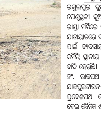
ବିପର୍ଯ୍ୟସ୍ତ ହୋଇପଡ଼ିଥିବା ରାସ୍ତା।

ରଘୁଲପୁର ରୁକ୍ମ ଅନ୍ତର୍ଗତ ମୁଖ୍ୟ ବ୍ୟବସାୟିକ ପେଣ୍ଡୁଳା କୁଆଖିଆ ବଜାର ଦେଇ ଯାଇଥିବା ରାସ୍ତା ମଝିରେ ଏକ ଗର୍ଭ ସୃଷ୍ଟି ହୋଇଛି। ଫଳରେ ଯାତାୟାତରେ ବାଧା ଉଠୁଛି। ଉକ୍ତ ଗର୍ଭ ମରାମତି ପାଇଁ ବ୍ୟବସାୟୀ ସଂଘ, ଲକ୍ଷ୍ମୀନାରାୟଣ ପୂଜା କମିଟି, ସ୍ଥାନୀୟ ଅଞ୍ଚଳର ଜନସାଧାରଣଙ୍କ ପସରୁ ଦାବି ହେଉଛି। ୧୨ନଂ. ଗାଡ଼ା ରାଜପଥରୁ ୨୦ ନଂ. ରାଜପଥ ଦେଇ କୁଆଖିଆ-ବୁଢ଼ବରଦା-ଯାଜପୁରଗଡ଼-ବରା ଅଞ୍ଚଳକୁ କୁଆଖିଆ ବଜାର ପ୍ରବେଶପଥ ବୋଲି କୁହାଯାଇଛି। ଏହି ରାସ୍ତା ଦେଇ ଦୈନିକ ଶହ ଶହ ଗାଡ଼ି ମୋଟର ଯାତାୟାତ