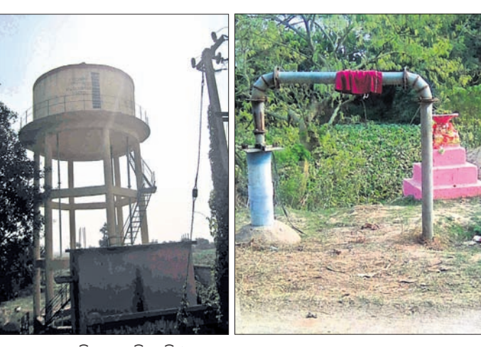
ଅଚଳ ହୋଇପଡ଼ିଥିବା ପାଣି ଟାଙ୍କି ଓ ପ୍ରକଳ୍ପ।

ନାଉରା, ୧୭ମାର୍ଚ୍ଚ(ସ.ପ୍ର.): ଦିନକୁ ଦିନ ଗ୍ରୀଷ୍ମ ପ୍ରବାହ ବୃଦ୍ଧି ପାଇବାରେ ଲାଗିଛି। କିନ୍ତୁ ନାଉରା ବ୍ଲକ୍ରେ ପାନୀୟଜଳ ସମସ୍ୟାରେ ସୁଧାଧାର ଆସୁନାହିଁ।