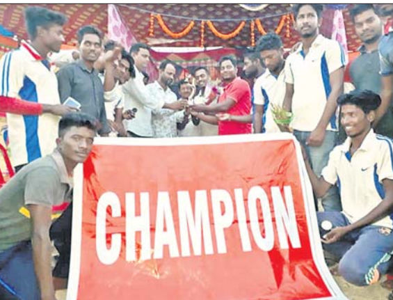
ଚାମ୍ପିୟନ ବକକୁ ଅତିଥି ଟ୍ରଫି ପ୍ରଦାନ କରୁଛନ୍ତି।

କୃତ୍ତିକା, ୧୭୩(ସ.ପ୍ର.) କୃତ୍ତିକା ଚନ୍ଦ୍ର ମଙ୍ଗଳାକପୁର ମିନି ସ୍ଥାଡ଼ିଂମରେ ଚାଳିଥିବା କ୍ରିକେଟ ଚୁନାମେଣ୍ଟ ରବିବାର ଉଦ୍‌ଘାଟିତ ହୋଇଛି। ଉଦ୍‌ଘାଟନକ୍ରମେ କ୍ରିକେଟ ଟ୍ରଫି ଓ ବଜରଙ୍ଗବାଲି ଡିମାଣ୍ଡା ମଧ୍ୟରେ ଫାଇନାଲ ମ୍ୟାଚ୍ ହୋଇଥିଲା। ଏଥିରେ ବଜରଙ୍ଗବାଲି ଟ୍ରଫି ୫ ଉଇକେଟ୍‌ରେ ଉଦ୍‌ଘାଟନକ୍ରମେ ହରାଇ ଚାମ୍ପିୟନ