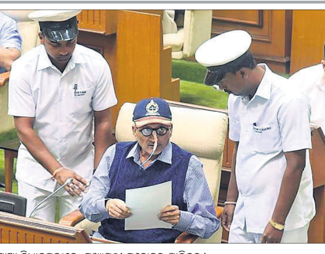
ଗୋଆ ବିଧାନସଭାରେ ମୁଖ୍ୟମନ୍ତ୍ରୀ ମନୋହର ପାରିକର।