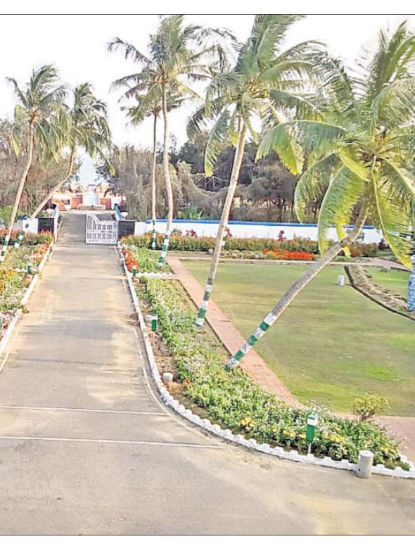
ପାରାଦୀପ ଜବାହର ଅତିଥି ଭବନ ସମ୍ମୁଖରେ ଥିବା ବନରର ଭିତ୍ତିପ୍ରସ୍ତର ଫଳକ।

ଦୁଷ୍ଟ ନ କହୁ ନାଟେ, ଗୁପ୍ତ ନ ରହିବ ଯାତେ । ନାଟ ବା କୌଣସି ଆମୋଦ ପ୍ରମୋଦ ସ୍ଥାନରେ କିଛି ଗୁରୁତ୍ୱପୂର୍ଣ୍ଣ କଥା କହିଲେ ତା'ର କୌଣସି ମୂଲ୍ୟ ରହି ନ ଥାଏ, କଥାର ଗୁରୁତ୍ୱ କମି ଯାଇଥାଏ। ସେହିପରି ତୁମ ପୋଖରୀ ତଥା ଘାଟକୁଳରେ ଅଧିକ ଲୋକ ମେଳ ହେଉଥିବା ସ୍ଥଳେ ସେ ସ୍ଥାନରେ କୌଣସି ଗୁପ୍ତ କଥା ପ୍ରକାଶ କଲେ କଥାର ଗୋପନାୟତା ନଷ୍ଟ ହୋଇଯାଇଥାଏ। କଥା ଶାନ୍ତ ଏ କାନୁରେ ସେ କାନ ହୋଇ ଚାରିଆଡ଼େ ପ୍ରସାରି ହୋଇଯାଉଥିବା ଅର୍ଥରେ ଏଭଳି ଉକ୍ତି ଉଲ୍ଲେଖ କରାଯାଇଛି।