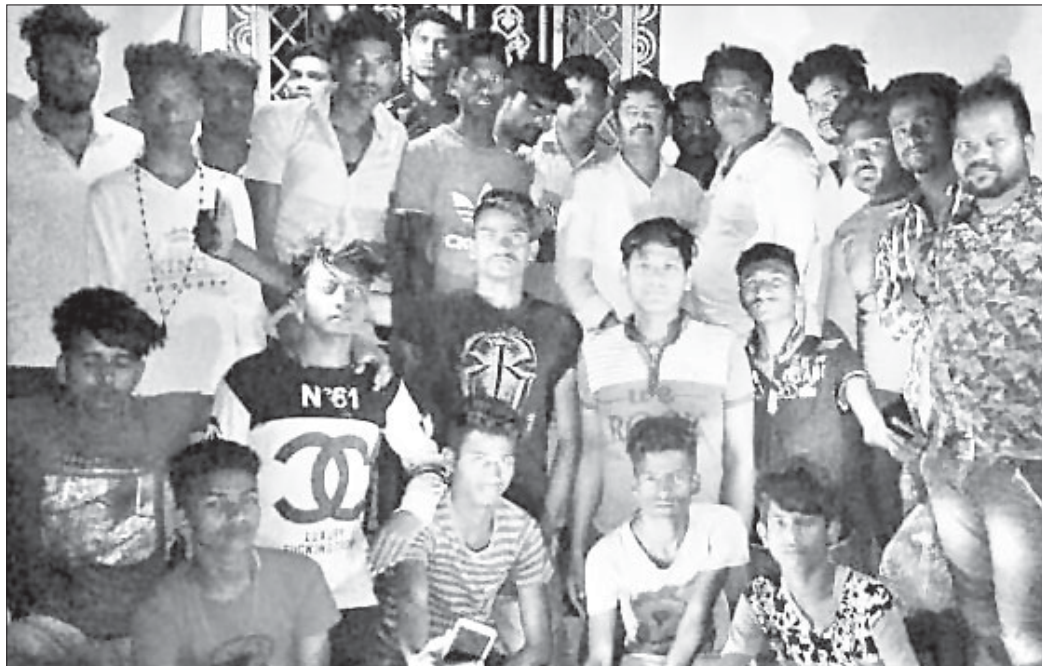
ବୈଠକରେ ଉପସ୍ଥିତ ବିଶ୍ୱହିନ୍ଦୁ ପରିଷଦ ଓ ବଜରଙ୍ଗ ଦଳର ସଦସ୍ୟ ।